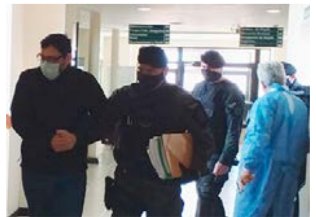
Se reanudarán las visitas a los internos. Serán semanales y en el gimnasio de la Policía Provincial.

Por último el jefe del Servicio Penitenciario Provincial indicó que “las visitas se van realizar siguiendo una serie de protocolos, en el Gimnasio policial, para poder respetar el distanciamiento social exigiendo medidas como barbijo o máscara facial y alcohol en gel”.