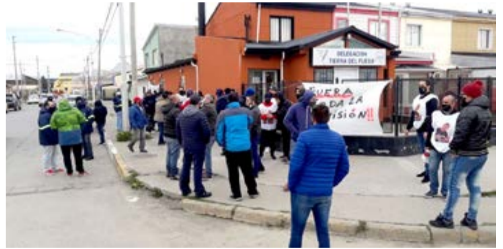
El viernes pasado la sede de la Asociación Obrera Textil fue escenario, una vez más, del malestar de delegados y trabajadores con la conducción del gremio.