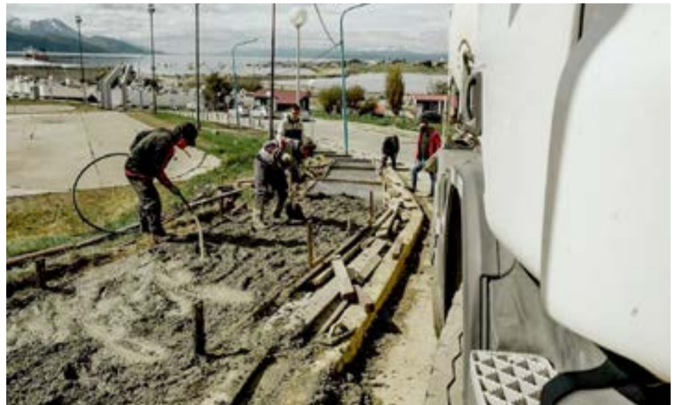
Las obras del Paseo del Centenario forman parte de un trabajo integral de recuperación de este espacio emblemático de la ciudad.