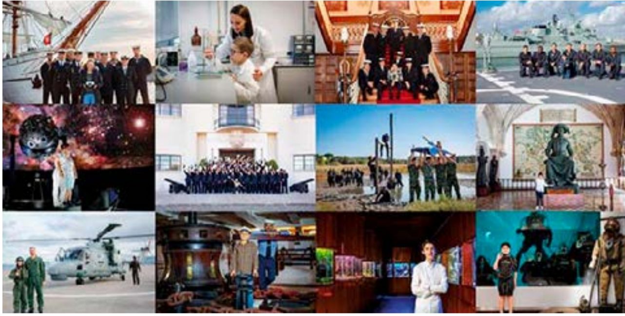
‘Marinheiros da Esperança en la ruta de Magalhães y Elcano’ “es un proyecto del V Centenario coordinado por el Centro Hospitalar Universitário São João.

“Asesoré a mi esposo, ya fallecido, que era modelista naval, realizando sus investigaciones de cada modelo, me han puesto desafíos como escribir una zarpada o arribada sin usar términos náuticos. He navegado como invitada en la Fragata ARA Libertad y como cronista también. Lo mejor de todo esto, es, como decía, unir. Aquí vemos el mar como la delgada línea de la costa donde nos bañamos, vemos los buques en lejanía pero no nos preguntamos quiénes son ni a dónde van. Podemos verlo como esa inmensidad amenazante, o se gran cuenco de agua que nos une a otros países aunque sea un poquito temperamental a veces. Podemos aprender de todos, hay lenguajes que son universales, que les permitieron a estas expediciones realizar sus viajes. Y nosotros, unimos. Estamos atentos a los detalles que se pueden publicar, cuales no en determinados países, generamos nuestras notas, contenidos, acreditamos corresponsales en el exterior. Escuchar que llaman desde un buque es una de las más grandes alegrías, que nos escriba su comandante, o que uno en sencilla ceremonia condecere en Ushuaia. Hace poco me dijeron de al verme escuchar una conferencia en Portugal en un café del barrio en el telefono -vivo en San Telmo, casco histórico- ‘que suerte que tenés, que salís con el mundo en la mano’”, concluyó la historiadora.