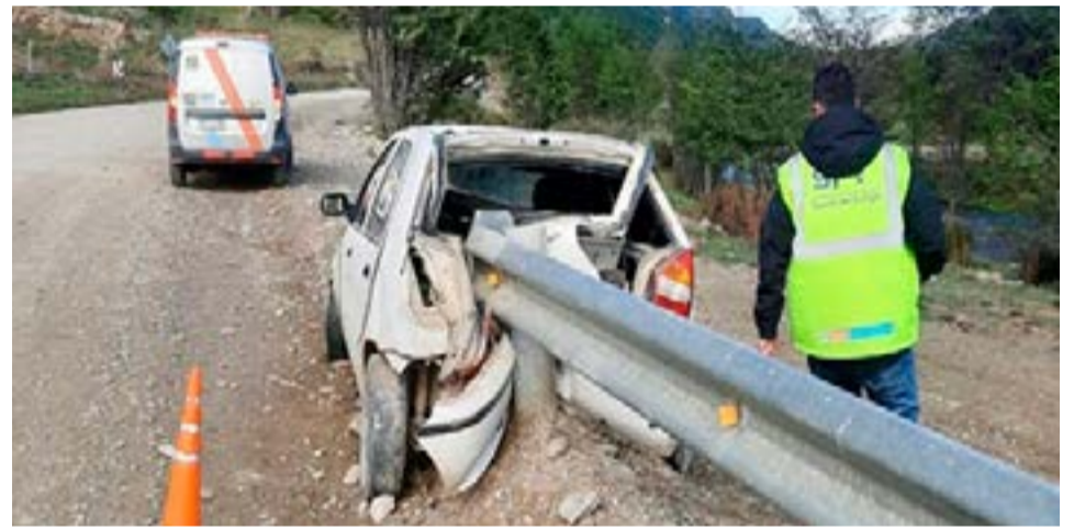
Automóvil fue encontrado chocado, sin ocupantes ni patente, en cercanías del puente del río Pipo de Ushuaia.

El conductor no se encontraba en la zona del accidente, por lo cual Tránsito debió secuestrar la unidad.