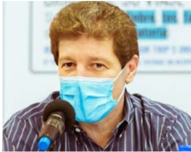
El Gobernador fueguino destacó el congelamiento de los impuestos internos que significaban “un claro prejuicio” para la industria de Tierra del Fuego.

lo que redundará en la generación de más fuentes de