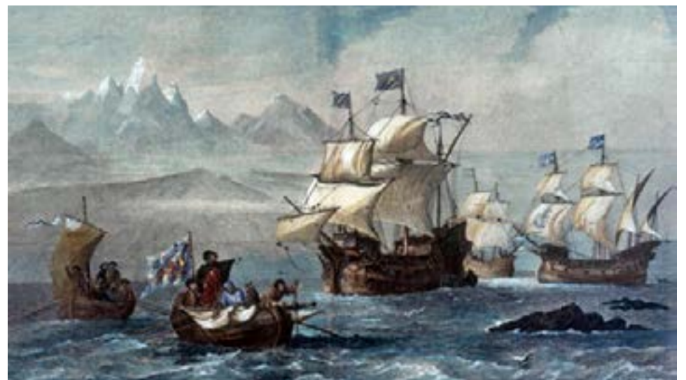
El 1 de noviembre de 1520, luego de explorar la entrada de mar, Magallanes entró al estrecho al que llamó ‘de Todos los Santos’, ya que ese día la Iglesia católica celebra esa festividad. En la ribera sur, vio grandes fogatas y la bautizó como ‘Tierra del Fuego’.

poblaban, debía de ser una gran isla. Sin detenerse con las tres naves que formaban su escuadrilla, continuó resueltamente su navegación por el angosto canal que se abría con dirección al noroeste.