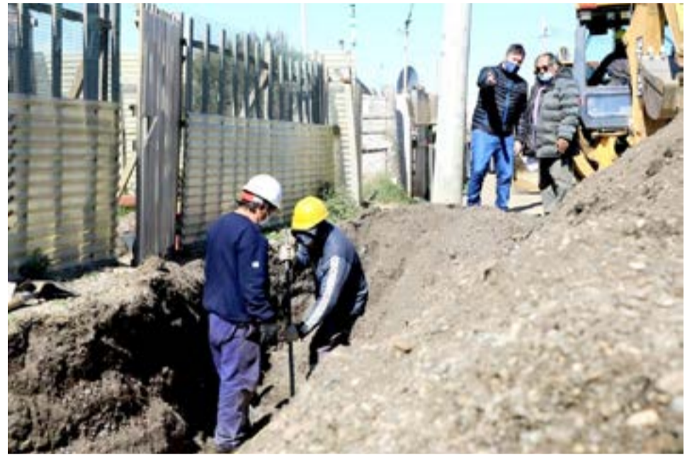
La obra demandó de 12 millones de pesos para su reactivación, y la conclusión de la misma comprenderá de una inversión total de 30 millones.