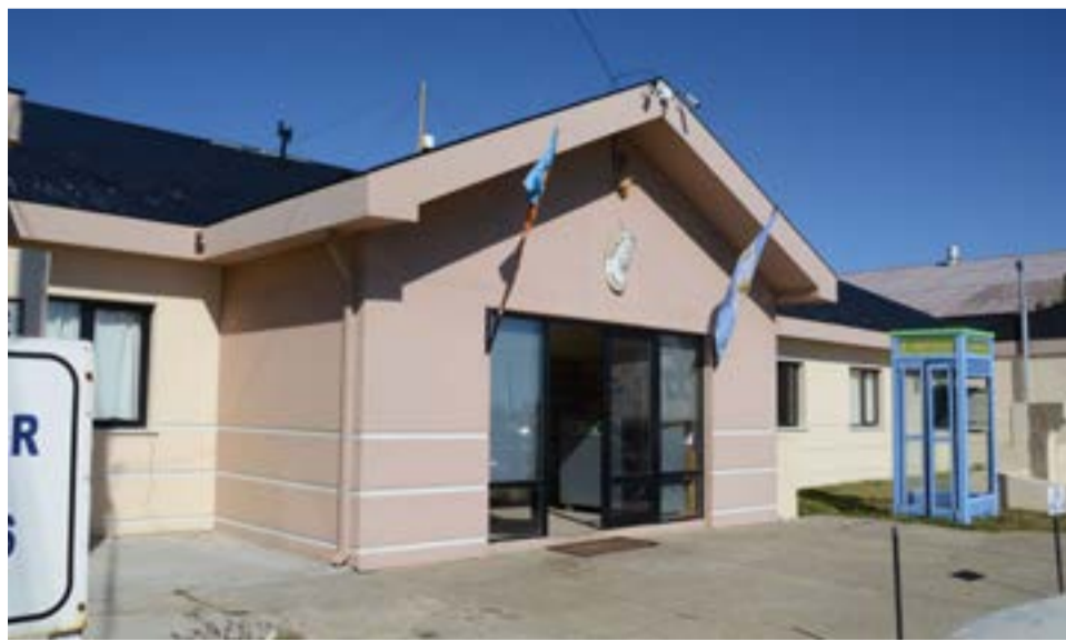
Este lunes continúa el proceso oral no público contra sujeto imputado en el abuso sexual de una niña

los magistrados y las partes presentes en el debate. Ahora, está previsto que esta semana culminen la declaraciones testimoniales, y luego se conozca el veredicto, que al menos hasta este momento, no se ha dado a conocer que modalidad se adoptará, teniendo en cuenta que esta parte del proceso debiera ser pública, pero ante el refuerzo de medidas sanitarias por parte del Superior Tribunal de Justicia, se desconoce la manera en que se hará público.