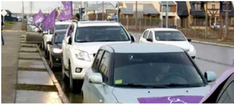
Habrà una caravana de autos en las tres ciudades hoy lunes 2 y mañana martes 3, de acuerdo a número de patentes y respetando las medidas sanitarias vigentes.

La caravana es los dos días a las 11 horas en las tres ciudades. Los lugares de encuentro para el inicio de la caravana son: Río Grande: Plaza del Delfín. Tolhuín: Los Nires, frente al supermercado. Ushuaia: Rotonda del Aeropuerto / Rotonda del Polivalente de Arte / Marcos Zar y Alem.