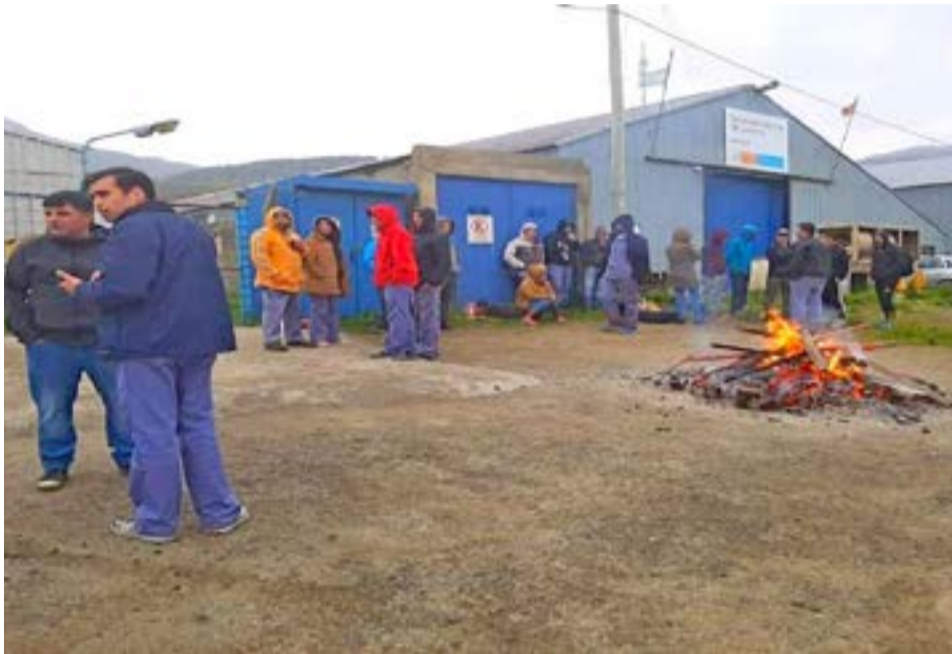
Los trabajadores de Hilandería Fueguina, de Ushuaia, se sumaron a los textiles de Río Grande con el malestar que vienen expresando hacia la conducción de la Asociación Obrera Textil.

Dijo que cuando expresaron estas situaciones a la conducción de la Asociación Obrera Textil, como respuesta les dijeron los sindicalistas que se quedarán “en el molde porque no hay mucho trabajo. Lo normal es escuchar de parte del gremio que nos tenemos que quedar tranquilos, porque corremos peligro por los puestos de trabajo. Siempre metiendo miedo a la gente”, concluyó.