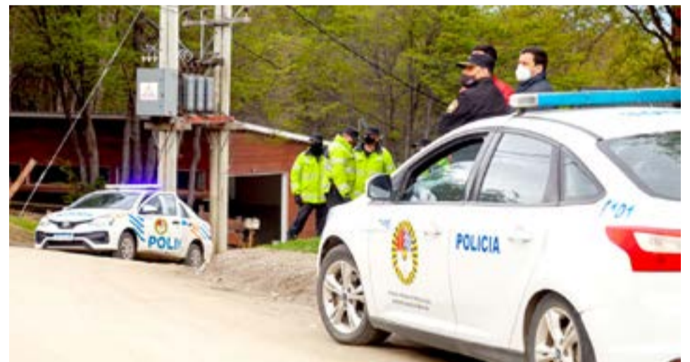
En el lugar se encontraba una construcción precaria sin ocupantes, establecida en el medio del bosque.