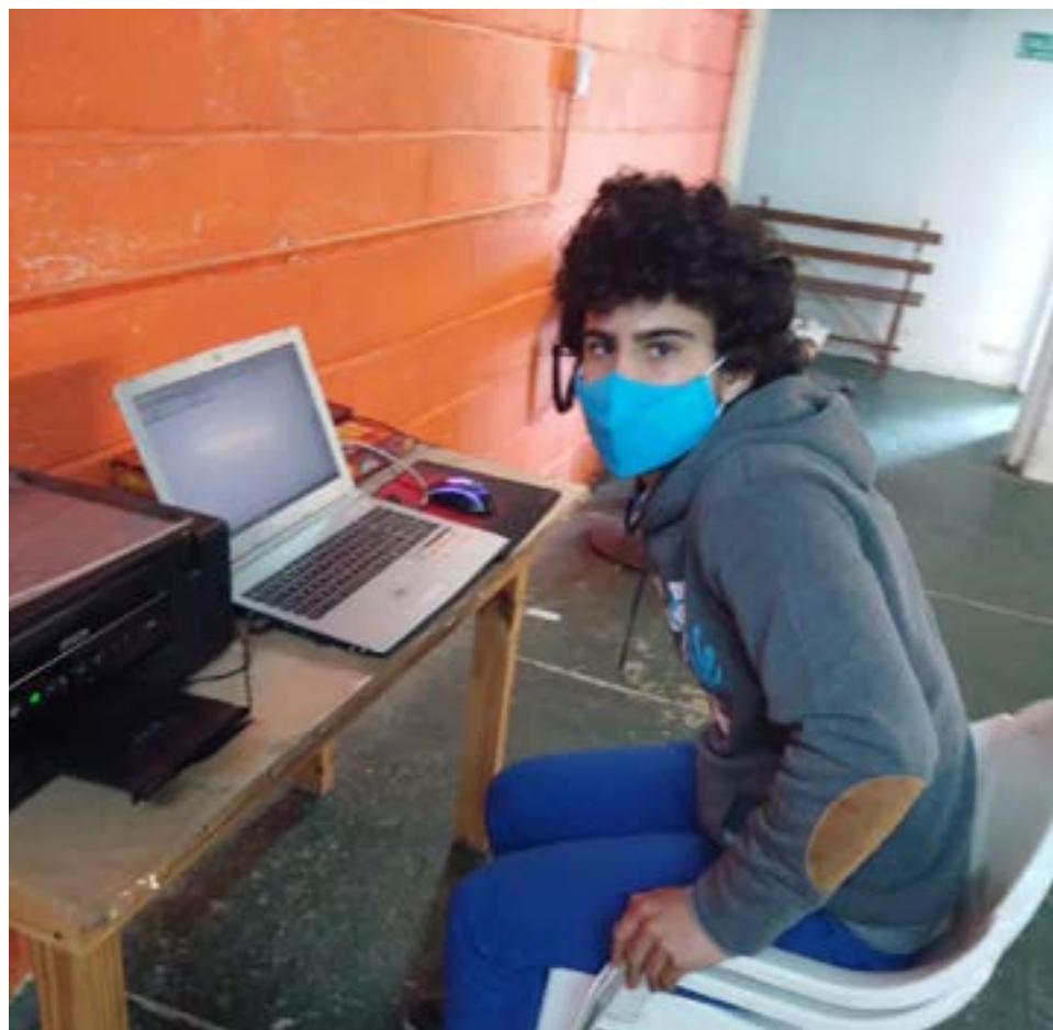
El reconocido ajedrecista; Santiago Borbea será el organizador del certamen regional.