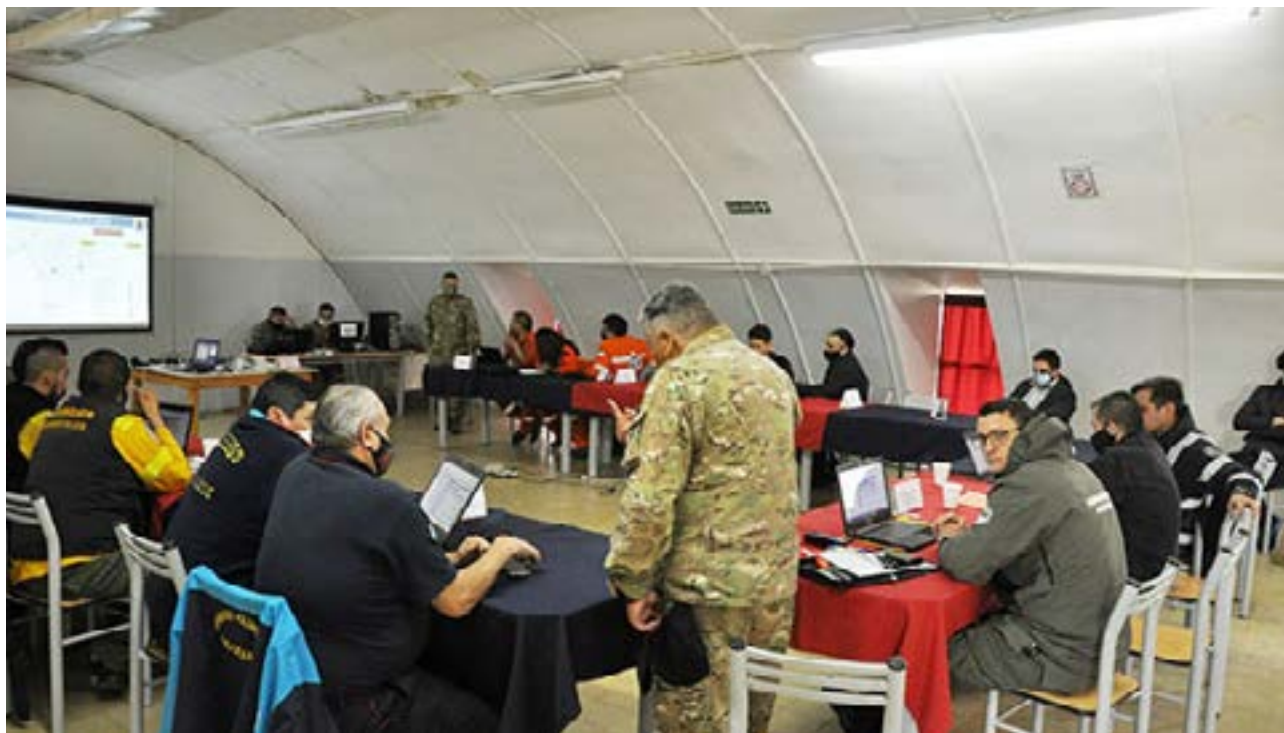
Junto a distintas reparticiones públicas de seguridad el BIM 5 lleva adelante Ejercicio de Manejo de Crisis.

En este sentido, el militar valoró la experiencia y la experticia de estas reparticiones públicas, tanto federales, provinciales como municipales, “ya que ellos han enfrentado diversas situaciones con manejo de crisis y por ello es que los hemos convocado a que nos ayuden a diseñar un ejercicio para después proponerlo en el futuro con más actores y que sea una herramienta que ayude