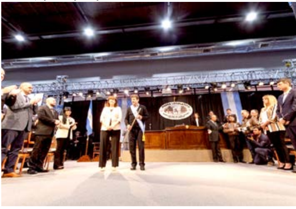
El Gobernador de Tierra del Fuego, Antártida e Islas del Atlántico Sur, Gustavo Melella, realizó un balance de gobierno al cumplirse el primer aniversario de su gestión este 17 de diciembre.

“Quiero agradecer a todos los fueguinos y fueguinas por acompañarnos en este primer año de gestión. Sigamos transitando a la par para poner de pie a nuestra Tierra del Fuego, Antártida e Islas del Atlántico Sur”, concluyó el gobernador Melella a un año de su asunción.