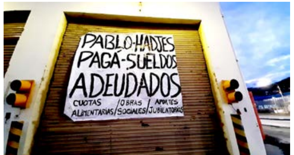
Las trabajadoras y los trabajadores de Ambassador Fueguina, quienes llevan 12 meses sin cobrar sus haberes y permanecen en el interior de la planta reclamando por la reactivación de la misma, intentarán el próximo lunes tomar contacto con el presidente Alberto Fernández durante su visita a Río Grande.