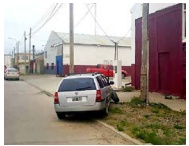
Colisionó contra un poste y terminó hospitalizada.