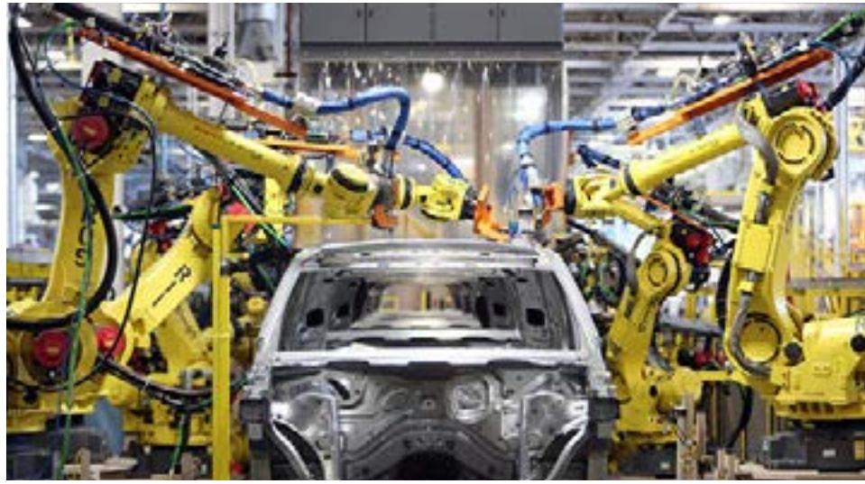
Mal año para la industria.

relación con el anterior. Según el informe del organismo estadístico, el consumo privado cayó 14,7% interanual, la inversión retrocedió 10,3% mientras que el consumo público se contrajo 6,5%. En el frente externo, las