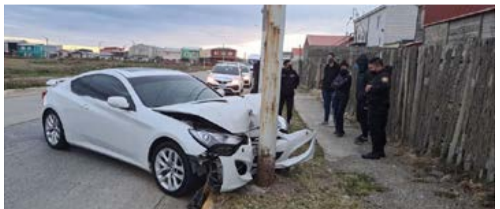
Automóvil de alta gama quedó destrozado al impactar contra un poste en San Martín y Liniers.

Ambos fueron notificados del artículo 205 de violación a la cuarentena.