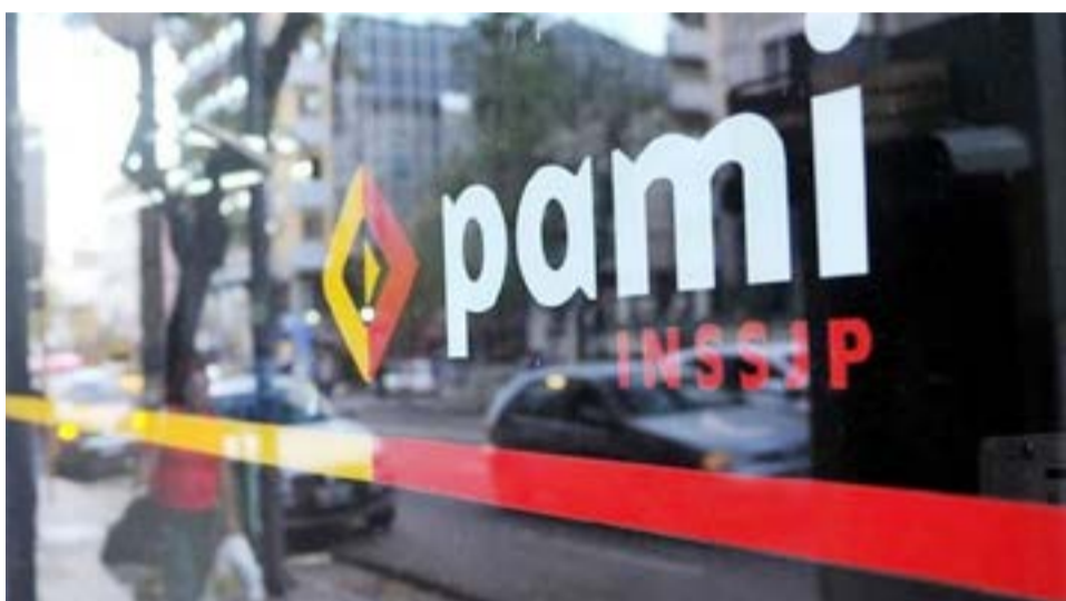
La obra social trabaja sostenidamente en las políticas de inclusión social para alivianar la situación compleja que se vive durante la emergencia sanitaria.

0 y 1 cobran el: 22 de diciembre, 2 y 3 cobran el: 22 de diciembre, 4 y 5 cobran el: 22 de diciembre, 6 y 7 cobran el: 22 de diciembre, 8 y 9 cobran el: 22 de diciembre.