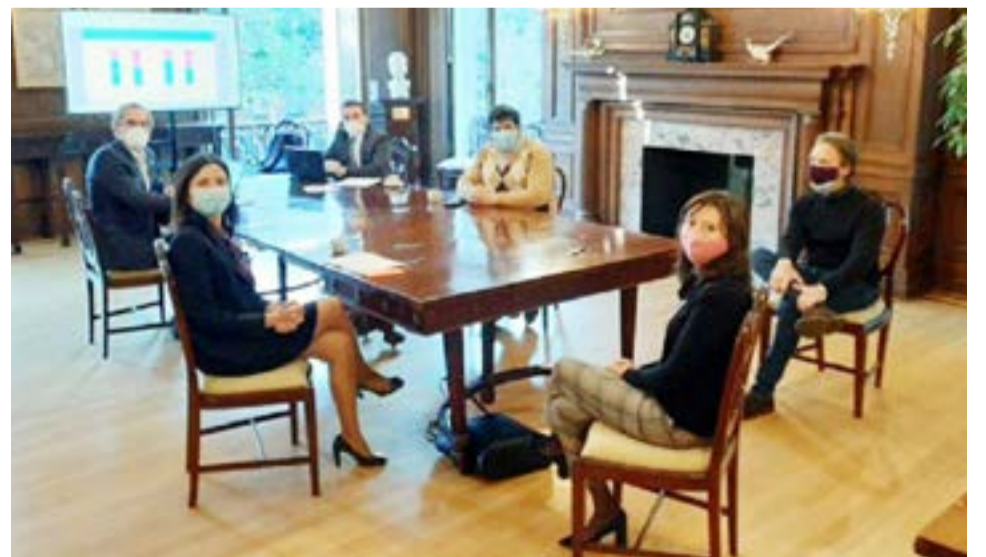
Funcionarios del Ministerio de Economía y del Fondo Monetario Internacional (FMI) comenzaron las reuniones formales en Washington para intentar avanzar en la firma de un acuerdo, que recién podría llegar en el primer trimestre de 2021.

se trabajará en la estrategia para la profundización del financiamiento vía el mercado de capitales doméstico.