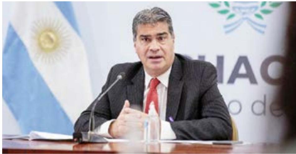
El gobernador Jorge Capitanich será el anfitrión del encuentro de mandatarios del NOA y NEA del viernes en Chaco.

De la cumbre brotará un documento conjunto con los ejes centrales de los