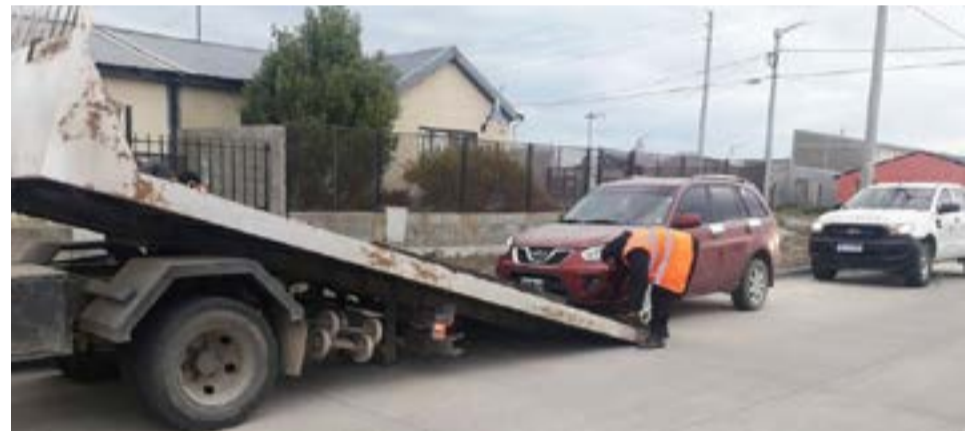
Conductor en estado de ebriedad realizaba maniobras indebidas y fue aprehendido.