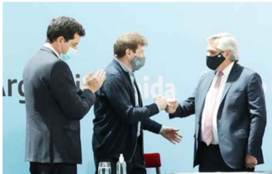
El nuevo pacto establece que todos los traspasos de funciones de Nación a alguna provincia se realizarán con fondos estipulados por ley y no a través de un cambio en los coeficientes de coparticipación.

“HAY UN PAÍS QUE NOS RECLAMA TRABAJAR UNIDOS”