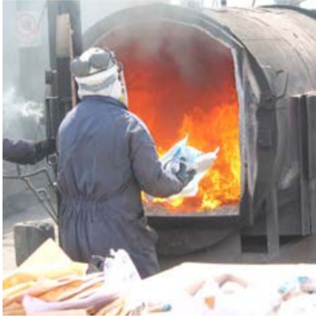
La Justicia Federal de Río Grande incineró más de 68 kilos de sustancias estupefacientes.