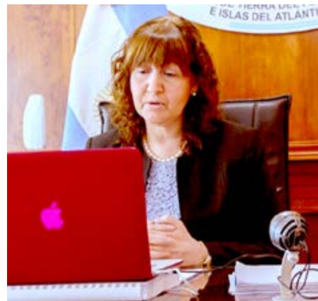
La Vicegobernadora Urquiza destacó diversas actividades que la provincia de Tierra del Fuego ofrece como por ejemplo industria electrónica, textil, industria del conocimiento, turismo, logística antártica como así también lo que representa la cuestión Malvinas.

La presidenta de la Cámara, afirmó “el enclave logístico que tenemos con España, desde Ushuaia y hacia la Antártida, se ha desarrollado fuertemente desde el año 2005, a través de la Armada española con el buque Hespéride, que realiza la logística antártica desde