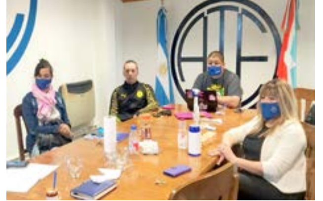
Dirigentes de ATE arribaron a un acuerdo salarial con las autoridades de la Agencia de Recaudación Fuegoquina (AREF), que corresponde al segundo semestre 2020.

dara como ajuste la mala liquidación del SAC de julio. Esto último se reclamó desde la seccional Río Grande para todos los trabajadores del AREF a nivel Provincial.