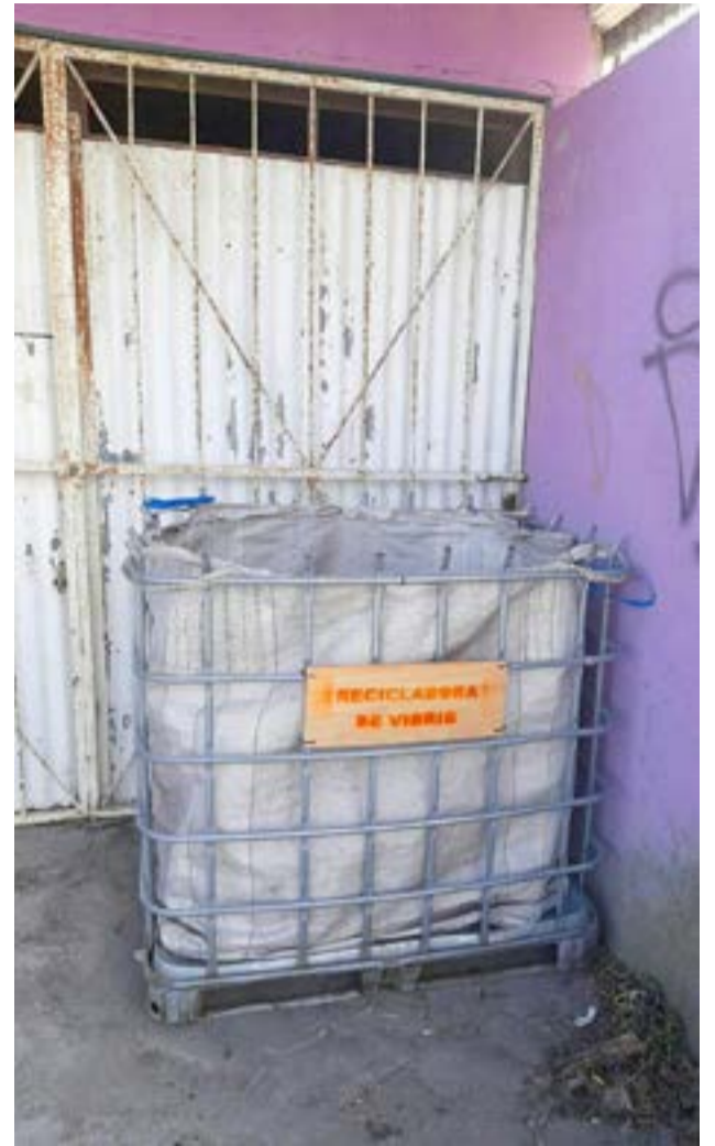
El punto de recolección de vidrio en Alberdi 167 frente a la recicladora.