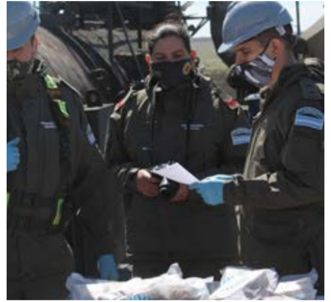
El procedimiento estuvo a cargo de Gendarmería Nacional.

Acerca de los plazos para realizar este procedimiento, el funcionario comentó: «Los plazos se establecen en base a cada causa, en base a tiempos procesales, porque el plazo que indica la ley es exiguo, pasa que en los 5 días no llegamos a hacer las pericias que se requieran entonces se realiza la pericia se extrae la contra muestra para que continúe la siguiente etapa y se eleve a juicio oral y público», dijo.