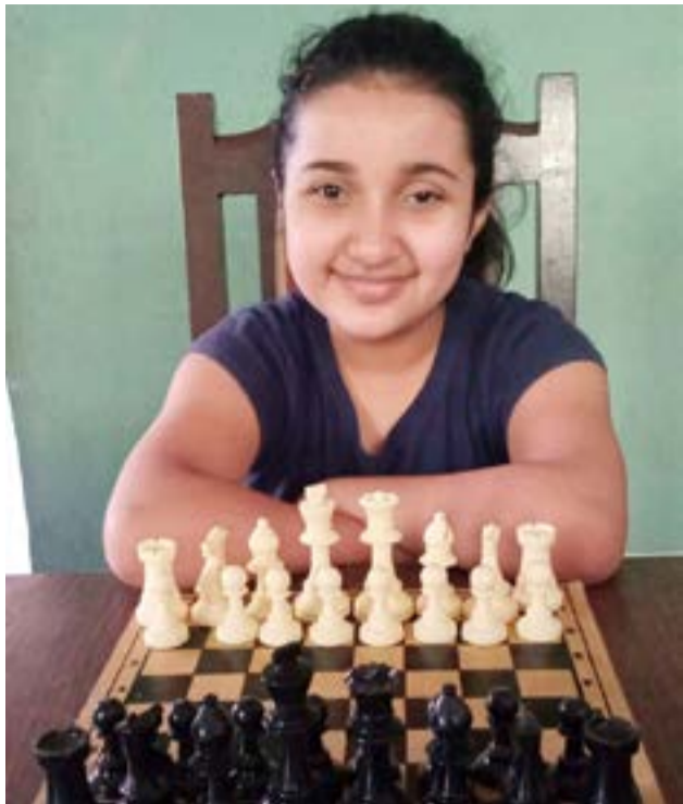
https://lichess.org/tournament/605m8btY Sábado 13 de febrero