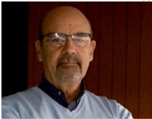
Carlos Martín Torres Diputado de la Nación (m.c.) y Ex Gobernador Fueguino.

Lo económico y financiero; Los Recursos Naturales y un usufructo propio de los mismos; la defensa nacional y las FFAA en su accionar; la soberanía de la Provincia en sus territorios, en su mar y de sus capacidades materiales y las relaciones con los países vecinos, están condicionados absolutamente por Inglaterra y por dichos Tratados, que invalidan la posibilidad de concretar lo que se dice en los discursos soberanistas. Recuperación de la Patria usurpada; Justicia Social; crear trabajo; lucha por la salud pública; cruce por aguas argentinas;