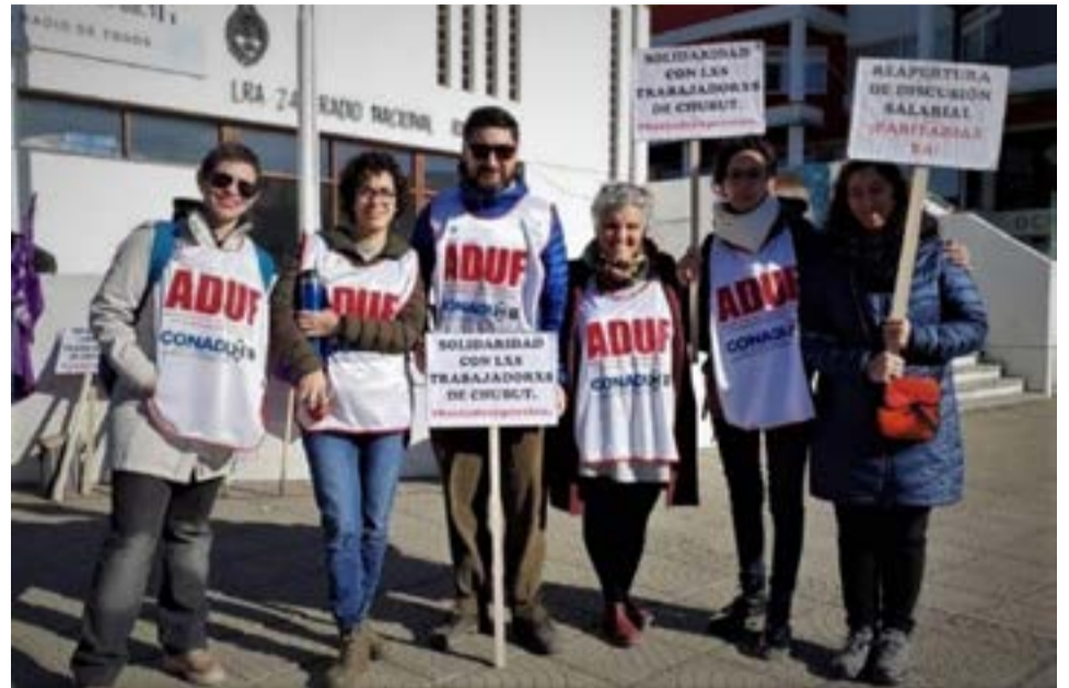
Desde la Asociación de Docentes Universitarios Fueguinos se refirieron a la reunión que mantuvo la Comisión Negociadora de Nivel Particular en la UNTDF.

Además de “Ratificar la voluntariedad para cualquiera de las modalidades que adopte cada docente/equipo docente”.