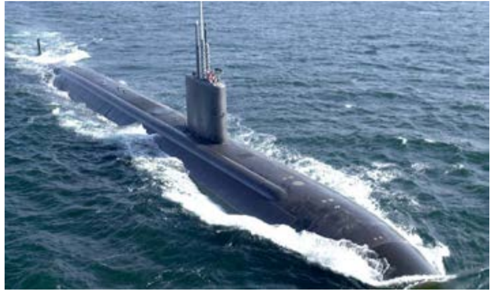
El USS Greeneville - SSN 772 en el Atlántico Sur despertó la preocupación del gobernador Gustavo Melella.

“Manifestamos nuestra más extrema preocupación por este accionar inaceptable no solo para nuestra Provincia y nuestro País, sino para todos los ciudadanos del mundo que luchan contra el colonialismo y por vivir en un mundo sin armas nucleares”, cerró Melella.