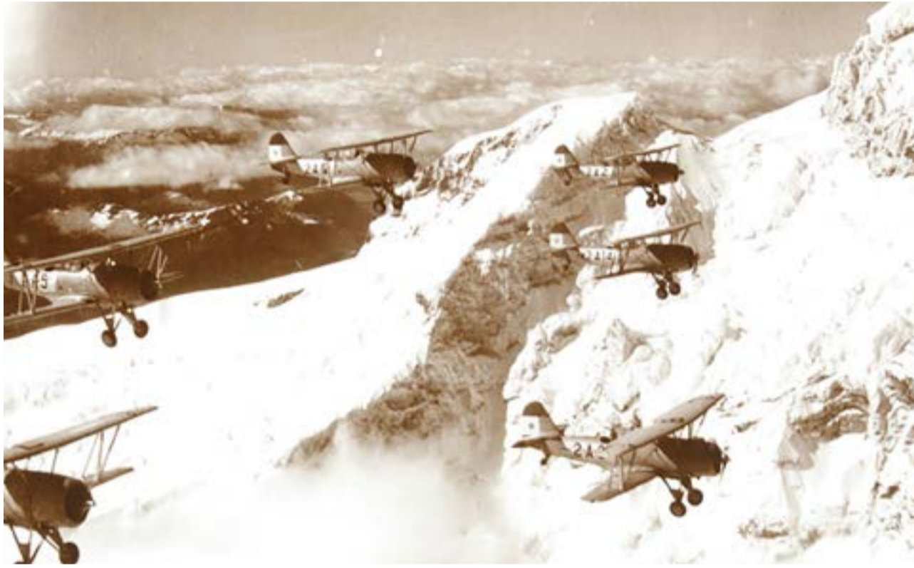
El 11 de febrero de 1916 se creó el Parque y Escuela de Aeroestación y Aviación de la Armada en Fuerte Barragán, con dependencia directa del Ministro de Marina.

Otro desastre natural por el que fue requerida la asistencia de la Armada Argentina ocurrió en Bolivia donde, producidos una serie de desastres climatológicos que provocaron una situación de emergencia nacional, fue enviada para prestar ayuda parte de la Escuadrilla Aeronaval de Observación de la Escuadra Aeronaval N° 2.