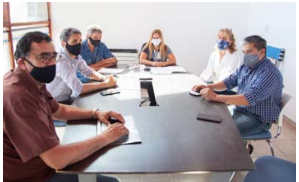
Aseguran que el objetivo de la Agencia es coordinar los trabajos con seguridad vial y tener una fuerte presencia en las rutas de la provincia para disminuir los siniestros viales.