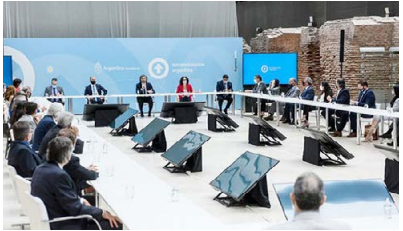
Funcionarios y empresarios en la reunión que se realizó en el Museo del Bicentenario.

Por el lado de los empresarios, aquellos con mayor llegada a los funcionarios hicieron saber que el sector puede acompañar pero que la presión impositiva hace difícil cumplir con algunas medidas de contención de precios.