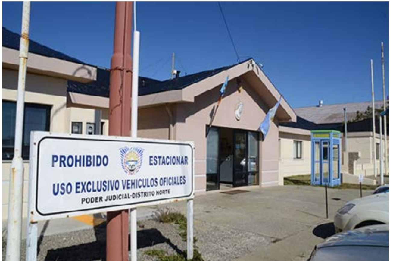
Se está llevando adelante un juicio por mala praxis en Río Grande.

Ayer declararon compañeros de trabajo de la víctima y mañana continuarán testimoniales con más médicos.