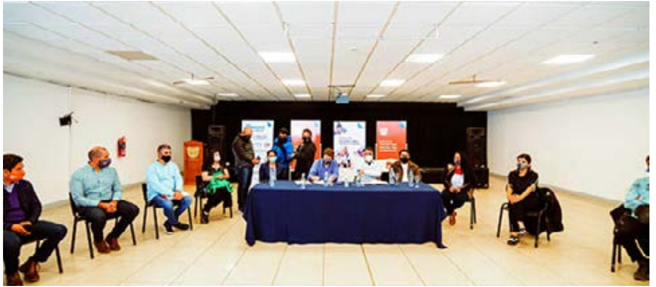
Melella evaluó que “está a la vista que cuando hay decisión política todo se puede hacer”.

A su vez, recordó que “cuando volvimos a la legalidad del salario, había docentes que trabajaban doble turno