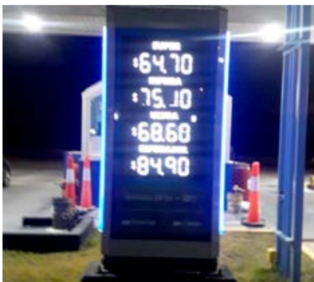
En el resto del país, donde los importes son más altos, la suba será del 7% promedio.

El viernes último, YPF anunció que aumentará sus combustibles un 15% en lo que queda del año. Pero