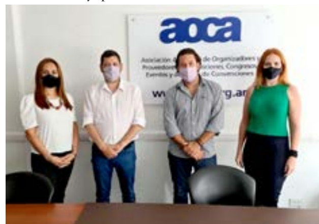
En el encuentro se trabajó en temas relacionados con la actividad del turismo de reuniones y sobre la participación de la ciudad de Ushuaia en el programa Re-encontrarse.

las herramientas con el objetivo de generar una mayor cantidad de visitantes, de cara a la nueva temporada invernal, después de este año tan difícil producto de la pandemia, que paralizó el turismo de invierno".