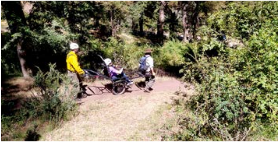
Las 24 sillas de ruedas adaptadas para senderismo en zonas agrestes, serán distribuidas en 12 áreas protegidas del país.

Piccione llevó adelante una capacitación al personal del parque como también re-