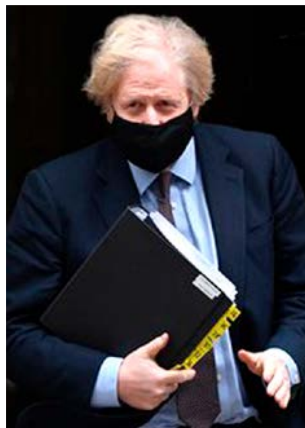
“El Reino Unido está lejos de abandonar sus compromisos transatlánticos. Se están reforzando y se mantienen en alta consideración”, dijo Boris Johnson.

Ante ese panorama, el Reino Unido, con su recobrada “independencia” tras dejar la UE, “ya no puede confiar en que un sistema internacional obsoleto” proteja sus intereses y promueva sus valores, subraya el documento. Por ello, aboga por usar “todas las armas a disposición”