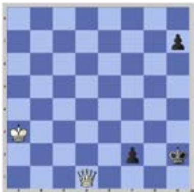
Problema 007 Flor-Ozols 1937 Juegan Blancas y ganan