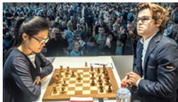
Hu Yifan – Carlsen – Internacional Grenke 2017

Luego del retiro de Judith Polgar, Hu Yifan desde julio del 2014 hasta la actualidad es la número 1 del mundo con 2658 ELO FIDE, luego de jugar el Super Torneo Tata Steel en enero 2016, en febrero llegó a Punta Arenas donde jugó un match contra el maestro internacional Cristóbal Enríquez (hoy gran maestro). En 2006, a la edad de 12 años, participó en su primer Mundial. Más tarde, se convertiría en la campeona mundial femenina más joven de la historia, venciendo a su compatriota Ruan Lufei. Jugo los torneos más fuertes del mundo, Biel, Grenke, Memorial Gashimov donde siempre dio batalla. En julio 2020 ha sido nombrada como la docente titular más joven de la historia de la Universidad de Shenzhen. La joven de 26 años es ahora profesora en la Escuela de Educación Física, donde dirigirá el programa de ajedrez de la institución.