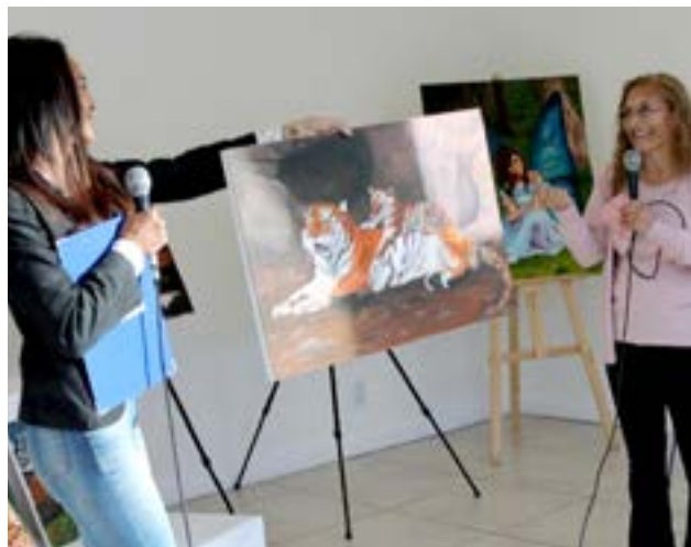
Todos aquellos vecinos y vecinas que pasen por la vidriera de San Martín 1052 (casi esquina Don Bosco) podrán apreciar las magníficas obras.

Cabe mencionar que los cuadros permanecerán exhibidos durante dos semanas. Todos aquellos vecinos y vecinas que pasen por la vidriera de San Martín 1052 (casi esquina Don Bosco) podrán apreciar las magníficas obras.