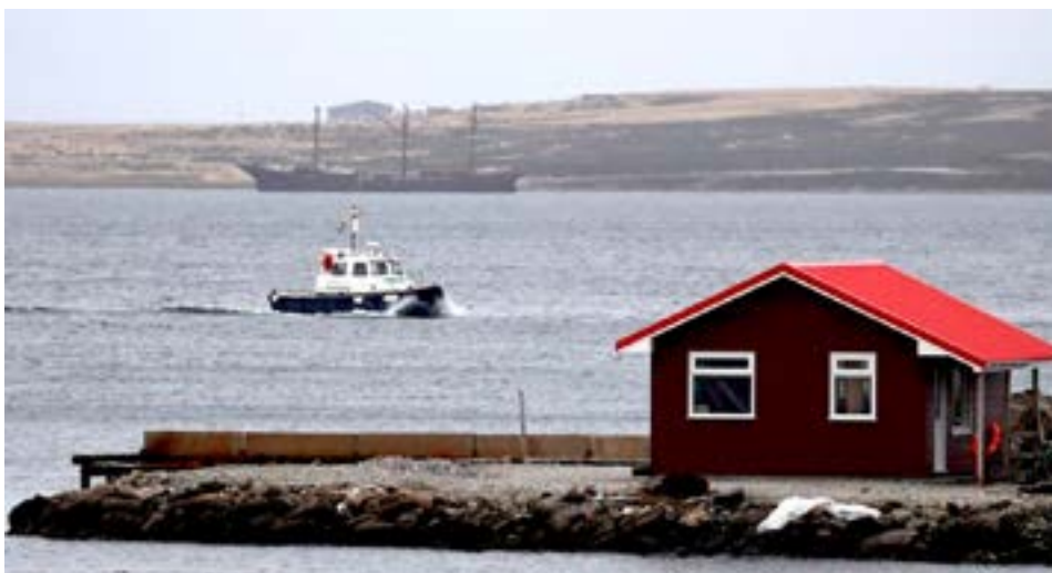
La Cancillería argentina emitió un comunicado en el que reivindicó su soberanía sobre las Islas Malvinas y recordó que “el Reino Unido debe escuchar a la comunidad internacional que promueve el fin del colonialismo en el mundo”.

Frente a la presentación realizada hoy por el primer ministro británico Boris Johnson en la Cámara de los Comunes, en la que expuso una Revisión Integrada de Seguridad, Defensa, Desarrollo y Política