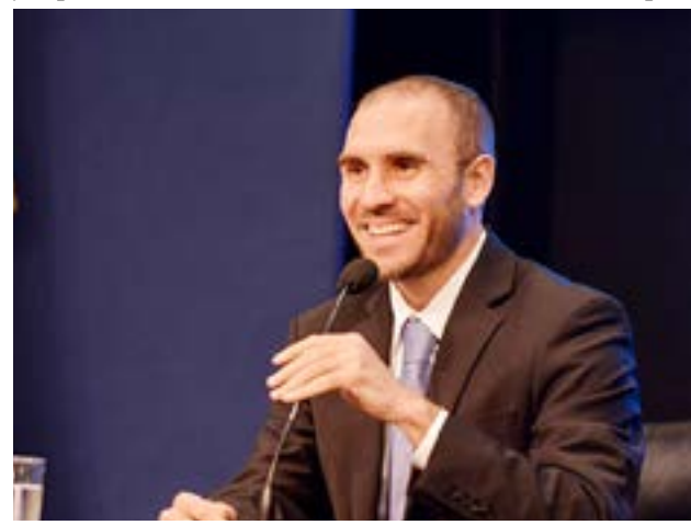
Argentina "es la economía que más rápido se está recuperando en todo el continente", aseguró Guzmán a fondos de inversión.

El mercado sigue la misma línea optimista que Guzmán, ya que también hizo una corrección al alza de las pro-