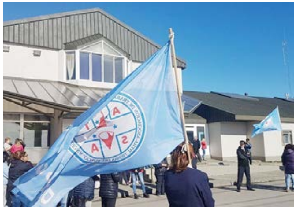
El secretario Adjunto de ATSA confirmó que rechazaron la nueva oferta del Gobierno en paritarias, reclamando que se atienda lo pedido por el gremio.

Desde ATSA entienden que hubo un trato diferenciado para los diferentes sectores de la salud, mencionando que