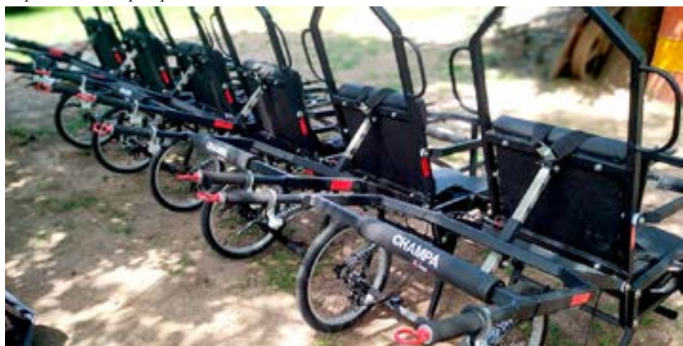
El monociclo tiene silla tapizada apta para intemperie, barra antivuelco, apoya brazos rebatibles y apoya pies regulables.