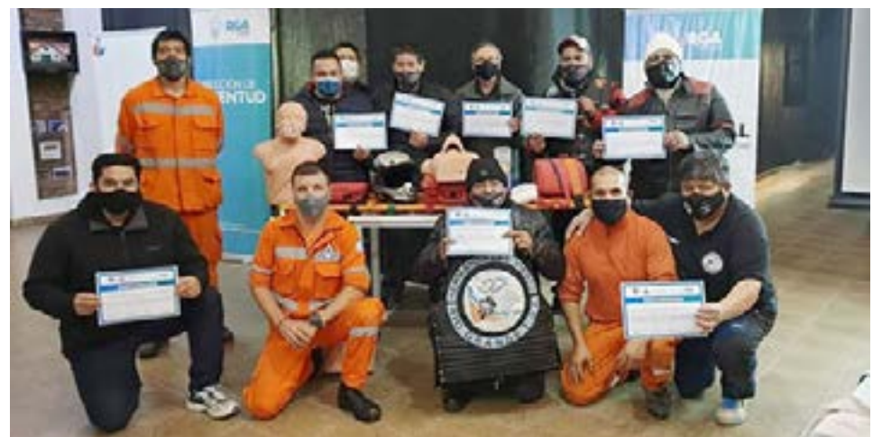
Los Hermanos del Viento serán colaboradores de la Vuelta a la Tierra del Fuego, por ese motivo también realizaron el curso de Primeros auxilios, RCP y DEA.

hincapié en las parrillas de suspensión, rodamientos de maza, corte de corriente que apaga el motor, cascos y administrativamente se realizaron los pagos de los seguros de competencia, deslinde de responsabilidades, etc.