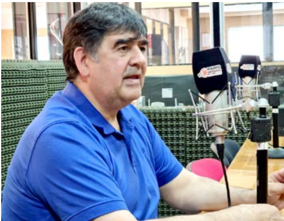
El ministro de Trabajo Marcelo Romero visitó los estudios de Radio Universidad 93.5 y ofreció un panorama de la situación laboral en la provincia.

Romero destacó que “hubo mucha asistencia a trabajadores agrupados por sus gremios, como el gastronómico. El gobierno nacional estuvo entregando los ATP y luego a través del INFUETUR logramos la asistencia del Ministerio de Trabajo nacional y del Ministerio de Turismo nacional, para algunos trabajadores de hotelería y gastronomía, que no satisfizo pero llevó cierta tranquilidad. Hay una herramienta muy importante que nos delegó el Ministerio de Trabajo de Nación que son los acuerdos de reducción salarial. Esto permitió mantener las fuentes de trabajo, de todas formas el trabajador sufrió mucho esta situación