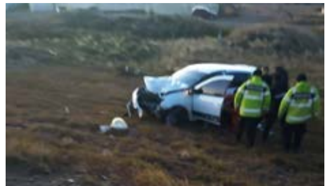
Conductor lesionado luego que su automóvil impactara contra un poste.

Personal de Tránsito municipal realizó el test de alcoholemia al conductor arrojando como resultado 1,79 g/l, por lo que se labró el acta de comprobación respectiva.