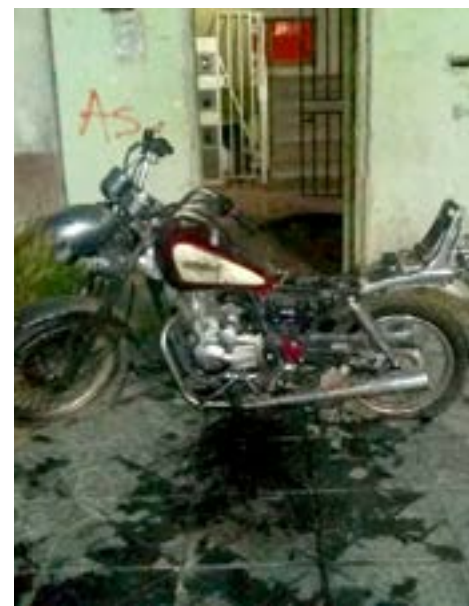
Tres incendios en simultáneo causaron alarma en un sector de Chacra II.

Los ígneos —informó la Policía— serían intencionales y concatenados. Se realiza un amplio relevamiento de testigos y cámaras. Personal de Bomberos de Policía trabajó en los lugares mencionados.