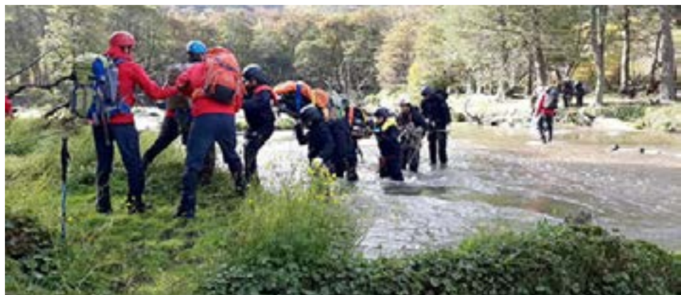
Personal policial se capacitó en búsqueda y rescate de personas en el cerro Jeujepén y Laguna Encantada de Ushuaia.

“Todas nuestras capacitaciones están dirigidas para realizar el trabajo de manera segura, con todo el turismo que se está reactivando a nivel local tenemos mayores intervenciones”, dijo para concluir el funcionario.