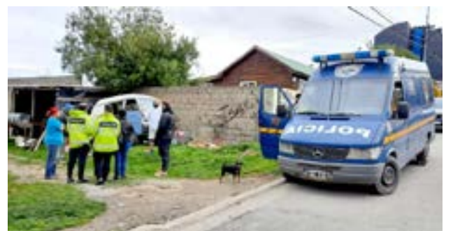
Policía recuperó en Ushuaia, un vehículo que había sido robado días atrás.

Tras esto, el Juzgado de Instrucción N°1 ordenó un allanamiento con resultado positivo donde secuestraron el