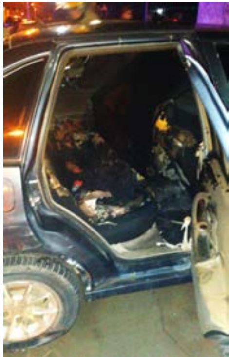
Entre los elementos afectados se encontraron una moto, un automóvil y el palier de un edificio.

Río Grande.- Vecinos de un amplio sector de Chacra II despertaron alarmados el pasado sábado, debido a tres incendios ocurridos en simultáneo en un sector comprendido entre calles Pioneros Fueguinos, Luisa Rosso y Cambaceres. Según relató el Principal Alan Muller a