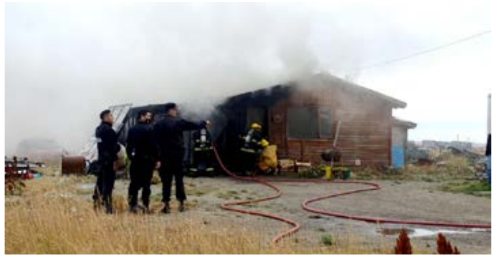
El fuego destruyó un taller de herrería en barrio San Martín y afectó una vivienda contigua.

Intervino en la emergencia personal de la comisaría Quinta de Policía.