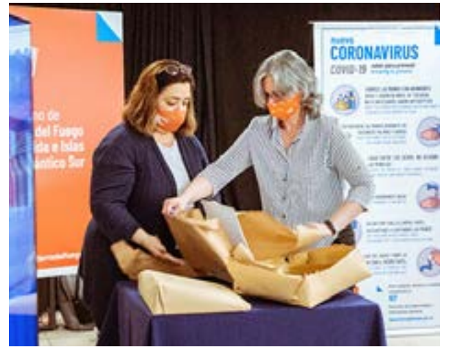
El Gobierno de la Provincia de Tierra del Fuego AIAS a través del Ministerio de Obras y Servicios Públicos realizó la apertura de sobres de licitación para proveer de gas natural a más de 3200 familias de Margen Sur en Río Grande y en barrios de Tolhuin.

política pública garantizar servicios, pero para llevar adelante esto es necesario un esfuerzo conjunto con