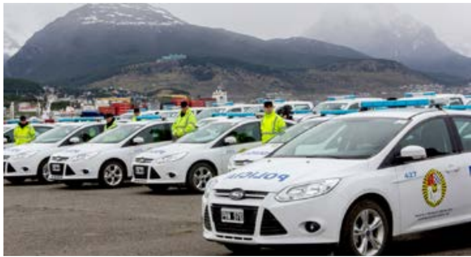
Personal policial y penitenciario de Tierra del Fuego percibirá un 70% de aumento en su salario básico.

"más allá de estos acuerdos salariales, que son necesarios e importantes porque reivindican el trabajo que realizan, desde Gobierno seguiremos generando las ca-