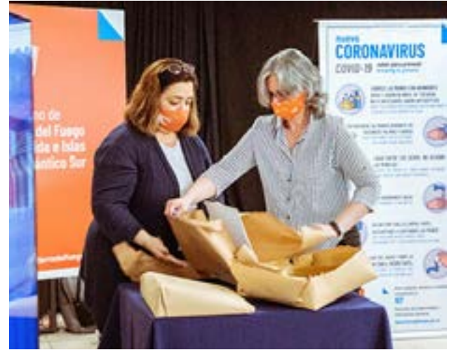
El Gobierno de la Provincia de Tierra del Fuego AIAS a través del Ministerio de Obras y Servicios Públicos realizó la apertura de sobres de licitación para proveer de gas natural a más de 3200 familias de Margen Sur en Río Grande y en barrios de Tolhuin.

política pública garantizar servicios, pero para llevar adelante esto es necesario un esfuerzo conjunto con