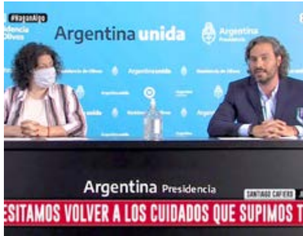
El jefe de Gabinete, Santiago Cafiero, y la ministra de Salud, Carla Vizzotti, anunciaron la aplicación de un nuevo decreto para limitar la circulación en horario nocturno.

El jefe de los ministros también adelantó que este lu-