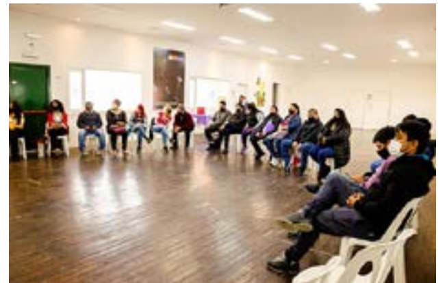
Castillo expresó que “esperamos que en un corto plazo de tiempo, una vez analizadas las ofertas, podamos comenzar con los trabajos. Les pedimos a los vecinos que sean pacientes.”

“El compromiso que asumió el Gobernador es un hecho y en unos días nada más, cuando completemos este proceso administrativo, informaremos qué em-