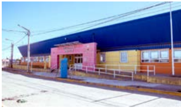
El Ministerio de Educación, Cultura, Ciencia y Tecnología de la Provincia de Tierra del Fuego AIAS, dispuso cómo será la continuidad progresiva del regreso cuidado a clases iniciado este 1 de marzo.

En el Nivel Secundario, durante todo el mes de marzo, cursarán la presencialidad los y las estudiantes de 6°/7° de la cohorte 2020 y a partir del lunes 8 de marzo, se suman a la presencialidad, los y las estudiantes de 6°/7° del 2021, participando de seminarios y/o talleres, a través de un dispositivo denominado "Acompañamiento