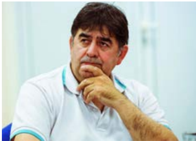
La cartera provincial notificó formalmente a las entidades gremiales y a los paritarios del Ejecutivo Provincial de la convocatoria en la que se discutirá lo concerniente al Escalafón Seco, será el 8 de marzo próximo a las 15 horas en el SUM del IPRA, cito en Perito Moreno 168 de Río Grande.

Río Grande.- La cartera provincial notificó formalmente a las entidades gremiales y a los paritarios del Ejecutivo Provincial de la convocatoria en la que se discutirá lo concerniente al Escalafón Seco, será el 8 de marzo próximo a las 15 horas en el SUM del IPRA, cito en Perito Moreno 168 de Río Grande.