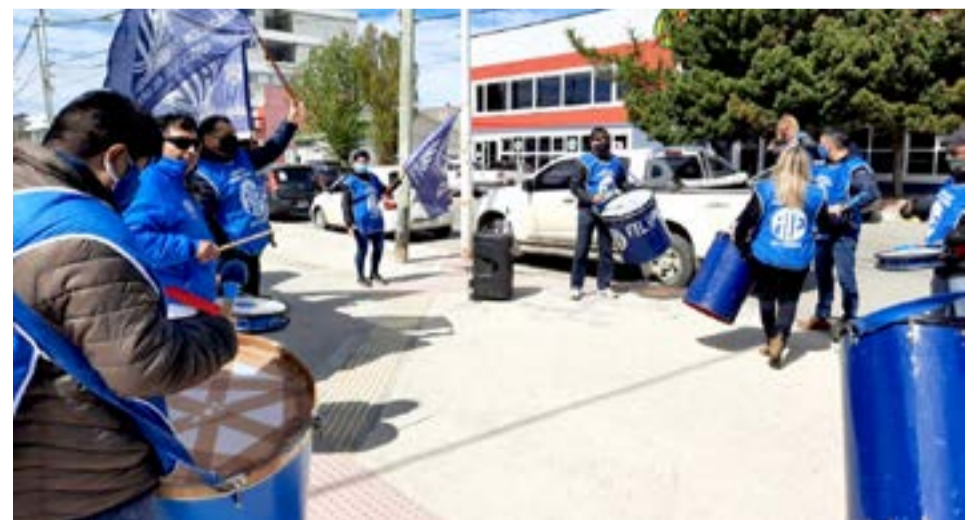
Desde ATE adelantaron la intención de lograr un incremento salarial "para los dos escalafones" en el ámbito de paritarias.

"Seguramente la tendremos ahora en esta primera reunión, por eso estamos esperando que nos contesten y seguir trabajando para obtener un aumento en estos dos escalafones que también están bajísimos en cuanto a los sueldos, por eso es importante levantar el piso salarial como lo hicimos en la Municipalidad de Río Grande", destacó finalmente el titular de ATE Río Grande.