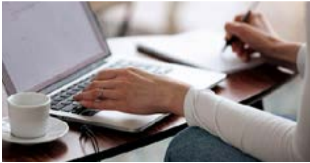
Las escalas del Monotributo permanecen desactualizadas pese a la inflación.

Buenos Aires.- En su discurso ante del Congreso, el presidente Alberto Fernández pidió que se apure el tratamiento de la ley que propone reformas y actualiza las escalas del Monotributo, que aún no tiene fecha definida. Mientras tanto, se mantienen sin actualizar las