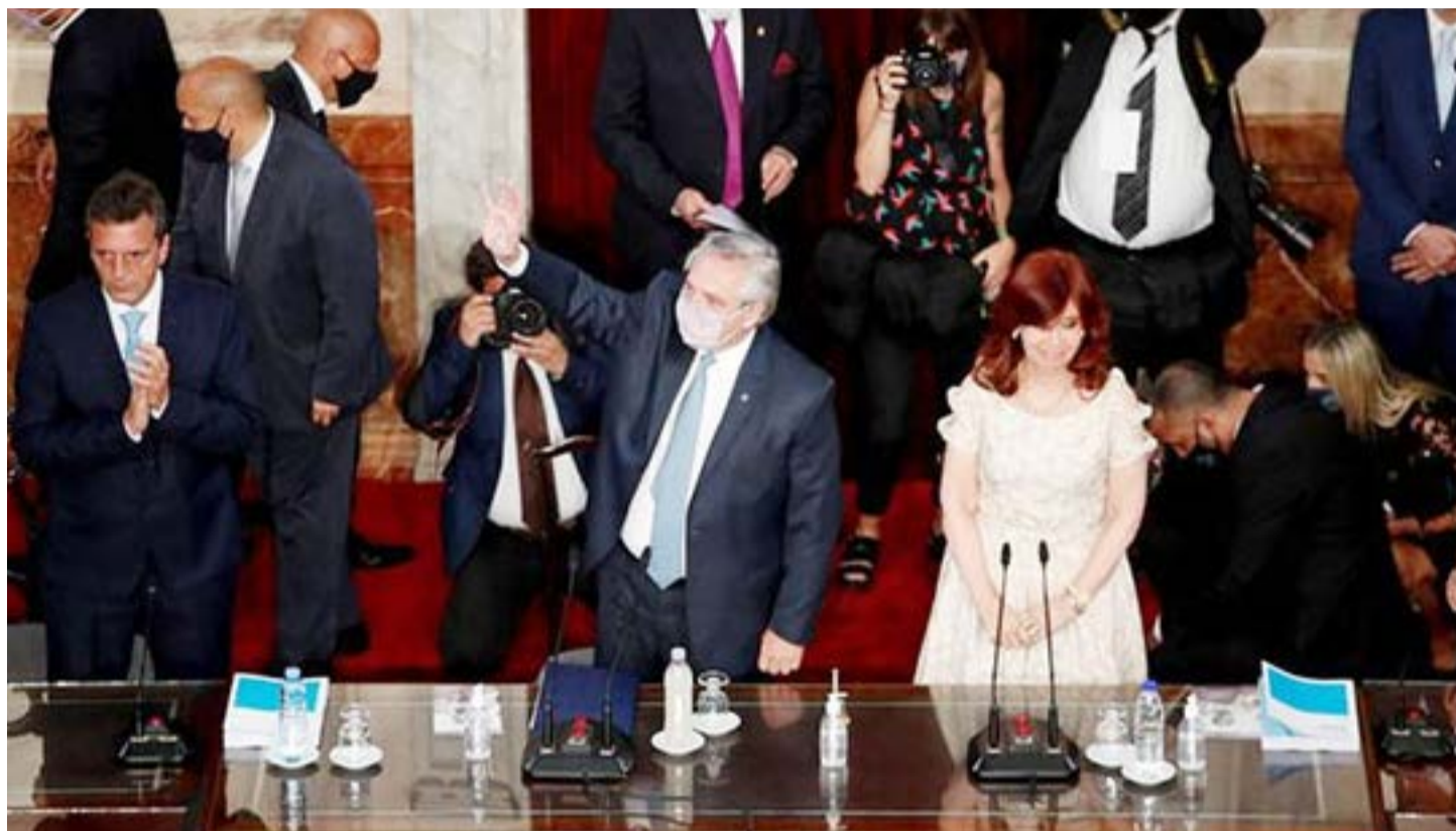
Alberto Fernández junto a Cristina Kirchner en la Asamblea Legislativa del lunes.