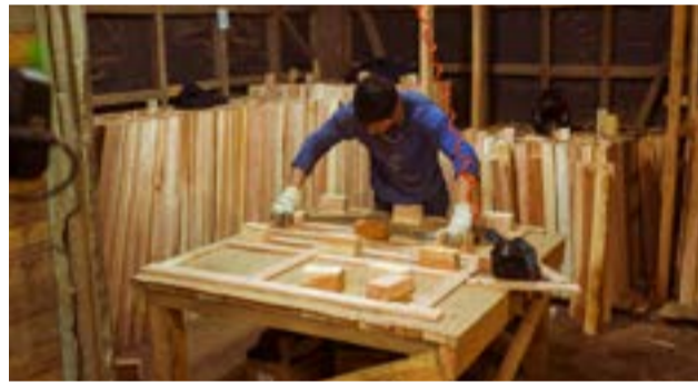
El Gobierno de la Provincia a través de PROGRESO, durante el 2020, asistió a emprendedores, trabajadores de la economía popular y, micro, pequeñas y medianas empresas (MiPyMEs), de distintos rubros de actividad tales como el comercio, la producción primaria e industrial, los servicios personales y profesionales, la gastronomía y hotelería, el turismo, la educación, entre otros.

Los créditos bancarios con destino de inversión productiva de hasta $10.000.000, serán operados por el Banco de Tierra del Fuego. Sobre esta línea, el FONDEP, Ministerio de Desarrollo Productivo de Nación, subsidiará 8 puntos porcentuales de la tasa de interés, mientras que el Gobierno de la provincia contribuirá con el subsidio de tasas de interés (entre 15 y 23 puntos porcentuales) para que las MiPyMEs fueguinas pueda beneficiarse de