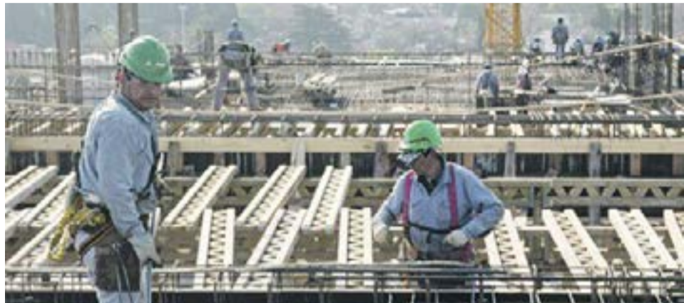
Los costos de los materiales volaron, mientras la mano de obra se mantiene estancada.

Buenos Aires.- Los costos de la construcción crecieron 43,9% interanual, empujados fuertemente por la inflación en los materiales, que se incrementaron 4% en el tercer mes del año, siendo el rubro que desde hace un año no paró de empujar los precios. Las subas coincidieron con la ralentización de la actividad sectorial que las entidades vienen señalando desde febrero.