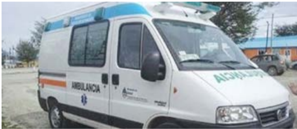
“El Paisa” Orbez, imputado de abuso sexual, fue trasladado a Río Grande tras haber sido escrachado en Tolhuin.

cuadro de salud. Mientras tanto, se evalúa si se realizará o no el juicio oral, justamente debido a la situación de salud que Orbez atraviesa, sin embargo, la familia denunciante pide justicia y que “no muera inocente”.