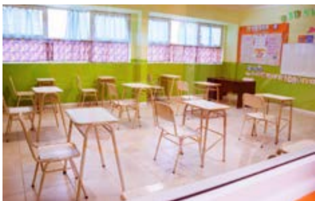
Bellone resaltó que “entre ayer y antes de ayer hay un total de 9 casos sospechosos de covid en Ushuaia, 6 docentes y tres alumnos cada uno con sus burbujas”.

la es un espacio cuidado porque por protocolo se redujeron la cantidad de alumnos por metro cuadrado, usan barbijo, se ventila frecuentemente y hay higiene de manos. Por esto no estamos considerando que las escuelas sean un factor de transmisión, porque no hay contagios adentro de las burbujas y ese es el dato que nos sirve para indicar si hay o no contagio institucional”.