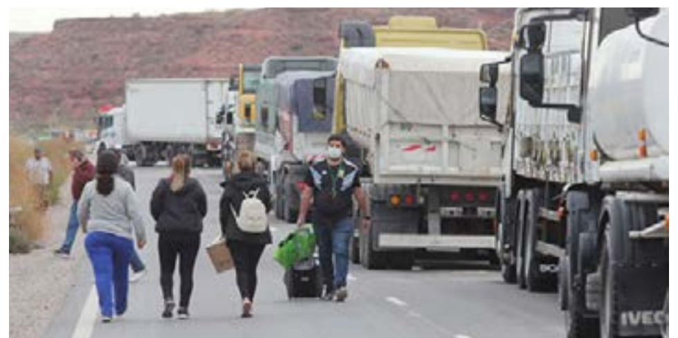
Un conflicto gremial provoca pérdidas millonarias.

"Resulta necesaria la articulación coordinada de los sectores involucrados en el marco de las respectivas competencias y funciones, se trate tanto del Estado Nacional, como las Prestadoras de los servicios licenciados para la adopción de las medidas y en particular de todas las acciones correspondientes, a fin de evitar este tipo de situaciones que puedan poner en riesgo la operación normal y segura de los Sistemas de Transporte regulado por el ENARGAS así como el abastecimiento", advirtió.