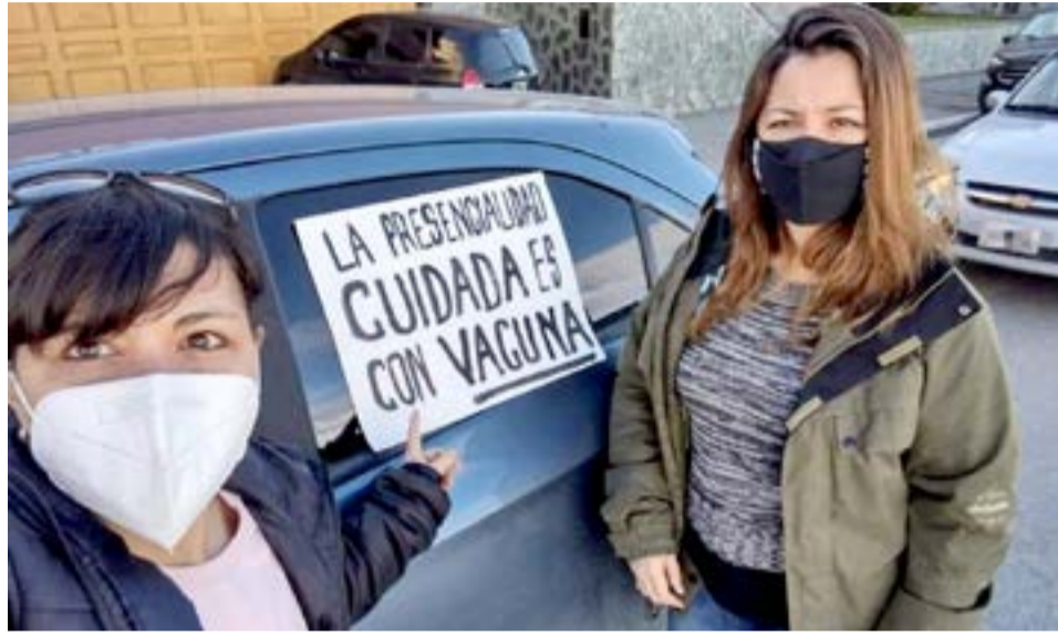
Ayer se cumplió con la medida de fuerza dispuesta por el SUTEF, hubo paro de actividades y caravanas en las tres ciudades.

Los dirigentes del SUTEF expresaron además que “El Gobierno es responsable.