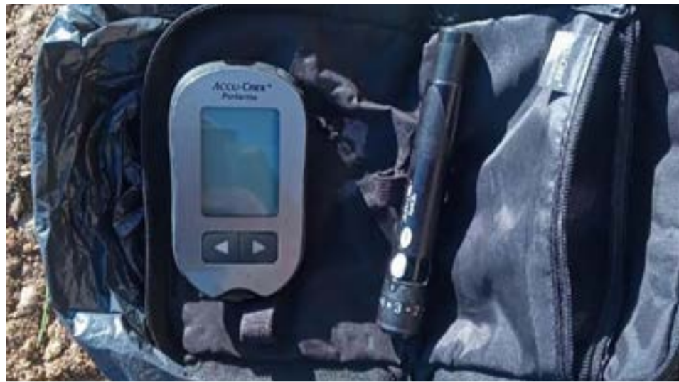
Malvivientes sustrajeron un medidor de glucemia.

El ilícito se registró el pasado 30 de marzo