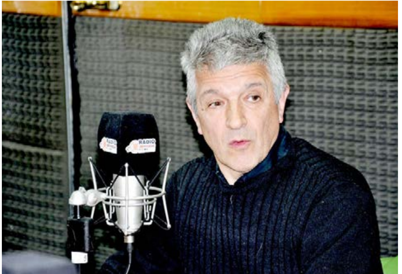
El vicepresidente de ENACOM, Gustavo López, adelantó por Radio Universidad 93.5 la posibilidad de que este mismo año se finalice con la conexión de la provincia con la red federal de fibra óptica, que cambiará radicalmente la calidad del servicio de internet en Tierra del Fuego.

“Vamos a tener una red pública que va a poder vender servicios a los privados que tienen empresas de Internet o de cable, porque ARSAT es mayorista. Por otro lado va a proveer a la red pública del sistema de educación, salud y seguridad”, planteó dentro de los