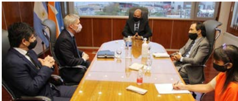
El Superior Tribunal recibió al Colegio Público de Abogados de Río Grande