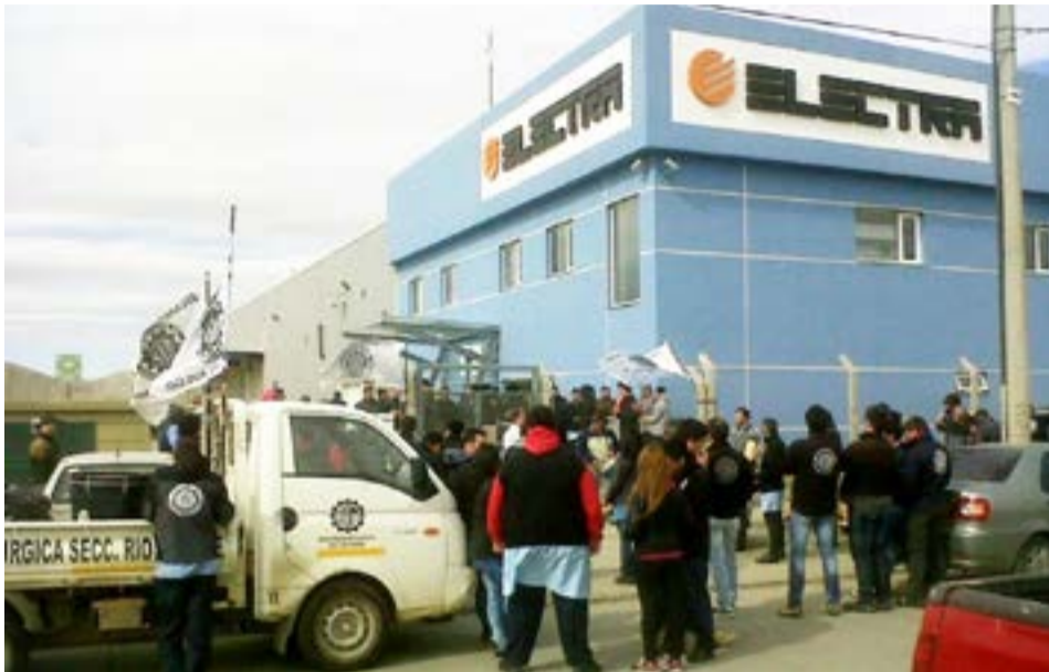
Los delegados de la empresa Electra (Aires del Sur), expresaron su beneplácito por las noticias que dan cuenta de la homologación del concurso de acreedores, pero piden reunirse con la empresa para tener más información.

Uriona se refirió luego a la homologación del concurso de acreedores, situa-