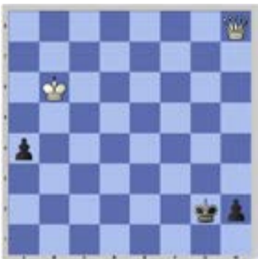
Problema 015 Berger 1922 Juegan blancas y ganan.