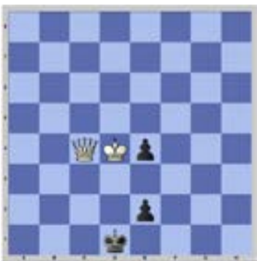
Problema 016 Bekey1906 Juegan Negras y ganan.