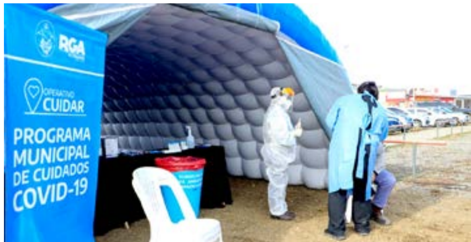
La secretaria de Salud Cóccharo indicó que “con el Operativo Cuidar se busca diagnosticar casos positivos y poder aislarlos de manera temprana”.

“Esta es una de las tantas acciones que llevamos adelante desde el Municipio, con el fin de resguardar la salud de la comunidad riograndense”, aseguró la funcionaria y recordó que “esta jornada de testeos masivos se repetirá en más sectores de la ciudad que oportunamente se informarán”.