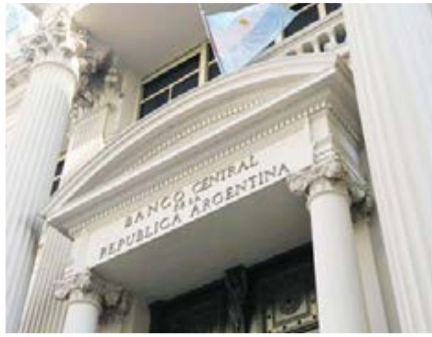
Las reservas no superan los u$s40.000 millones desde octubre de 2020.

En el segmento mayorista, la divisa ascendió cuatro centavos a $92,62 en una rueda en la que el Banco Central compró u$s140 millones, con lo que la autoridad monetaria prácticamente compensó las ventas realizadas durante 2020 (las que se concentraron sobre todo en julio y noviembre).