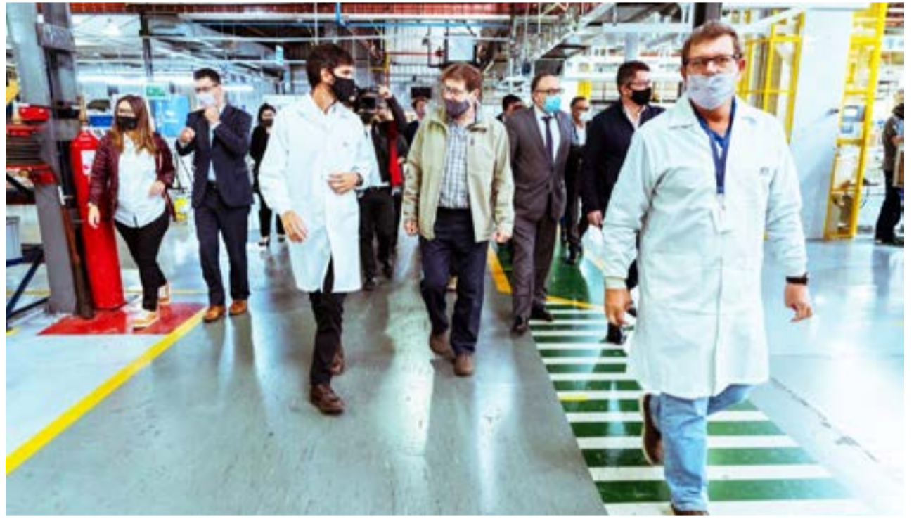
El Gobernador Melella insistió que el espíritu de la Ley 19.640, que creó el subrégimen de promoción industrial en la provincia, “era la soberanía. Hacer crecer la población argentina en Tierra del Fuego”.

“Un gobierno fuerte, una población fuerte que se planta y defiende su soberanía, no es lo mismo que cuando se tiene un gobierno cómplice que hace silencio y acompaña las medidas que favorecen al invasor. Para nosotros el plan de desarrollo es salir por arriba, no es salir con lo mismo de siempre. Vamos por mucho más. Y lo venimos trabajando muy bien con el gobierno nacional” aseguró.