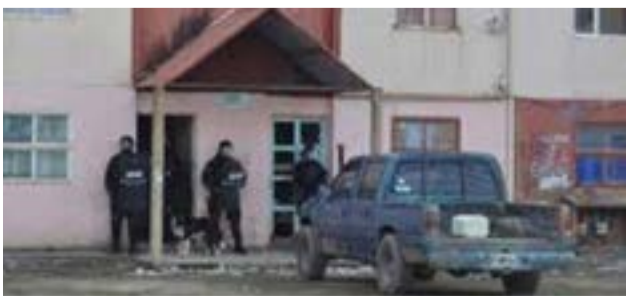
Joven fue atacado y asaltado a punta de arma de fuego, mientras esperaba un remis, en una garita de Chacra IV.

Durante el asalto, con la culata del revólver le propinaron un golpe en la cabeza que le generó una lesión sangrante, por lo que la investigación ya está orientada hacia conocidos malvivientes que residen en la zona.