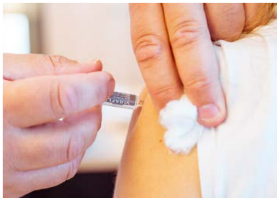
El lanzamiento del Plan Nacional de Vacunación Antigripal 2021 en la provincia se hizo en el CAPS N°9 de Ushuaia del Barrio de Andorra.

Convivientes de enfermos oncohematológicos.