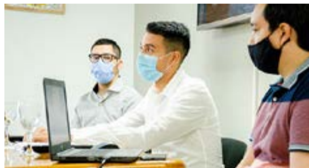
En el marco del Plan de Vacunación contra Covid-19, el Gobierno de la Provincia de Tierra del Fuego AIAS presentó este martes una página web para obtener turnos.

Río Grande.- En el marco del Plan de Vacunación contra Covid-19, el Gobierno de la Provincia de Tierra del Fuego AIAS presentó este martes una página web para obtener turnos. En una primera etapa está destinada a