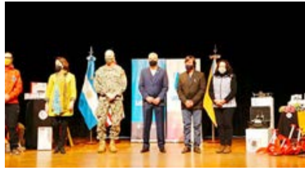
La recepción de los equipos en Ushuaia donde estuvo el Almirante Craig Faller -Jefe del Comando Sur- de Estados Unidos.

la Argentina del más alto nivel, en el que fue recibido por el Ministro de Defensa, Agustín Rossi, y por el jefe del Comando Mayor Conjunto de las Fuerzas Armadas, General Juan Martín Paleo para efectuar donaciones por un valor de 3,5 millones de dólares para apoyar los esfuerzos