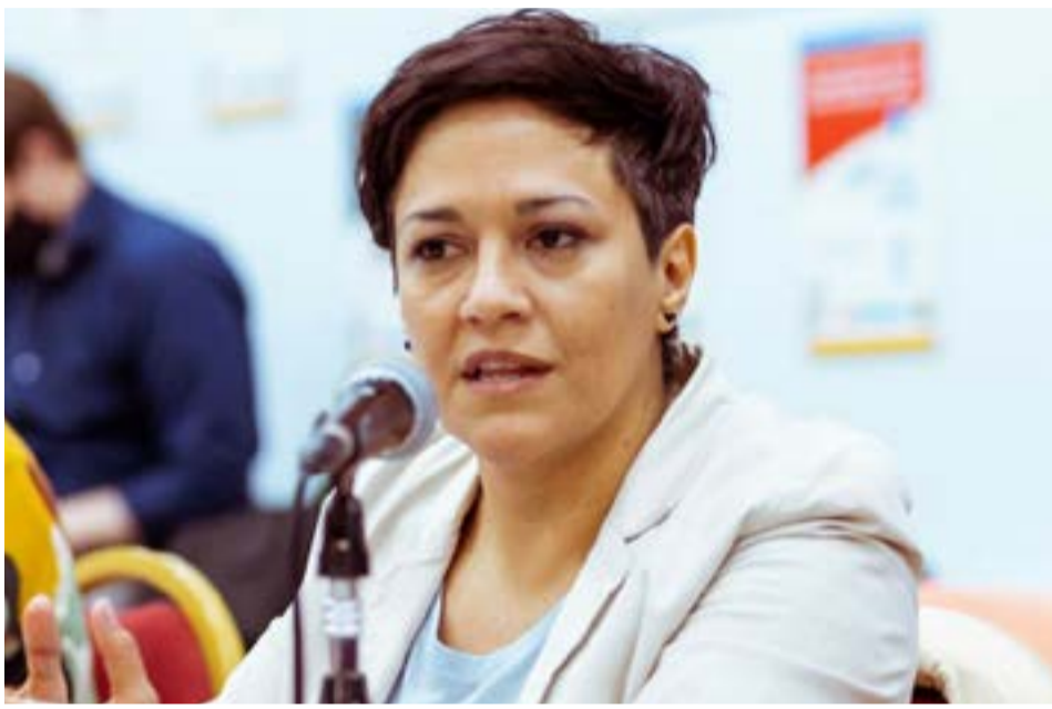
La ministra de Educación Analía Cubino dio a conocer por FM La Isla los casos detectados hasta el momento, desde el reinicio de las clases presenciales, y defendió la necesidad de mantener las escuelas abiertas.

Respecto de qué ocurriría si el gobierno nacional decide cerrar, pese a estos números, dijo que “si hay que cerrar, lo último va a ser la escuela y, si fuera ne-