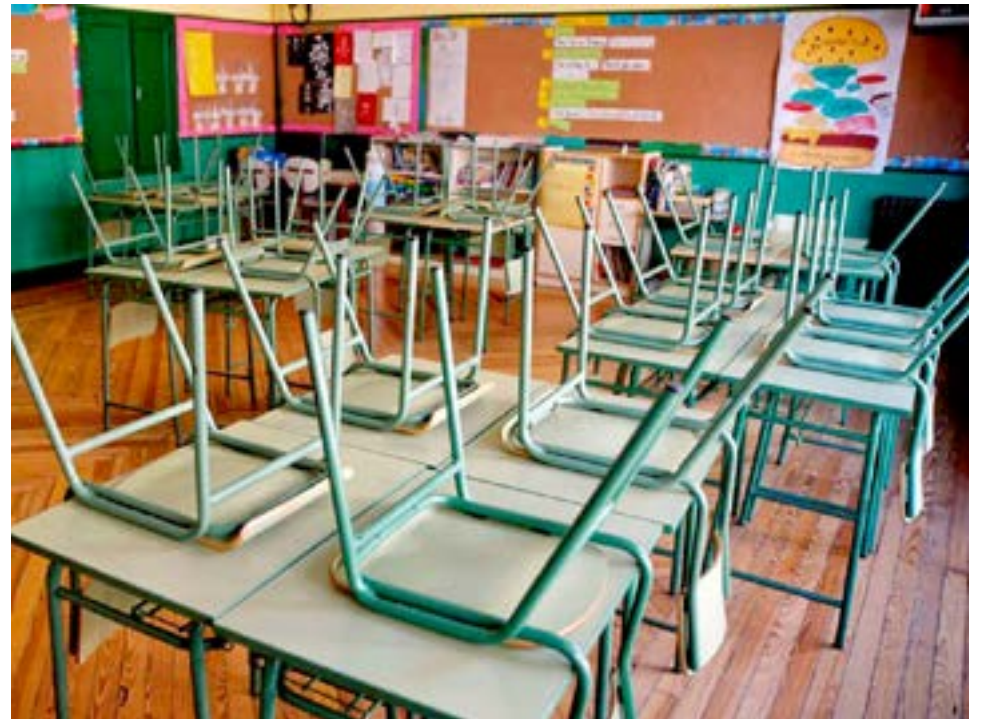
Suspensión de las clases presenciales en los tres niveles educativos desde el lunes.

Y señaló que “las vacunas están siendo acaparadas por un número muy reducido de países. Nosotros estamos entre esos países que irónicamente tienen cierto privilegio de poder seguir accediendo a vacunas y vacunando a su pueblo”.