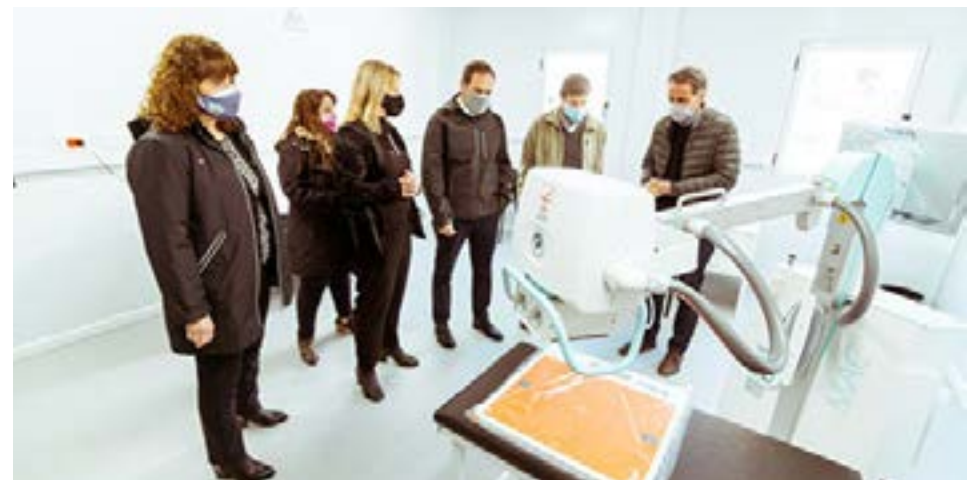
El Ministro Katopodis dijo que “es muy importante que estemos poniendo en funciones este centro sanitario que va a sumar 15 camas al sistema de atención Covid-19”.

Además, remarcó que “Ushuaia tiene un gran problema de infraestructura con el