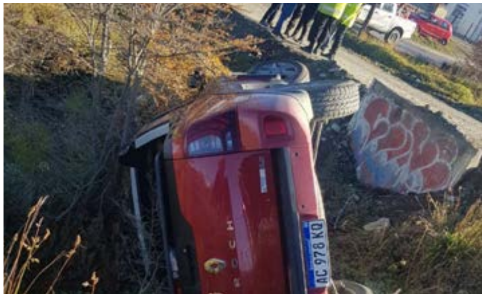
Producto de una mala maniobra, volcó una camioneta en la ciudad de Tolhuin.