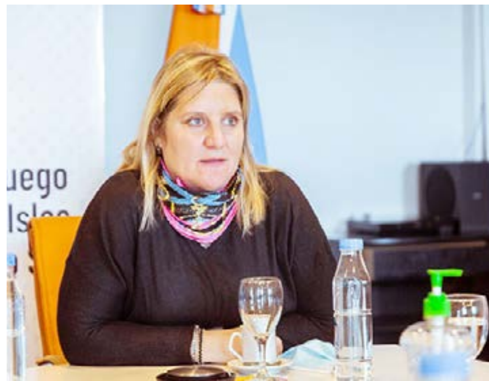
La ministra de Salud Judith Di Giglio se refirió a la situación epidemiológica de Tierra del Fuego y marcó diferencias con el resto del país, si bien no ameritan relajar los cuidados sino todo lo contrario.

siones ni analizar datos. Ahora se están haciendo muchos testeos en la provincia y tenemos distintos lugares de carga de los hisopados. El municipio de Ushuaia realiza los miércoles una campaña de hisopado masivo, y son alrededor de 250 hisopados que se hacen una o dos veces