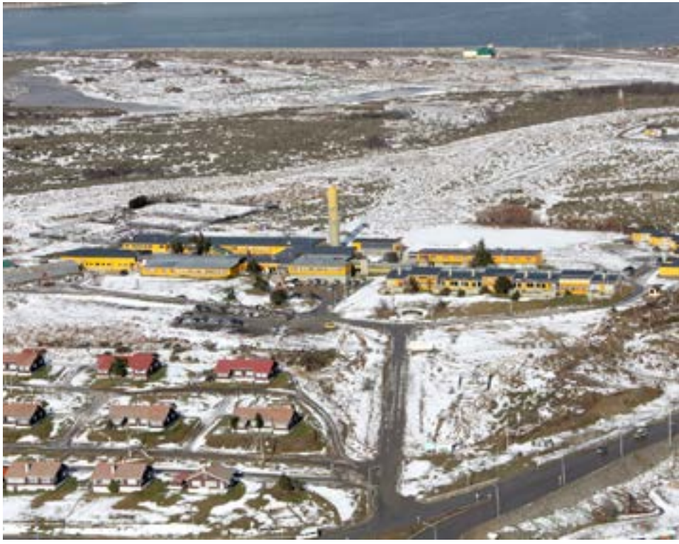
El CADIC hoy orgullo fueguino y del CONICET.

El 9 de abril de 1969 se creó el CADIC y, desde entonces, se destaca por una producción científica reconocida mundialmente y de gran relevancia local.