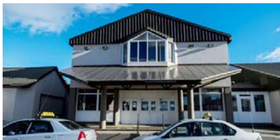
Una familia completa terminó hospitalizada tras intoxicarse con monóxido de carbono.

Toda la familia quedó en observaciones de modo preventivo, aunque se encontraban fuera de peligro.