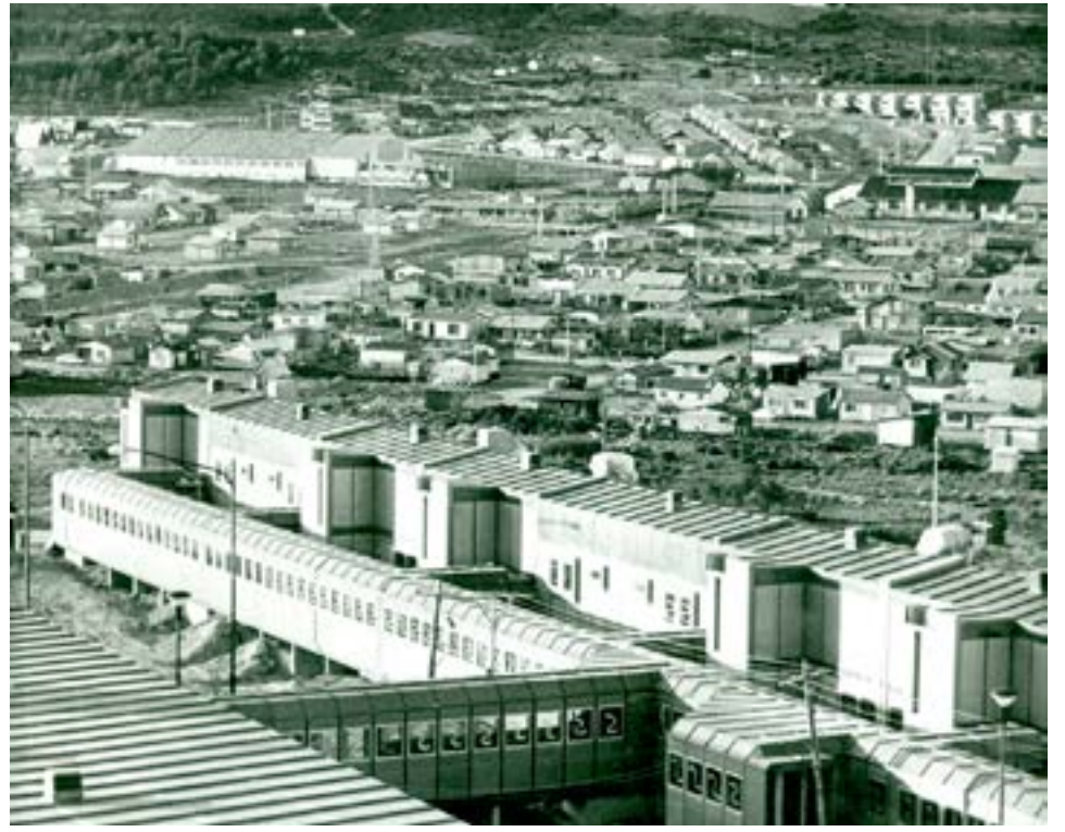
El CADIC en construcción (1981).

Ushuaia.- El Centro Austral de Investigaciones Científicas (CADIC - CONICET) integra múltiples áreas de conocimiento y disciplinas y es reconocido a nivel nacional e internacional por la excelencia e importancia de sus trabajos en el extremo austral de América del Sur y Antártida. Pero además, el Centro, es un actor clave en la vida de Tierra del Fuego ya que sus investigaciones son de gran relevancia para el conocimiento y la protección de los recursos naturales y el patrimonio fueguino, e inciden en procesos políticos, sociales y de tomas de decisión, entre otros.