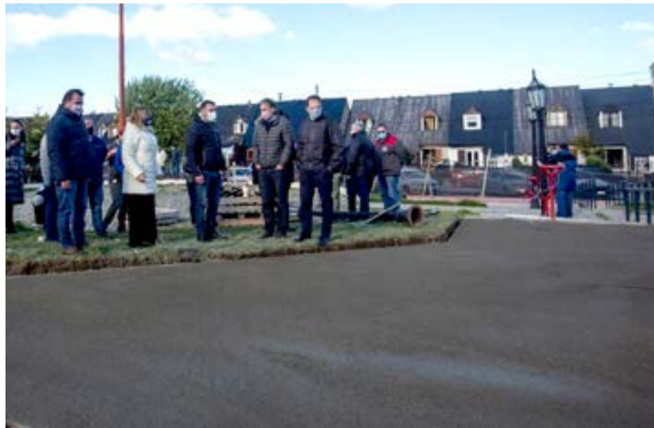
También recorrieron la emblemática plaza de los Bomberos de Ushuaia, ubicada en la intersección de las calles Don Bosco y Magallanes.