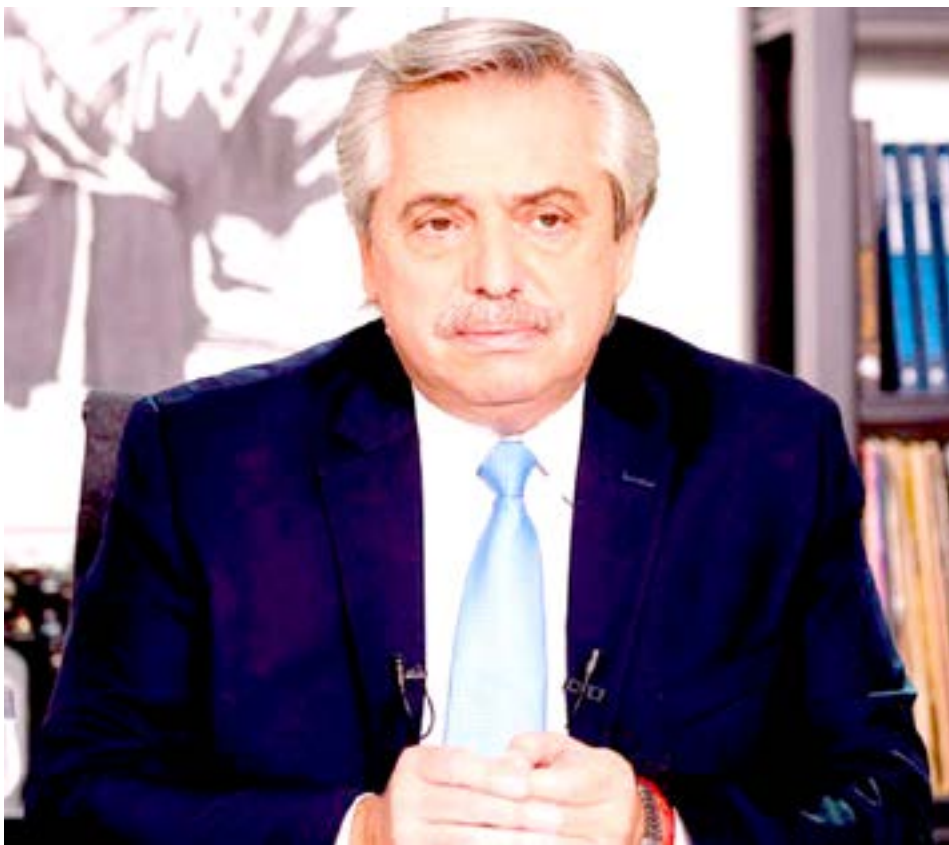
El presidente Alberto Fernández anunció un nuevo paquete de medidas restrictivas para enfrentar la segunda ola de coronavirus.

brindó desde la Quinta de Olivos, le envió un mensaje a los mandatarios provinciales que, según entiende, deberían haber tomado medidas restrictivas más allá del DNU de la semana pasada y no lo hicieron. "El resto de las jurisdicciones puede adherir a las medidas que estoy tomando hoy", indicó Fernández.