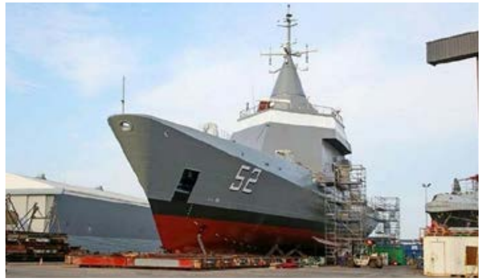
El ARA Piedra Buena es la segunda embarcación entregada por la empresa gala a la Armada Argentina.

Por su parte, el patrullero oceánico ARA