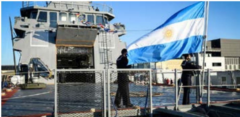
Arribada de la bandera argentina en la cubierta del ARA Piedrabuena.