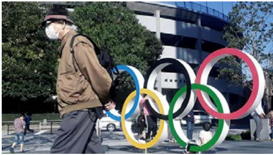
Los atípicos Juegos Olímpicos de Tokio se disputarán bajo estrictas normas en tierras asiáticas.

dising, la cartelería y todo lo preparado hace años) lanzó una serie de manuales con protocolos y recomendaciones para federaciones, cuerpos técnicos, atletas, prensa acreditada y TV. Todos los acto-