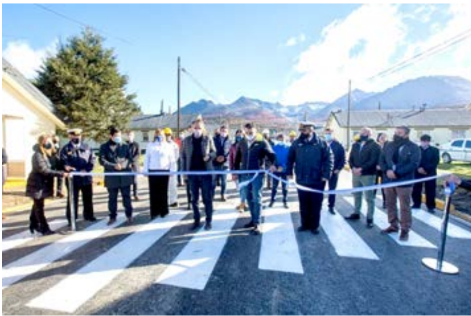
Tras el corte de cintas, el jefe del Ejecutivo capitalino Walter Vuoto señaló que “inauguramos una de las obras que llevamos adelante gracias al acompañamiento del ministro Katopodis y de todo su equipo”, y remarcó que “hay una decisión clara del Gobierno de Alberto y de Cristina para que podamos llevar adelante estos proyectos”.

En esa línea, valoró que “esta pandemia generó muchas complicaciones a los y las ushuaienses, y en este contexto, estuvo el Ministerio de Obras Públicas de la Nación para brindarnos un plan de obras y una reactivación económica en un momento muy difícil, en el que no se veían