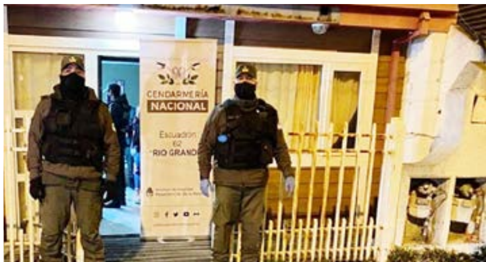
Gendarmería Nacional allanó un domicilio en el marco de una causa por presunta trata de personas.

Cabe recordar que las personas que sean víctimas del delito de trata o conozcan a alguien que lo sea, pueden denunciarlo anónimamente llamando al 145, la línea gratuita de la Oficina de Rescate y Acompañamiento a las Personas Damnificadas por el Delito de Trata que funciona las 24 horas en todo el país.