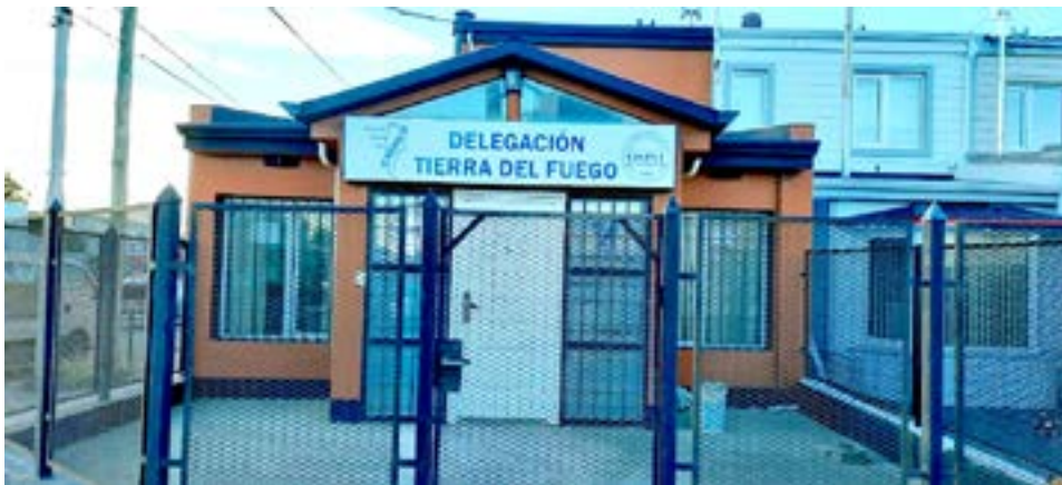
Los delegados exigen que algún representante de la empresa, con poder de decisión, venga desde Buenos Aires para rubricar un acuerdo.

Finalmente comentó que los trabajadores “están un poco más tranquilos, porque cobraron algún porcentaje del sueldo. Pero veremos el acuerdo que se pueda lograr, nosotros como siempre decimos que no tenemos responsabilidad por lo que sucedió por eso entendemos que no tenemos que pagar los platos rotos y debemos cobrar el 100%, porque las deficiencias fueron por responsabilidad de la empresa”, concluyó Calisaya.