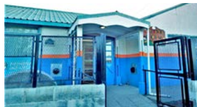
La misma comprende dos encuentros los días 12 y 26 de mayo, y se realizará a través de la plataforma virtual Zoom. Estará dirigida a personas que trabajen en centros de primera infancia, tanto públicos como privados.

Asimismo, Ponce precisó que “esta capacitación es una