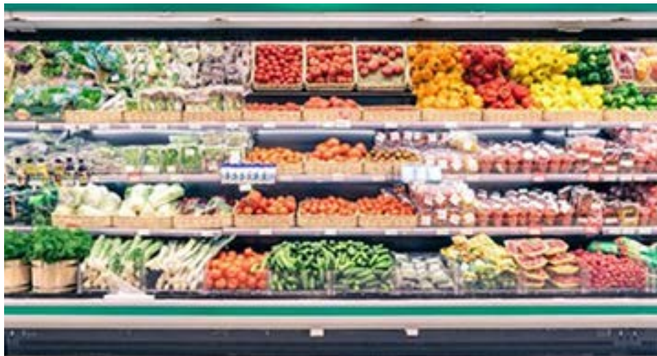
La fuerte emisión del 2020, producto del déficit fiscal, derivó en una suba constante de la inflación.

Para mayo, los primeros registros parecen algo más alentadores que en abril. Eco Go marcó una suba del 1,2% en alimentos y proyecta un incremento mensual del 4% en este rubro y y del 3,5% en su relevamiento general de precios. En tanto, Seido registró en la primera semana del mes una suba del 0,8% y del 3,8% como promedio en cuatro semanas, mientras que LCG también arrancó con el 0,8%. "Desacelera, pero sigue en niveles elevados, por encima del 3,5% mensual. Y el mes terminará entre el 3 y el 3,5 por ciento", concluyó su director, Guido Lorenzo.