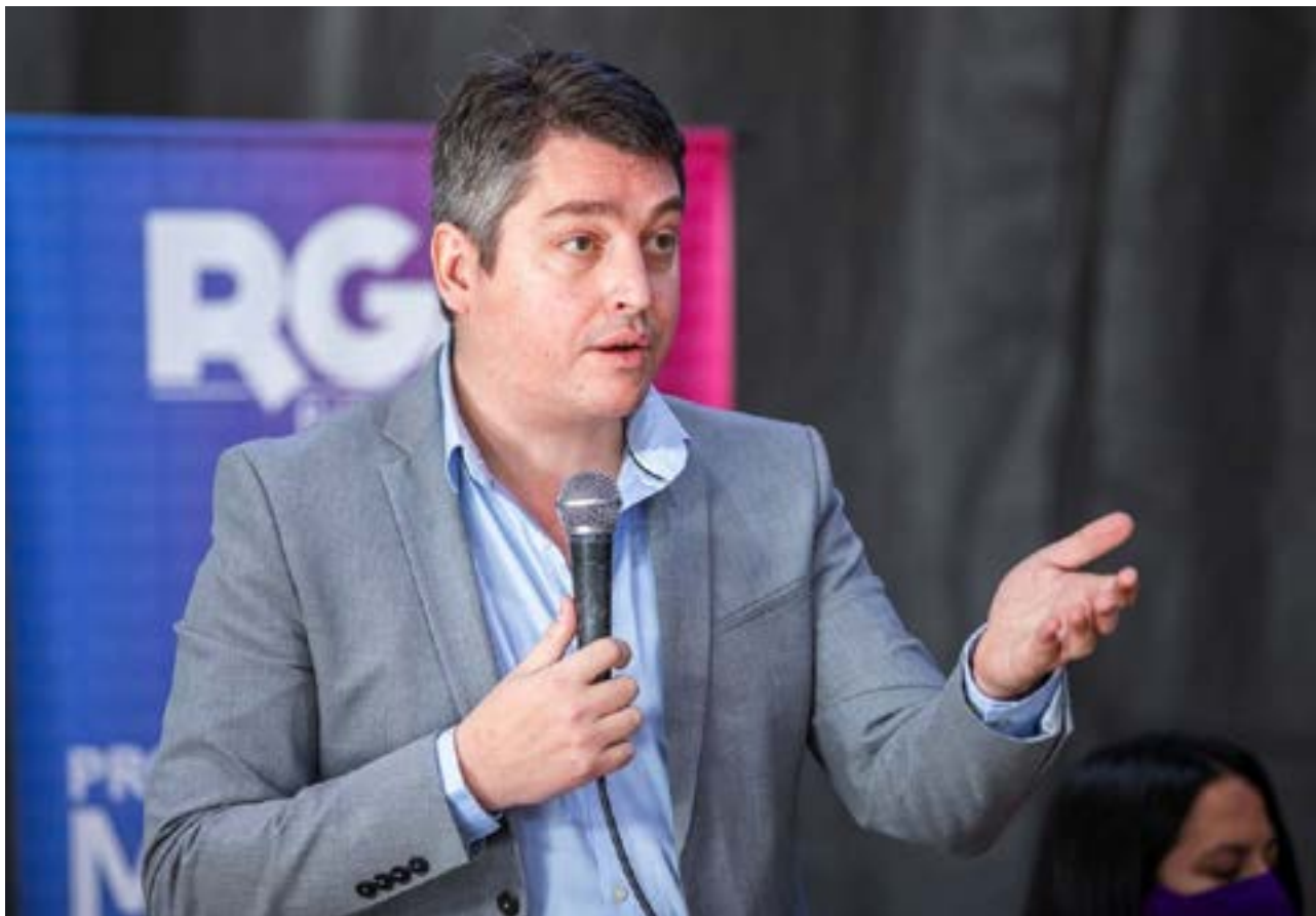
El intendente de Río Grande, referente de La Cámpora, anunció ayer en rueda de prensa que el gobierno nacional va a financiar íntegramente los gastos que demanden los festejos del Centenario de la ciudad, por un monto que supera los 50 millones de pesos.