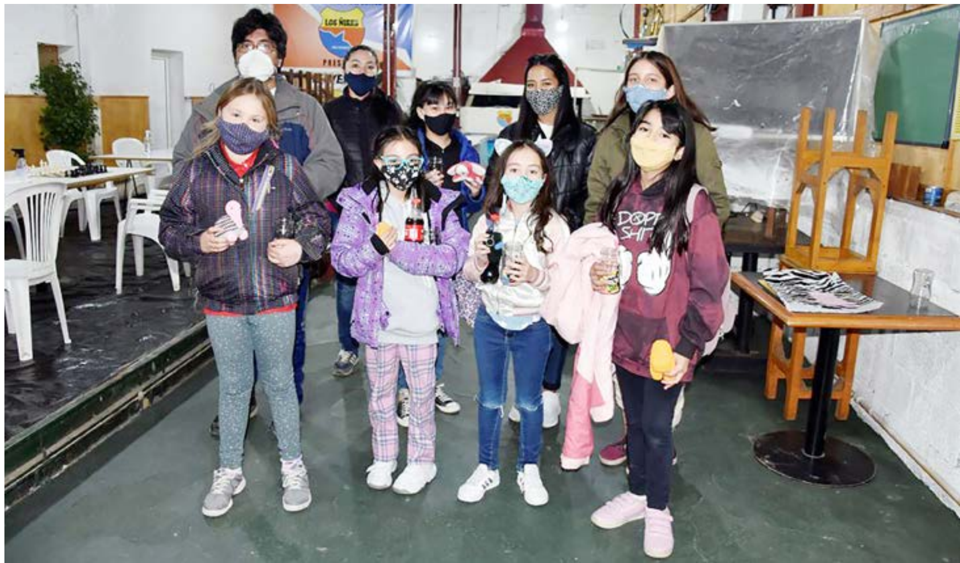
Las ocho juveniles ajedrecistas que intervinieron en el Torneo Base Marambio.