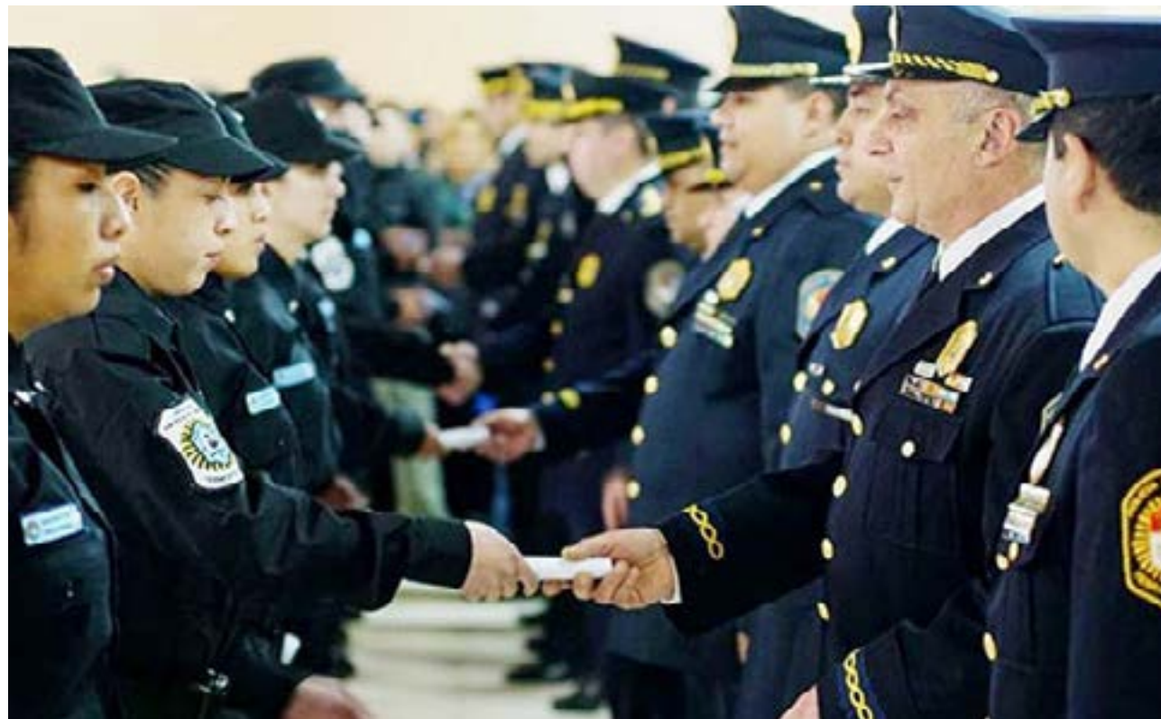
Generaciones de policías transcurrieron por la Institución policial fueguina.

Si es cierto que el destino de los hombres se inicia en su nacimiento para efectuar un camino que nadie sabe donde finaliza. Ser Policía significa haber nacido con un privilegio del destino para amar a la sociedad. Ser Policía también significa tener vocación. Aun desde la niñez, una fe inquebrantable en el bien hacia las personas. Superarse diariamente, sin pretender ser mejor que nadie. Sufrir y sacrificarse, llegando si es necesario hasta la misma puerta de la muerte. Brindar su vida para mantener intacto el orden, que constituye la piedra fundamental de la existencia de la Policía.