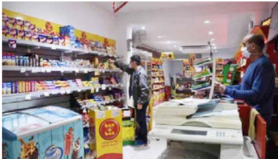
Los comerciantes hacen malabares para sobrevivir.

Acerca de cuál cree que es el escenario más probable para la plantilla de personal de su empresa de cara a los próximos tres meses, 61,3% prevé mantener sin cambios su cantidad de personal, 34,7% prevé una reducción y 4% prevé incorporar