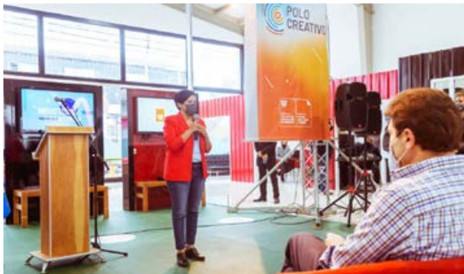
Cubino destacó que “es un momento muy especial para nuestra gestión de Gobierno, un hito más de los que pretendemos empezar a generar, siendo un puntapié inicial”.

La Ministra destacó que la estructura de este nuevo Polo en Ushuaia cuenta con un concepto abierto “con el fin de empezar a funcionar del mismo modo en que