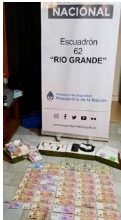
Elementos que fueron decomisados durante el procedimiento.

Durante las actividades investigativas, que demandaron varios meses, los fun-