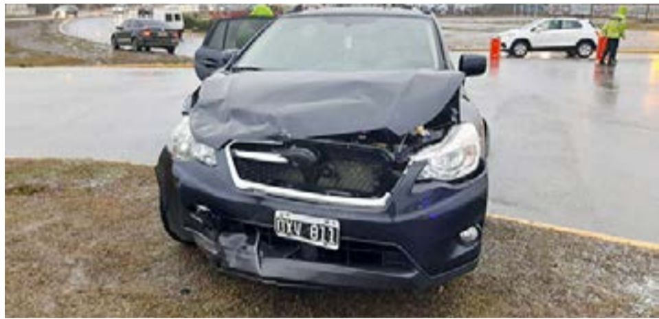
Imagen del otro vehículo involucrado.

Se solicitó la ambulancia quien procedió al traslado de la joven hacia el nosocomio local.