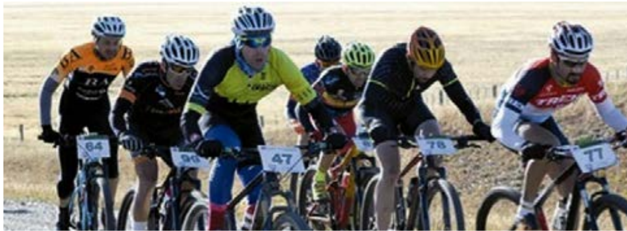
El Comité Operativo de Emergencias de Tierra del Fuego resolvió ayer suspender las competencias de estas tres disciplinas por un lapso de 30 días debido a reiterados inconvenientes en el "incumplimiento de protocolos".

Turdó indicó finalmente que la suspensión de las actividades "en principio es por 30 días y siempre teniendo en cuenta la situación sanitaria en el momento".