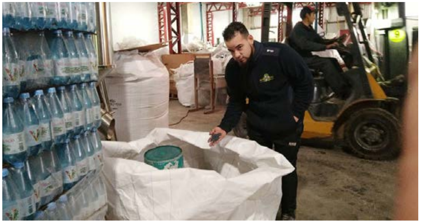
El ‘pelletizado’ se procesa en sus colores que se clasifica previamente.

Ante la consulta, comentó que parte del material, dependiendo de su naturaleza, se lleva al continente (Buenos Aires, Córdoba o Rosario) o al exterior del país,