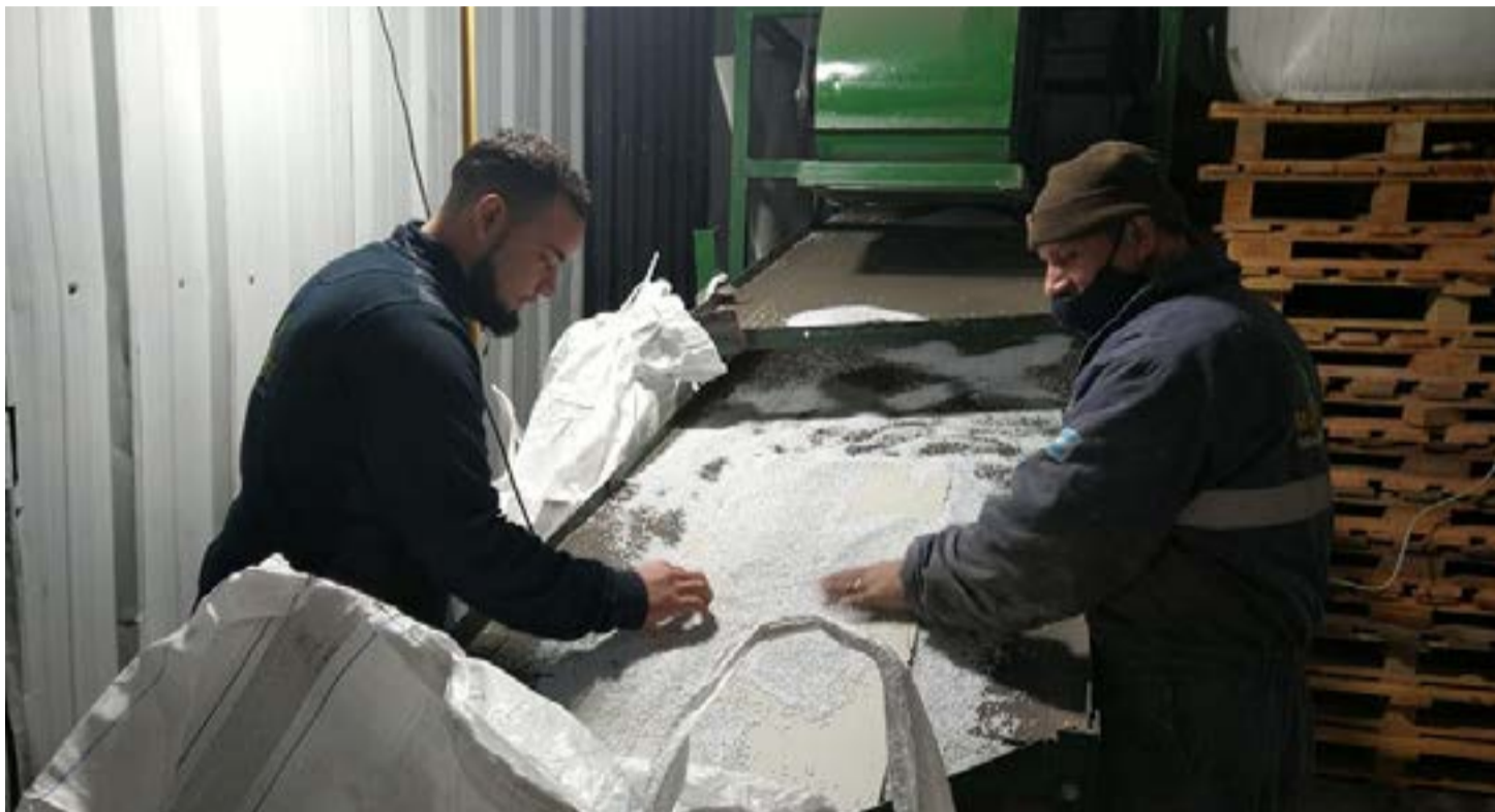
El proceso de 'pelletizado' de los plásticos.

Mak-Plast está ubicada en 25 de Mayo y Combate de Montevideo, en el Parque Industrial de la ciudad. “Actualmente tenemos 25 empleados más mi grupo familiar, es decir, somos 30 familias las que estamos trabajando dentro de esta empresa familiar. Mis cinco hijos trabajan