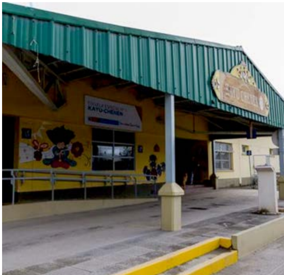
Integrantes de la comunidad educativa de la Escuela Especial 1 dieron a conocer un texto, donde denuncian una serie de problemas edilicios.

Para pasar a relatar que “En nuestra Escuela funcionan los siguientes servicios: S.E.E.P. (servicio de educación especial primaria en el turno mañana), el T.F.O. (trayectos formativos ocupacionales en el turno tarde), el turno vespertino “Extensión Educativa de Jóvenes y Adultos con Discapacidad”, S.E.T. (servicio de educación temprana en los tres turnos), S.A.I. (servicio de apoyo a la inclusión en los tres niveles del sistema educativo y sus modalidades, en los tres turnos),