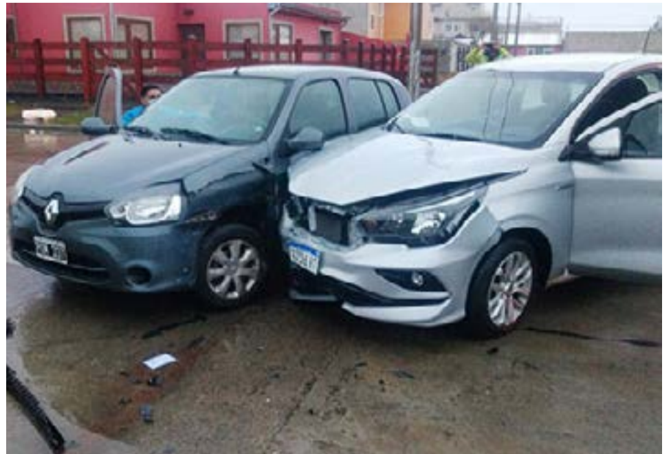
Colisión en calles Resistencia y Posadas, dejó como saldo a una mujer hospitalizada.