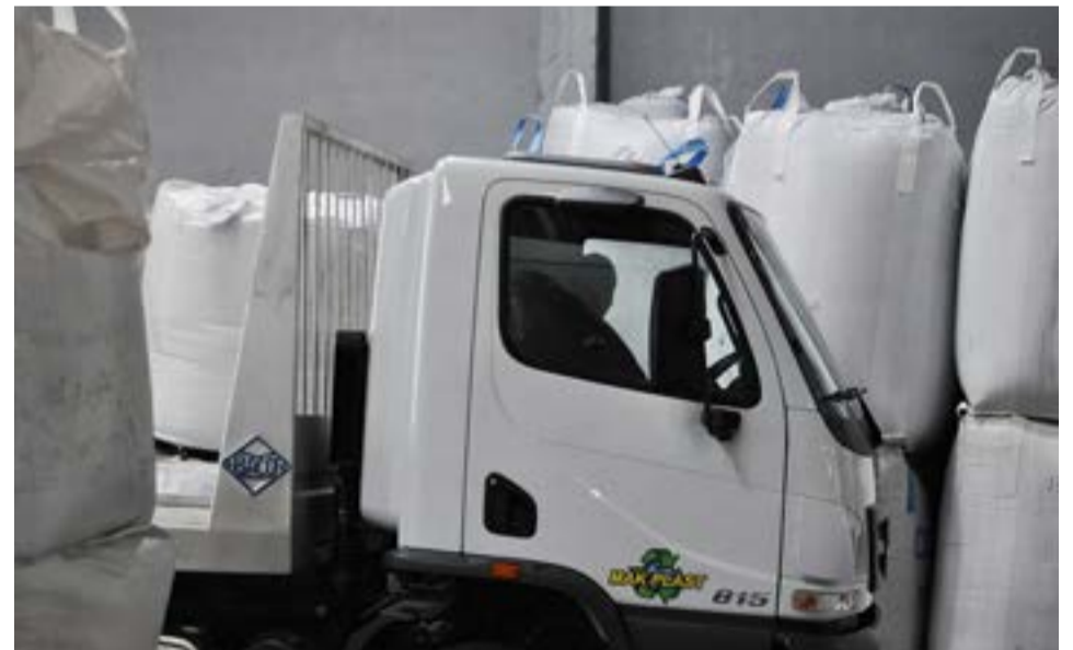
Es incesante el ingreso y egreso de camiones.

El reciclado químico consiste en un proceso químico por el cual se vuelven