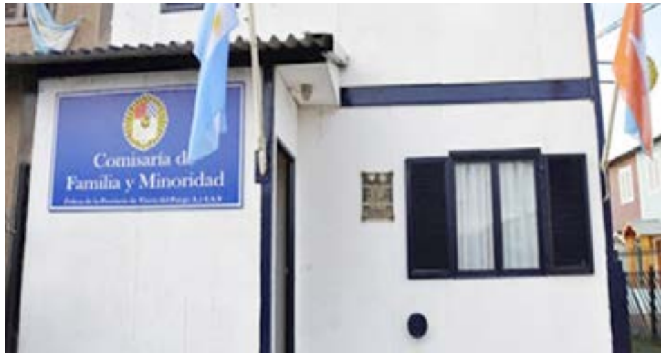
Una efectivo policial llamó a una víctima de abuso para preguntarle el domicilio del imputado.

La denuncia por abuso sexual en la infancia fue radicada en noviembre del 2019. Un año y 5 meses después, el 5 de mayo de este año concretamente, llegó el procesamiento del sujeto, al que ahora, la policía no puede encontrar para notificarlo.