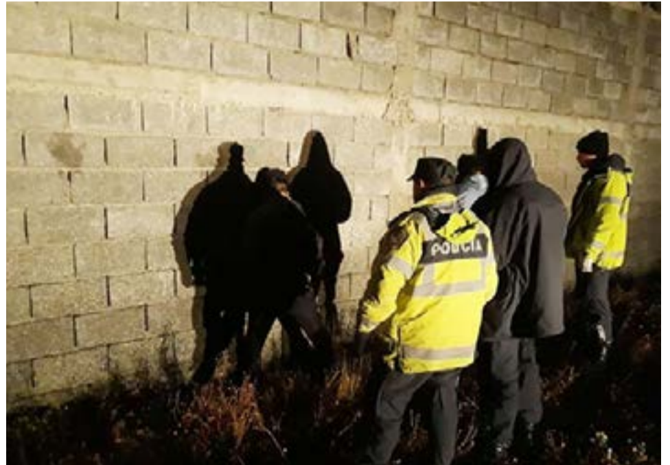
Los detenidos de los operativos antinarcóticos “Aniversario” y “Estilo Blanco” seguirán detenidos.