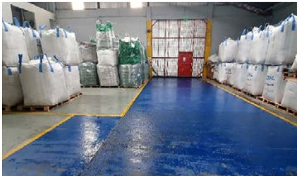
Una imagen del interior de la planta en Río Grande.

Aseguró que “absolutamente todo lo que consumimos en nuestro hogar, es reciclable, falta mucho todavía para que tomemos real conciencia y de tomar el hábito de clasificar en nuestro hogar, si bien