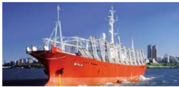
Las comodidades y estado sanitario de los buques pesqueros no los torna aptos para convalecencias a bordo.

En marzo 2020 en declaraciones realizadas ante Infobae, representantes de los prácticos de los ríos De La Plata y Paraná manifestaron su preocupación por la total falta de protocolos para ejercer su trabajo a bordo de buques procedentes de distintas partes del mundo. Vale recordar que el práctico o piloto es el profesional argentino que toma contacto en primer término con tripulaciones de buques extranjeros cuando estos llegan aguas restringidas de jurisdicción nacional y necesitan ser guiados con seguridad por los distintos canales de navegación hasta llegar a puerto.