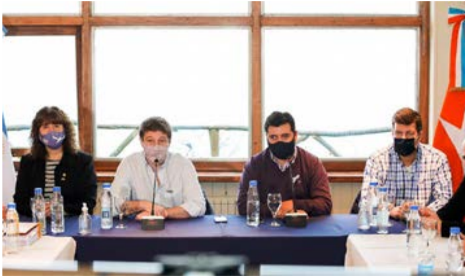
El Mandatario Provincial Gustavo Melella manifestó que “este anuncio de la pavimentación de la Ruta N° 1 que rodea el Lago Fagnano, el Lago Khami, es muy esperado por los vecinos y vecinas tanto de Tolhuin como de toda la Provincia”.

Por último, indicó que “sin dudas, nos llena de alegría este gran esfuerzo que hacemos todos para que la inversión real de los recursos del Estado siempre lleguen a cada rincón del país y a nuestra gente por sobre todas las cosas”.