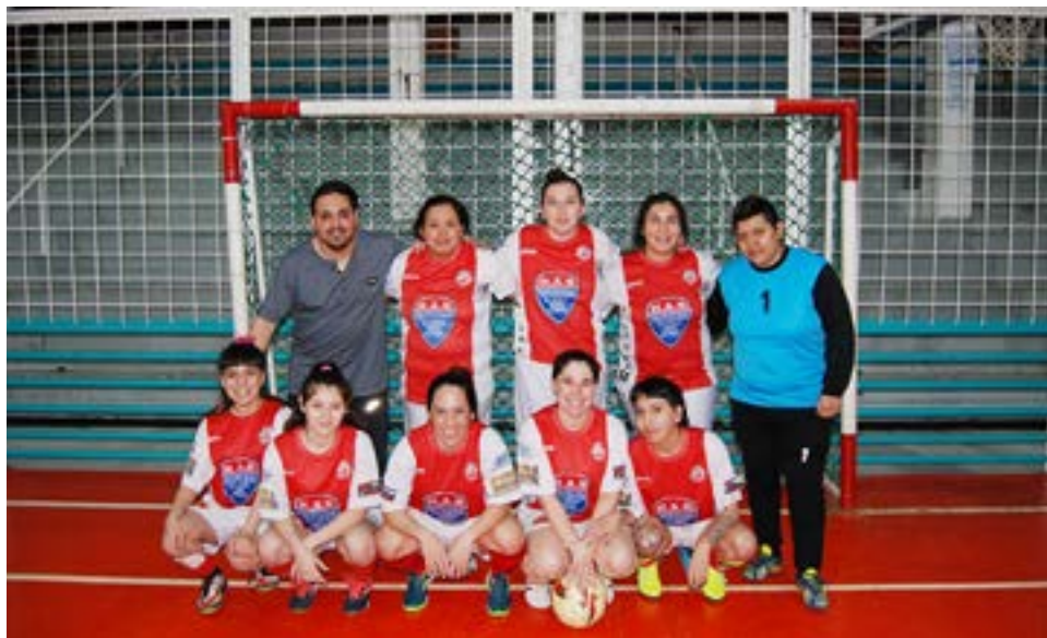
El equipo de Deportivo Sur, categoría primera división.

Sábado 5 Gimnasio Centro Deportivo Municipal Partido 1 – categoría primera división – inicio: 12.00 horas Saque inicial: Sol Naciente Sol Naciente 4 Libertad 2 Partido 2 – categoría primera división – inicio: 13.00 horas Saque inicial: Spordivas Estrellas del Sur 1 Spordivas 8 Partido 3 – categoría primera división – inicio: 14.00 horas Saque inicial: Liga del Norte Liga del Norte 2 Hor-Val 0 Partido 4 – categoría primera división – inicio: 15.00 horas Saque inicial: Juventus Juventus 0 O'Higgins 13