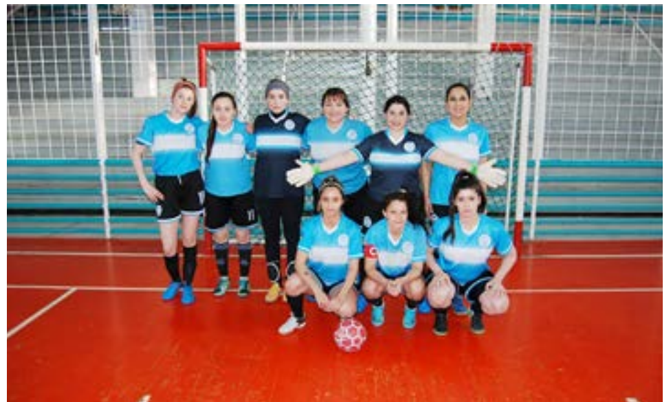
El equipo de Margen Sur, categoría primera división.

Partido 6 – categoría primera división – inicio: 17.00 horas Saque inicial: New-Man Unión Austral 4 Deportivo Sur 1 Libre: Real Madrid