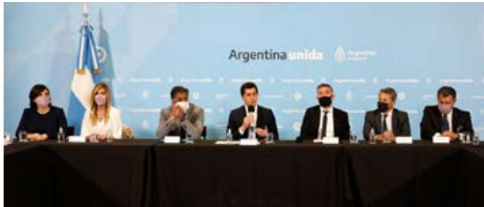
En un contexto marcado por la pandemia, desde el Gobierno adelantaron que el escrutinio provisorio de las PASO se dará a conocer dos horas más tarde de lo habitual.

La funcionaria lo adelantó a la salida de un encuentro realizado en el Salón de los Pueblos Originarios de la Casa Rosada con las principales empresas y cámaras de medios del país, que fue convocado días antes de los comicios por el Gobierno y la Justicia Electoral para “ratificar el compromiso ético” frente a los comicios, y donde estuvieron presentes el ministro del Interior, Eduardo “Wado” de Pedro y