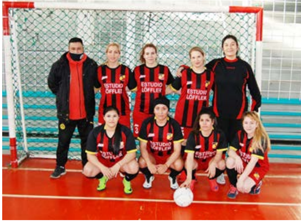
El equipo de New-Man, categoría primera división.

Torneo "Apertura 2021" que tiene como protagonistas a quince equipos de la primera división femenina, donde el domingo 5 de septiembre desde las 12.00 horas en el Centro Deportivo Municipal 'Reverendo Padre Forgacs', se disputó al Décimo Quinta Fecha del certamen que tiene como punteros principales a los equipos de O'Higgins, Fusión y Racing respectivamente; donde se han enfrenado en diversas ocasiones, y demostraron en el campo de juego un muy buen nivel de competitividad, e instando de esta manera a que los restantes combinados que participan tomaran su posicionamiento y adquirieran el mayor roce posible y logran colocarse en los primeros puestos de la tabla de posiciones para así dirimir quien asciende y como se conformaran de forma definitiva las divisiones para enfrentar el clausura, y así llegar a finales