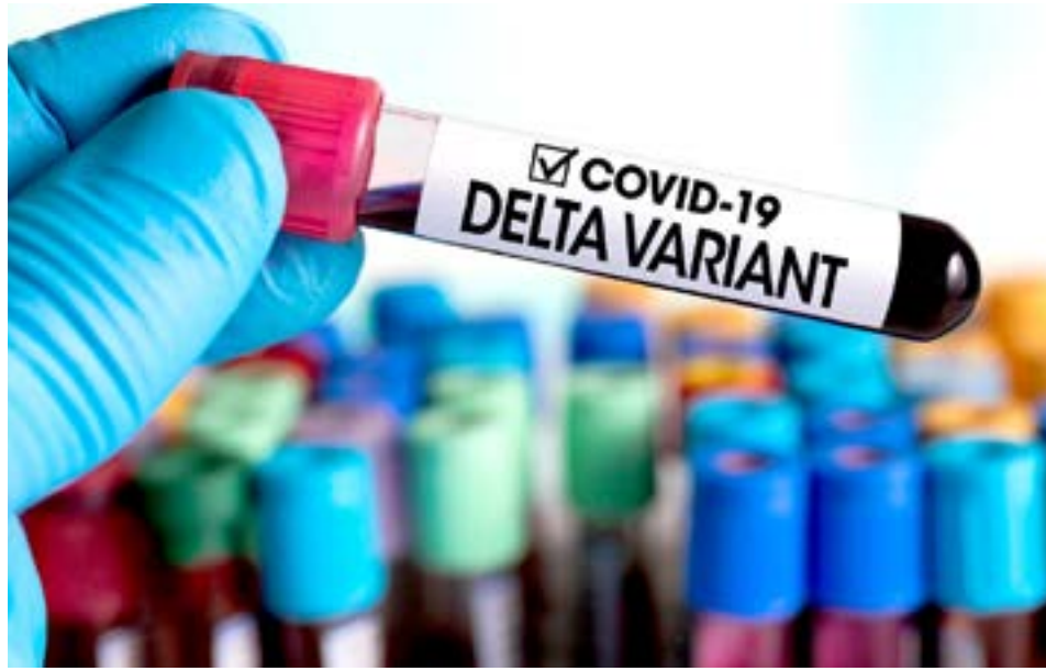
La variante Delta del coronavirus, identificada por primera vez en India, se ha propagado rápidamente alrededor del mundo.

ciudad. Siguen bajando los casos y es una curva que está estable. La situación epidemiológica es similar a la del país”. “Sabemos que están por llegar dosis de Sputnik II y venimos con una campaña de vacunación muy buena y con el 85% de