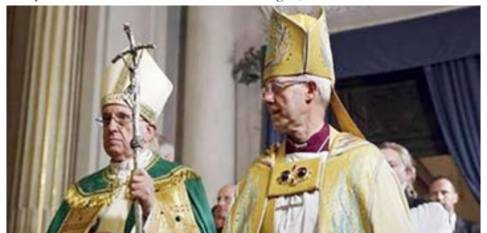
El papa Francisco y el arzobispo de Canterbury Justin Welby en la iglesia de San Gregorio al Celio en Roma.

gistrado este año, aunque solo por un pequeño margen con respecto a las dos temperaturas más altas anteriores de junio-agosto, dijeron científicos de la Unión Europea el martes, y los grupos ecologistas han pedido que se posponga la COP26. El papa Francisco tiene previsto participar en la COP26, que se celebrará entre el 31 de octubre y el 12 de noviembre en la localidad escocesa de Glasgow, en Reino Unido.