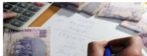
Los plazos fijos UVA, que están indexados por inflación, registraron en agosto una caída mensual del 1,6% en términos reales, según el Informe Monetario publicado por el Banco Central (BCRA) este martes.

"Esta moderación se dio, en un contexto en el que el diferencial entre el rendimiento de un depósito en UVA y uno en pesos se tornó prácticamente nulo, dada la menor inflación esperada para los próximos meses", explicó el BCRA en su informe.