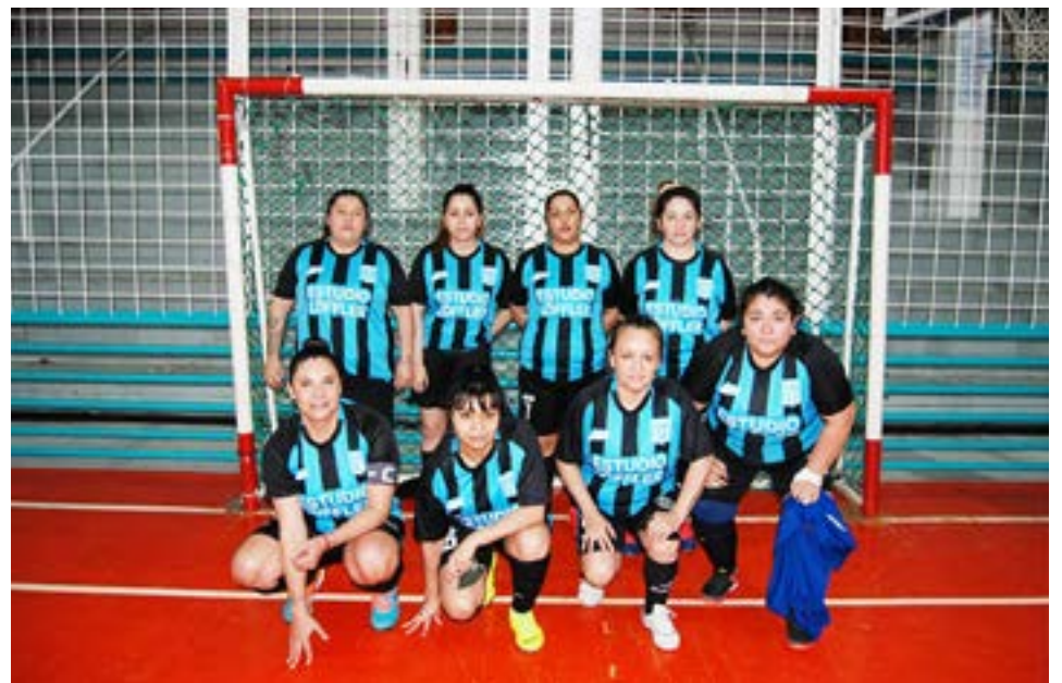
El equipo de Racing, categoría primera división.

Partido 5 – categoría primera división – inicio: 16.00 horas Saque inicial: Margen Sur Margen Sur 1 Racing 4 Partido 6 – categoría primera división – inicio: 17.00 horas Saque inicial: New-Man Unión Austral 4 Deportivo Sur 1 Libre: Real Madrid Partido 7 – categoría primera división – inicio: 18.00 horas Saque inicial: Deportivo Sur Fusión 2 New-Man 0