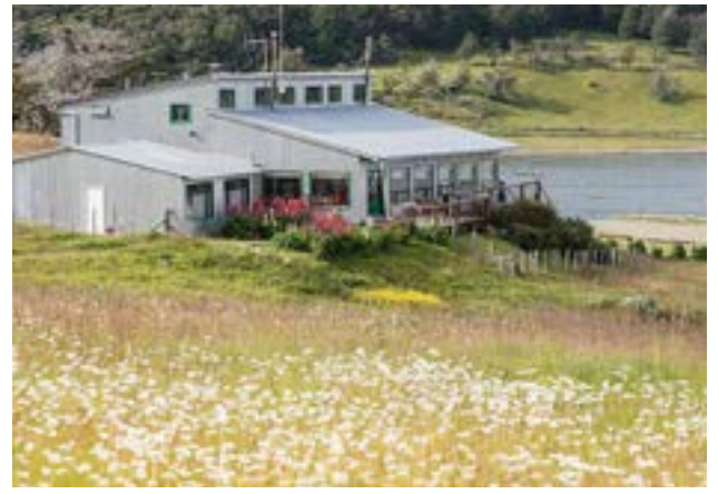
La mítica Estancia Harberton está compuesta por numerosas casas; hoy muchas son alojamientos para turistas que se acercan a conocer el museo y a hacer recorridos.