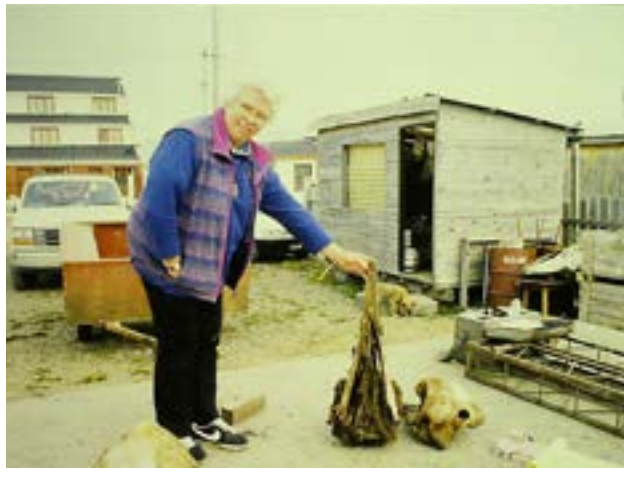
Prosser pasó gran parte de sus 50 años en la Argentina recolectando huesos de mamíferos marinos e investigándolos.