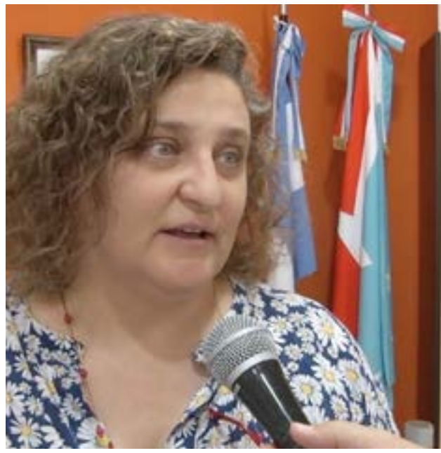
La ministra de Producción y Ambiente, Sonia Castiglione, dio a conocer por Radio Nacional Ushuaia algunos detalles del relevamiento de pymes en la provincia, que “teníamos planificado cuando iniciamos la gestión, porque se venía realizando desde 2012, 2014, 2016, y se debía actualizar cada dos años.

Consultada acerca de si los comercios han pedido refinanciación de los préstamos tomados, respondió que “no todavía, lo que pasó el año pasado es que sacamos la línea en principio con seis meses de gracia. Luego de charlas con los distintos sectores recogimos la necesidad de ampliar el período de gracia, porque la pandemia se extendió, no se reactivó el turismo, y ampliamos el plazo a 12 meses. Algunos solicitaron ajustarse a la nueva normativa y se amplió para esos casos. Ahora está venciendo el plazo y están empezando a pagar el crédito. No sé si a futuro alguien va a solicitar refinanciación pero lo que estamos observando es que no se está ha-