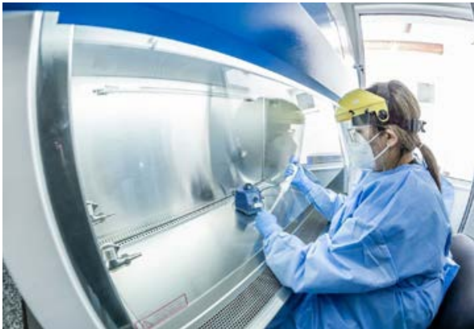
Bajaron notablemente en Tierra del Fuego los contagios por COVID e internados y solamente quedan solo 74 casos activos.

Asimismo, ante la aparición de síntomas se solicita llamar al 107 y mantenerse aislado.