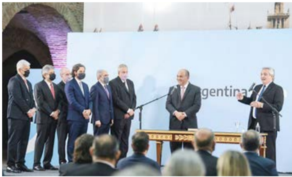
Alberto Fernández tomó juramento a sus nuevos ministros: “La solución no está en dividirnos”.

sido. Debatimos de cara a la gente, nuestras diferencias siempre tienen un sentido único que es superar la instancia y encaminarnos a un momento mejor. Nunca los debates me han afectado o preocupado, soy presidente el PJ, me preocupa más un movimiento político silenciado, que no discute, que uno que reflexiona”. Asimismo, ratificó que el Gobierno está preparando anuncios para recuperar al