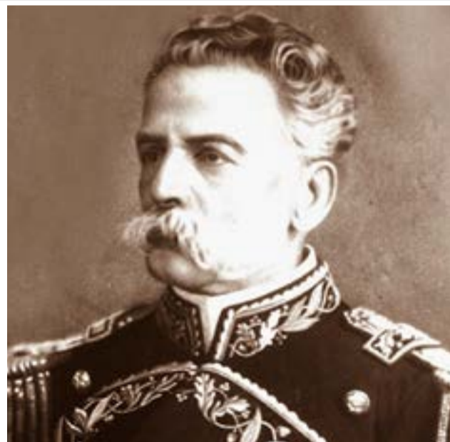
El Comodoro Augusto Lasserre, un gran desconocido para la mayoría de fueguinos que hasta a veces le escriben mal su apellido con una sola "s". Fundó Ushuaia e inventó un bote salvavidas insumergible que fue probado con éxito y patentado en nuestro país, Estados Unidos de Norteamérica y Francia.

Luego de la reunión entre Lasserre y Bridges, el Pabellón nacional fue izado para siempre, marcando un hecho determinante de soberanía argentina en esas tierras. Posteriormente, realizó tareas de balizamiento para mejorar la navegación en la zona y construyó varios edificios públicos, entre ellos, la Subprefectura -antigua denominación de la base naval de la Armada Argentina-, constituyéndose estas primeras acciones de soberanía como evento fundacional de la ciudad de Ushuaia.