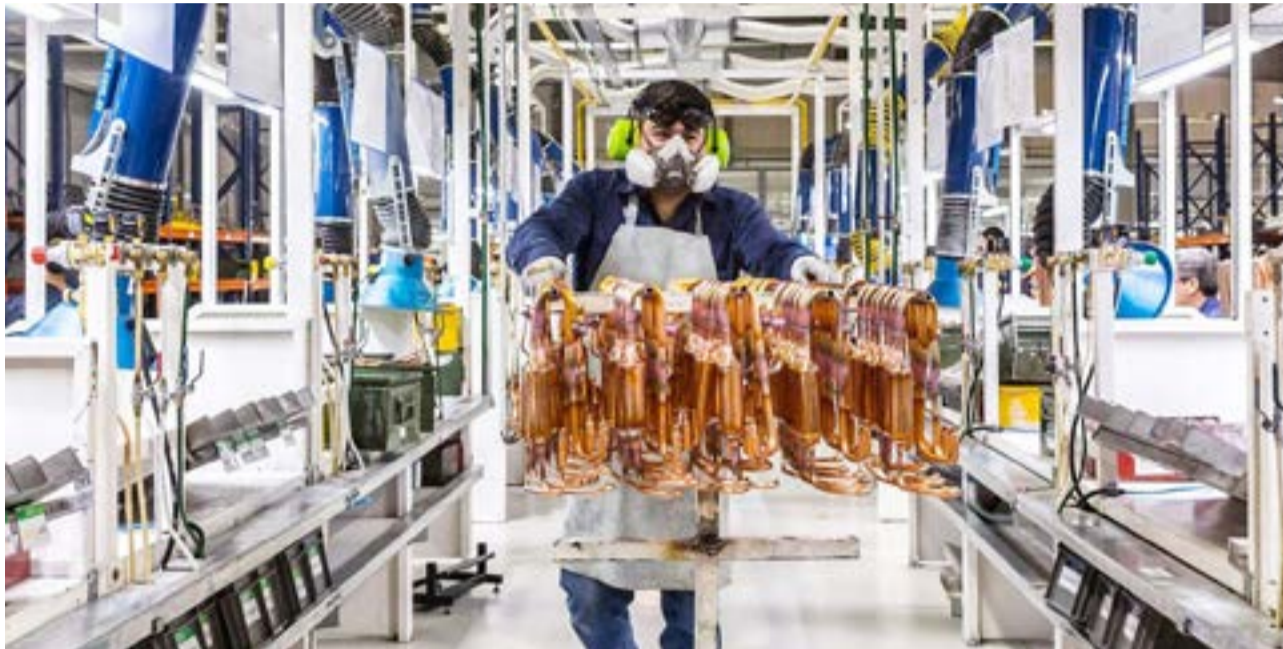
El proyecto de Ley de Presupuesto que el Gobierno nacional envió al Congreso Nacional indaga sobre cuánto costarán los regímenes de promoción a la Industria del Conocimiento y Polo Tecnológico de Tierra del Fuego.