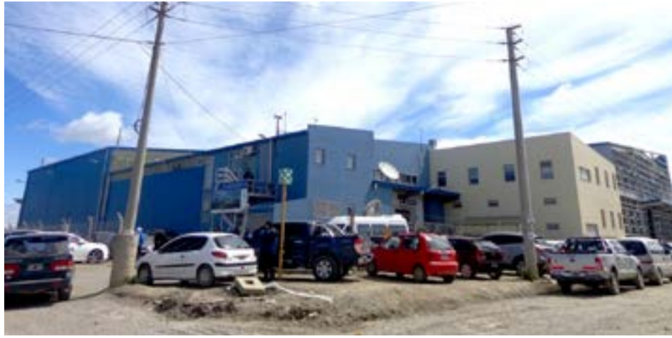
La empresa Brightstar, parte del Grupo Mirgor, pretende adelantar las vacaciones de su personal.

“La fábrica que supo ser modelo en Río Grande hoy se encuentra en una especie de limbo que no permite saber a ciencia cierta qué ocurrirá a futuro: fue adquirida por el Grupo Mirgor en una operación objetada por el Gobierno Nacional y la principal marca que fabricaba (LG) decidió retirarse del mercado argentino”,