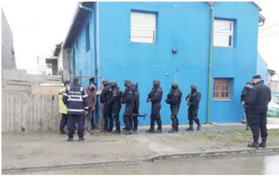
La justicia dispuso ayer el allanamiento del domicilio de Scalabrini Ortiz al 1.000 con resultado positivo.

Rápidamente dio intervención al 101 iniciándose junto a la Sección Robos y Hur-