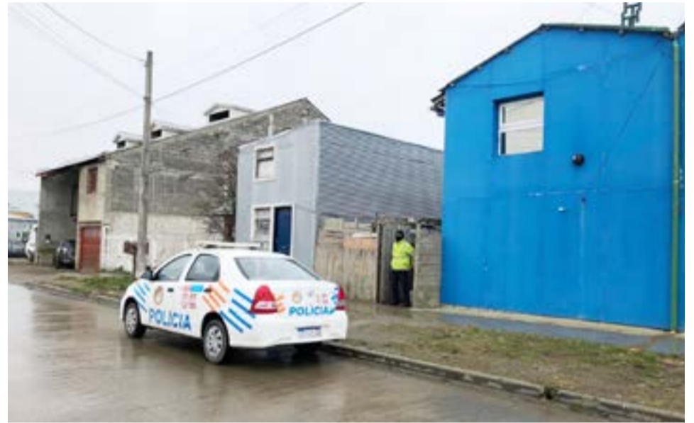
Asaltaron otro kiosco a punta de pistola. Hay dos sospechosos.

Posterior a ello, personal de Servicios Especiales localizó a dos masculinos con las características aportadas, que transitaban