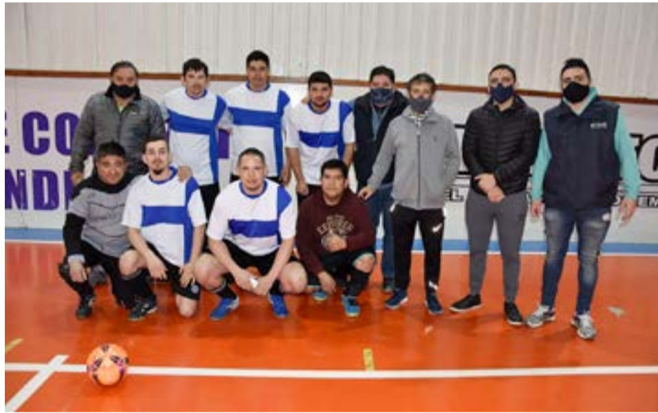
El equipo de La Costa, categoría libre.

del público a las gradas de acuerdo a las disposiciones vigentes que estableció el (COE) con respecto a la capacidad de las instalaciones deportiva; la estructura del gimnasio nuevamente vibró al unísono reviviendo el fervor de todos los presentes al disfrutar cada encuentro realizado