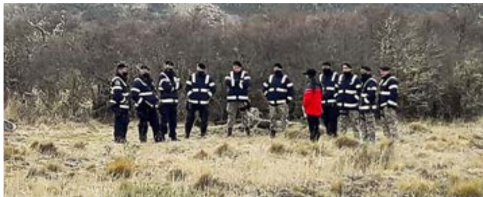
“Estaban ofreciendo tierras, que se estaba alambrando en un sector donde hay un camping y estaba listo para vender”.

Al referirse al operativo, contó que “lo