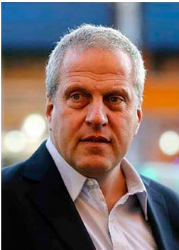
El Frente de Todos Universitario (FDTU) salió a la palestra a apoyar la designación de Jaime Perczyk como ministro de Educación.

Finalmente destacaron que el sistema universitario público Argentino “tiene en el nuevo ministro un trabajador que comprende e interpreta las necesidades de la educación. Su capacidad de trabajo y diálogo nos permitirá seguir proyectando el crecimiento equitativo de la educación en nuestra Argentina”.