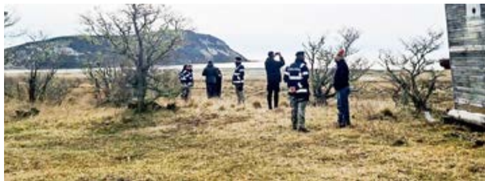
Autoridades del Gobierno de la Provincia junto a la Policía de la Provincia, realizaron un operativo de desarme en la zona de San Pablo.

que hicimos fue levantar todos los alambrados y cercos que no estaban autorizados y los colocamos en el depósito del INFUETUR”.