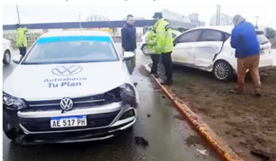
Violento accidente sin heridos en Islas Malvinas y Almagre.

Aunque los conductores no resultaron lesionados, ambas unidades presentaban importantes daños materiales.