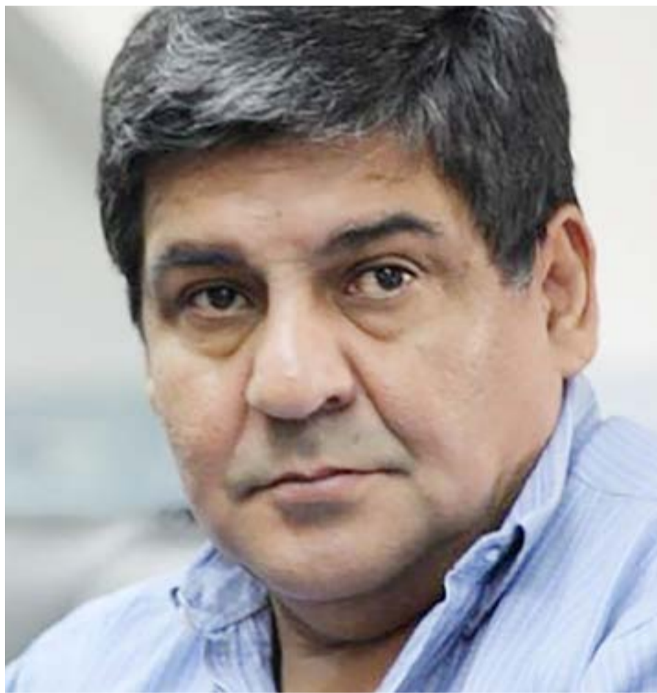
El ex gobernador y congresal del PJ cuestionó por Radio Provincia la falta de convocatoria de las autoridades del partido, de consenso previo al momento de designar a los candidatos, porque terminaron “impuestos”, y atribuyó la derrota a esta situación.

“Cuando se toman decisiones políticas, en este caso de las autoridades que fueron electas por los afiliados del partido, uno espera que alguna vez se convoque o se diga por qué se tomó esa decisión. Yo no hablo por los aliados sino por mi partido,