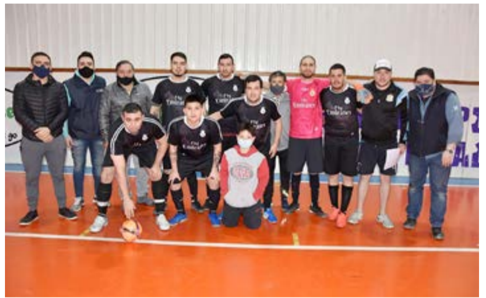
El equipo de Los Rebeldes, categoría libre.

después de más de un año y medio de inactividad, y volver a pisar el balón y que las ‘populares’ alienten con pasión el partido, realmente no tiene precio ya que los presentes para cada cotejo pudieron deleitarse como hacía tiempo no se vivía; pero no así con las expectativas que a los cuatro vientos el ‘Destructor de Redes’ pregonó, en fin, faltó algo ahí, creo que.....sí, más entrenamiento y menos promesas, eso sí, convirtió su gol prometido, pero fue con gusto a poco ya que una vieja lesión no le permitió lucirse, y bue, se está discutiendo su transferencia, ‘tranqui’ muchachos, habrá sorpresas, esto recién comienza.