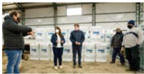
La Ministra Castillo comentó al respecto que “hemos iniciado el acopio de estos elementos con los primeros camiones que arribaron transportando este equipamiento”.

Río Grande.- Se trata de cocinas, termotanques y caloramas, además de cañerías