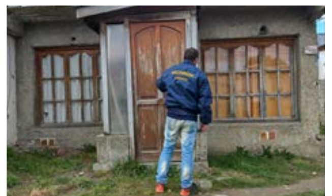
La Justicia Federal ordenó el allanamiento del domicilio sito en calle Cilawaia al 1000 donde se secuestraron elementos de interés para la investigación.

El día viernes la detenida fue indagada en el Juzgado Federal, tras lo cual recuperó la libertad quedando imputada en una causa por comercio de estupefacientes.