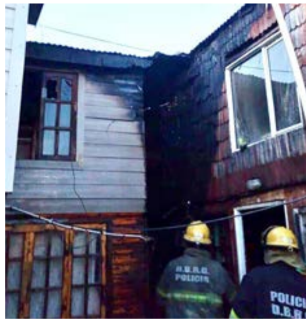
Seis personas fueron evacuadas durante un incendio en pasaje Chamorro al 1700 y dos viviendas se vieron afectadas.

Dos efectivos fueron trasladados al nosocomio local preventivamente por inhalación de humo.