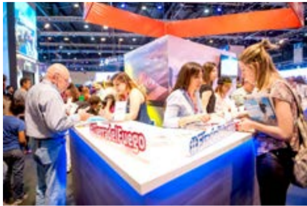
El InFueTur tendrá un espacio dentro del stand del Ente Oficial de Turismo Patagonia Argentina, donde se mostrará de manera integrada la oferta del destino.

“Invitamos a representar a Tierra del Fuego a prestadores turísticos, agencias y referentes de alojamientos, en esta importante feria que es una de las más esperada por el turismo mundial en Latinoamérica y representa