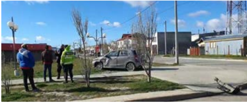
Producto de un choque entre dos rodados, un niño de 11 meses trasladado al Hospital.

De igual modo, se solicitó preventivamente la ambulancia a raíz de que el niño no estaba en la butaca de seguridad.