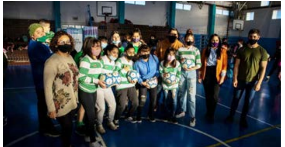
Entregaron material Deportivo a Clubes