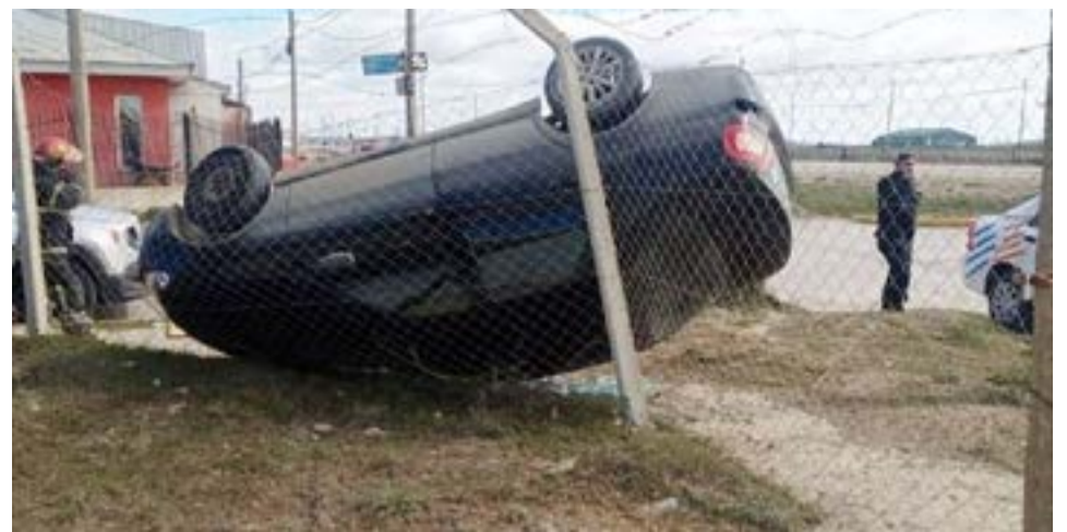
Joven de 19 años resultó herido en un vuelco en la esquina de calle Echelaine y Cabot.