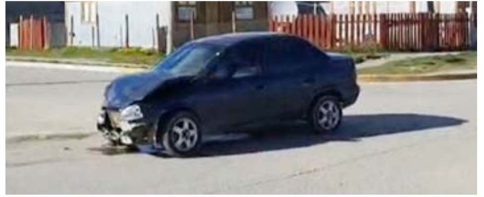
El siniestro vial se registró en Gobernador Paz y Estrada

División Narcocriminalidad y Delitos Federales