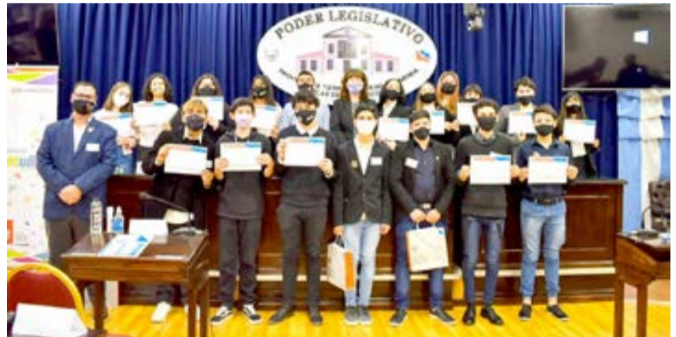
La sesión consistió en la lectura y votación por unanimidad del Documento Provincial creado por medio del diálogo y debate entre las y los jóvenes estudiantes de la provincia.