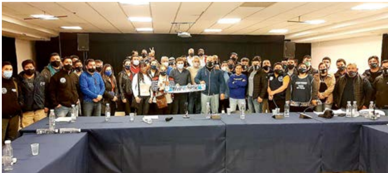
Un amplio abanico de representantes de organizaciones sindicales acompañó el anuncio del presidente Alberto Fernández, respecto de la prórroga del subrégimen de promoción industrial.