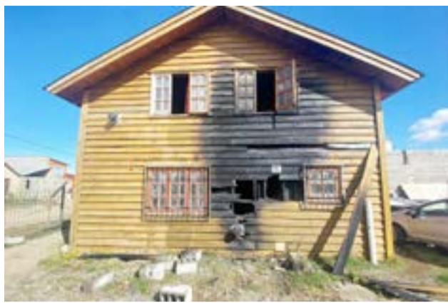
Recalentamiento del tiraje de un calefactor ocasionó incendio en una casa ubicada en calle Chorlo Ceniciento 38.