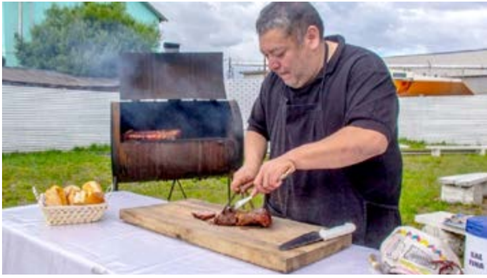
El Centro Cultural, Social y Político "Nueva Argentina" abre las inscripciones para el Primer Concurso de Asado en Chulengo.