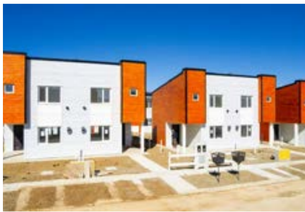
Desde la Asociación Trabajadores del Estado aseguraron que varias de las viviendas del barrio que se inauguró en Río Grande presentan inconvenientes.

diversos problemas que se suscitaron, recordando que "son 120 viviendas, los reclamos vienen a través de ATE pero le pedimos a los vecinos que se comuniquen con el área técnica que por ahí es más directo", indicó finalmente Hernández.