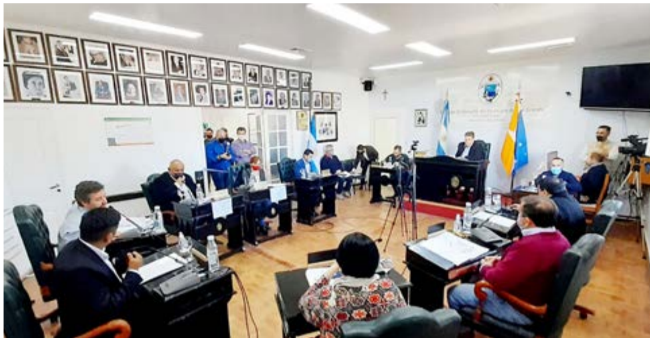
Por unanimidad, el Concejo aprobó el Presupuesto Municipal 2022.