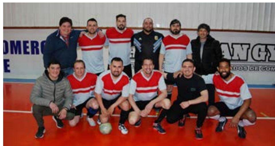
El equipo de Caiquén, categoría libre.