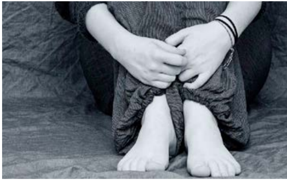
Hombre habría abusado de su hija de 3 años. La denuncia se realizó en el 2019.

Río Grande.- "La realicé porque tenía muchos testimonios de ella, me preocupó bastante porque tenía actitudes que no eran propias de su edad y lo que el pro-