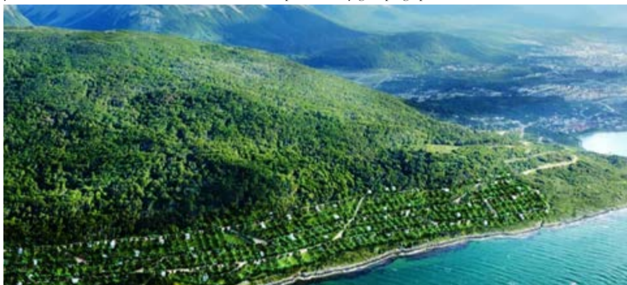
Costa Susana tiene 280 hectáreas de las cuales se urbanizarán 57. En la primera etapa ya terminada de 220 lotes, hay 13 casas construidas y otras 30 en camino.

Para los vecinos del Parque Nacional Tierra del Fuego, el Monte Susana es un referente del área que debía tratarse con respeto y superar las expectativas ecológicas en caso de urbanizarse. Con ese desafío en mente, el desarrollador reunió a distintas ONGs locales para que los ayudaran a replantar en la ciudad las extracciones enteras de tierra que se removieron en la construcción.