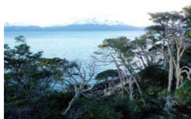
Las impresionantes vistas al Canal de Beagle linderas a una frondosa vegetación son las perlas del fin del mundo.

Análisis topográficos permitieron que todos los lotes puedan contar con vista a la naturaleza sin construc-