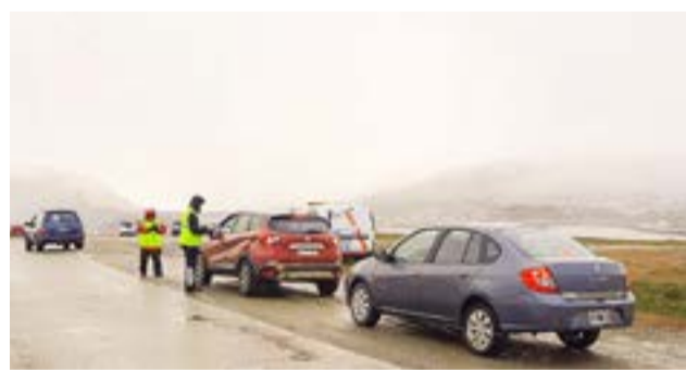
Además de este tipo de controles se realizan campañas y acciones para reducir la incidencia del consumo de alcohol frente a los siniestros viales la cual es la principal causa de muerte en menores de 35 años.

Tierra del Fuego se encuentra dentro de las provincias que posee tolerancia cero en el ejido urbano de los 3 municipios a la hora de conducir y se enmarca entre las jurisdicciones que menor incidencia del alcohol al volante registró en los últimos controles, con 0,3% de