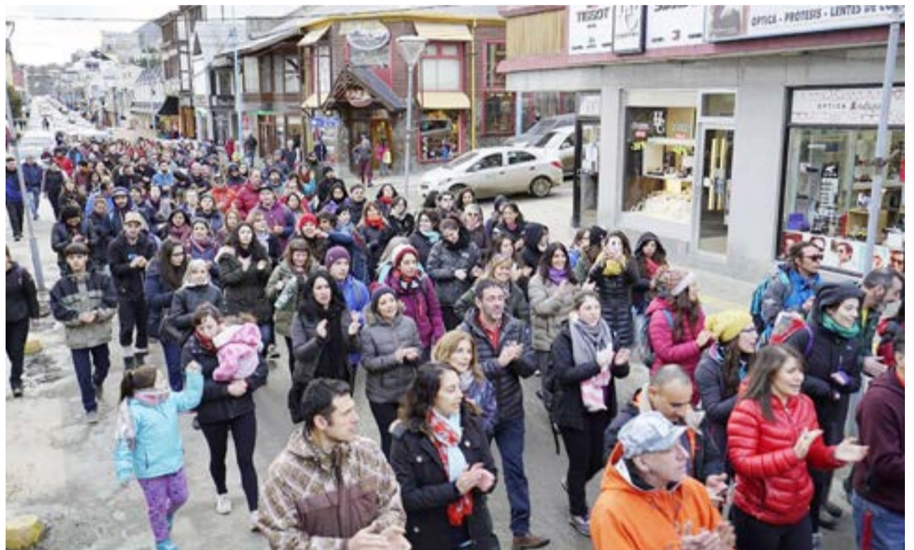
En el 2019 hubo una gran movilización en Ushuaia en defensa del bosque fueguino.

Los cambios realizados y propuestos para la actual revisión, se concentran mayoritariamente en los Ejidos Municipales, como es lógico, el sector más dinámico en cuanto a su expansión, que es imprescindible actualizar con regularidad (Casi una década es mucho tiempo para la dinámica de nuestras ciudades), la incorporación de la Isla de los Estados y mejoras en la calidad cartográfica general. Aquellos realizados sobre