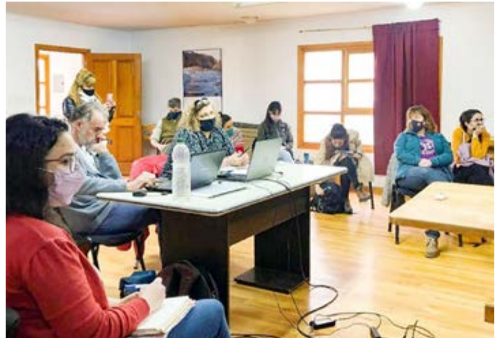
Comunidad Indígena Rafaela Ishton exige participación en el Consejo Consultivo de Bosques Nativos.

Para que no queden dudas de cómo se debe realizar la consulta, en 2021, el Estado Nacional creó un manual para la aplicación de este derecho en todo el ámbito nacional https://www.argentina.gob.ar/sites/default/files/ma-