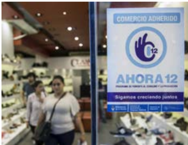
Entre otros, se incorporaron productos de cocina y un "kit para la instalación domiciliar del servicio de agua potable y cloacas".

Según lo dispuesto, podrán ser adquiridos mediante el financiamiento previsto los siguientes bienes de pro-