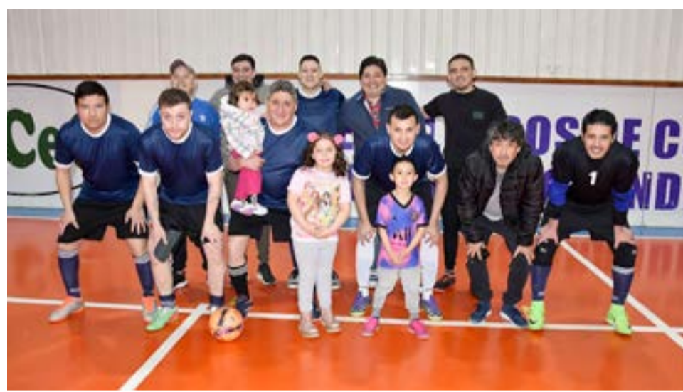
El equipo de Seinco, categoría libre.

Río Grande.- Con las últimas instancias que ya se están desarrollando en el Complejo Deportivo del (C.E.C.) con respecto al Torneo de Futsal "Amistad 2021" que el Centro de Empleados de Comercio realiza cada año para todos sus afiliados, el domingo 24 de octubre desde las 14.00 horas se enfrentaron ocho equipos en la categoría libre para estos Cuartos de Finales que fueron realmente electrizantes y que dirimieron en el campo de juego a los afortunados equipos que el próximo fin de semana disputaran las esperadas Finales, y quienes serán los que se coronaran Campeonas absolutos del Torneo "Amistad 2021", ya que la organización promete un espectáculo futbolero sin precedentes y que tendrá como condimento especial para esta ocasión a las fervientes 'populares' ya que pronostican hacer temblar las instalaciones deportivas, que tul.