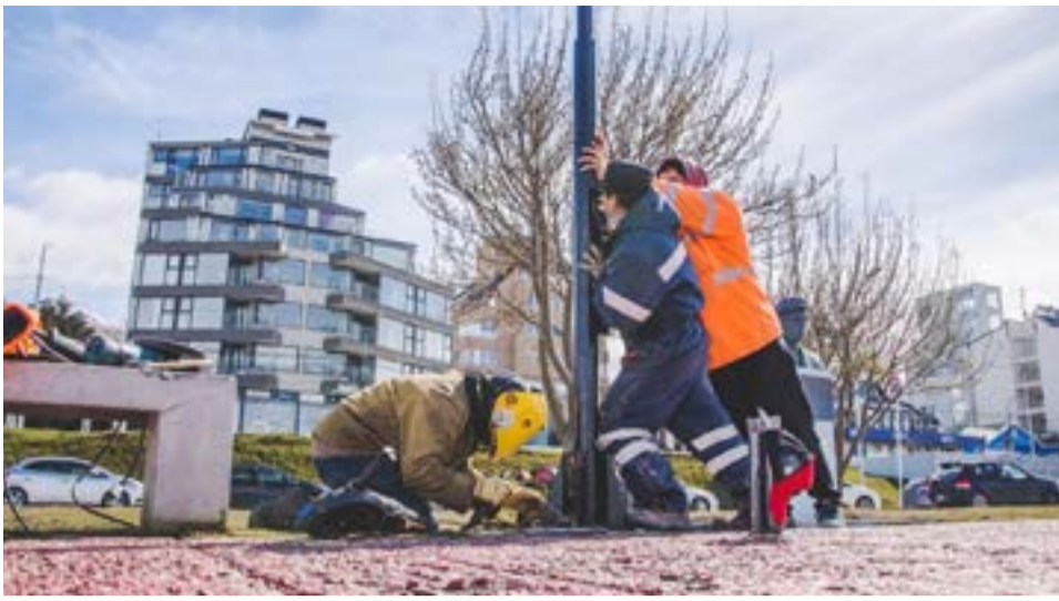
Avanzan los trabajos de colocación de luminarias LED en el Paseo Costero de Ushuaia.

Además, destacó que “ya se están realizando las últimas bases para la colocación de columnas en la calle principal de la urbanización y nos encontramos en la etapa final del tendido de cableado aéreo en todos los sectores” indicó la funcionaria municipal.