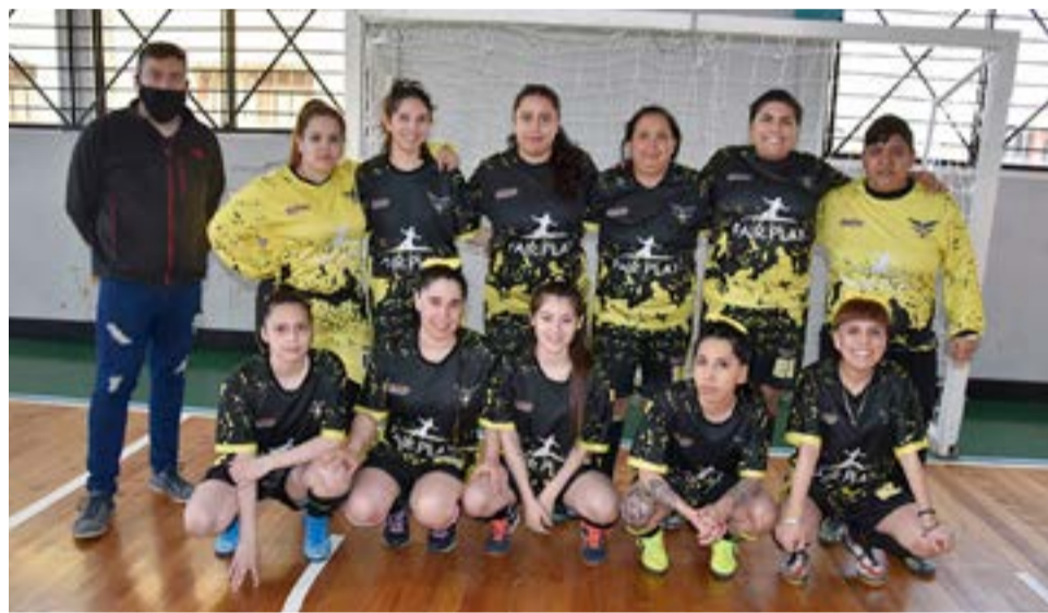
El equipo de Deportivo Sur, categoría primera división.

prepararse para el extenso calendario que tendrá la asociación en el año 2022, y así también poder evaluar el nivel de juego y en qué condiciones físicas se encuentran las chicas para este gran desafío futbolístico con compromisos muy importantes. Detallando a continuación los resultados de la tercera fecha y las tablas de posiciones.