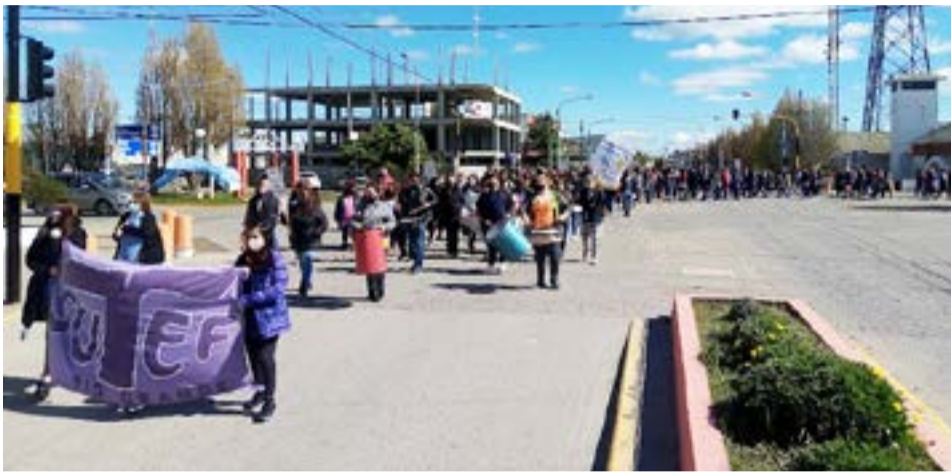
En las tres ciudades de la provincia se realizó la desobligación docente, acompañada con manifestaciones.