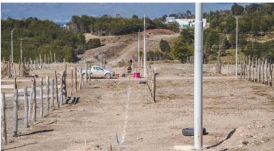
La Municipalidad de Ushuaia a través de la Secretaría de Planificación e Inversión Pública continúa con los trabajos en el tendido de los servicios para la urbanización de San Martín.

de las columnas y el conjunto mismo fue completamente producido en los talleres del Municipio como así también el montaje en el lugar fue realizado por personal del área”.