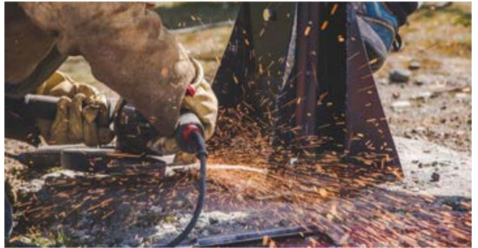
“Tanto las bases, el sistema de montaje, el sistema rebatible, las estructuras de las columnas y el conjunto mismo fue completamente producido en los talleres del Municipio como así también el montaje en el lugar fue realizado por personal del área”.

Asimismo, el funcionario municipal detalló que “vamos a seguir trabajando a lo largo de noviembre y diciembre para que tanto los turistas como los vecinos y vecinas puedan disfrutar de todos los espacios verdes que Ushuaia tiene para ofrecer”.