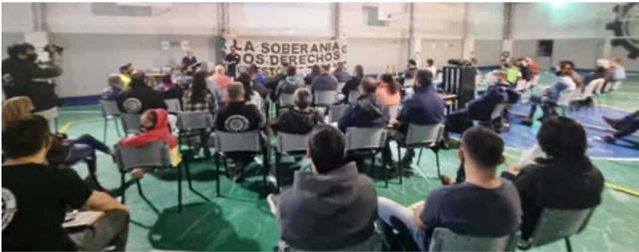
La UOM Seccional Río Grande realizó un homenaje, para quienes en octubre de 2018 unieron Río Grande con Ushuaia atravesando la Cordillera a pie, para reclamar por el subrégimen de promoción industrial.

Martínez también se refirió a la reciente prórroga del subrégimen, asegurando que también fue resultado de la caminata que realizaron en 2018. Repasó la decisión del gobierno de no recibirlos como esperaban y valoró el acompañamiento que recibieron, para concretar el camino entre Río Grande y Ushuaia. Para concluir ratificó la decisión de seguir reclamando “por cada uno de nuestros derechos, por los puestos de trabajo, por la industria nacional, por la soberanía, por la defensa de seguir viviendo como queremos en la provincia de Tierra del Fuego”.