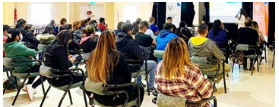
Gobierno provincial culminó con las jornadas de capacitación sobre cooperativismo que se llevaron a cabo en las tres ciudades fueguinas.

Finalmente, dijo que "dado la demanda y el interés por parte de la comunidad, se va a volver a realizar otro encuentro antes de fin de año".