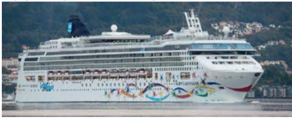
Por primera vez un buque de estas dimensiones hará esta cantidad de viajes a la Antártida en una sola temporada y además esta Compañía realizará prácticamente todos sus recambios en Buenos Aires, en lugar de repartirlos entre Buenos Aires y Valparaíso y/o San Antonio.

En el año 2007, Apollo Management compró el 50% del paquete accionario y en el año 2013 la Compañía comenzó a cotizar en la bolsa de Nueva York. En 2014, NCL adquirió las Compañías Oceania y Regent Seven Seas, convirtiéndose en el tercer grupo más grande de cruceros del mundo.