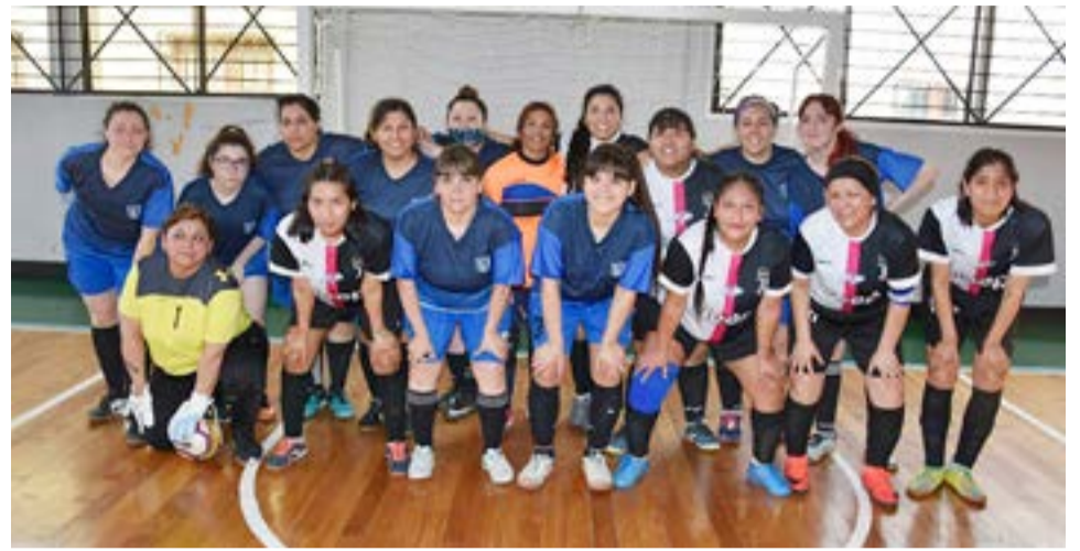
Los equipos de A.A.T.E.D.Y.C., categoría primera división.

Sol Naciente 0 Hor-Val3 Partido 2 – categoría primera división zona: "B" – inicio: 13.00 horas Saque inicial: Real Madrid Real Madrid 2 Atlético Libertad 4 Partido 3 – categoría primera división zona: "A" – inicio: 14.00 horas Saque inicial: O'Higgins O'Higgins 4 New-Man 0 Partido 4 – categoría primera división zona: "C" – inicio: 15.00 horas Saque inicial: Deportivo Tigre Real Azul 1 Deportivo