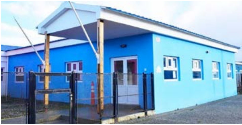
El Hogar de Día 'Lazos de Amor' de Río Grande.