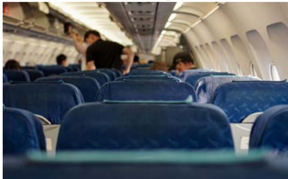
Los turistas extranjeros que visiten la Argentina podrán abrir una caja de ahorro.

Las acreditaciones de moneda extranjera en esta “Caja de ahorro para turistas”, de-