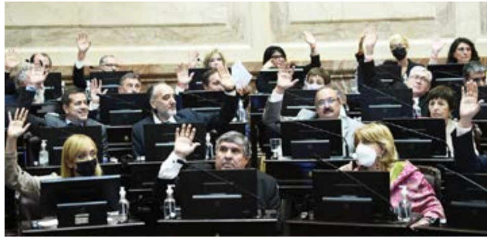
La reforma también establece que el mínimo no imponible se actualizará automáticamente en diciembre de cada año. La última modificación a la ley se había votado en 2018.

Por su parte, la senadora del PRO Laura Rodríguez Machado dijo que su espacio votaría a favor a pesar de que la rebaja es “escasa y no alcanza”. También planteó un contraste con la reforma que el gobierno anterior hizo en 2018. “Es importante pensar cómo se ha empobrecido la