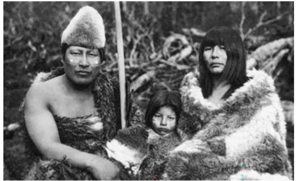
Los selk'nam, habitantes originarios de Tierra del Fuego, en el extremo sur de América, fueron dados por extintos.

Junto con la Corporación Selk'nam Chile,