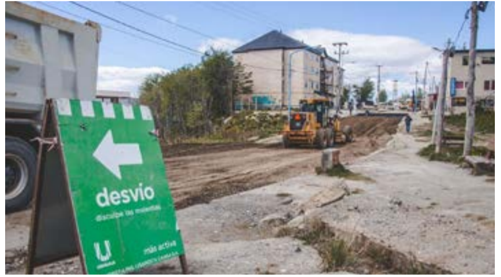
“En la calle Albatros ya terminamos el pedraplen y estamos colocando base anticongelante, todo el trabajo necesario que se realiza previamente a la pavimentación”, dijo Muñiz Siccardi.

“En la calle Albatros ya terminamos el pedraplen y estamos colocando base anticongelante, todo el trabajo necesario que se realiza previamente a la pavimen-