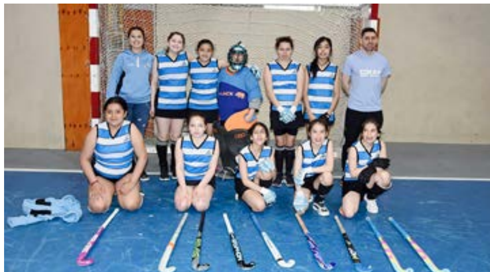
El equipo de CIMAH, categoría sub-12.

los clubes provinciales, realmente es sorprendente ver la cantidad de jóvenes con serias intenciones en sumarse al proyecto y llevar al Hockey provincial a lo más alto en la Patagonia, que como te comenté anteriormente con respecto a la selección de primera damas y caballeros que obtuvieron el segundo puesto en Caleta Olivia, y digo y creo que la Federación hoy está pasado uno de los mejores momentos deportivos en los últimos años, y eso realmente nos gratifica mucho como comisión directiva, realmente muy conformes por los resultados". "Para cerrar