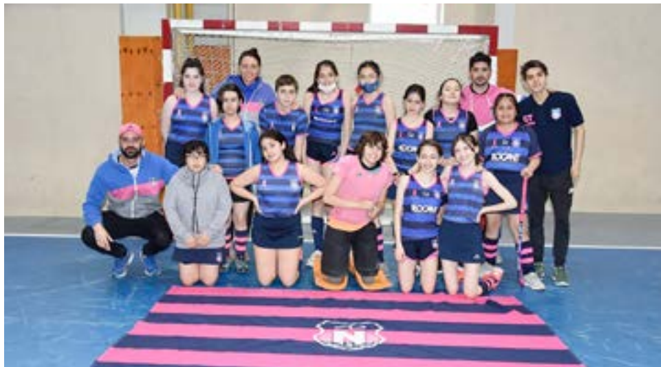
El equipo de Ñires (Ushuaia), categoría sub-12.

disfrutar entre todos los clubes que participaron junto a los amigos de Ushuaia de una muy buena jornada participativa, ya que además, los técnicos aprovecharon esta oportunidad para observar el nivel de crecimiento que vienen teniendo las nenas y los nenes, que te digo, hay un buen número de varones que se sumaron a este lindo proyecto, así es que, desde la organización muy conformes por todo lo que logramos". "Además debo comentarte que esta serie de encuentros nos permite evaluar el desarrollo