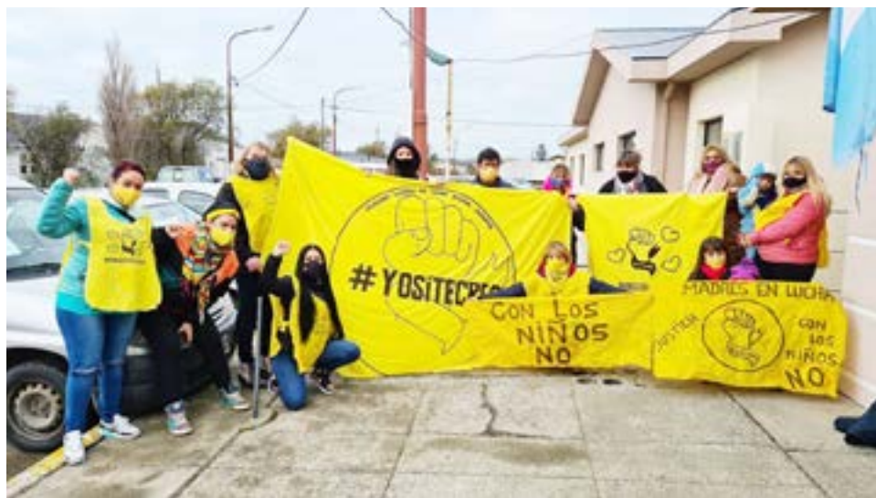
El 19 de noviembre se conmemora el Día de la lucha contra el Abuso Sexual Infanto-juvenil y Mamás en Lucha convocan a la comunidad a manifestarse en la Plaza Almirante Brown de Río Grande.