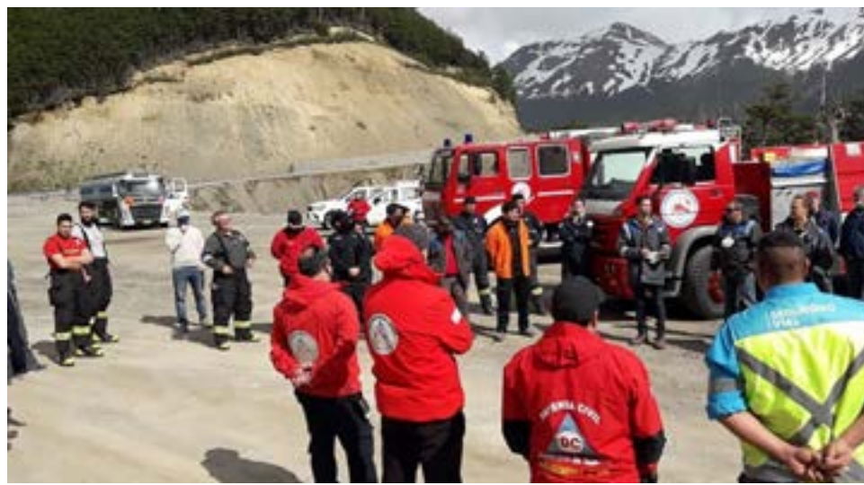
El Gobierno de la Provincia, a través del Ministerio de Salud y la Secretaría de Protección Civil, participaron en el simulacro de emergencia realizado -este miércoles- en el Paso Garibaldi.