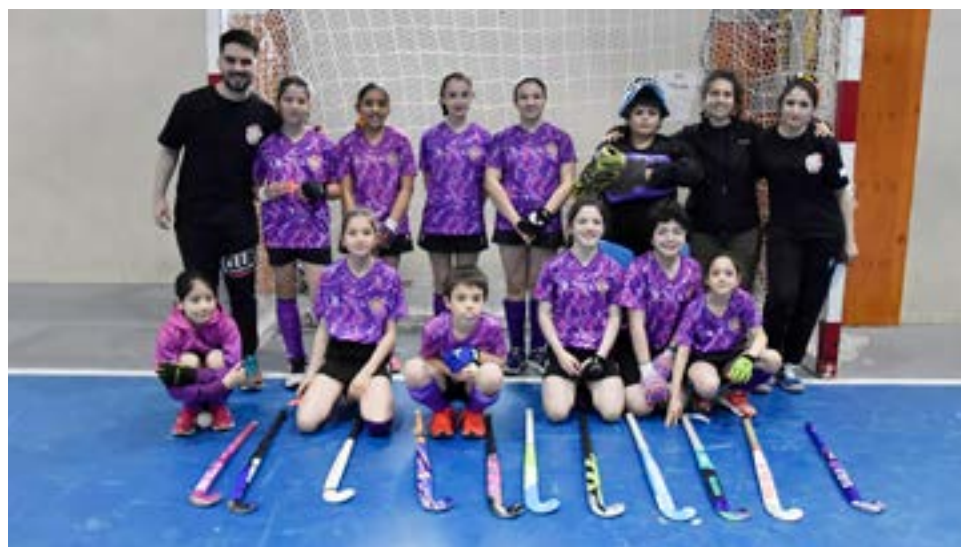
El equipo de Uaken Club social y deportivo, categoría sub-12.