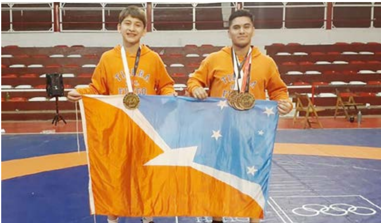
Los hermanos Miranda en pleno entrenamiento para competir en el Nacional de Misiones.