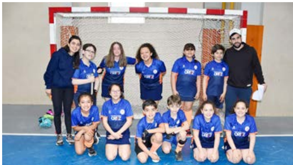
El equipo de Yoppen, categoría sub-12.

de cada nena y nene, como así también nos permite que las chicas y los chicos de las categorías superiores puedan trabajar con los 'peques' y enseñarles todo lo que ellos aprendieron en los diferentes partidos que han enfrentado, ya que esa experiencia es muy valiosa para todos los iniciales, y que también es el objetivo que proponemos desde el club". "Contarte también que 'Uaken Club Deportivo Social' viene participando en la Federación Fuegoquina de Hockey de forma excelente y con muy buenos resultados para la institución, ya que en estos últimos meses hemos incrementado los entrenamientos y apuntamos a tener mayor competen-