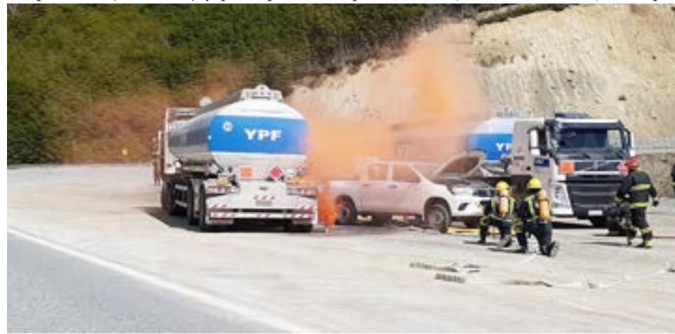
El operativo fue coordinado por YPF y contó con la participación de todas las áreas que intervienen normalmente en simulacros de emergencia.

En cuanto a la intervención del área de Salud, dijo que “brindamos la cobertura inicial en la escena, con un móvil sanitario de Lago Escondido”, para explicar luego que “cuando nos confirma Bom-