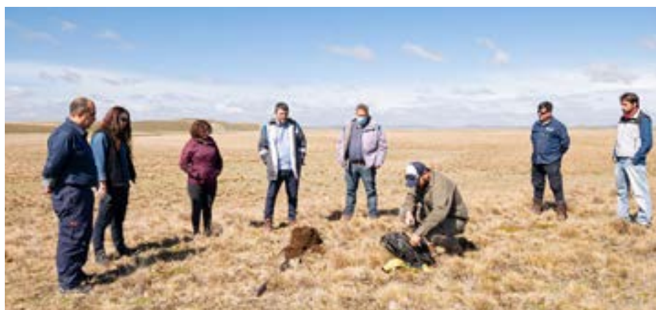
Las tareas consisten en tomar muestras de suelo en sitios puntuales a fin de llevarlas a un laboratorio especializado para determinar la presencia de hidrocarburos en superficie y delimitar las zonas prospectivas.

Todos estos estudios, son parte del compromiso de inversión de casi 11 millones de dólares en exploración en la CA-12 que permitirán brindar datos del potencial hidrocarburoso de la zona, como así también puedan proponerse en la siguiente etapa, la perforación de pozos exploratorios. Este trabajo que viene realizando la Secretaría de Hidrocarburos, ha permitido que la reactivación del sector, tanto en exploración como en explotación, sea una realidad y más pronto en el tiempo, luego del período de incertidumbre que nos impuso la Pandemia, acrecentado por la falta de acciones concretas de la gestión anterior en la materia.