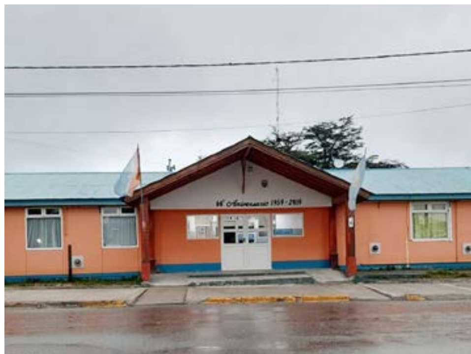
Madre denunció que un sujeto espía a niñas en el baño del colegio N° 5 en Tolhuin.