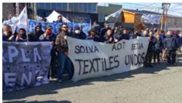
Desde la AOT, SETIA y el SOIVA pidieron “llevar tranquilidad a las trabajadoras y trabajadores del sector, dado que las fuentes de trabajo no están en peligro”.

Más adelante indican que “De dicho encuentro, hemos podido disipar dudas y manifestar inquietudes tendientes al futuro de la Industria Textil y confeccionista. Las palabras del Gobierno nacional han sido alentadoras por cuánto se garantizan las fuentes de trabajo, instando a mejorar al máximo los procesos productivos con el fin de incrementar las fuentes laborales y condiciones de trabajo del sector”.