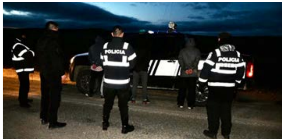
Intentaron hurtar tres corderos vivos y terminaron notificados de derechos y garantías procesales en una causa por presunto abigeato.

Se procedió a la fehaciente identificación y notificación de derechos y garantías a los ocupantes del rodado, resguardo del vehículo, en tanto que los ovinos fueron entregados al damnificado encargado de la Estancia Sara.