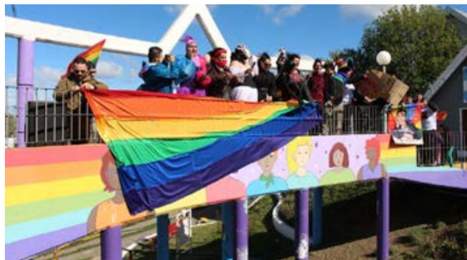
La fiesta-protesta tuvo gran participación, y se espera que lo mismo ocurra, la semana entrante, en la ciudad de Ushuaia.

Asimismo, otro de los reclamos tuvo que ver con la ausencia de una real aplicación de la Ley de Educación Sexual Integral: “Después de 15 años es momento de ver las consecuencias de la falta de educación sexual integral en las escuelas, lugares que deberían ser seguros para construir las identidades, expresiones y orientaciones sexo afectiva. Pero también es momento de definir responsabilidades y responsables.