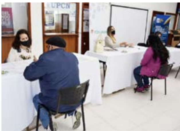
Fue constante el flujo de vecinos que realizaron consultas a los notarios.