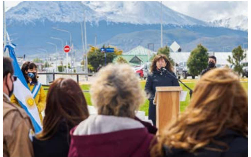
La vicegobernadora Mónica Urquiza, encabezó este sábado, el acto por el Día de la Soberanía Nacional, desarrollado en la Plaza Islas Malvinas de Ushuaia.

en las futuras generaciones, que nosotros seguiremos reclamando por las vías pacíficas lo que nos corresponde de acá