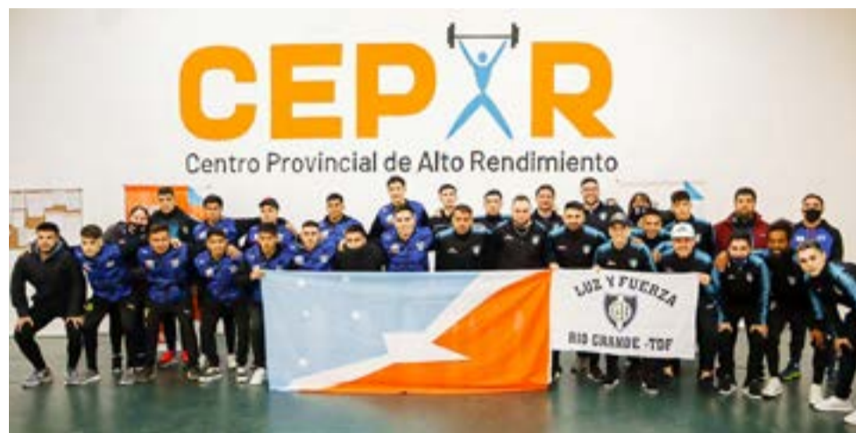
Los equipos de Luz y Fuerza y San Martín que representarán a Río Grande en la Copa Franca Austral que se realiza desde el domingo 21 al sábado 27 de noviembre en la ciudad de Puerto Madryn.

el sábado 27 de noviembre en la ciudad de Puerto Madryn, que en principio San Martín enfrentó a los Halcones de Comodoro Rivadavia, y en el turno siguiente fue para Luz y Fuerza ante Gregores FC de Caleta Olivia. Destacando además que este Campeonato Nacional de Futsal C.A.F.S "Copa Franca Austral", contará con la participación de treinta y dos equipos de ocho provincias distintas y se espera por una participación de seiscientos deportistas.