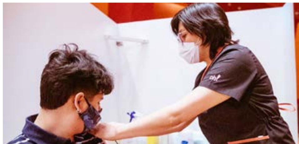
Es para personas que hayan recibido la segunda dosis hasta el 31 de mayo.

Hasta el momento, siguiendo las disposiciones acordadas con el Ministerio de Salud Pública de la Nación, se han aplicado en la provincia un total de 276.521 vacunas, de las cuales 148.606 corresponden a primeras dosis, 121.934 a segundas dosis, 1797 a dosis de refuerzo en adultos mayores y personal sanitario, 4182 a dosis adicionales y 2 a dosis única.