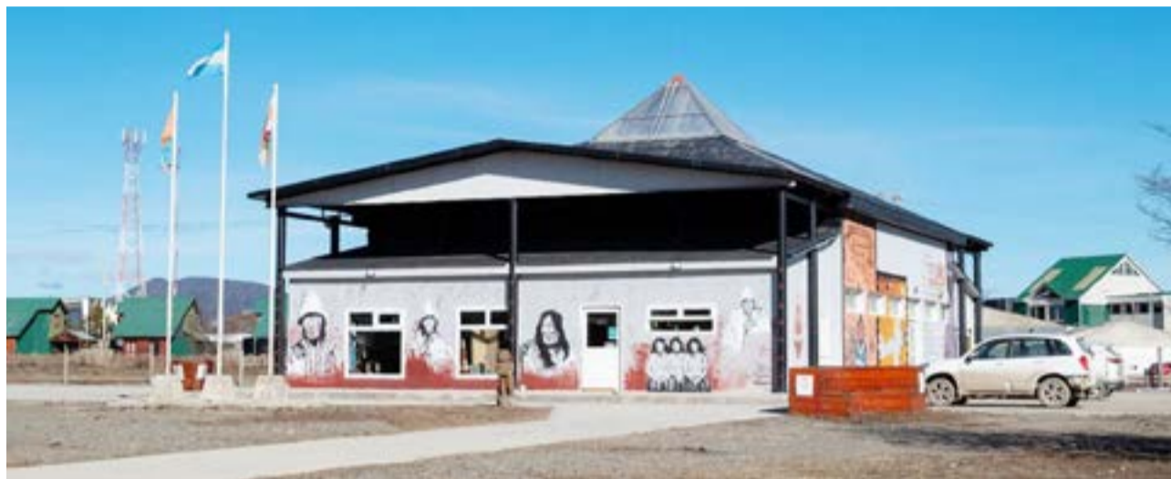
La atención será por orden de llegada a partir de las 10 y hasta las 15 horas en el edificio de Producción ubicado en Rupertini 51 (Dirección de Producción).

vivienda, repercute directamente en la economía local, ya que fomentaría la construcción y mano de obra local, la generación de fuentes de empleo relacionadas con la construcción local e inyección de dinero por parte