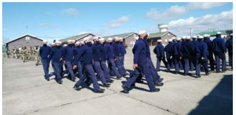
La ceremonia militar se desarrolló en el Gimnasio del BIM 5 Escuela, pero previamente hubo un desfile en la plaza de armas de la unidad.

Destacó que “la ciudad de Río Grande está estrechamente relacionada con el BIM 5, desde los hechos cotidianos hasta el conflicto de Malvinas, una relación que nació en 1947, hace más de 74 años cuando esta ciudad aún era un pueblo, una aldea, crecieron juntos el pueblo y el Batallón 5 y es un hecho históricamente conocido que Río Grande está identificada con Malvinas. Por eso aquí se vive y se respira Malvinas, lo vemos en cada Vigilia, en cada acto por el 2 de abril; estoy encantado por la Semana de Malvinas