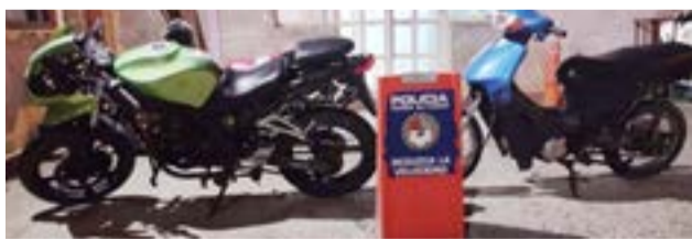
Recuperaron tres motocicletas que habían sido denunciadas como robadas, en los últimos 15 días.

bordo de una motocicleta de baja cilindrada -110cc- con cachas de color azul.