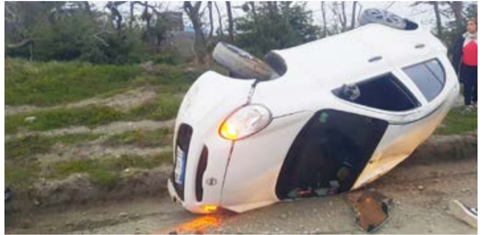
Conductor realizó una mala maniobra a bordo de su automóvil y volcó.

Se realizaron las actuaciones de rigor conjuntamente con personal de la División Policía Científica.