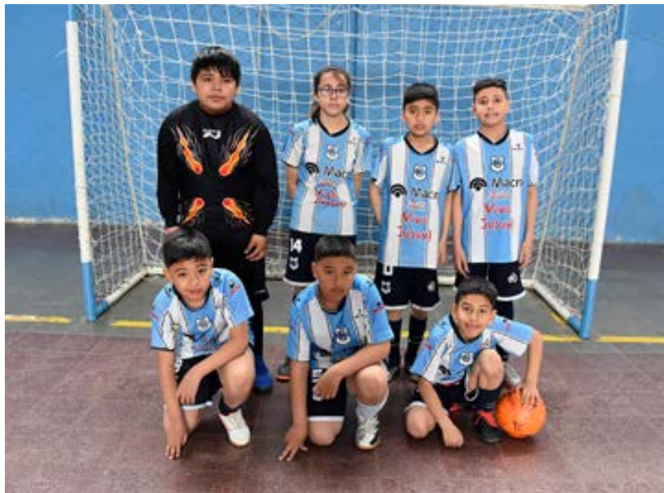
El equipo de Residentes Jujeños, 7ma división.

Progreso 5 Italiano 8 Partido 5 – 9na división Copa de Oro – inicio: 16.00 horas Saque inicial: Escuela Argentina Kapones 4 Escuela Argentina 3 Partido 6 – 10ma división Copa de Plata – inicio: 17.00 horas Saque inicial: ADEFU Negro ADEFU Negro 5 Escuela Argentina 1