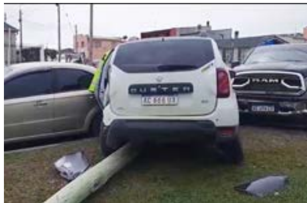
Violento accidente dejó como saldo una camioneta destruida y una columna derribada, en Don Bosco y Colón.

Producto del impacto entre las camionetas, un Chevrolet Aveo que estaba estacionado, también fue colisionado. De fortuna, no hubo personas heridas, sin embargo, los daños materiales, fueron más que importantes.