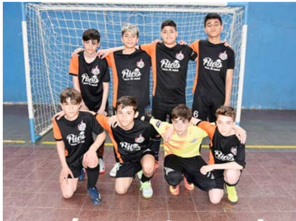
El equipo de ADEFU Naranja, 6ta división.