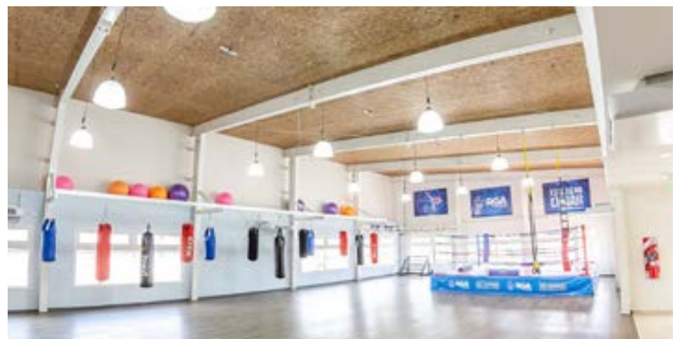
“Hoy se inaugura el gimnasio de Chacra IV de deportes de contacto y “desde temprano vamos a empezar con las recorridas. Tiene aproximadamente 330 metros cuadrados y la inversi n fue cercana a los 30 millones de pesos, con aportes de naci n”, dijo M naco.

“Cuando asumimos hab a una gran demanda y muy poca tierra. Justamente en eso se est  trabajando junto con distintas  reas del municipio. Se est  trabajando con las desarrolladoras y se est n postulando nuevos predios para llevar suelo urbano. Tambi n estamos viendo la situaci n de los postulantes del banco de tierras para ver si hoy tienen alg n terreno, para poder reconfigurar esa demanda”, apunt .