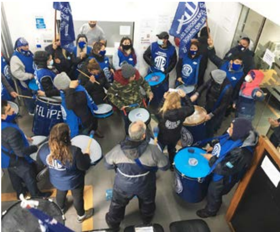
Ayer por la mañana, integrantes de la Asociación Trabajadores del Estado de Río Grande, del Centro de Jubilados ATE – ANUSATE y de la Asociación de Jubilados Municipales, se manifestaron en la Delegación local de la OSEF.

– ANUSATE y de la Asociación de Jubilados Municipales, en ambos casos replicando las críticas y los cuestionamientos por el deficiente servicio que brinda la OSEF y coincidiendo en solicitar la renuncia de quienes integran el Directorio.