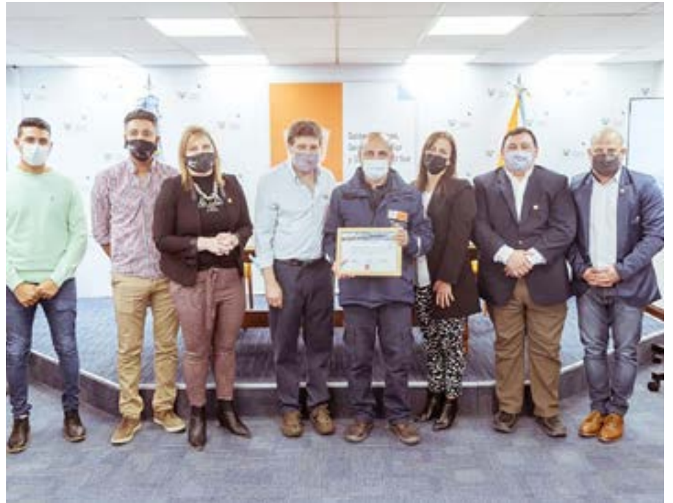
El gobernador Gustavo Melella junto a la ministra de Salud, Judit Di Giglio entregaron reconocimientos a quienes trabajaron de manera incansable en los vacunatorios contra el COVID-19 de la provincia.

De igual modo, consideró que “sin lugar a dudas la intensa y excelente Campaña de Vacunación, ha sido una de las principales razones para que regresemos a nuestros trabajos, actividades y especialmente que volvamos a encontrarnos con nuestros afectos, situación que parecía tan lejana y que gracias al esfuerzo de todos y cada uno de los fueguinos y fuegui-