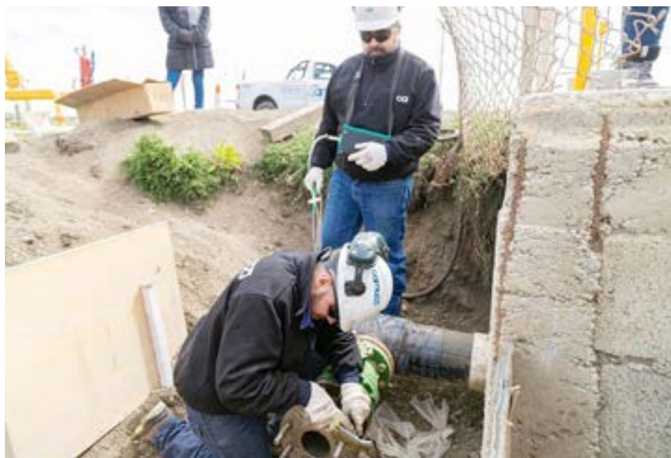
El Gobierno de la Provincia, a través del Ministerio de Obras y Servicios Públicos, concretó la vinculación de la nueva planta reguladora de gas natural del barrio Arraigo Sur, la cual abastecerá del servicio a dicho sector y al barrio Esperanza de Río Grande.

Finalmente aseveró que “esto es un paso a paso, ya que habrá familias que prontamente podrán contar con el servicio y otras lo harán en los próximos meses. La realidad es que desde el Gobierno estamos trabajando fuertemente para garantizar que el servicio llegue a todos, y poder brindar condiciones dignas y de habitabilidad a las familias de la zona sur que hace tanto tiempo lo están esperando”.