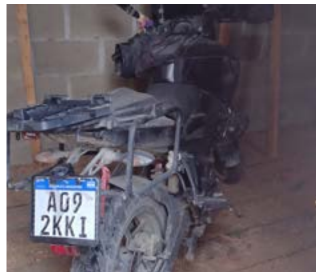
Encontraron la moto en un predio ubicado en calle Mariano Moreno al 1500.

Personal de brigada dependiente de la Comisaría Tolhuin realizó una exhaustiva investigación entorno a la motocicleta sustraída el pasado 03/12/21, producto de la cual se analizó una cuantiosa cantidad de filmaciones colectadas en la ciudad. De dicha labor se logró obser-