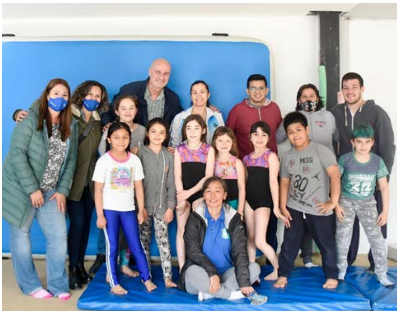
El presidente del Instituto Municipal de Deportes realizó el pasado fin de semana una recorrida por todos los espacios deportivos y/o recreativos que la Municipalidad de Ushuaia posee en los diferentes barrios de la ciudad.