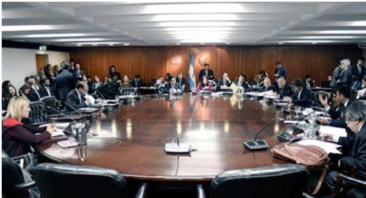
El proyecto enviado al Congreso propone aumentar la cantidad de integrantes de 13 a 17.

“Para la elección de dicha estructura, se consideró que los estamentos que deben ser representados en el Consejo de la Magistratura son, de un lado, el Poder Le-