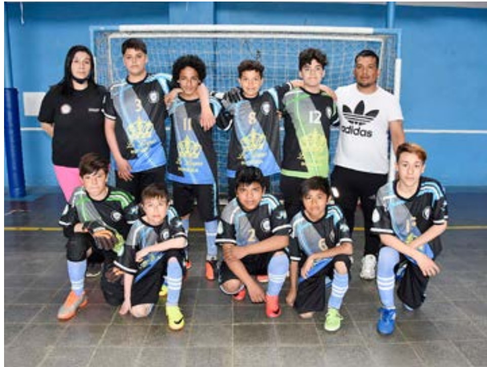
El equipo de Ardiles, 6ta división.