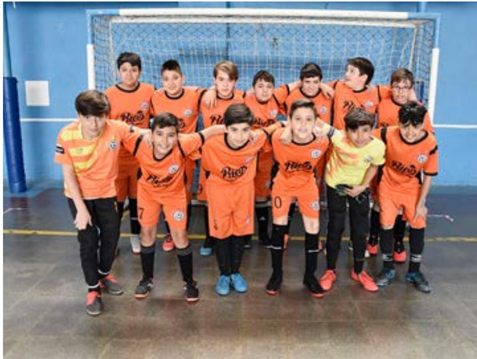
El equipo de ADEFU, 7ma división.