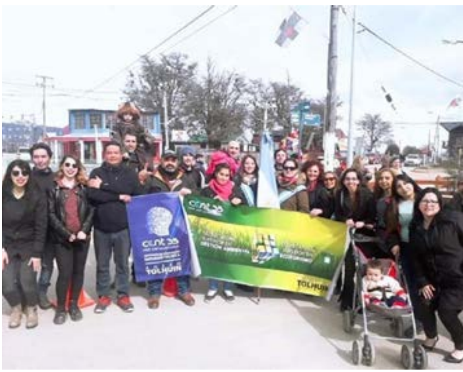
Egresados y estudiantes de Turismo con Orientación en Ecoturismo denuncian que no pueden ejercer de guías de turismo y culpan al InFueTur.

Agregaron que “sin embargo, los estudiantes de universidades de la provincia y técnicos de otras provincias si pueden acceder a la certificación que nos es negada constantemente por parte del InFueTur. La Ley Territorial N° 338 – Guías de Turismo, cita: Artículo 1°. La denominación de Guía de Turismo es reservada exclusivamente para las personas físicas diplomadas en Centro de Capacitación Turística, terciarios, terciarios no universitarios y/o universitarios cuyos títulos se encuentren debidamente reconocidos por el Ministerio de Educación y Justicia de la Nación y que cuenten con su respectivo número de matrícula; que entiendan en las técnicas de dinámicas grupales, actuando como nexo de acciones referidas a la fluida interpretación de bienes naturales y culturales, propiciando la interrelación cultural, conforme a un ajustado manejo de acciones recreativas,