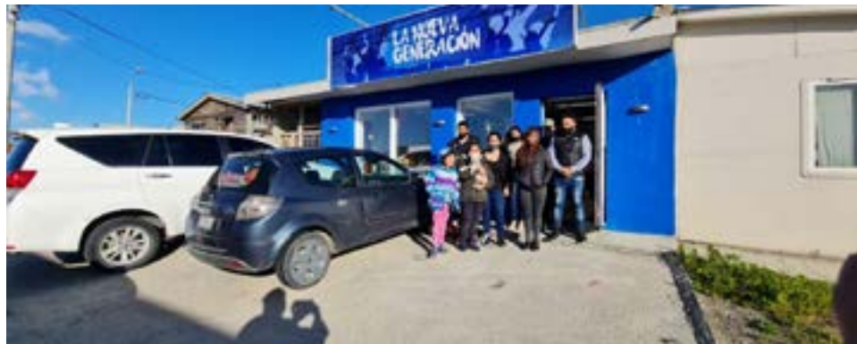
La sede pronta a inaugurar está ubicada en Forgacs 2415 de Río Grande.