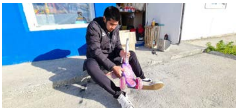
Con mucha dedicación, los jóvenes reparan y pintan los juguetes rotos y lo dejan a nuevo.

Justamente los jóvenes reciclan estos juguetes y los dejan a nuevo, sean monopa-