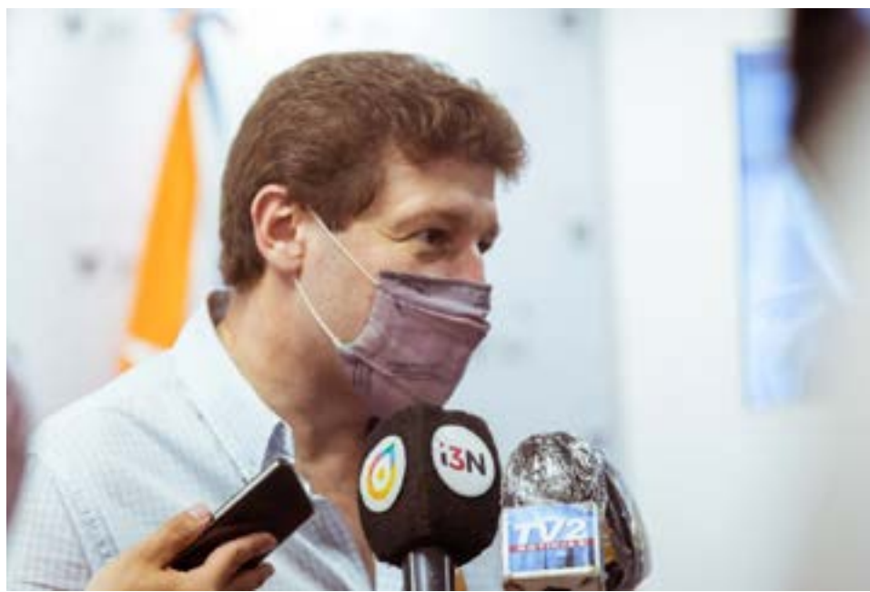
El gobernador Melella saludó la determinación al destacar que “contar con el Presupuesto aprobado nos permite ejecutar las políticas que garanticen la protección de las familias fueguinas” y destacó el compromiso de la oposición legislativa.

sarios, a través de una discusión política adulta con sus pares”, insistió.