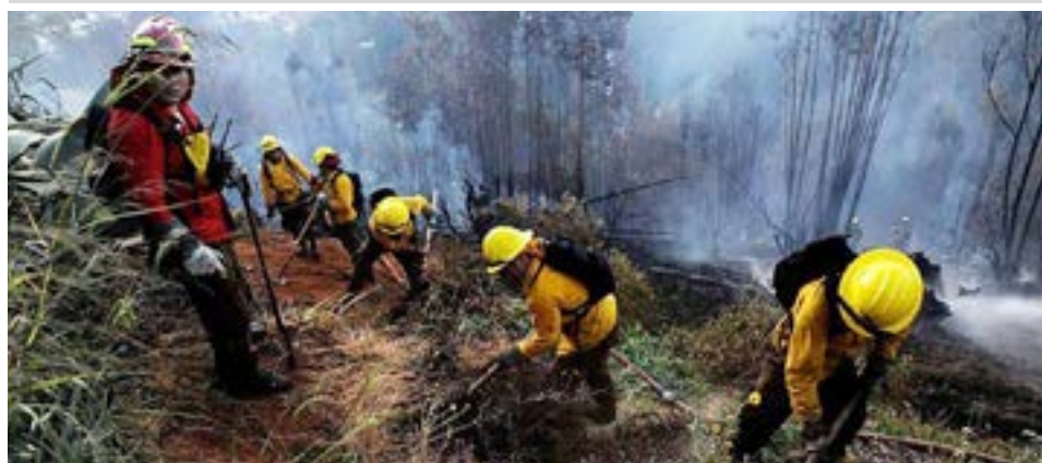
Continúa el combate del incendio en “La Fueguina” y afecta 12 hectáreas de bosque y hay un segundo foco al norte de Estancia Sara. (Imagen ilustrativa de archivo).