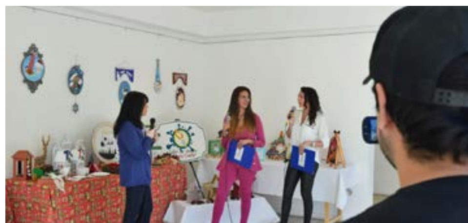
Este lunes, el Centro Cultural "Nueva Argentina" inauguró la muestra navideña del Taller de Pintura Decorativa "Último Confin".