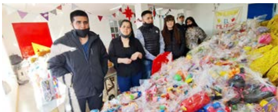
Parte del equipo de jóvenes de ‘La Nueva Generación’.

También con esta campaña del juguete ‘La Nueva Generación’ está preparando bolsas navideñas. “Hay un grupo de chicos que están en la sucursal de Carrefour en Perú y están recolectando pan dulces y demás alimentos navideños y también hay vecinos que nos donan juguetitos nuevos de ahí; y el objetivo es también junto con