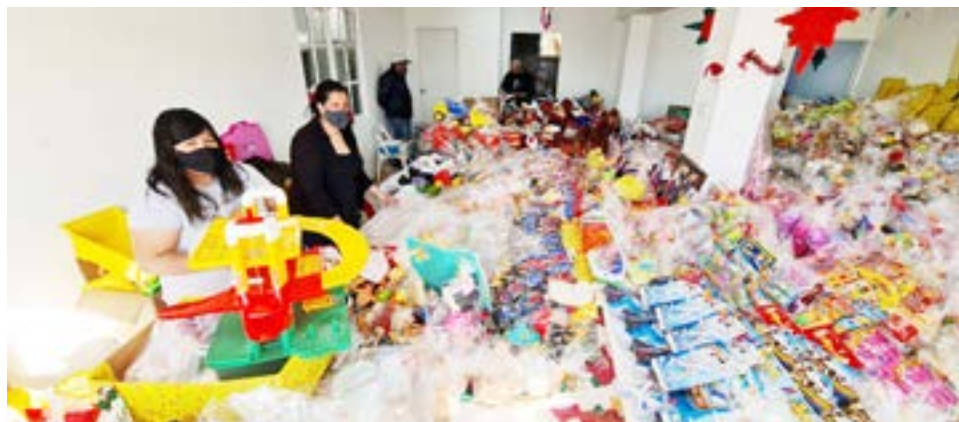
Familiares de los chicos vienen a colaborar con ellos en la clasificación de los juguetes.

que no sabemos, en ese caso tratamos de aprender. Es un trabajo que lo hacemos en forma totalmente honoraria, son unos sesenta chicos los que colaboran pero los que están full time son unos treinta y estamos distribuidos en distintos puntos de la ciudad. Esta sede que tenemos (en Forgacs 2415) es nuevita y todavía no la inauguramos, pero está rebotante de actividad y prácticamente no hay espacio con todos los juguetes y bolsas navideñas