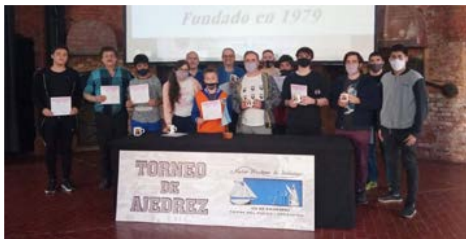
Todos los participantes del Torneo Abierto de Ajedrez Instituto Browniano.