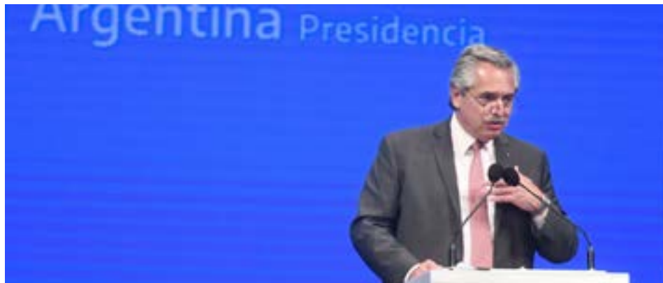
El presidente Alberto Fernández confirmó ayer al mediodía que los trabajadores de la administración pública nacional recibirán un bono de fin de año de $20.000.

Los estatales habían tenido un incremento salarial del 18% entre enero y mayo y de otro 40% entre junio y diciembre, ya como parte de la paritaria 2021-2022.