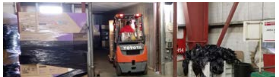
Será inminente la vuelta a la producción en las empresas Digital Fueguina y Tecnosur, después de muchos meses de inactividad.

Al finalizar, González comentó que "hoy somos 190 trabajadores en condiciones de retomar las actividades, con ellos estaremos retomando la producción entonces del fasón", comentó. Para terminar señalando que "esto es algo bueno, dentro de todo lo malo que nos viene pasando.