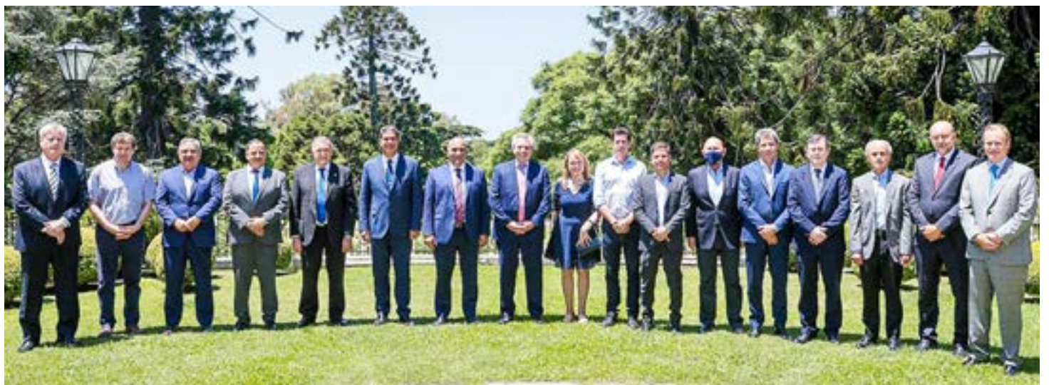
El presidente Alberto Fernández y los gobernadores oficialistas.

El presidente de la Cámara de Diputados, Sergio Massa, quien estuvo a cargo de las negociaciones en el Congreso y resultó golpeado por el fracaso, envió el domingo un mensaje a los gobernadores, donde les advirtió que ahora deberán rehacer sus presupuestos o recortar gastos. Generó así una fuerte reacción de la oposición: los titulares de los Ejecutivos de Corrientes, Gustavo Valdés, y los diputados que responden a Juan Schiaretti en Córdoba, así como el jefe de gobierno porteño, Horacio Rodríguez Larreta, sa-