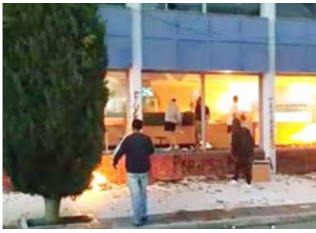
Incendiaron el diario 'El Chubut' con periodistas adentro.

La Asociación de Diarios del Interior de la República Argentina (A.D.I.R.A.) expresó su más enérgico repudio contra los actos de violencia perpetrados en el día de ayer contra la sede del diario 'El Chubut', provocan-