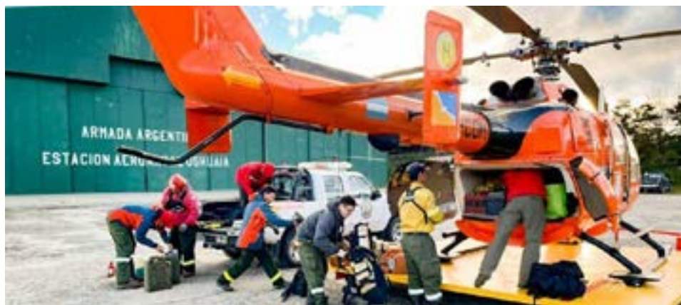
Participan un total de 21 combatientes y 5 personas afectadas a tareas de logística y operaciones en la asistencia del incendio.

En el lugar, están trabajando brigadistas de la Empresa YPF coordinados por los Brigadistas Provinciales de Zona Norte con asiento en Río Grande, a fin de continuar con las acciones de enfriamiento y mitigación, las cuales son indispensables en el contexto de los vientos imperantes en el sector en la jornada de ayer.