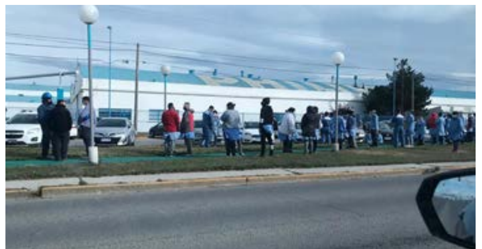
Se registró un principio de incendio en FAPESA, que fue controlado y sofocado por personal de seguridad de la empresa..

El mismo fue sofocado previamente por personal de seguridad. El origen del mismo, fue accidental, siendo sofocado y controlado, sin haber heridos en el lugar.