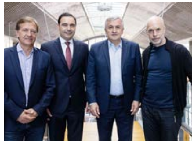
Rodolfo Suárez, Gustavo Valdés, Gerardo Morales y Horacio Rodríguez Larreta, tras el almuerzo que compartieron.

La reunión de los jefes partidarios servirá para repasar algunos temas nacionales y, en particular, para tratar de resolver cómo será la conformación de la nueva Mesa Nacional de Juntos por el Cambio: buscan que la coalición opositora tenga una estructura a nivel nacional que sea más ejecutiva que la actual y que responda con mayor fidelidad a los resultados de las últimas elecciones. Está en discusión quiénes deberían integrar la conducción nacional a partir de ahora y si se arma una mesa federal para permitir que se incorporen ganadores de las elecciones en las provincias.