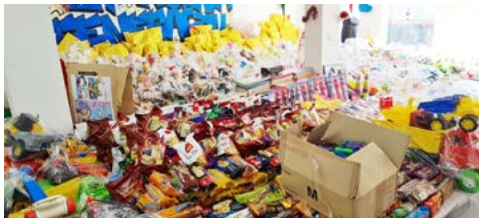
Con la venta de pollo, han logrado recolectar fondos para comprar más de 800 juguetes nuevos, lo que es un impulso también a la economía de Río Grande.