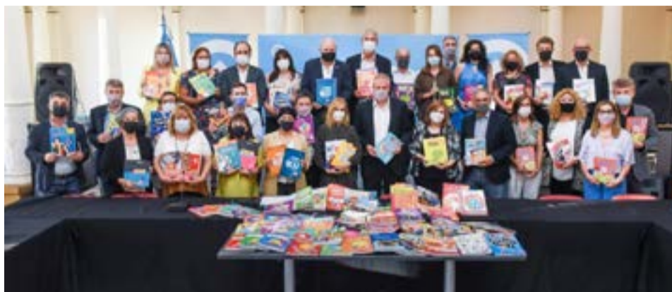
En la reunión se comunicó oficialmente la puesta en marcha de "Libros para aprender", un programa de alcance federal que tiene por objetivo fortalecer el vínculo pedagógico de niñas y niños con los libros.

Destacando la importancia de los libros como una herramienta fundamental para el aprendizaje, Perczyk, señaló que "en