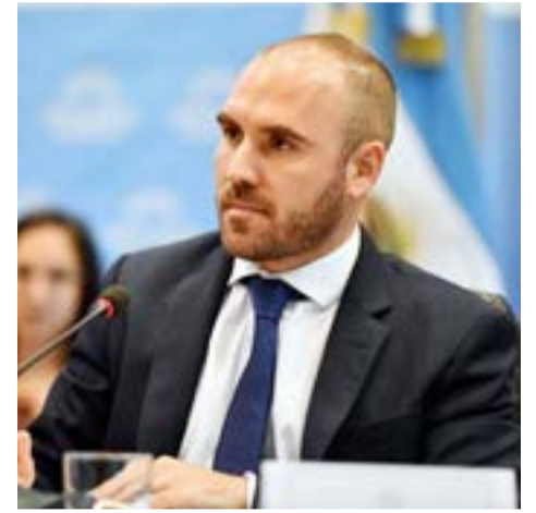
A primera hora de este miércoles, el Gobierno le pagó al Fondo Monetario Internacional los casi u$s1.900 millones correspondientes al segundo vencimiento de capital del multimillonario programa Stand By que firmó Mauricio Macri en 2018.

de ruta económica, que posiblemente requiera una velocidad de convergencia fiscal superior a la que estaría siendo planteada, en busca de así reducir el financiamiento monetario. También resultará un desafío alcanzar un amplio respaldo político -en especial tras los tironeos políticos