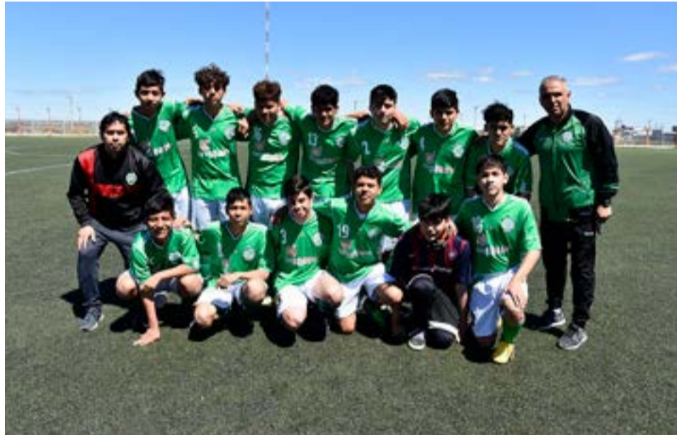
El equipo de Q.R.U., categoría sub-13.