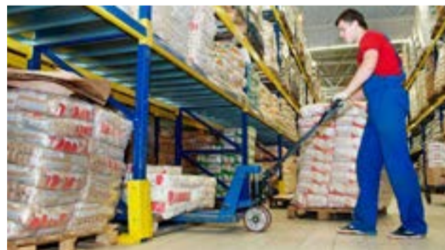
La variación de los precios mayoristas se explica como consecuencia de la suba de 2,9% en los “Productos nacionales” y de 3,4% en los “Productos importados”.

El Índice de precios internos al por mayor (IPIM) tiene por objeto medir la evolución promedio de los precios de los productos de orígenes nacional e importado ofrecidos en el mercado interno. Se incluyen el impuesto al valor agregado, los impuestos internos y los impuestos a los combustibles netos de los subsidios explícitos. Por