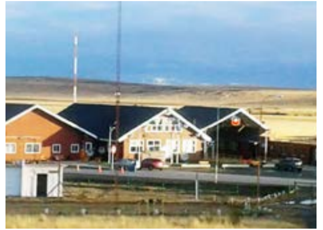
Con un cupo de 200 personas diarias, el paso Integración Austral -que une Punta Arenas con Río Gallegos- contará con personal sanitario de la Nación, de 10 a 16 horas, que controlará el ingreso de chilenos y argentinos a la provincia.

Así, el ingreso de chilenos a Argentina será de 10 a 16 horas con un cupo de 200 personas por día. Mientras tanto, las familias ya preparan el bolso y chequean contar con toda la documentación requerida para poder cruzar de un país a otro, por lo que la expectativa y la ansiedad crece tras casi dos años sin poder abrazarse.