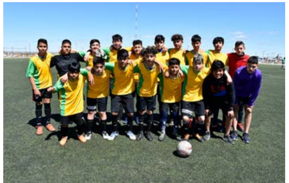
El equipo de Escuela Municipal de Fútbol, categoría sub-13.

Partido 1 – categoría sub-17 – inicio: 15.00 horas Saque inicial: Sacachispas O'Higgins 0 Sacachispas 1 Estrella Austral 0 Real Madrid 3 Goles Real Madrid, (7) Alan Huaracan 1, (10) Tobías Riquelme 1, (17) Fabricio Giova-