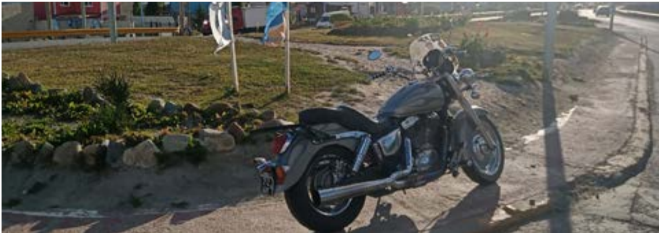
Vera catalogó la experiencia del viaje como "espectacular, hermosa, fue un reencontrarse con la realidad que hay en Argentina, sobre todo alrededor de la Causa Malvinas".

del 50% de la población bajo la línea de pobreza, eso duele pero también es nuestra realidad", reflexionó.