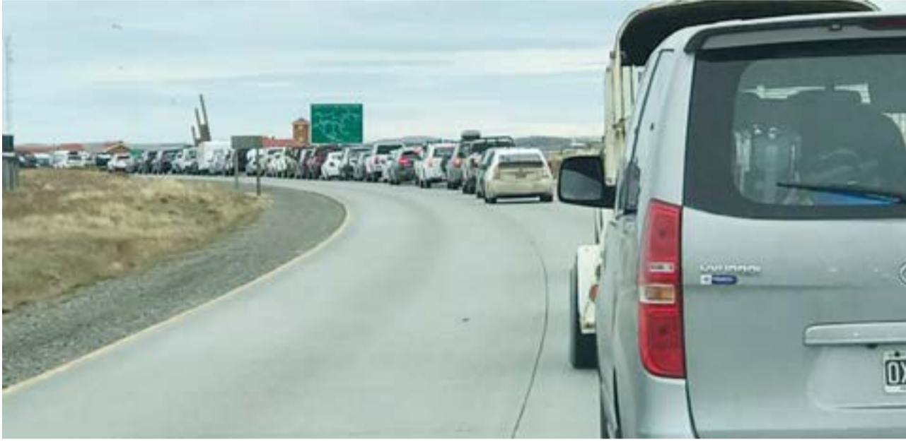
Los fueguinos tienen que hacer casi 100 kilómetros de más para ir a Punta Arenas.

Lo único que restaba esperar para que esto suceda eran algunas cuestiones operativas. Acorde a lo que pudo saber La Opinión Austral, desde el Ministerio de Salud de la Nación se comprometieron a que este miércoles en Integración Austral habrá presencia de personal sanitario de la Nación de 10 a 16 horas para garantizar el control necesario acorde a la normativa en el marco de la pandemia.