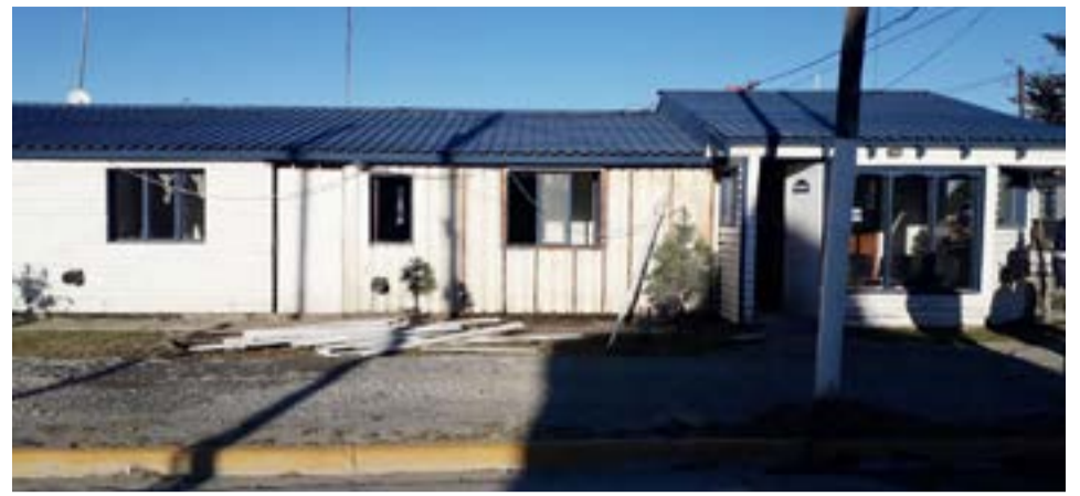
Principio de incendio al lado de la comisaría de Tolhuin.