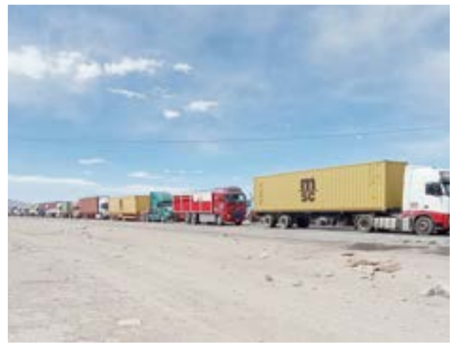
Cabe destacar que días pasados hubo más de diez kilómetros de camiones varados.

Es que es imposible realizar el viaje 'corto', que sería directo entre Río Grande y Punta Arenas, y que tiene poco más de 402 kilómetros de camino.