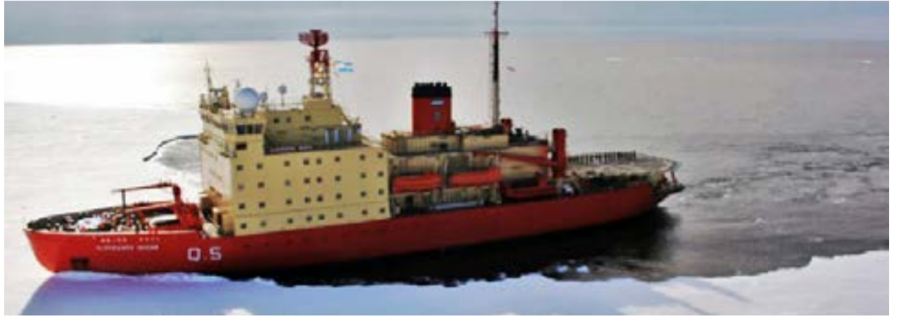
El convenio para llevar adelante esta iniciativa fue rubricado por los ministerios de Defensa, Ciencia y Relaciones exteriores el pasado 9 de diciembre, y establece que la coordinación de las acciones está a cargo de la Cancillería, a través de la Dirección Nacional del Antártico (DNA) o el Instituto Antártico Argentino (IAA).

"Estamos iniciando el montaje de estos laboratorios en el rompehielos Irizar, estamos recuperando la Base Pe-