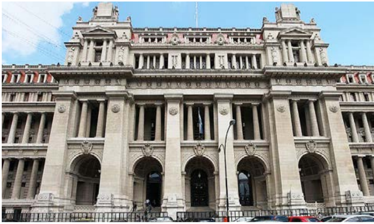
Las jubilaciones especiales para los trabajadores retirados del Poder Judicial alcanzan a poco más de 7.000 personas.

Según un informe de la Oficina de Presupuesto del Congreso (OPC), las jubilaciones para el Poder Judicial es en promedio un 11% superior entre los hombres en relación con las mujeres. Por su parte, las pensiones fue-