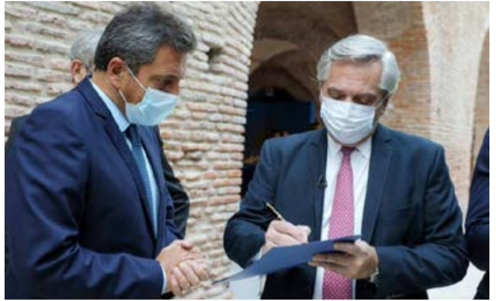
Alberto Fernández y Sergio Massa estuvieron reunidos en la Casa Rosada durante la tarde del lunes.

En paralelo, aparece un foco de preocupación. Los tiempos son acotados para el Gobierno debido a que el 22 de marzo es el primer vencimiento del pago de la deu-