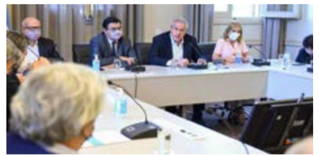
El gobierno nacional llegó ayer por la tarde a un acuerdo con los gremios docentes. El ministro de Educación, Jaime Perczyk, les ofreció a los cinco sindicatos un aumento del 45,45% en cuatro tramos para el salario inicial de los maestros.

“Lo destacable es que este aumento es para un primer tramo, para una primera oferta semestral que volverá a