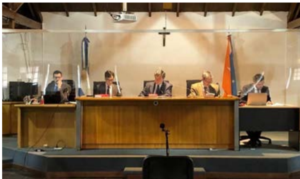
Sujeto acusado de abuso sexual agravado enfrentará al Tribunal de Juicio en la ciudad capital de Ushuaia.