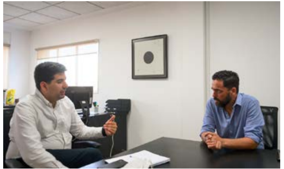
El Municipio y Nación trazan acciones para fortalecer el deporte Riograndense.