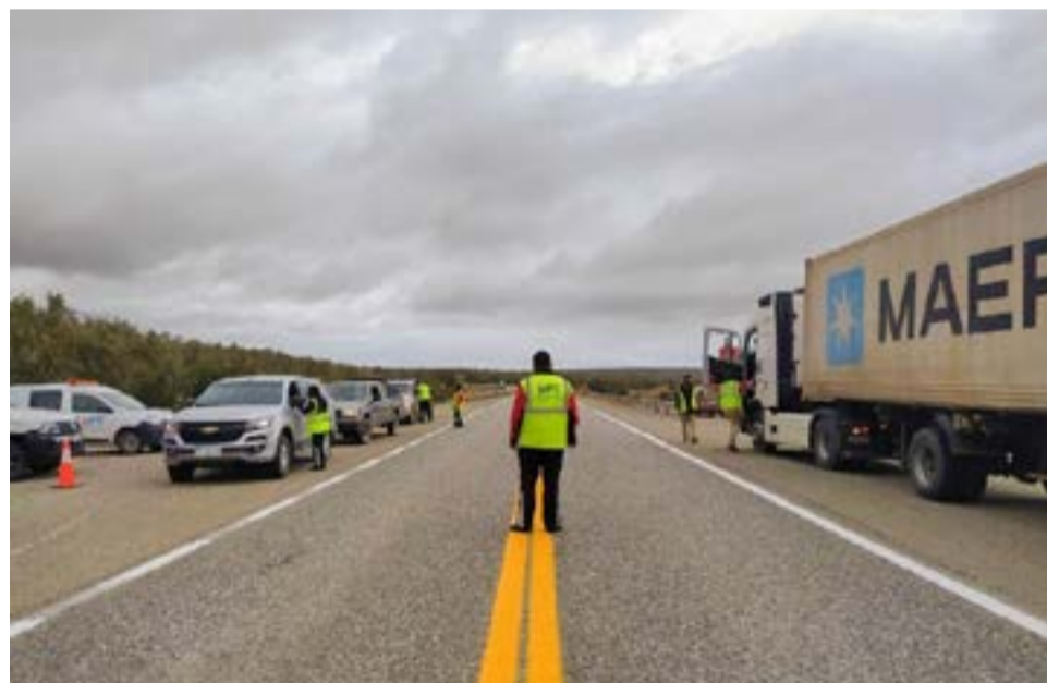
Personal de Seguridad Vial efectuó controles en los ingresos y egresos de las tres ciudades de la Provincia.