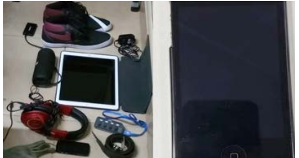
Robaron elementos informáticos de una casa ubicada en Guarani al 800 y horas después fueron recuperados tras allanamientos.

Se logró recuperar gran parte de los elementos, a la vez que los involucrados fueron notificados de derechos y garantías.