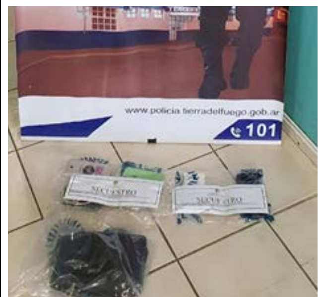
Recuperan elementos de un hurto en calle Gálvez al 500.

Manuel Correa fue notificado de derechos y garantías procesales.