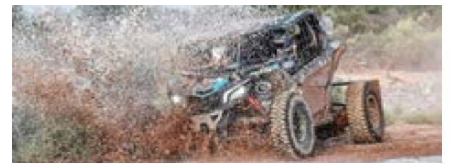
Se retrasó la etapa 6, pero a pesar de la lluvia el SARR 2022 desembarcará en Río Negro.

culos: primero las motos, luego los quads, UTV y camionetas. Por su parte, desde el vivac de 25 de Mayo, los equipos, asistencias mecánicas y las familias desarmaron sus campamentos para dirigirse a Villa Regina, en un recorrido que tendrá casi 250 kilómetros de ruta hasta llegar a la próxima locación que será el Predio Barda Indio Comahue, ya que el martes la etapa 5 del SARR 2022, entre la localidad mendocina de General Alvear y 25 de Mayo, había sido cancelada también por