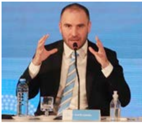
Este lunes concurrirá Guzmán a la Cámara de Diputados.

tos sociales, de entidades empresariales, nucleados en la Confederación General Empresaria de la República Argentina (CGERA), la Asamblea de Pequeños y Medianos Empresarios (APYME), y el Grupo de los 6 (UIA, Camarco, CAC, ADEBA, SRA y la Bolsa de Comercio).