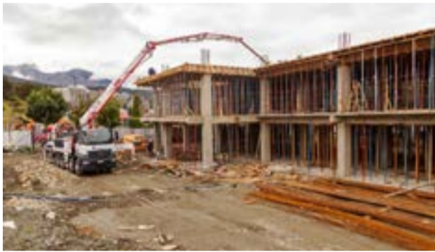
En el predio donde se levantará el edificio del Ministerio de Salud y consultorios externos, ya se hormigonaron las columnas y se avanza sobre la losa de la primera planta.

Asimismo agregó que la obra plantea etapas de trabajo