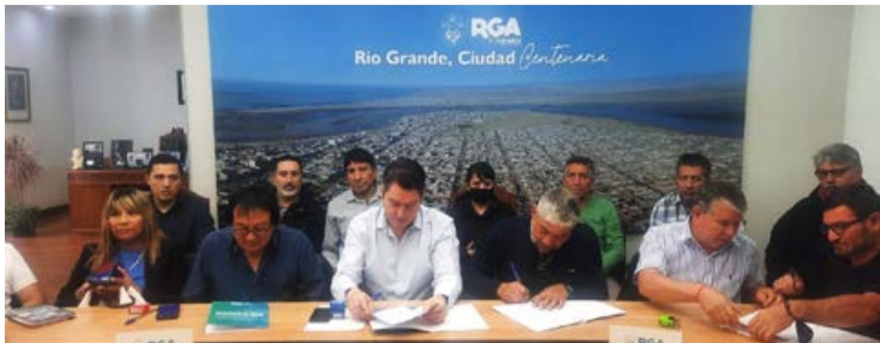
El incremento para los municipales fue planteado para el semestre comprendido entre marzo y agosto.

“Este incremento al básico de $9 mil, acordado en mesas de trabajo con todas las entidades gremiales impactará en todos los adicionales correspondientes como tí-