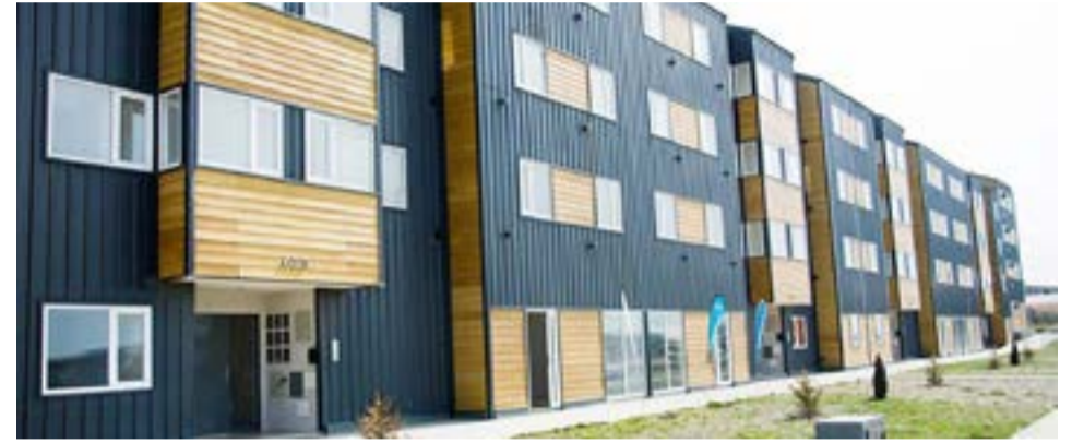
A través de la firma de convenio, en Río Grande se llevará a cabo la construcción del primer Desarrollo Urbanístico Procrear II.

como ejemplo los lotes con servicios en la zona sur de la ciudad y los más de 350 créditos Casa Propia que ya están acreditados, y a través de los cuales están construyendo su hogar cientos de fami-