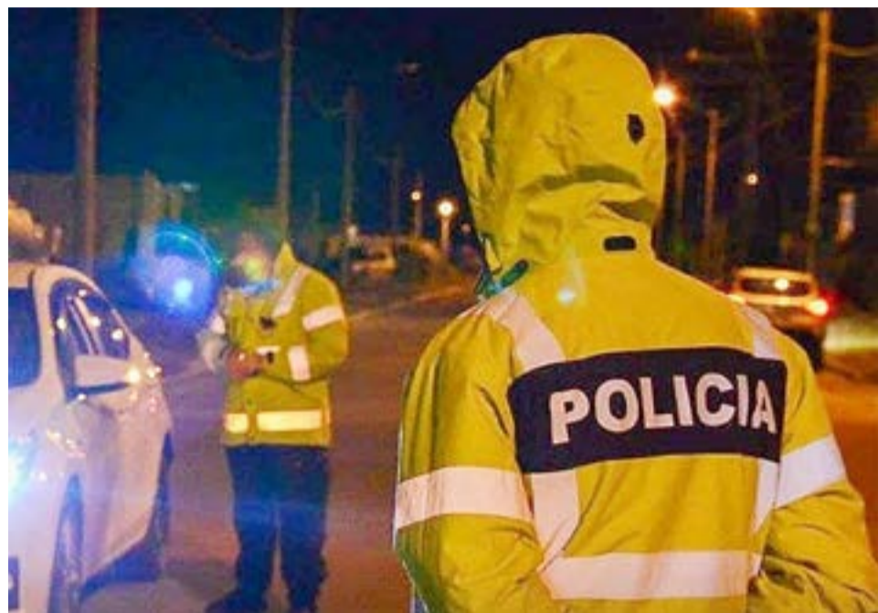
Una joven fue apuñada en una pierna dentro de un local bailable en Tolhuin.

En cuanto a la persona lesionada fue trasladada al centro asistencial, para su atención médica.