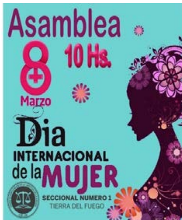
La UEJN convoca a una asamblea para el próximo 8 de marzo, al conmemorarse el Día Internacional de la Mujer.

conocer estos derechos de todas, todos y todes, lo vamos a hacer y vamos a impulsar lo necesario para avanzar en esto de convivir juntos”, concluyó el secretario General.