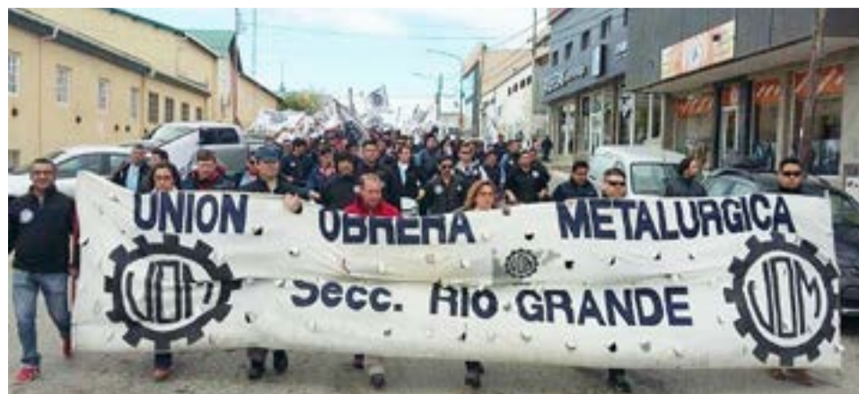
Después de mucho tiempo, tres listas se disputarán la conducción de la UOM en la seccional Río Grande.

Vale mencionar que se votará en todas las plantas fabriles, como así también habrá una urna en la sede de la UOM para quienes no puedan sufragar en sus lugares de trabajo.