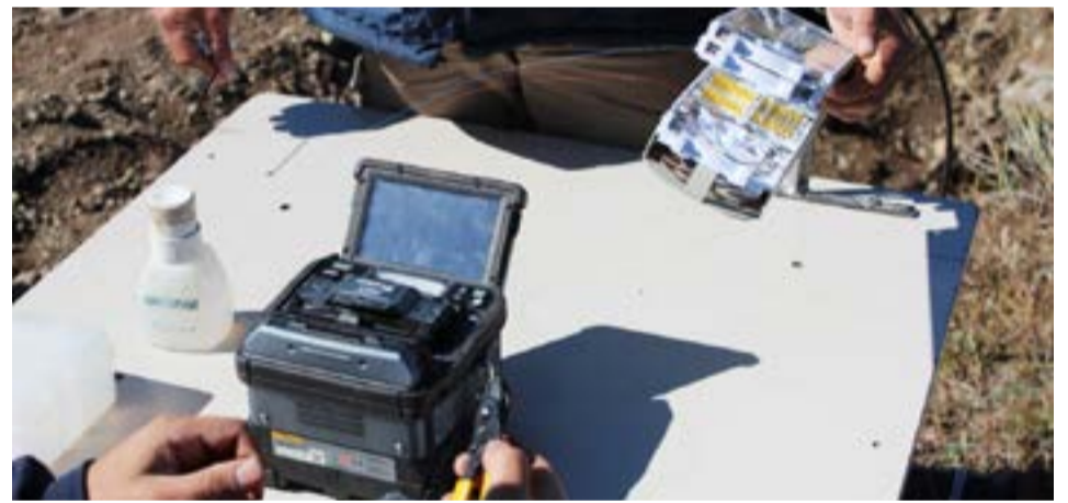
Los trabajos de medición tras el empalme. Ahora trabajan contrarreloj para aprovechar la presencia de los técnicos de la contratista de ARSAT.