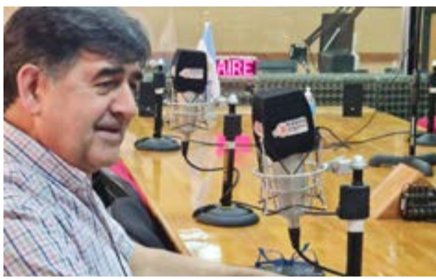
El ministro de Trabajo Marcelo Romero visitó los estudios de Radio Universidad 93.5 y Diario Provincia 23 para hablar de la situación del empleo en la provincia, particularmente en la post pandemia.

“Se ve una evolución del mercado económico, tanto del minorista como del industrial, y está teniendo una significancia muy importante en Tierra del Fuego”, aseguró.