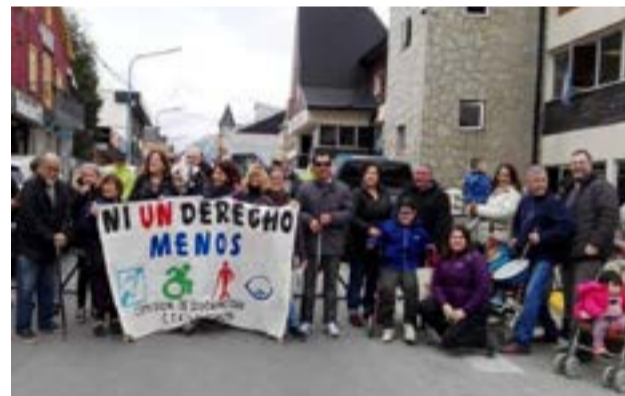
Desde la Comisión de Discapacidad de la CTA Autónoma comentaron las alternativas de la última asamblea que desarrollaron.

“Durante la asamblea se compartieron los relatos en primera persona sobre el padecimiento que implica esta vulneración del derecho más urgente; el derecho a la salud”, advirtieron desde la Comisión de Discapacidad. Para finalmente pasar a comentar que “Con gran participación, la asamblea definió: Realizar una sentada frente a Casa de Gobierno, el martes 8 a las 10:30 horas (llevar mate, cacerolas o elementos para hacer ruido). Lanzar una campaña en las redes para visibilizar la situación