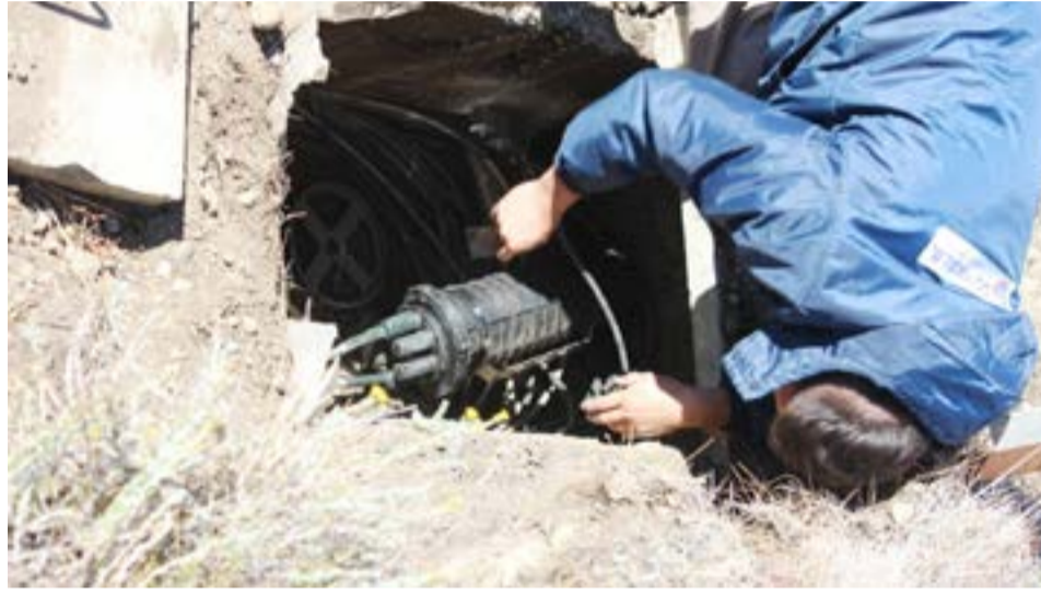
El lunes pasado se realizó el empalme de la red provincial a la red federal de la fibra óptica.

En ese sentido observó que el equipo técnico “es de Santa Fe y están llevando adelante este trabajo en todo el país y si se van antes de que se repare la red deben nuevamente programarnos una visita y la idea nuestra es que cuando lleguen los equipos podamos tener todo funcionando y si está la fibra cortada obviamente