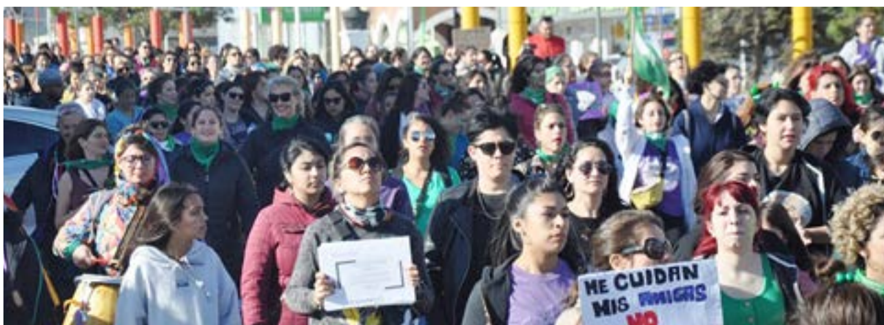
Vigilia y marcha por el Día Internacional de la Mujer en busca de la Reforma Judicial Transfeminista.

La Escuela Austral de Enseñanza Bilingüe (E.A.D.E.B.) se encuentra en la búsqueda de Profesores/as de Nivel Primario y Profesores/as de Inglés. Son requisitos excluyentes: - Título docente de Profesor/a de Nivel Primario. - Título docente de Profesor/a de Inglés. - Estar inscripto en la Junta de Clasificación y Disciplina del Nivel Primario. Los interesados deberán enviar su C.V. al correo electrónico: sec_eadeb@frtdf.utn.edu.ar o escuela.eadeb@gmail.com