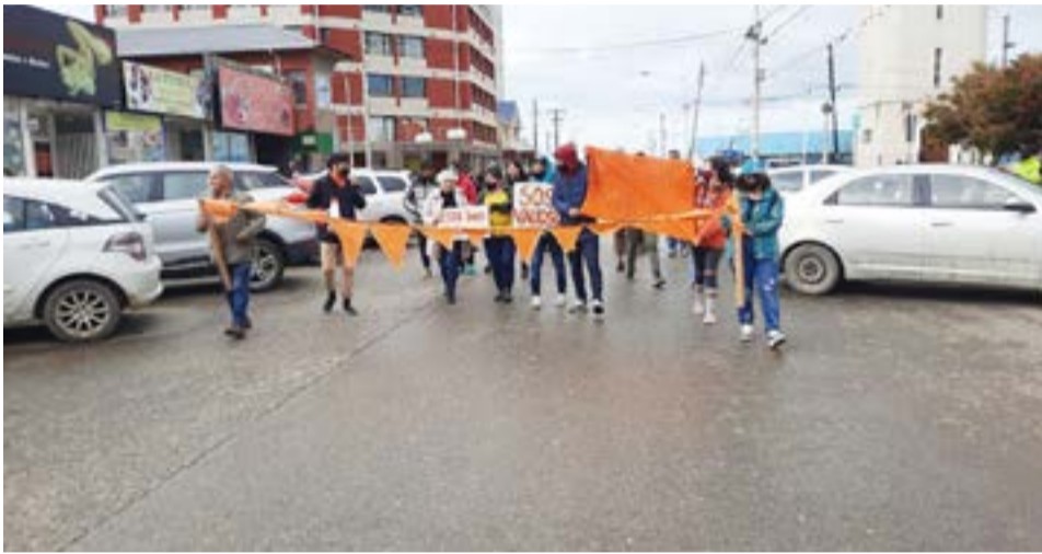
La organización “Mucho por Vivir” volvió a salir a las calles y pide una mesa de diálogo con Gobierno y Municipio de Río Grande.