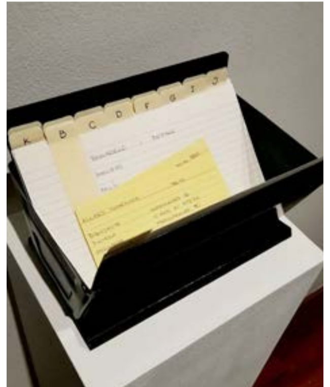
"El fichero es un testigo tangible de la violencia simbólica que rodea a estas mujeres", aseguró la artista.

Por último, la artista reflexiona: "No gané el premio, pero si expuse en el CCK y eso personalmente para mí es un montón. Gracias a los que me mandaron buenas vibras. Eso sí, como dicen en mi familia "el cielo es el límite".