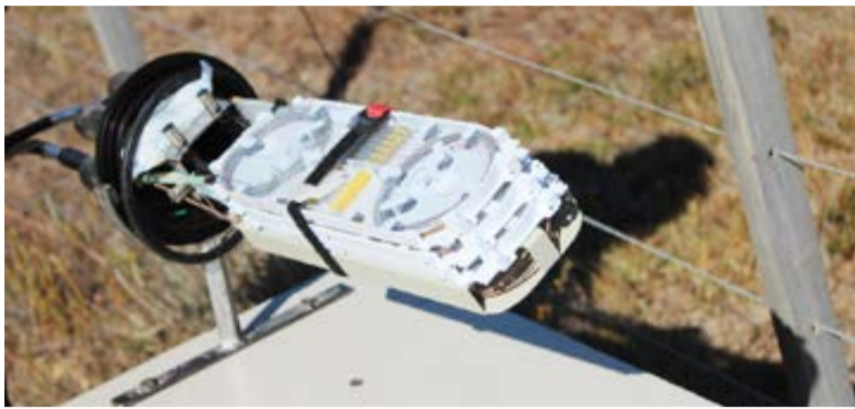
En las mediciones detectaron el corte de la fibra óptica a la altura de la avenida de Circunvalación.