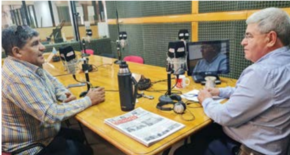
Arcando destacó el cambio que trajo la gestión de Harrington a la ciudad, luego de los tres mandatos de estancamiento de Queno. “Nosotros seguimos en la misma línea, acompañando a Daniel Harrington, y realmente hay una transformación en Tolhuin, se está planificando y hay muchas obras que se hacen que no tienen que ver con asfalto y vereda, sino que van bajo tierra, como el gas, el agua, las cloacas, y mejora la calidad de los vecinos”, dijo.

que vota. Con 5 mil votos se pueden llegar a tener tres convencionales, porque hay votos nulos, en blanco y recurridos en toda elección, por eso estimamos que con 2.500 votos positivos se puede tener un convencional. Por el sistema D’hont hay que ver quiénes entran de todos los