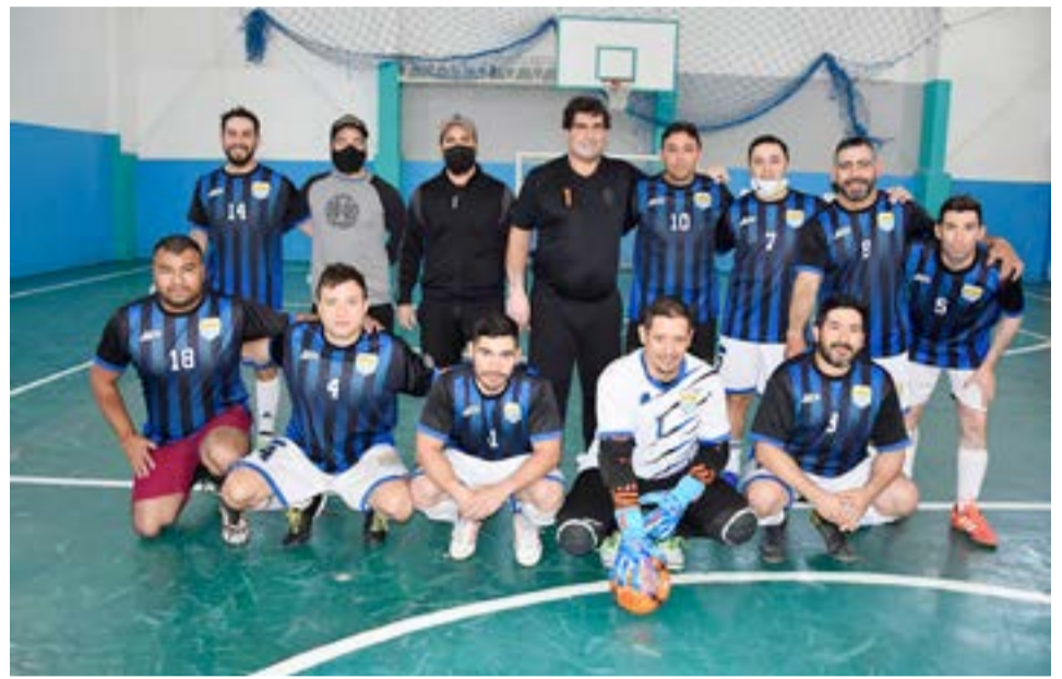
El equipo de Los Valientes, categoría libre.

Comisión de Deportes del Sindicato de Petroleros