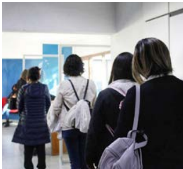
El Poder Judicial le dio la posibilidad a toda la comunidad de formar parte de la convocatoria, a quienes además acompañó en cada una de las instancias.

Cabe mencionar que, desde el llamado a inscripción para integrar la base de datos del Registro de Aspirantes, el 12 de mayo de 2021, el Poder Judicial le dio la posibilidad a toda la comunidad de formar parte de la convocatoria, a quienes además acompañó en cada una