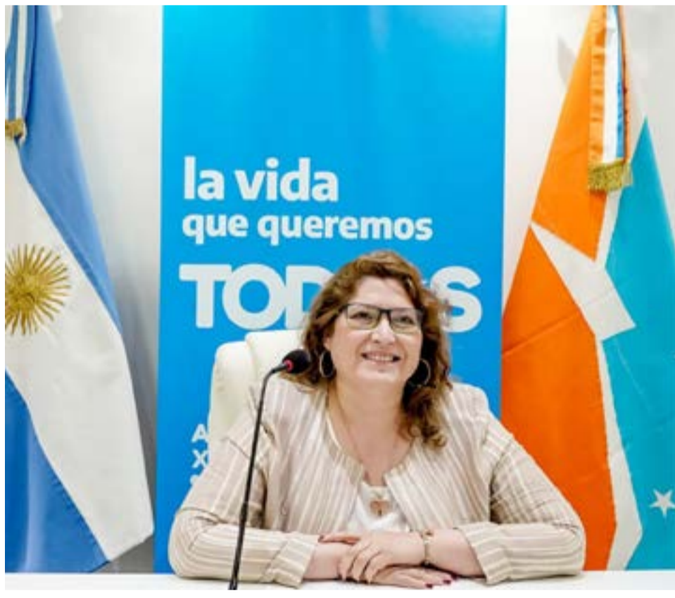
La diputada nacional Carolina Yutrovich intento justificar su votacion negativa al acuerdo con el FMI en la sesion de Diputados y aseguro que, de haber estado en riesgo la aprobacion, hubiera votado en forma afirmativa.

Cabe recordar que el proyecto fue aprobado luego mas de 13 horas de sesion, con 202 votos a favor, 37 en contra y 13 abstenciones.