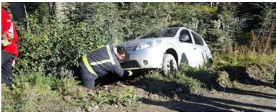
Conductor realizó una mala maniobra en una pendiente y despistó en calle Gendarmería Nacional y Cárcamo Vera de Tolhuin.