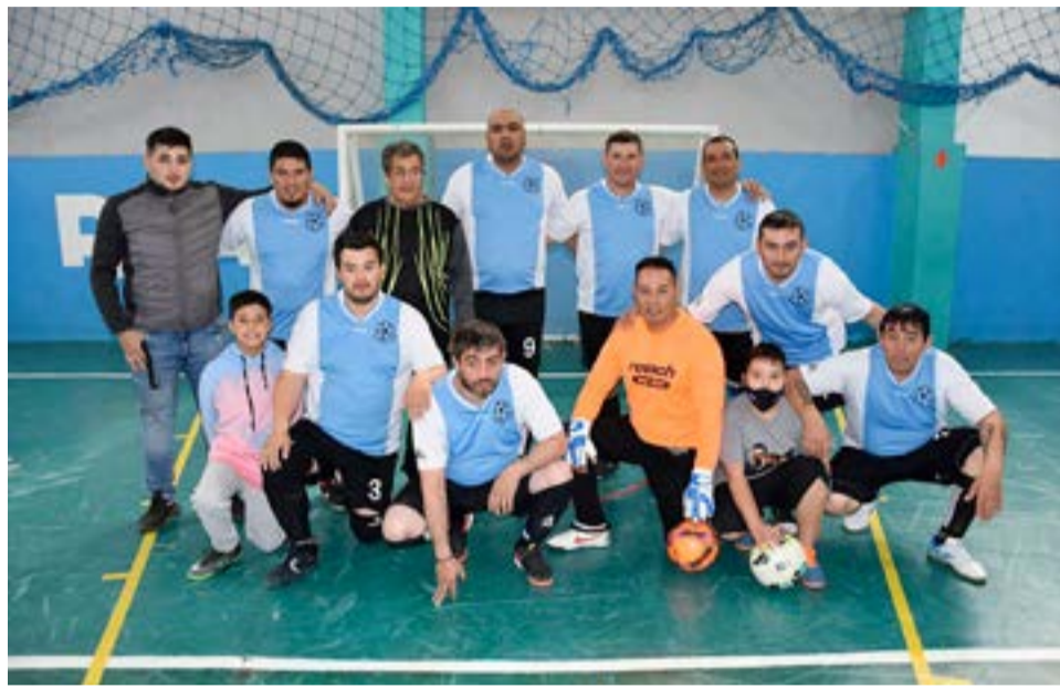
El equipo de Los Terris de Piedra, categoría veteranos.