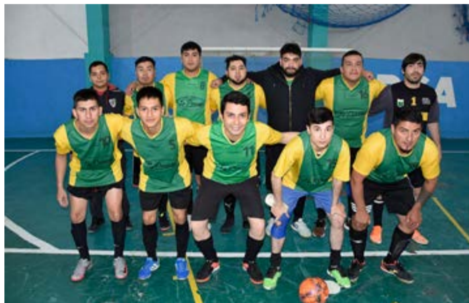
El equipo de Piedras FC, categoría libre.

Mesa y Planillaje: Israel y Josué Millacura