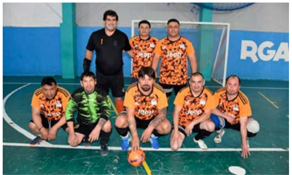
El equipo de Barrabases FC, categoría veteranos.

buen desarrollo y el esperado certamen por la muchachada futbolera que en cada edición utiliza además este evento como pretexto para juntarse entre compañeros de trabajo e intercambiar entre todos los familiares muy buenos momentos de encuentros y pasar un fin de semana de buen futsal también, y porque no después de cada encuentro y mates de por medio analizar en las tribunas junto a todos los presentes cuáles serán las próximas estrategias y la formación para enfrentar al equipo contrario en la próxima fecha, realmente se vivieron muy buenos momentos deportivos y felicitar a todos aquellos que utilizan este torneo como medio de recreación para divertirse, pa-