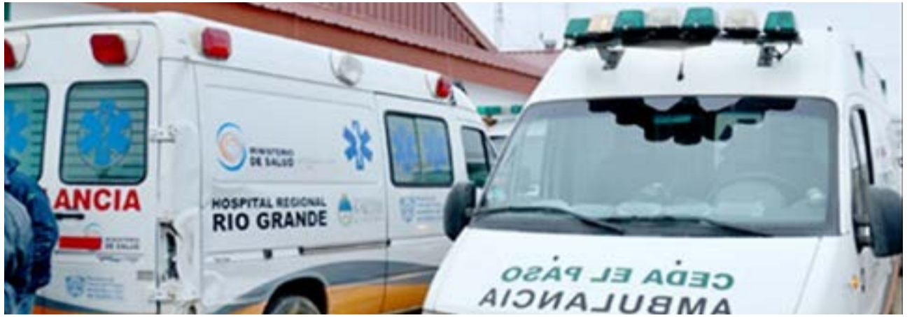
Indagaron a la joven detenida por la presunta agresión a su pareja.