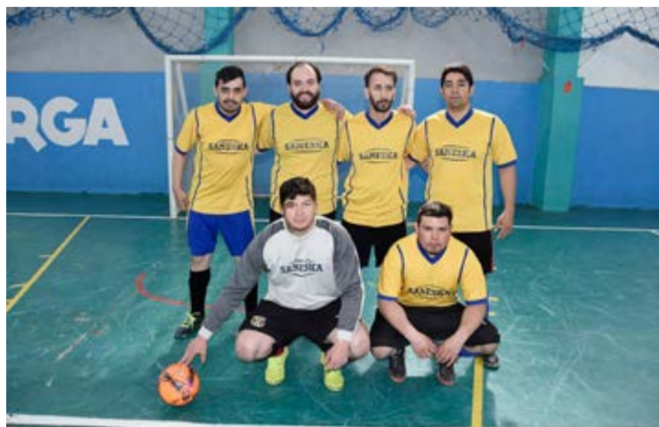
El equipo de Saneska, categoría libre.