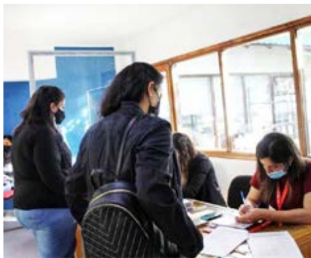
El Poder Judicial culminó exitosamente el proceso de exámenes presenciales.

La Escuela Austral de Enseñanza Bilingüe (E.A.D.E.B.) se encuentra en la búsqueda de Profesores/as de Nivel Primario y Profesores/as de Inglés. Son requisitos excluyentes: - Título docente de Profesor/a de Nivel Primario. - Título docente de Profesor/a de Inglés. - Estar inscripto en la Junta de Clasificación y Disciplina del Nivel Primario. Los interesados deberán enviar su C.V. al correo electrónico: sec_eadeb@frtdf.utn.edu.ar o escuela.eadeb@gmail.com