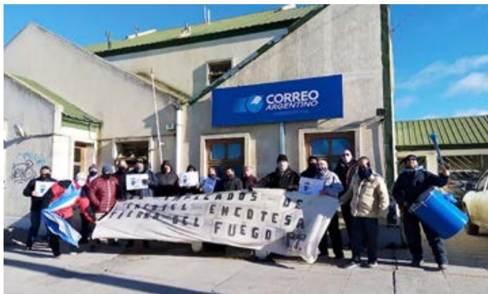
Este miércoles, los referentes de ex trabajadores y trabajadoras de ENCOTEL y ENCOTESA se presentarán en el Congreso de la Nación.