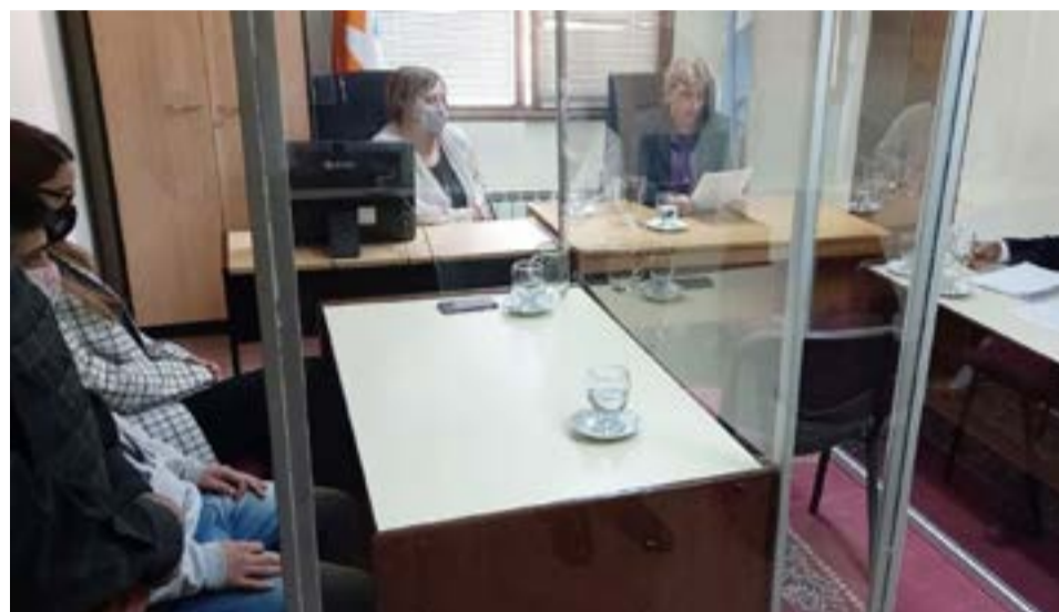
Condenaron a un hombre por lesiones leves agravadas por el vínculo y quedó en libertad.