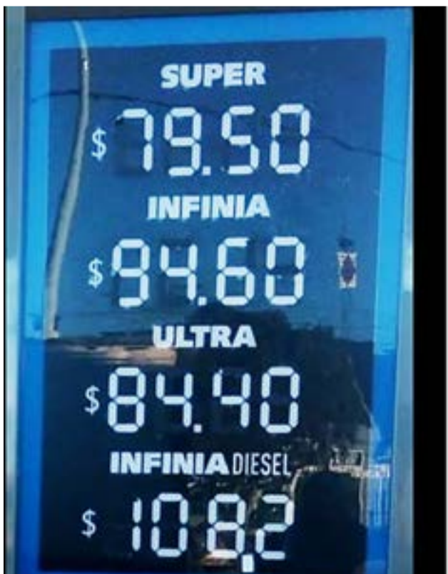
Los valores expresados en los distintos surtidores fueguinos.

Río Grande.- Los precios de combustibles se actualizaron un 9,5% para la nafta súper y gasoil, en tanto que