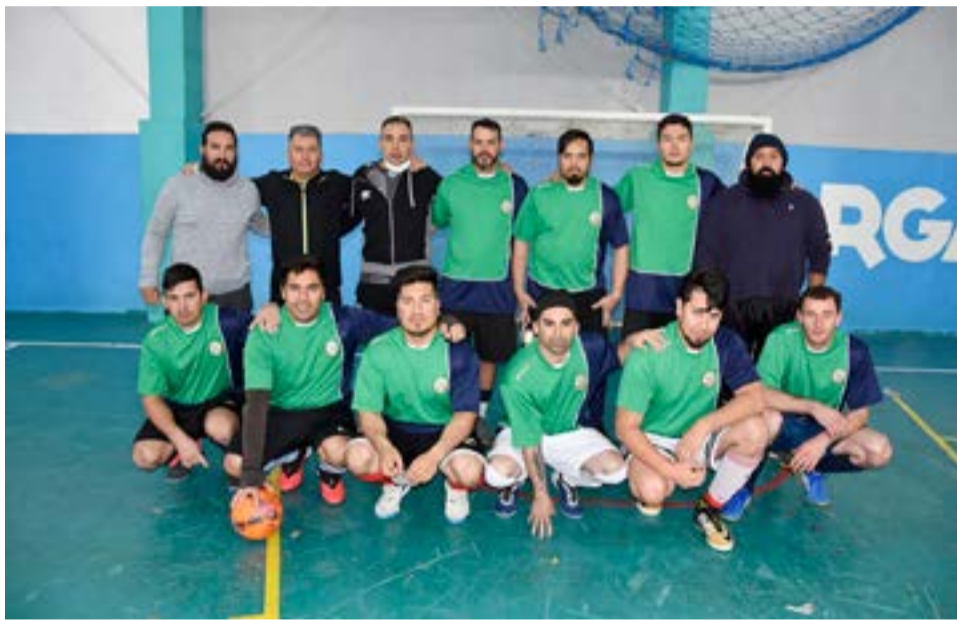
El equipo de Poliser FC, categoría libre.

Partido 2 – categoría libre – inicio: 11.00 horas