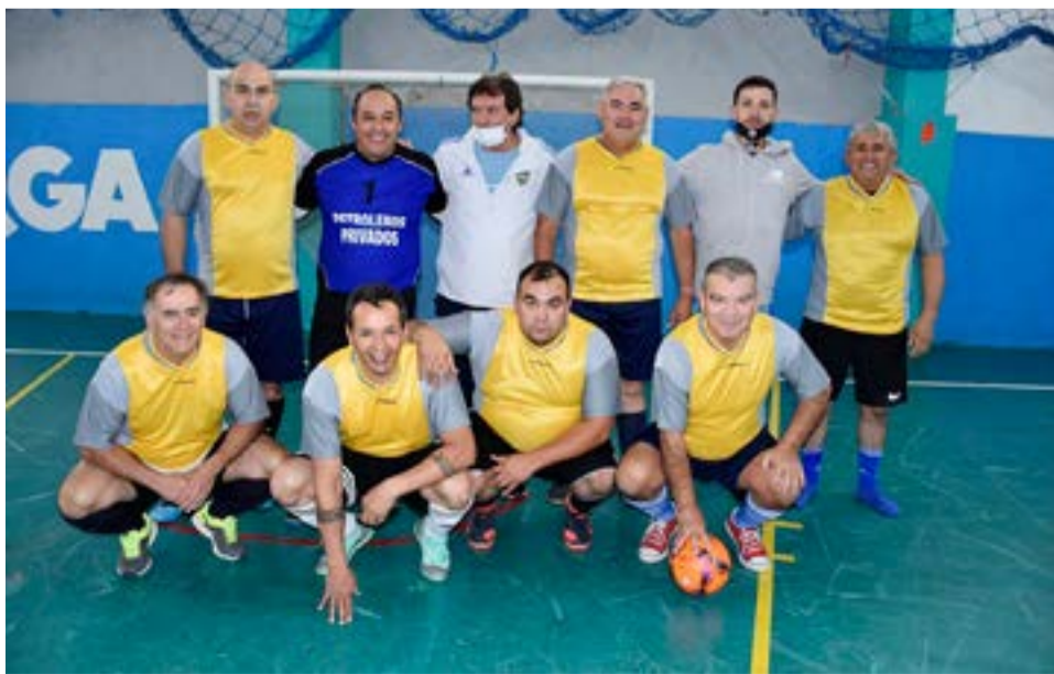
El equipo de Vikingos, categoría veteranos.