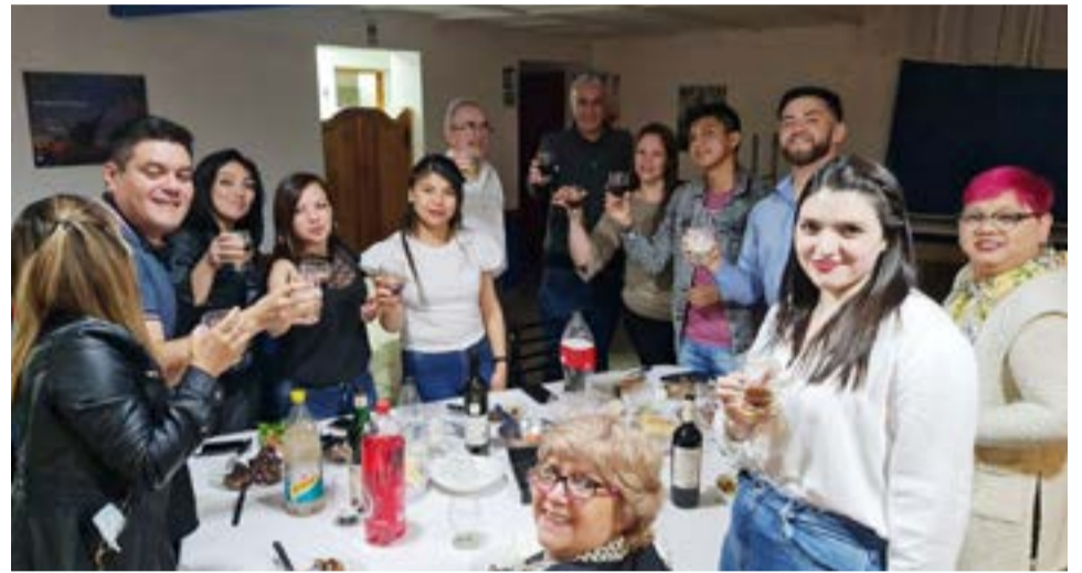
Un brindis de reconocimiento en medio de la velada.

Finalmente dijo que "ser agradecido y poder comunicarlo como una Gran Noticia que sea el testimonio para saber que tenemos y hay grandes persona/profesionales en diferentes áreas del Hospital Regional, me tocó compartir ese agradecimiento a diferentes profesionales y por eso destaco esta Gran Noticia: de poder ser agradecido"