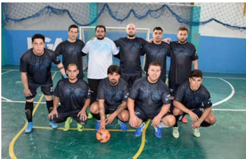
El equipo de El Rejunte, categoría libre.