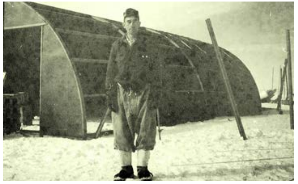
El 21 de marzo de 1951 el entonces Coronel Hernán Pujato fundaba la pionera base polar y continental San Martín.

Además, “la Base cuenta con la Plaza Histórica, que es el lugar en el que se hallaba emplazada la originaria Base San Martín (primeras edificaciones), y con el Mausoleo en el Islote Bárbara, donde descansan