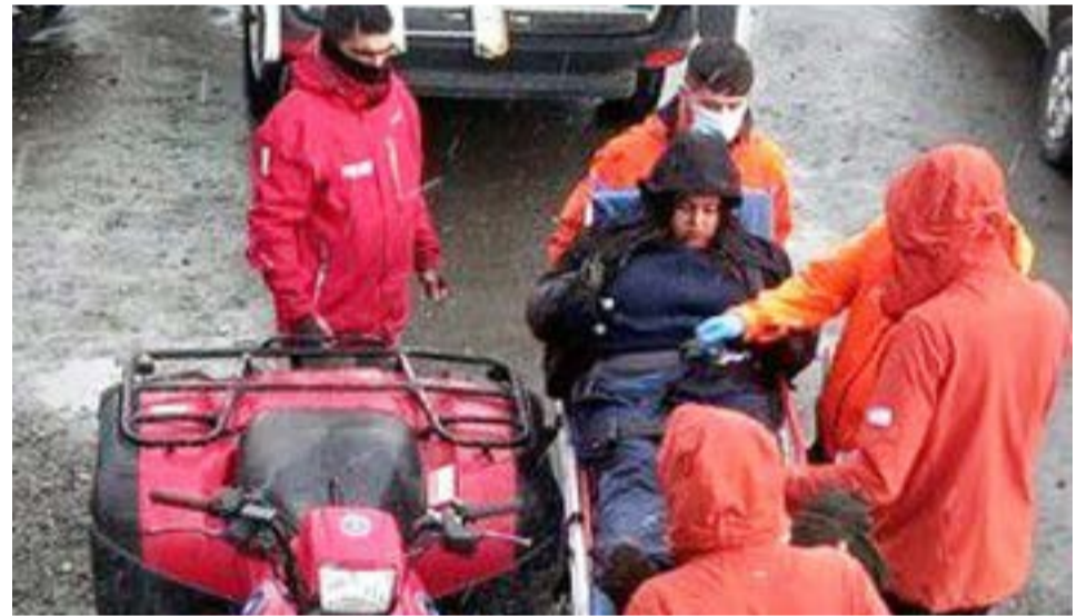
Los brigadistas salieron su encuentro apoyados por cuatriciclo todo terreno.

A las 17 horas, lograron tomar contacto con el lesionado, confirmando la fractura en un miembro inferior, por lo que se le da alerta al servicio de salud. Ya iniciada la extracción de la senda, 24 minutos más tarde, los brigadistas, equipo y el lesionado, oriundo de la ciudad