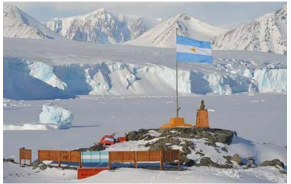
Base Antártica San Martín. Bahía Margarita. Mar de Bellingshausen. Más allá del Círculo Polar Antártico.