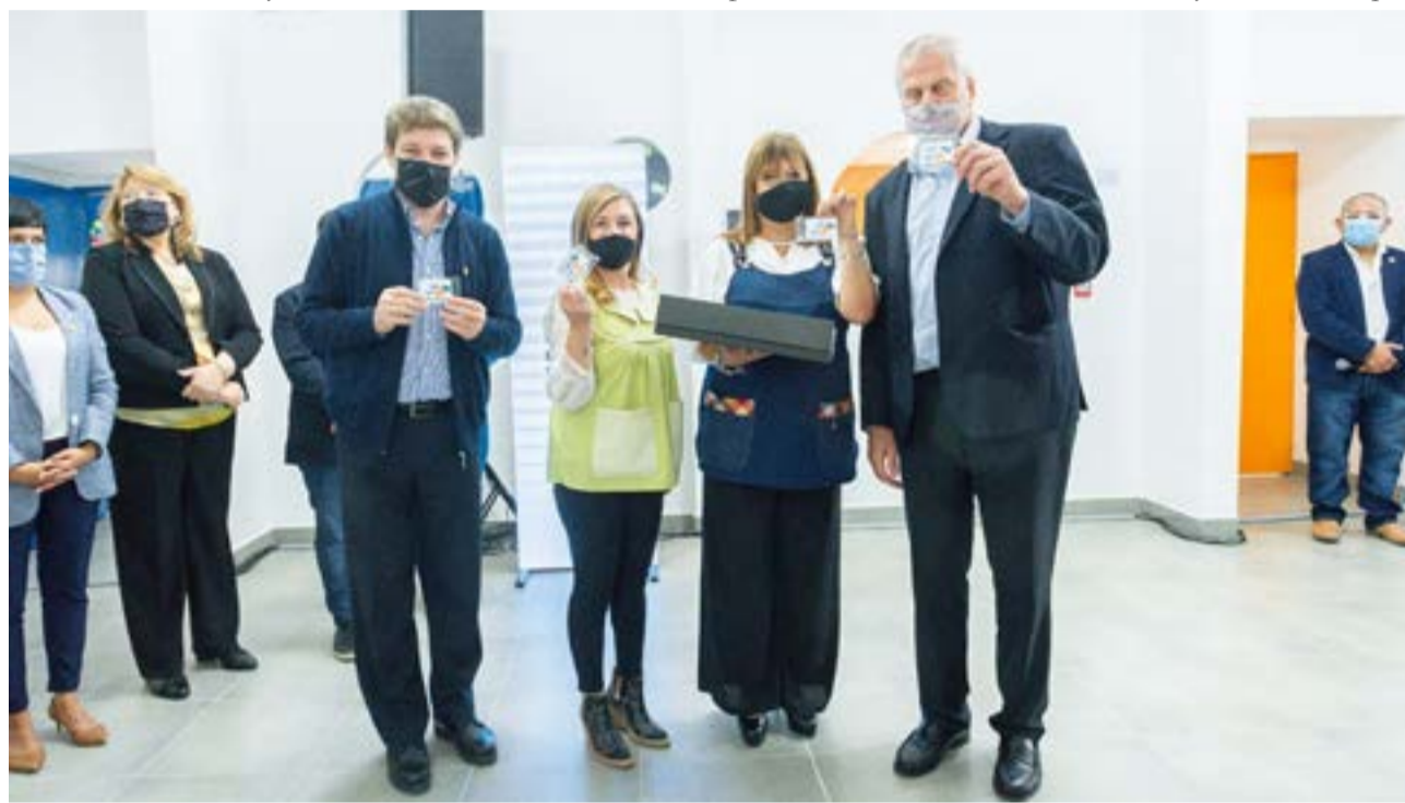
El gobernador de la provincia, Gustavo Melella, junto al ministro de Educación de la Nación, Jaime Perczyk, y autoridades del Jardín de Infantes N° 28.

Con relación al Jardín de Infantes N° 28 en el barrio Río Pipo de Ushuaia, la institución cuenta con una superficie de más de 424 m2, tres salas y dos baños equi-