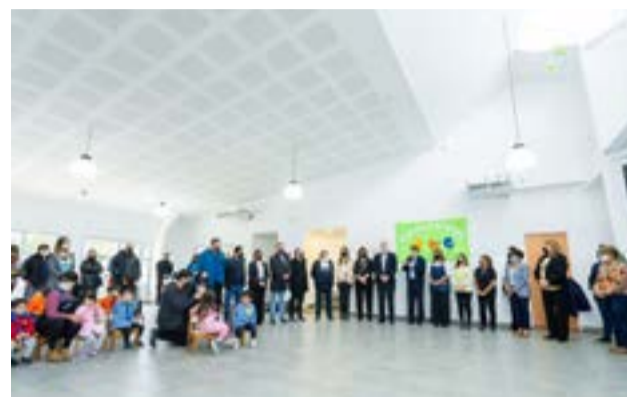
El Gobernador destacó el trabajo del equipo de gestión del Jardín "quienes tienen que asegurar el buen crecimiento de los chicos y las chicas".

A su vez, el ministro Perczyk también se dirigió al equipo de gestión del establecimiento a quienes expresó que "ustedes están iniciando un camino que muchos de estos nenes van a recorrer durante muchos años en el sistema educativo. Un camino hacia la primaria, luego a la secundaria y finalmente a un proyecto de vida. Pocas cosas son más importantes que esto que está pasando hoy acá".