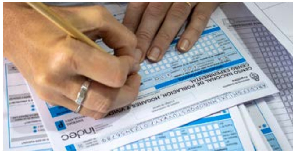
Daniels destacó que Tierra del Fuego está tercera en el Censo Nacional 2022 porque está entre las que mayor cantidad de formularios digitales completaron, en relación con la población.

Por otra parte, se lo consultó sobre el destino de los fondos que aportarán las empresas de acuerdo al decreto de prórroga del subrégimen, y la integración de la comisión asesora. “Esto lo va a manejar seguramente el área de Industria. Desde nuestra área estamos trabajando en la identificación de oportunidades. Este decreto lo que plantea es la inversión en obras de infraestructura para el desarrollo provincial y que las empresas promovidas puedan invertir en la ampliación de la matriz productiva. Nos han consultado por distintas oportunidades de inversión en la provincia, que no tienen que ver con el régimen de promoción, por ejemplo, industrias de economía del conocimiento, de la madera. Esos sectores podrán recibir aportes de la inversión que hagan las industrias para ampliar la matriz”, concluyó.