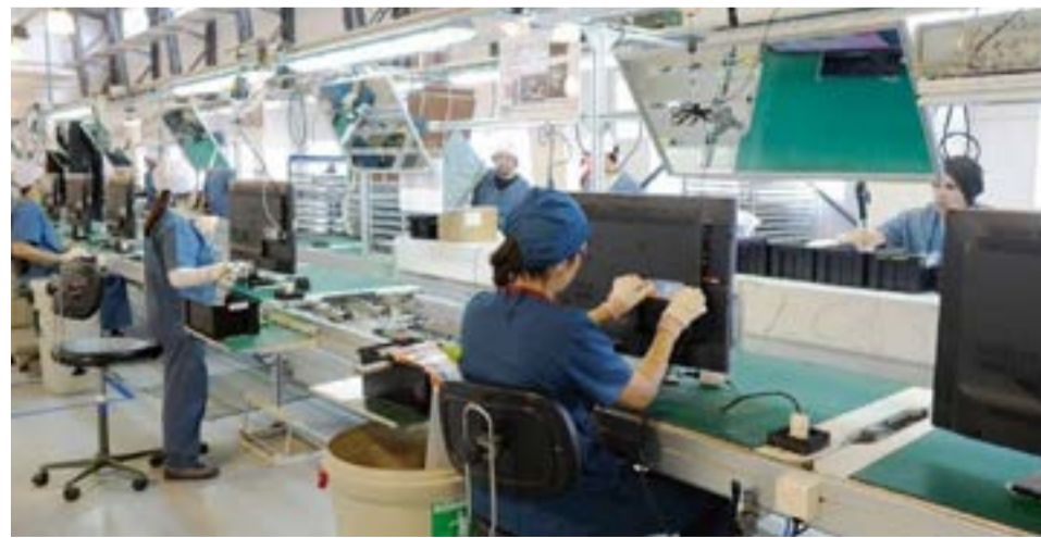
Por otra parte se lo consultó a Daniels sobre el destino de los fondos que aportarán las empresas de acuerdo al decreto de prórroga del subrégimen, y la integración de la comisión asesora.