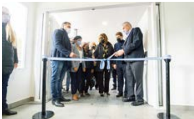
Inauguración del Jardín N° 29 ubicado en el barrio Malvinas de Ushuaia.

Asimismo, el primer mandatario provincial agradeció al Gobierno nacional por el acompañamiento, y por el financiamiento para lograr la ejecución del Jardín.