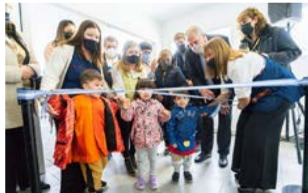
Inauguración del Jardín N° 28 ubicado en el barrio Río Pipo de Ushuaia.

A su vez, el ministro Perczyk también se dirigió al equipo de gestión del establecimiento a quienes expresó que "ustedes están iniciando un camino que muchos de estos nenes van a recorrer durante muchos años en el sistema educativo. Un camino hacia la primaria, luego a la secundaria y finalmente a un proyecto de vida. Pocas cosas son más importantes que esto que está pasando hoy acá".