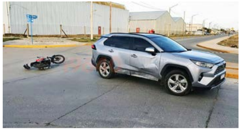
Tras la colisión, el motociclista presentó dolencias en el cuerpo y fue trasladado en una ambulancia al hospital..