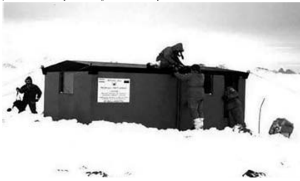
Refugio 'Ona', diseñado y construido por el Gobierno de Tierra del Fuego para el desarrollo del Proyecto 'Perito Moreno' (AWI-IAA-TDF) en los glaciares de la zona de la Base Polar argentina.