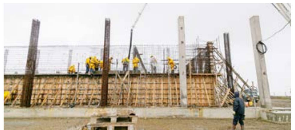
La obra beneficiará a 26.000 vecinos en una primera etapa y 52.000 en una ampliación posterior. Se comenzó a hormigonar las columnas y el perímetro de tabiques en el sector del reactor biológico.

El funcionario precisó que "en esta oportunidad se ha hormigonado el perímetro de tabiques, lo que requirió unos 80 metros cúbicos de material, y las columnas del sector del reactor biológico, donde se utilizaron 17 metros cúbicos". Explicó que, una vez concluida esta obra y la nueva planta de pretratamiento que se construirá en el sector norte de Río Grande, junto con otras obras complementarias, se logrará "el tratamiento del 100% de los efluentes cloacales de la ciudad".