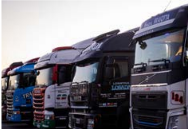
El aumento de los costos de logística de marzo ya anticipa presiones inflacionarias para abril según datos de las empresas del sector.

Buenos Aires.- El aumento de los costos de logística de marzo ya anticipa presiones inflacionarias para abril según datos de las empresas del sector. En las dos primeras semanas del mes los transportistas enfrentan incrementos del 12,5 % en salarios y del 9% en combustibles, variables que se trasladan a los precios del mes siguiente. "No creo que el índice de costos del sector de menos del