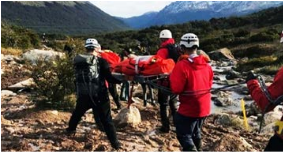
Este sábado por la tarde, la Comisión de Auxilio de Ushuaia rescató a una turista que tuvo convulsiones mientras realizaba la senda de la Laguna Esmeralda.