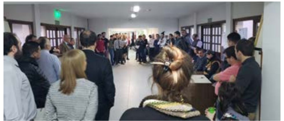
La Unión de Empleados de Justicia de la Nación convocó a elecciones, para el próximo martes 17 de mayo.

no dejamos de ser el eslabón que presidia el Poder Judicial", indica el comu-