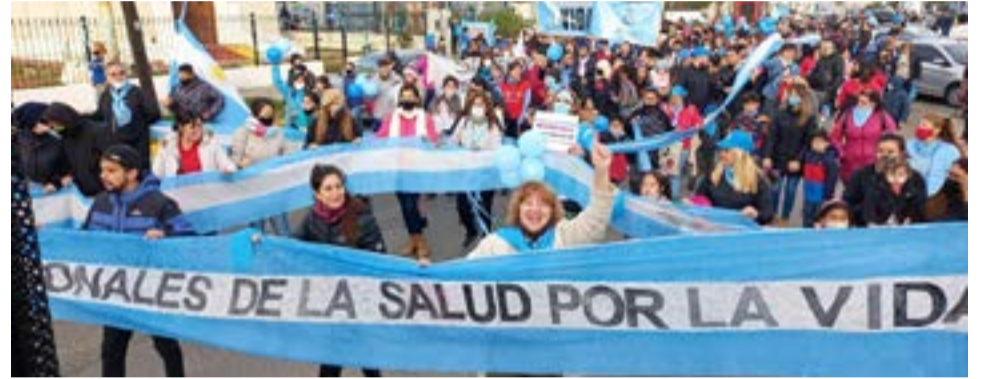
En el marco del ‘Día del Niño por Nacer’, se realizó una multitudinaria marcha por la Vida en Río Grande.

jando unidos instituciones de bien público, ONGs, como la fundación dar, fundación formar, iglesias católicas y evangélicas, asociaciones como ‘Gua-