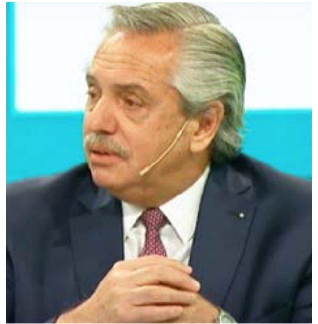
El presidente de la Nación, Alberto Fernández, dijo que no quiere “quedar bien con Dios y con el Diablo”, pero sí “que la gente pueda vivir en paz y que los precios bajen”, en relación a la “guerra contra la inflación”.

Fernández sostuvo que “hace una década que la Argentina tiene dos dígitos de inflación” y que bajarla “no es como dijo Macri, que se terminaba en 5 minutos”. “Son múltiples las causas que hay y hay que atacarlas al mismo tiempo”, explicó. También dijo que “para un gobierno como el nuestro, que está decidido a que los salarios le ganen a la inflación, es necesario que la inflación se modere”.