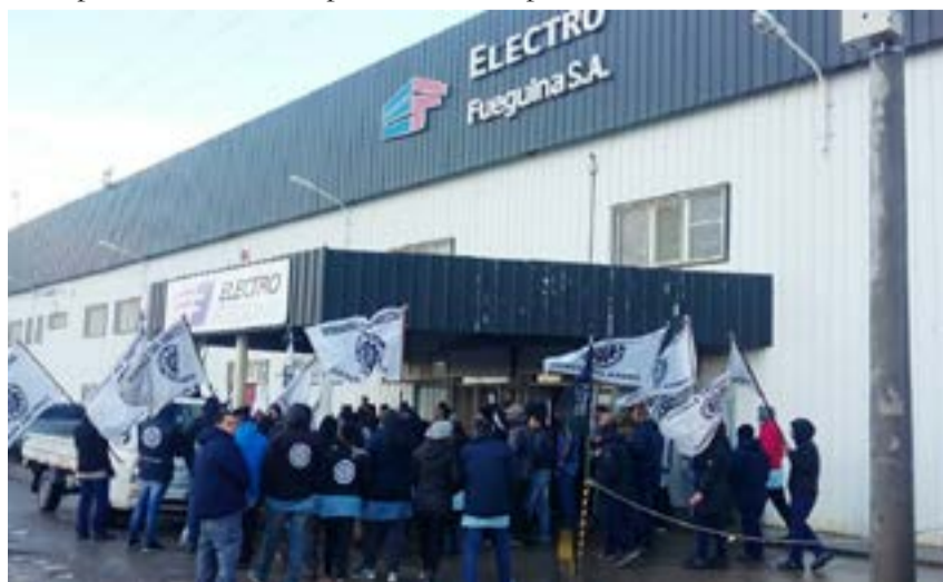
Hoy a las 23 arranca el paro de actividades que implementará la UOM riograndense, ante la falta de conformidad con la propuesta salarial de AFARTE.

dicción, también se espera presencia en la puerta de todas las plantas fabriles de la seccional mientras dure el paro de actividades.