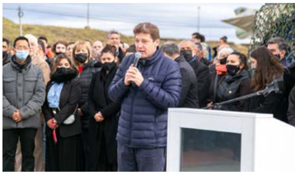
El gobernador Gustavo Melella dijo que "los veteranos son los más queridos en nuestra ciudad. Recordaba cuando años atrás el viento destruyó la carpa y con ese empuje que tienen los veteranos se volvió a poner en pie. Luego nos tocó pasar un momento muy duro como la pandemia y no tuvimos la carpa".