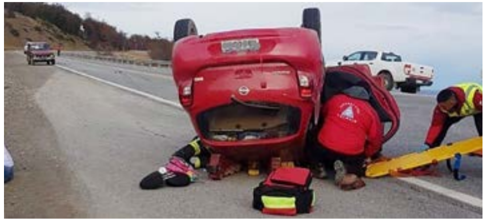
Tres personas lesionadas tras vuelco en el ingreso a Kaikén.

Se realizaron las actuaciones de rigor, con personal de Policía Científica.