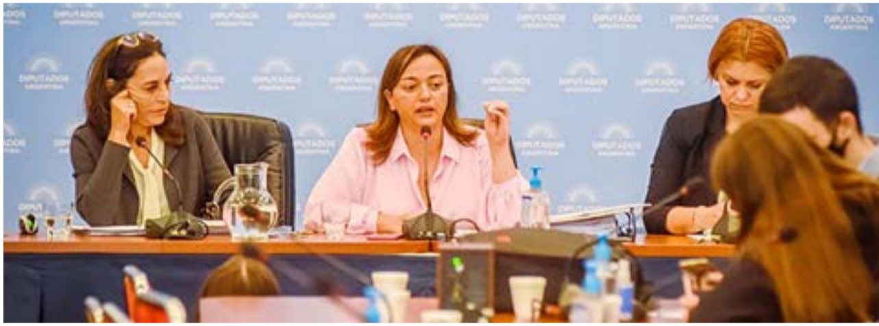
La Cámara de Diputados retomó este martes el trabajo en la comisión de legislación General para tratar los distintos proyectos que modifican o buscan derogar la ley de alquileres, sancionada en 2020. La reunión informativa contó con la presencia de 42 especialistas del interior del país que expusieron sobre la temática.

En la comisión el Frente de Todos cuenta con mayoría, ya que posee 16 de los 31 integrantes, mientras que Juntos por el Cambio suma 14 y una del interbloque Federal.