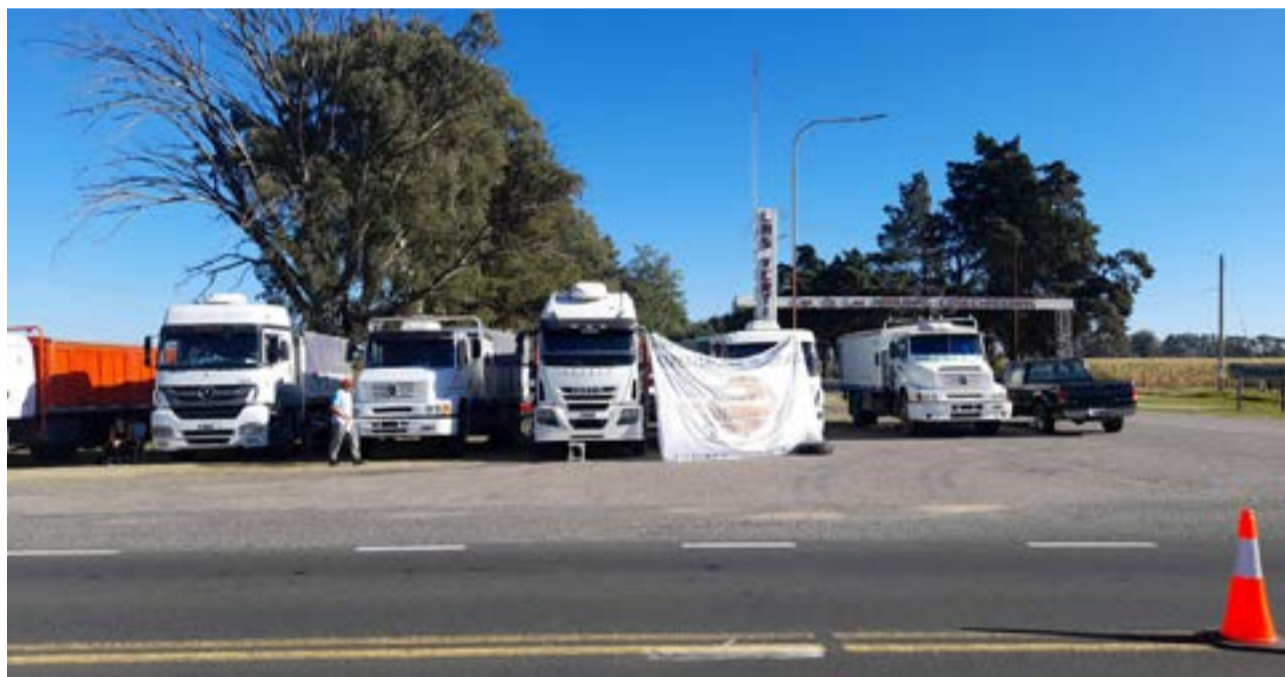
Los transportistas de granos siguen con la medida de fuerza y protestan al costado de las rutas.