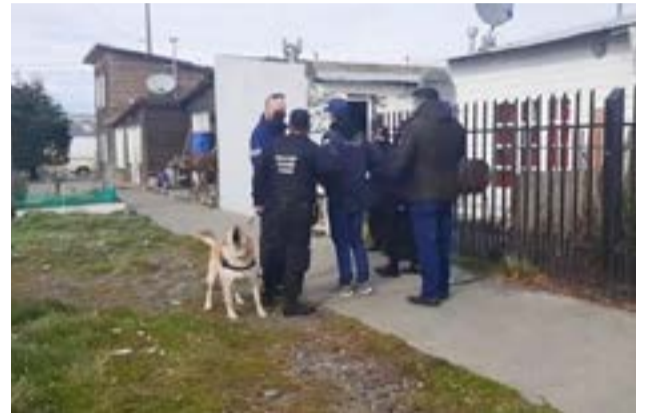
Incautan 1 kilo hachís, 100 gramos de cocaína y detienen a dos personas.

El hachís, a menudo conocido como "hash", es un producto del cannabis compuesto por preparaciones comprimidas o purificadas de glándulas resinosas llamadas tricomas. Tanto el hachís como la marihuana son parte de la misma planta, el cannabis sativa o planta de cáñamo.