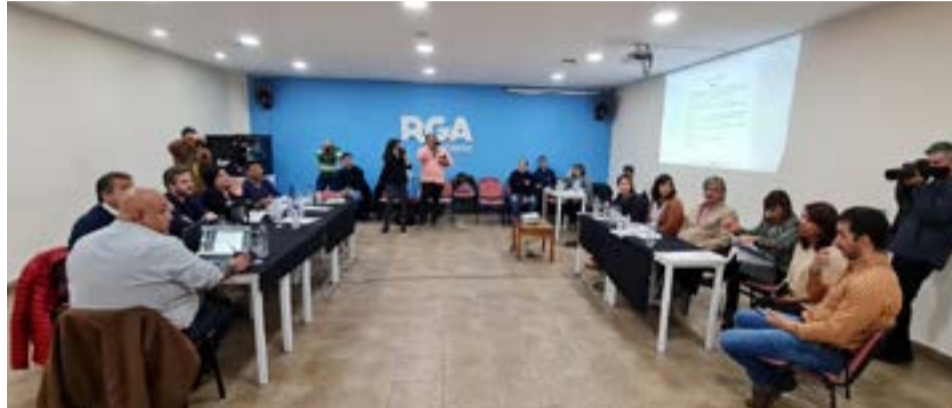
Entre los proyectos analizados en la reunión de comisión se debatieron la creación del Registro Público Municipal de Inmuebles Baldíos, Inmuebles con Edificación Derruida o Edificación Paralizada, proyecto que busca establecer plazos para que estos baldíos, edificaciones paralizadas dejen de generar problemáticas estructurales para el desarrollo urbano.