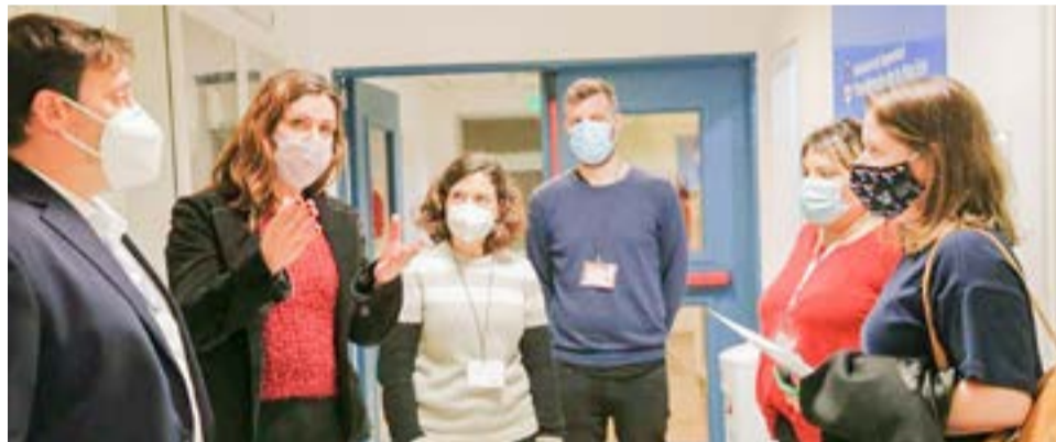
Está activa la línea 134 de reclamos y sugerencias para personal de las fuerzas de seguridad.

La Secretaria comentó que "es importante conocer en primera persona como realizan este tipo de labor para luego poder ponerlas en marcha en nuestra provincia".