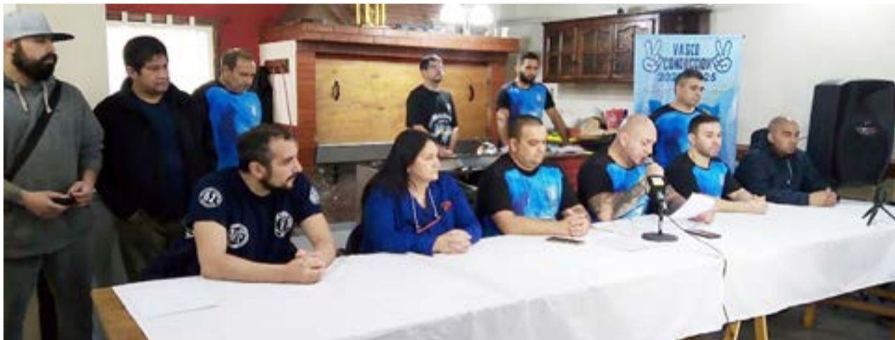
Se realizó una conferencia de prensa con representantes del SOIVA, SETIA y la AOT; donde los dirigentes de los sindicatos textiles y del vestido expresaron una marcada preocupación.

Parta finalizar expresando que "En virtud de todo lo expuesto, es que solicitamos a UD. como Autoridad Política de privilegio, recibírnos con carácter de urgente para poder tratar y revertir esta problemática, que solo busca llevar tranquilidad y que persigue como objetivo principal, gozar de la misma previsibilidad que el resto de las industrias y de fuentes de trabajo".