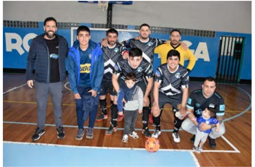
El equipo de Mutual Petroleros en la categoría libre, junto al subsecretario de Deportes Diego Radwanizer.