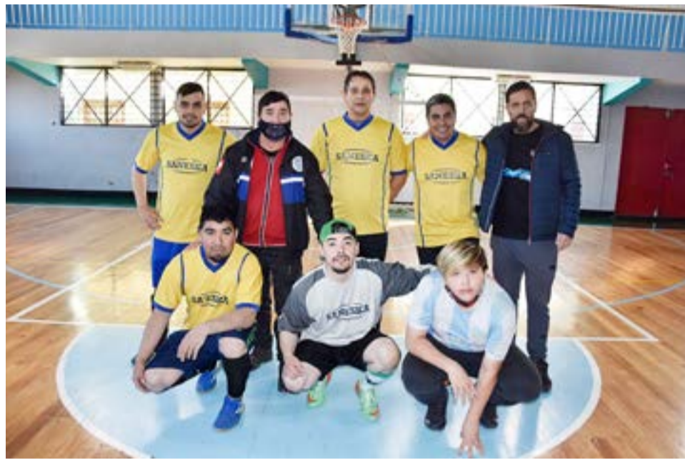
El equipo de Saneska, categoría libre junto al subsecretario de Deportes Diego Radwanizer.

Partido 4 – categoría libre – inicio: 16.00