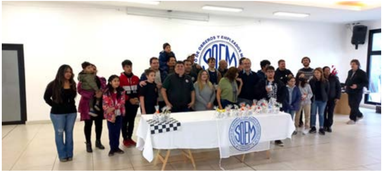
La organización del Torneo “Día del Trabajador” junto a todos los jugadores que compitieron en el certamen.