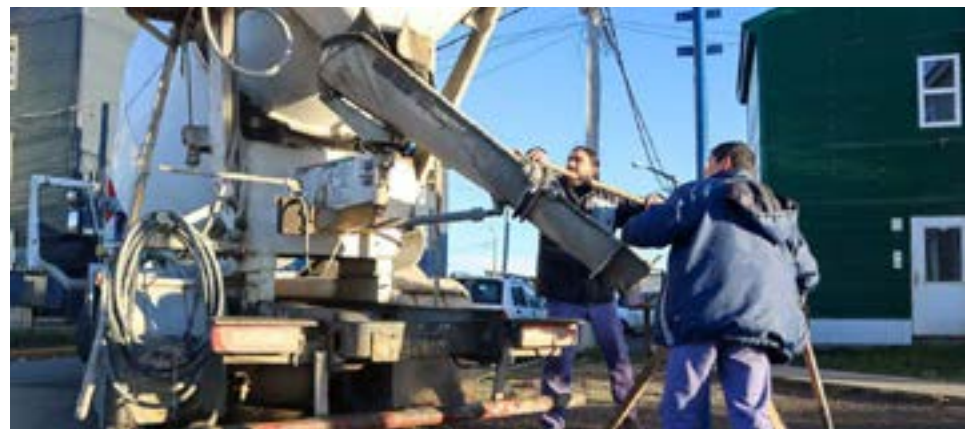
Sólo en el barrio Malvinas Argentinas fueron más de 180 los nuevos carteles nomencladores.

Sólo en el barrio Malvinas Argentinas fueron más de 180 los nuevos carteles nomencladores que se colocaron para ordenar la circulación. Cabe destacar que en el barrio, además, se dará cumplimiento a la ordenanza que estipula el cambio de sentido de algunas de las calles para mejorar la transitabilidad; tarea que se