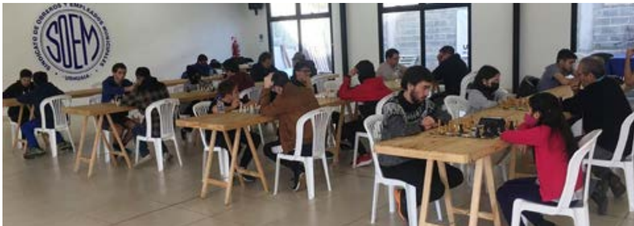
Alumnos de diferentes Escuelas de Ajedrez en plena competencia en el Torneo “Día del Trabajador”.