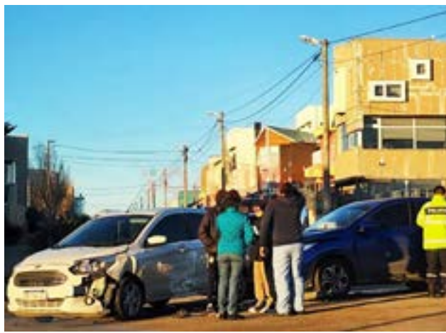
Las conductoras no presentaron lesiones, pero si se registraron importantes daños materiales sobre los vehículos.