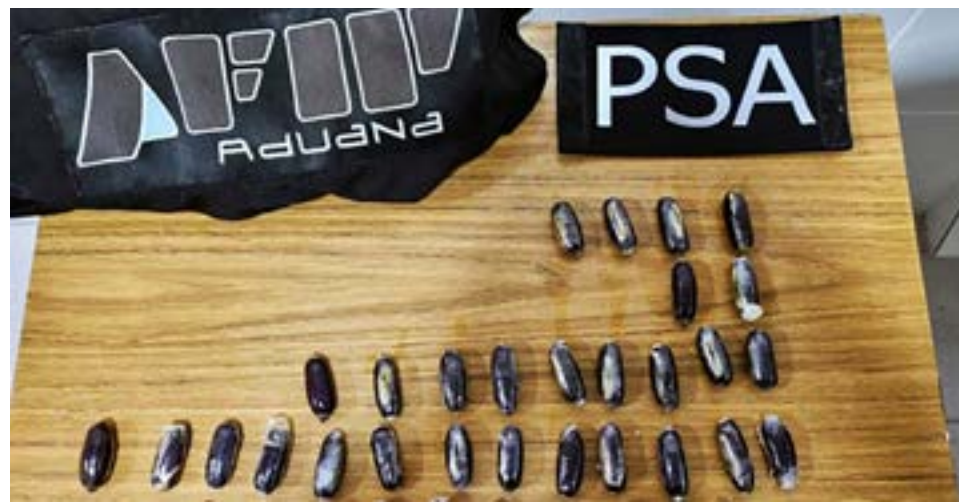
El Tribunal Oral Federal 2 de la Capital Federal lleva adelante un juicio contra cuatro hombres que captaban y explotaban a mujeres para transportar estupefacientes, en la modalidad de "mulas", las que tenían como destino final las ciudades de Río Grande y Ushuaia.

Uno de los hechos llevados a juicio se inició en septiembre de 2018, cuando personal de la Policía de Seguridad Aeroportuaria detuvo, en la zona de preembarque del Aeropuerto Metropolitano "Jorge Newbery", a una mujer que intentaba abordar un vuelo a la ciudad de Ushuaia con 850 gramos de cocaína. Así, las diligencias ordenadas evidenciaron que la