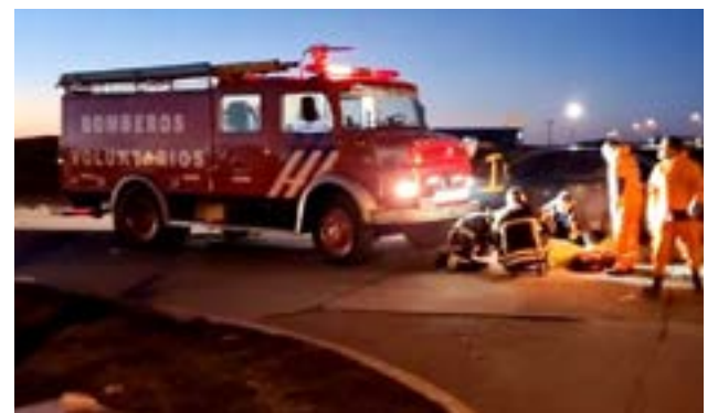
Atropellaron a una persona sobre calle Echelaine del barrio Aeropuerto.