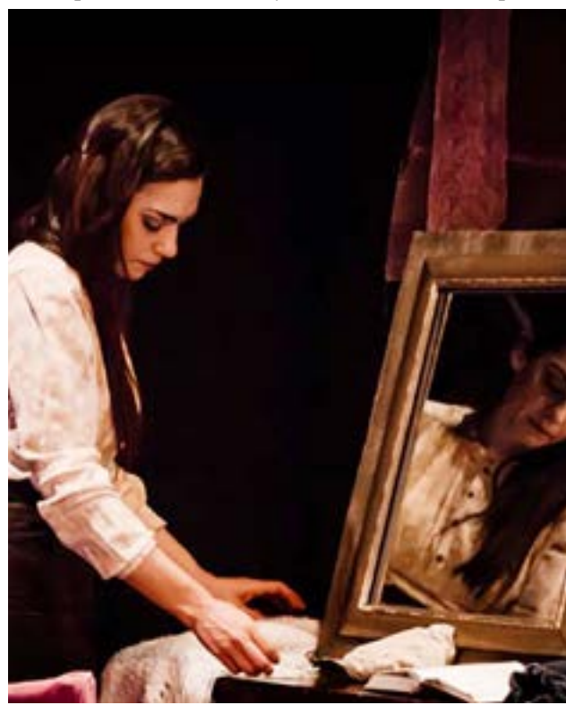
“Mary Ann Dunne” será una de las obras que se presentará en la Casa de la Cultura.

Río Grande.- Desde el inicio de la gestión, el Municipio implementa diversas políticas públicas con el fin de ampliar la estructura y oferta cultural, en pos de