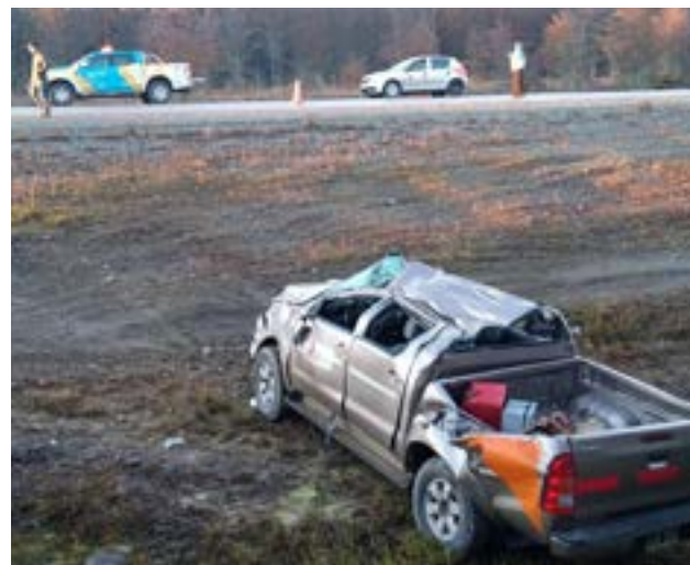
Dos empleados del IPV protagonizaron violento despiste y vuelco sobre la ruta 3.

Ambos ocupantes fueron trasladados al Hospital Regional Ushuaia para su atención, y en el lugar se realizaron las diligencias de rigor.