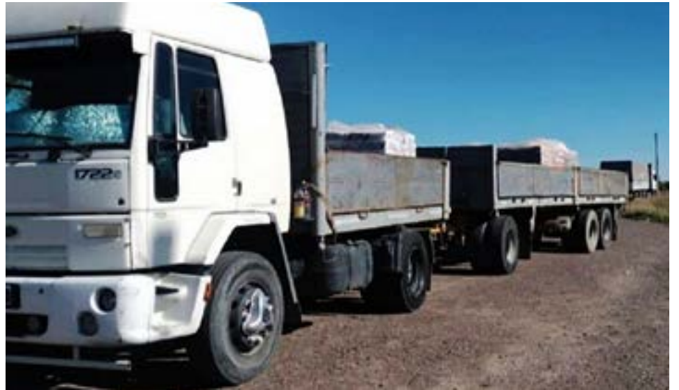
Autoridades judiciales procedieron a ingresar los datos del rodado a la App RN Seguridad Activa y se constató que el acoplado presentaba un pedido de secuestro por el delito de contrabando.