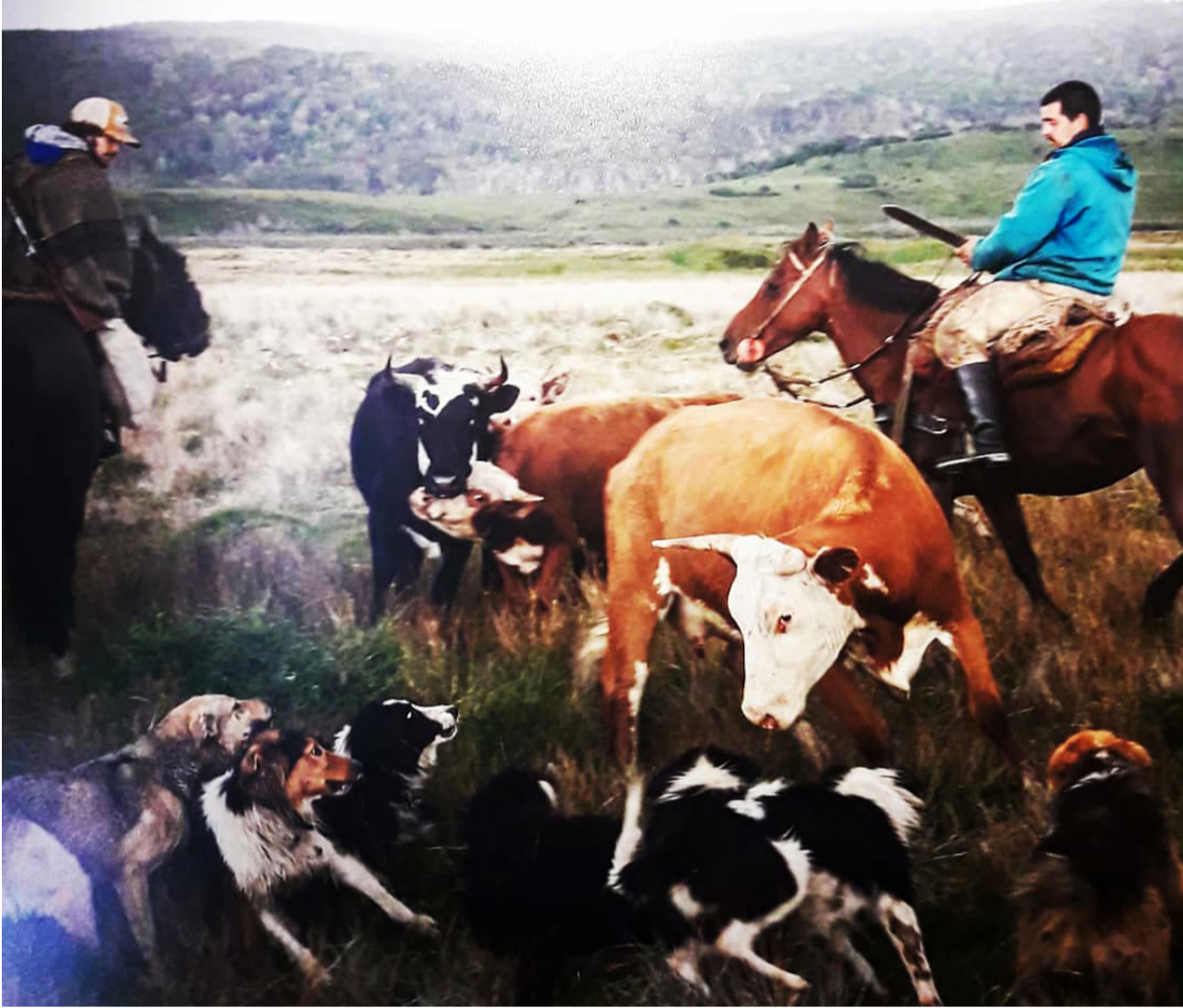
Un arreo de ganado en Estancia Policarpo. Parece una pintura pero es una fotografía.