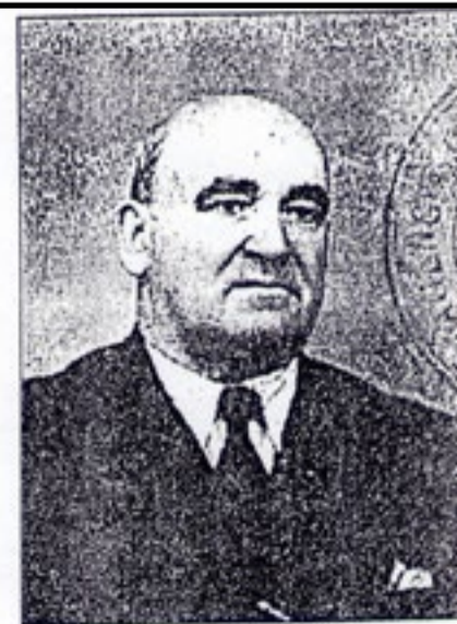
Don Ruperto Bilbao, primer Gobernador fueguino, en un recorte periodístico de 'La Baskonia'; publicación vasca de hace 44 años hoy.

Francisco Xabier Bilbao Garitaigotia, benefactor del sur argentino y héroe anónimo del caserío basko.