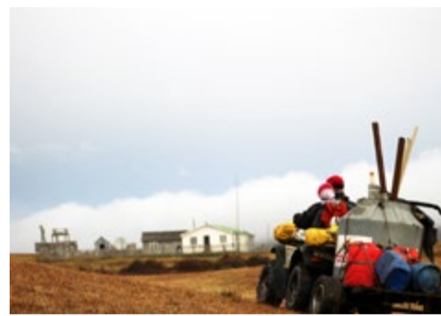
El acceso a Estancia Policarpo sigue siendo difícil. Imagen reciente de transporte de víveres.

Hasta finales de la década del 70 todo se abastecía y explotaba fundamentalmente por vía marítima. El barco llegaba una vez por año para recoger la zafrá y dejar las provisiones y materiales necesarios para el año siguiente. La estancia llegó a tener más de 8.000 cabezas de ganado ovino y un galpón de esquila para más de 800 animales. En ese momento la mano de obra para los trabajos rurales era abundante y calificada. Esquiladores, puesteros, ovejeros, carpinteros etc. no faltaban.