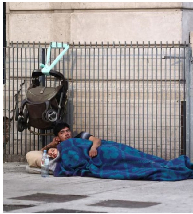
El Observatorio de la Deuda Social Argentina analizó el "efecto estadístico" de la medición del Indec que explicó, en parte, el fuerte descenso de la pobreza y la indigencia de este año.

Sin embargo, desde el cuarto trimestre de 2023 y el