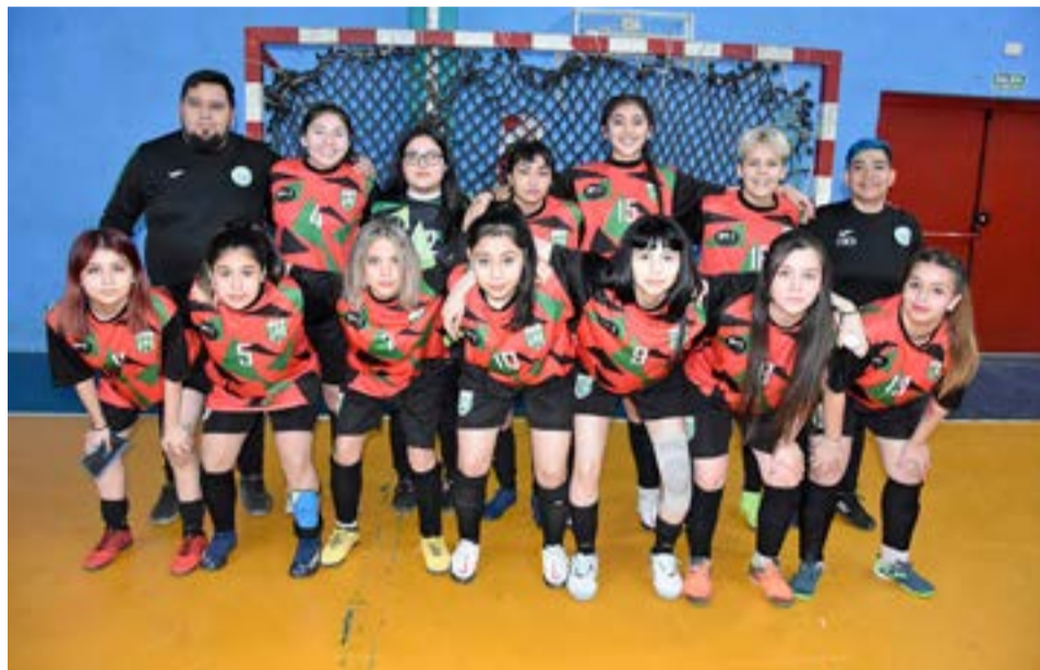
El equipo de Camioneros, 3ra división femenina.