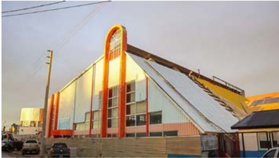
El Municipio de Río Grande se encuentra ejecutando los últimos trabajos de refacción y puesta en valor del natatorio municipal "Eva Perón".

Cabe destacar que los trabajos que se llevaron adelante, debieron hacerse desde cero por el estado en el que se encontraba