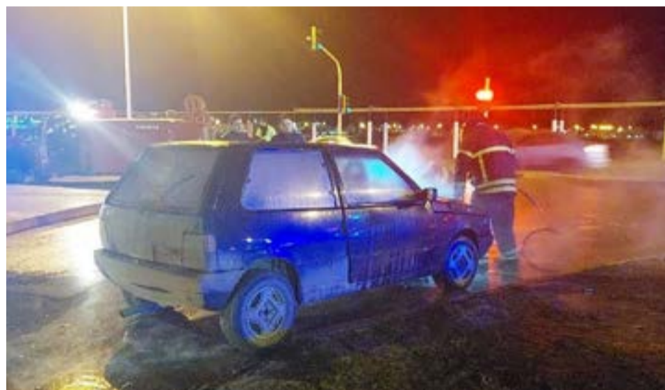
Un automóvil se prendió fuego mientras circulaba por avenida San Martín de Río Grande.

Según se pudo saber, el vehículo comenzó a incendiarse a raíz de un desperfecto eléctrico en el sector de la batería. Intervino personal de Bomberos de Policía y Voluntarios, quienes controlaron el ígneo a la brevedad.