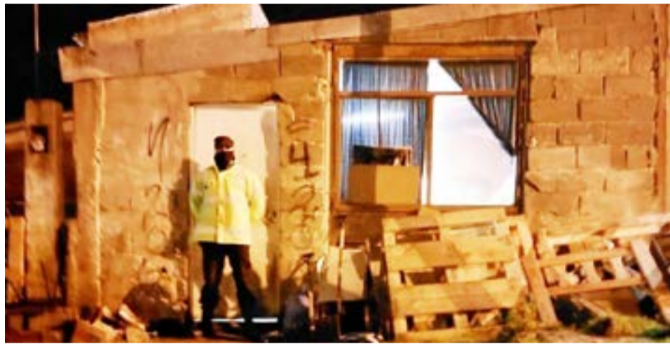
Un joven de 17 años fue identificado como presunto autor de al menos dos ilícitos en Ushuaia.

Finalizadas las medidas, en uno de los procedimientos, se secuestraron prendas de vestir y teléfonos celulares. En tanto el segundo allanamiento arrojó resultado negativo. Se notificó de prohibición de acercamiento y contacto del menor para con las víctimas y testigos.