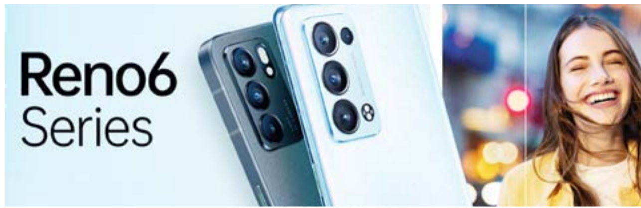
Los teléfonos móviles de Oppo se destacan por su gran relación de precio y calidad.

Xiaomi creció respecto al 2021, con el envío de 4,3 millones de unidades, con una cuota del 14% del mercado. Mientras que Apple envió 1,5 millones de iPhone, Oppo