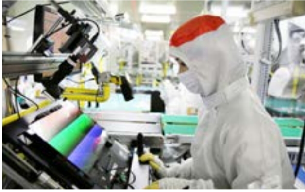
Creció fuerte la producción de los monitores para computadoras respecto a abril, dato que se consolida cuando se lo compara con los registros de mayo del año pasado

Río Grande.- Datos provisorios difundidos por la Secretaría de Industria, muestran que en mayo creció fuerte la producción de los monitores para computadoras