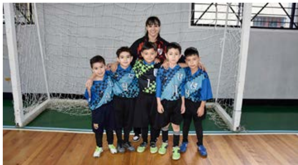
El equipo de Los Troncos, 9na división.