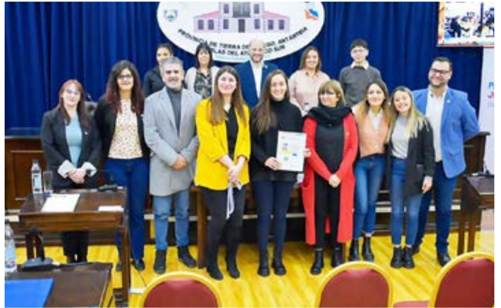
El Modelo de Estatuto para Centros de Estudiantes y Organizaciones Estudiantiles brindará la posibilidad de garantizar que todas las instituciones educativas de la provincia pertenecientes al nivel secundario den lugar a la conformación de centros de estudiantes y organizaciones juveniles.

*Para más información, puede visitar las redes sociales de JuventudesTDF y EducaciónTDF.