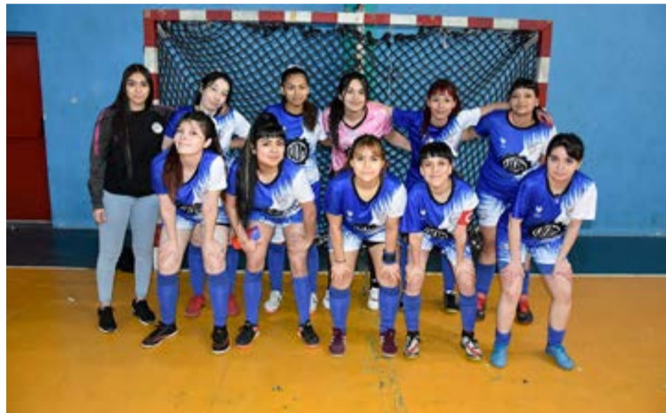
El equipo de Metalúrgico, 3ra división femenina.