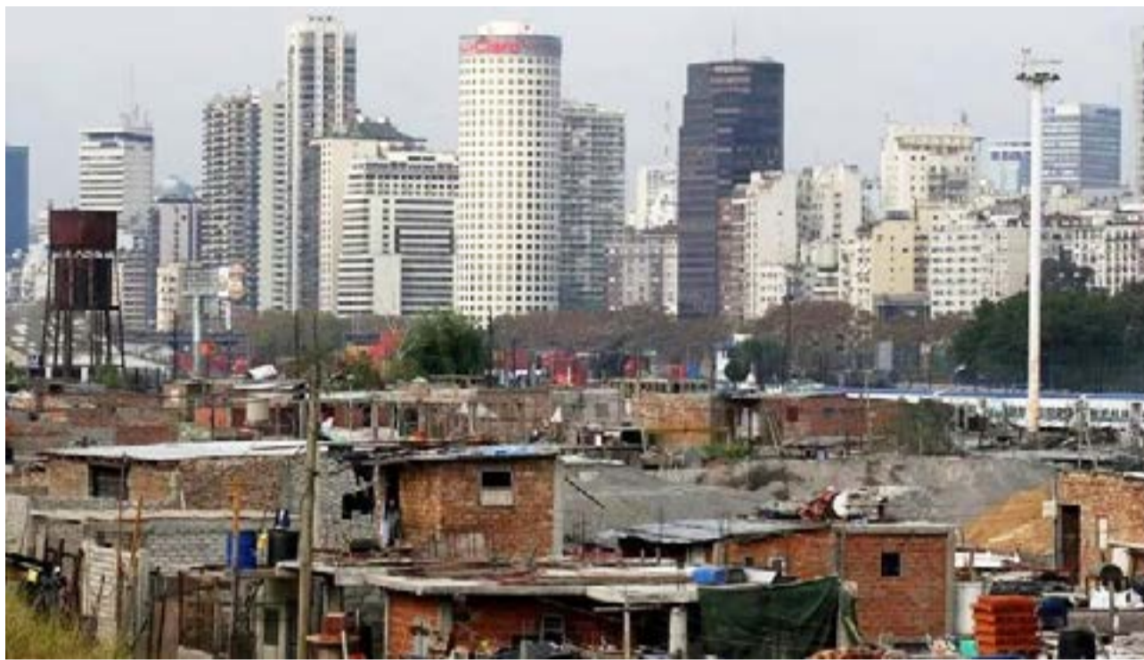
Pese a la inflación récord, la pobreza bajó a comienzos del 2022, según centros de estudio que realizan estimaciones en base a datos de distribución del ingreso del Indec.

Consultado por Ámbito acerca de qué factores pudieron haber explicado una baja de la pobreza a principios del 2022, en un contexto de elevada inflación, el investigador del Cedlas explicó: "Hubo un aumento de