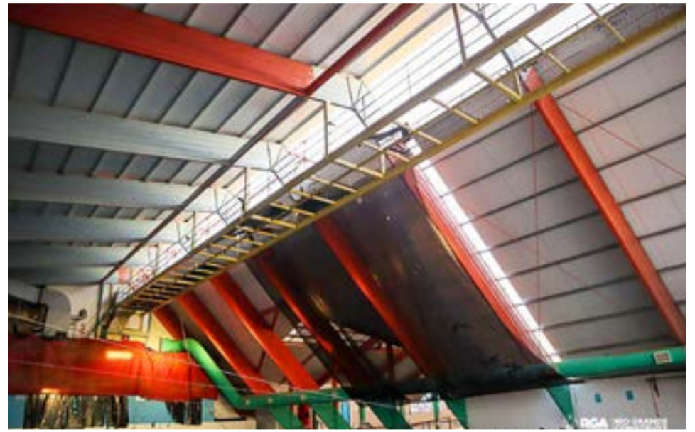
Además del techado a nuevo, se procedió a poner en valor todo el edificio, con trabajos interiores de pintura, reestructuración de los vestuarios, entre otras tareas.

Respecto al tipo de intervenciones que se llevaron adelante, desde la Secretaría de Planificación, Inversión y Servicios Públi-