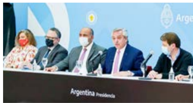
El Fondo para la Ampliación de la Matriz Productiva Fueguina - (FAMP-Fueguina) se crea en el marco de la prórroga del Subrégimen Industrial firmado por el presidente Alberto Fernández.

talación de bienes de capital, la fabricación de bienes, la provisión de servicios, el financiamiento de obras de infraestructura o de capital de trabajo de nuevos proyectos estratégicos, cuyo objeto sea la ampliación de la matriz productiva y que mejoren la competitividad en la Provincia de Tierra del Fuego, Antártida e Islas del Atlántico Sur".