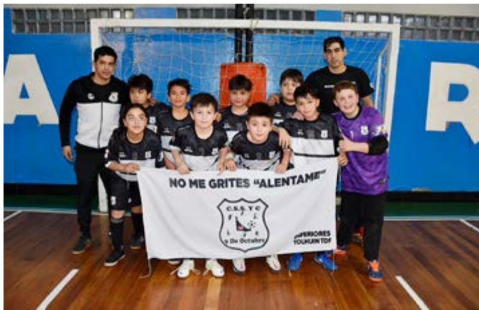
El equipo de 9 de Octubre (Tolhuin), 7ma división.