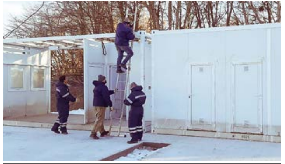
Desde el ministerio de Obras y Servicios Públicos indicaron que este miércoles arribaron a la localidad de Tolhuin los primeros componentes para instalar el nuevo hospital modular, el cual contará con una superficie de 975 metros cuadrados.

La funcionaria agregó que el plan de trabajos prevé la instalación paulatina de los módulos durante el mes de julio, es-