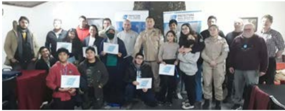
Todos los competidores de las categorías sub-12, sub-16 y libres que participan en el Torneo 212° Aniversario “Día de la Prefectura Naval Argentina”.

emblemática institución que ya conmemoró doscientos doce años ininterrumpidos custodiando la soberanía de nuestra querida República Argentina, se disputó el Torneo Abierto Aniversario “Día de la Prefectura Naval Argentina” por sistema Suizo a cuatro rondas y con un tiempo de reflexión de doce minutos más dos segundos por jugada junto a las categorías sub-12, sub-16 y libre con inscripción libre y gratuita y el arbitraje a cargo de Vicente Pozzoli y César Colantonio, que además el establecimiento castrense acompaña de forma perma-