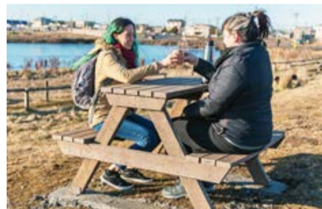
El mobiliario urbano es fabricado por la firma "Mak Plast".