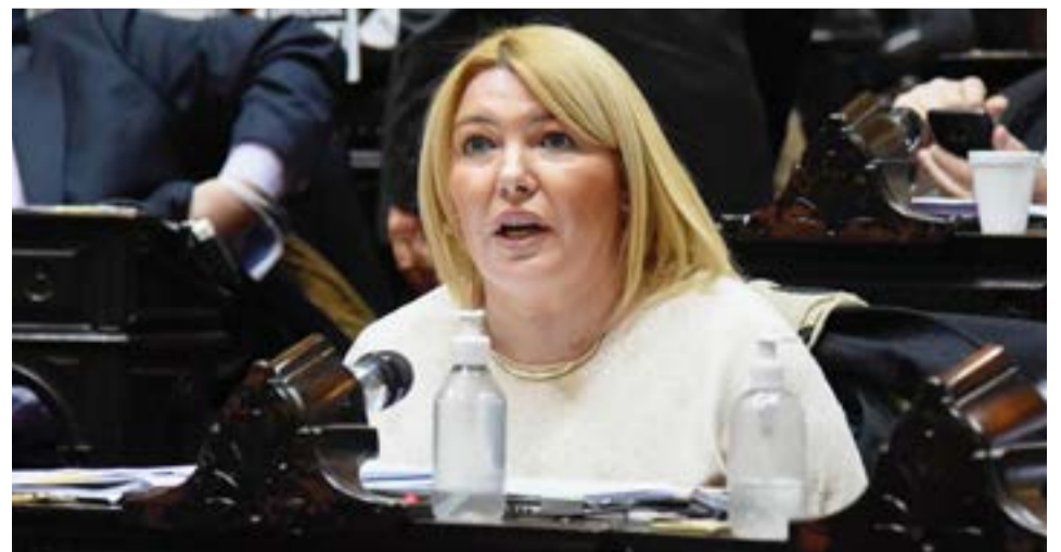
Con la aprobación de esta iniciativa “se nos abre nuevamente la oportunidad de seguir creciendo y consolidar nuestra provincia grande mejorando la calidad de vida de nuestros habitantes”, señaló Bertone.

“Pienso que se trata de dos iniciativas muy importantes que permiten promover las inversiones, la producción y el empleo”, señaló la diputada fueguina y agregó “en cuestiones como éstas los fueguinos tenemos que estar unidos porque se trata de defender las herramientas que nos permitan crecer y pensar en un proyecto sólido de desarrollo a mediano y largo plazo para nuestra provincia”.