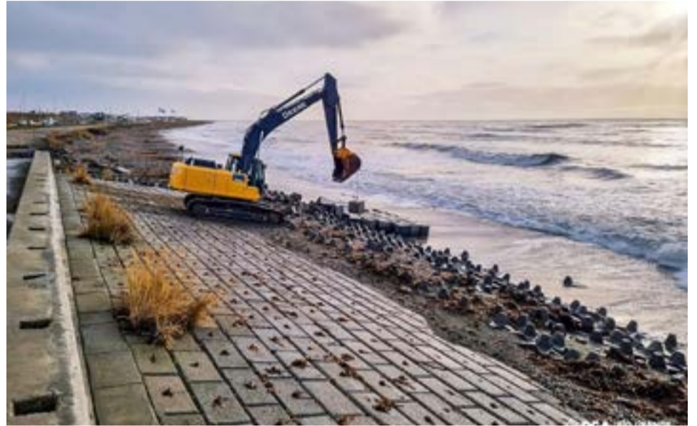
La obra alcanza una inversión aproximada de los 2.000 millones de pesos y será financiada por el Gobierno nacional.

Finalmente destacan que esta obra, que alcanza una inversión aproximada de los 2.000 millones de pesos y será financiada por el Gobierno nacional, es de suma importancia para la defensa costera, como así también para el mejoramiento del entorno urbano. Una obra más que se logra para brindar mejor calidad de vida a los y las riograndenses, generando impacto en la estructura de la ciudad y ofreciendo espacios públicos para el bienestar de toda la comunidad.