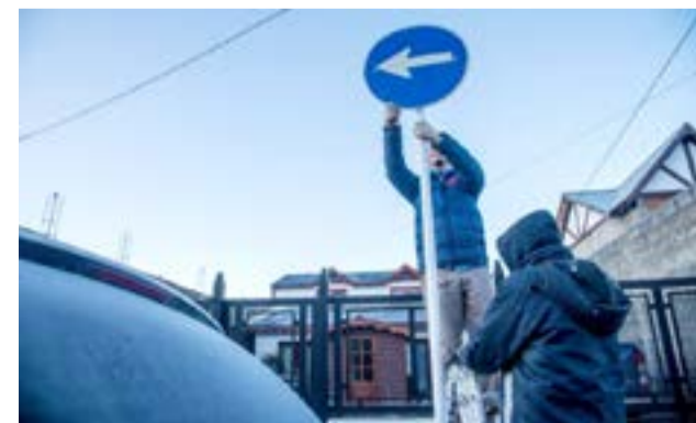
Inspectores de la Dirección de Tránsito acompañaron en el ordenamiento del tráfico durante el cambio de circulación.