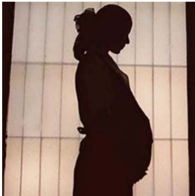
Ushuaia: Niegan la prisión domiciliaria a una mujer que cursa el octavo mes de embarazo.

Este tipo de prácticas del Poder Judicial ponen en evidencia la necesidad de llevar adelante una reforma judicial feminista. Y también nos obliga -como sociedad toda- a pensar qué garantías concretas estamos dando a las mujeres que son víctimas de violencia de género. Porque es a través de los actores que forman parte de las instituciones del Estado que se imparten esas supuestas garantías y que hoy, lamentablemente, NO EXISTEN”, indican para concluir el comunicado.