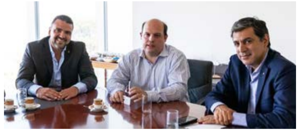
Los vuelos serán todos los lunes y viernes, con un viaje inicial el 8 de julio desde San Pablo y el regreso desde Ushuaia, también en forma directa, está previsto para los días domingos y jueves.

vo, tan importante para nuestra ciudad”, dijo Bello. “Aerolíneas Argentinas es nuestro gran socio aerocomercial para la