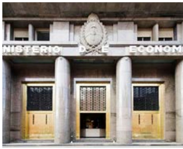
Ministerio de Economía envió este miércoles al Congreso el primer avance del Presupuesto 2023, que contempla un 50% de inflación anual y un tipo de cambio nominal para fines de 2023 de $223,50 por dólar.

Se encuentra por secretaría a disposición la documentación a tratarse de Lunes a Viernes de 9 a 13 hs en la sede de Ushuaia, cita en calle José del Carmen Gómez No. 1667. Unidad funcional No. 4 y en la sede de Río Grande, ubicada en calle Malvinas No. 881.