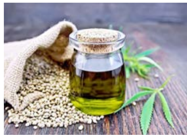
También el Poder Ejecutivo aprobó la compra de semillas de cannabis en el país.

el autocultivo y la elaboración de productos derivados del cannabis con fines medicinales”. Macame había llegado hasta la Corte solicitando que se considere al cultivo de cannabis como una acción privada exenta de toda autorización estatal y castigo penal, así como de una regulación. Por otra parte, anteaer el Poder Ejecutivo aprobó la compra de semillas de cannabis en el país. La resolución habilita a cualquier persona a comprar semillas legalmente. Las únicas que podrán venderse de manera legal son aquellas que cuenten con aprobación del registro ante el INASE.