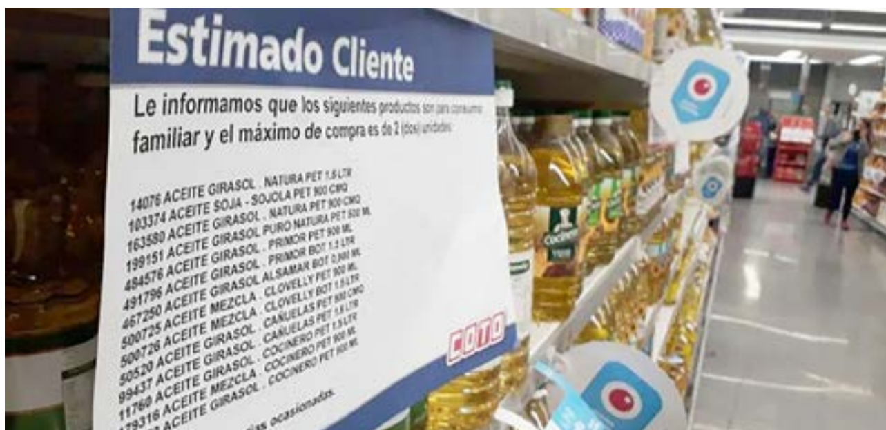
Este jueves 7 de julio vence Precios Cuidados, el único programa de control de precios con el que cuenta el Gobierno para contener la aceleración de la inflación en alimentos.