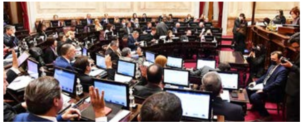
El oficialismo finalmente definió dar marcha atrás y no hará un llamado a sesión para mañana en la Cámara de Senadores. El temario que tenían previsto llevar al recinto no deja lugar al error y el margen cada vez era mayor.

denta de la Nación, Cristina Fernández de Kirchner, y su exposición será en el Calafate, provincia de Santa Cruz. La mandataria partirá mañana rumbo a la localidad