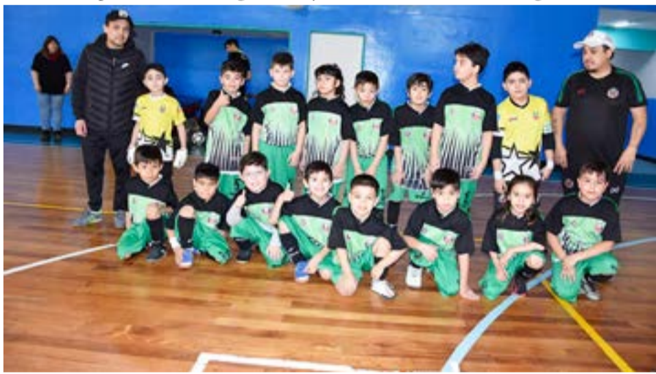
El equipo de Estrella Austral, 8va división.

ranja 0 Partido 25 – 3ra división Metalúrgico 1 Victoria 6 Partido 26 – 8va división