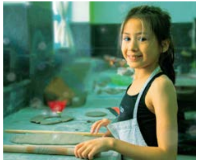
Las actividades estarán destinadas a niños y niñas entre los 4 y los 11 años de edad.

Las actividades comenzarán el martes 19 de julio y se extenderán hasta el 28 del corriente mes. De esta manera, el Municipio de Río Grande continúa generando propuestas para las infancias riograndenses, con el fin de que su ciudad les ofrezca espacios de encuentro, recreación y bienestar por una mejor calidad de vida para todos y todas.