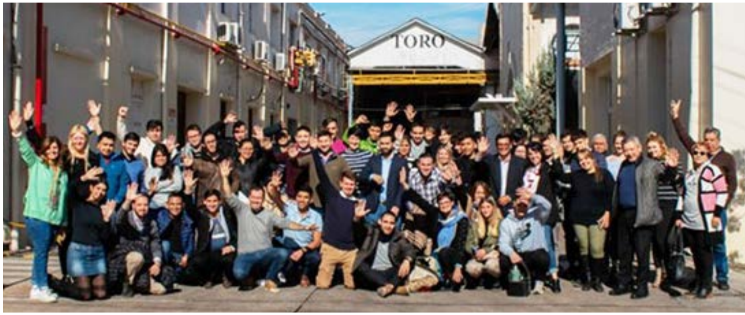
Con el objetivo de mantener en pie los valores del mutualismo en las próximas generaciones, se desarrolló el pasado viernes 20 y sábado 21 de mayo en la provincia de Mendoza, el Encuentro Nacional de Jóvenes Mutualistas de la CAM (Confederación Argentina de Mutualidades) con representantes de federaciones de todo el país. El lema de la convocatoria fue "Las juventudes y la integración asociativa."

la organización y el compromiso con la comunidad. Promovemos buenas prácti-