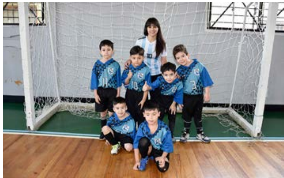
El equipo de Los Troncos, 9na división.

A.DE.FU. Naranja 7 Residentes Jujeños 1 Partido 27 – 5ta división San Francisco 6 Italiano 2 Partido 28 – 8va división Escuela Argentina 3 San Isidro 3 Partido 29 – 4ta división