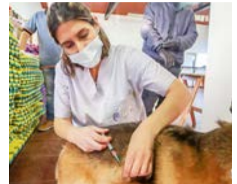
En el marco del programa de Tenencia Responsable del Municipio de Río Grande, se vacunaron contra la rabia a mil las mascotas de la ciudad.

De esta manera, se busca afianzar a Río Grande como ciudad mascotera y responsable, tanto con los animales como con el entorno, mejorando así la calidad de vida de todos y todas y cuidando, a