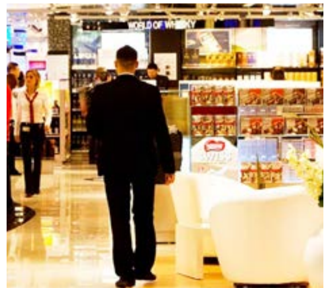
El Directorio del Banco Central de la República Argentina restringió la posibilidad de pagar en cuotas con tarjetas los consumos en todos los freeshops del país.

"En otra decisión que mejora las condiciones de acceso, se podrán cursar los pagos que realizan las empresas que recaudan en el país los fondos pagados por residentes a prestadores no residentes de servicios digitales", concluyó el comunicado del BCRA.