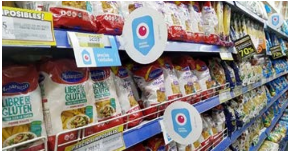
El Gobierno nacional renovó el programa Precios Cuidados y la canasta de frutas y verduras, con el fin de prolongar el acceso a una gran variedad de productos representativos del consumo cotidiano. Además, la Secretaría renovó también la canasta de frutas y verduras a valores de referencia en supermercados del AMBA.

El objetivo de esta canasta es brindar precios de referencia para un mercado cuya dinámica es muy volátil y cambiante por diferentes cuestiones como la estacionalidad y el clima. Se encuentra disponible en el Área Metropolitana de Buenos Aires (AMBA), todos los días, en los supermercados Día, Walmart, Changomas, Jumbo, Veá, Disco, Coto, Carrefour y Makro.