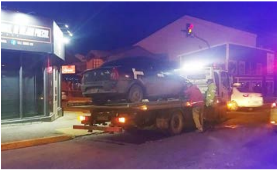
Circulaba en estado de ebriedad, chocó y fue aprehendido en el cruce de calles Perón y Fuegia Basket.