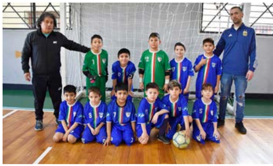
El equipo de Italiano, 8va división.

Partido 6 – 4ta división Metalúrgico 6 Victoria 2 Partido 7 – 7ma división Camioneros 8 Los Troncos 0 Partido 8 – 6ta división Estrella Austral Roja 3 A.DE.FU. Naranja 2 Partido 9 – 7ma división femenina A.DE.FU. 3 Residentes Jujeños 3 Partido 10 – 7ma división Escuela Argentina 5 Kapones 2 Partido 11 – 7ma división Progreso 8 Estrella Austral 5 Partido 12 – 9na división A.DE.FU. 7 Kapones 0 Partido 13 – 5ta división Escuela Argentina 1 Estre-