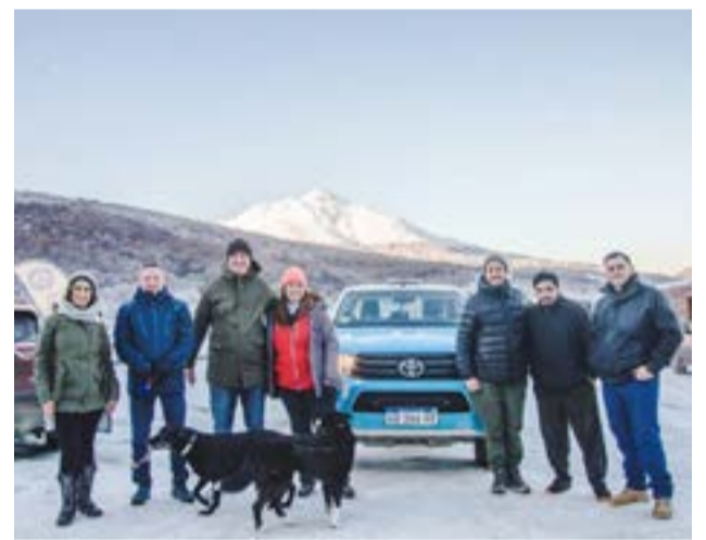
Recorrida por el centro invernal Llanos del Castor.

fondo y la caminata con raquetas; en contraprestación el municipio se compromete a la limpieza de algunos senderos y espacios comunes con los que cuenta el lugar de