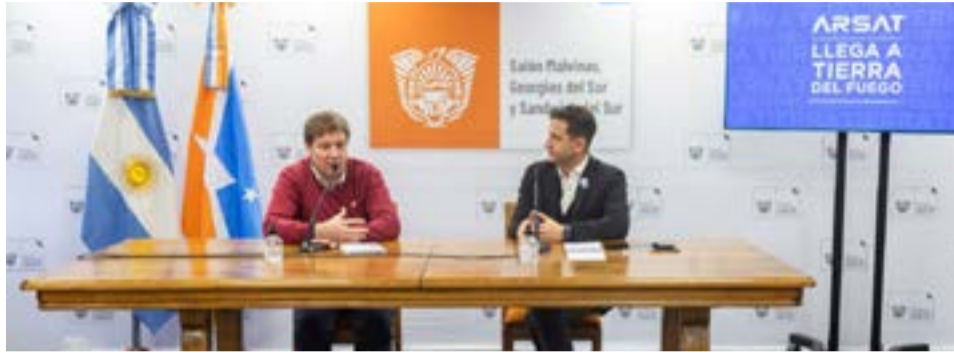
La rúbrica se realizó este jueves en Casa de Gobierno, con el objetivo de promover la inclusión social y la diversidad cultural a través del acceso a la tecnología digital.

aseveró que junto con ARSAT "entendimos que teníamos que dar el mejor servicio para que cada fueguino y fueguina tenga la conectividad que se merece para su vivienda, para su escuela, para su centro de salud o para su seguridad. Y también entendimos que esto debía ir a los privados quienes han hecho una gran inversión".