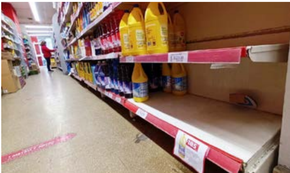
Las trabas a las importaciones y la incertidumbre cambiaria de los últimos días, con un salto del dólar blue el pasado lunes, ya generan faltantes en algunos productos en los comercios y la falta de referencias de precios hace que se retraigan algunas operaciones.

“Esta semana hubo proveedores que suspendieron ventas o pasaron listas de precios nuevos. Es una incertidumbre total, ¿quién se va a arriesgar a vender un producto que no tiene idea del precio y el mayor riesgo es que no lo va a poder reponer? Es probable que haya un par