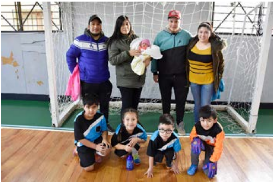
El equipo de Kapones, 9na división.

Estrella Austral 4 Kapones 3 Partido 30 – 5ta división San Isidro 3 Camioneros 4 Partido 31 – 4ta división Defensores del Sur 1 Residentes Jujeños 3 Partido 32 – 3ra división femenina Celeste FC 16 Metalúrgico 0 Partido 33 – 3ra división femenina San Isidro 11 Los Troncos 2 Partido 34 – 6ta división Italiano 11 Kapones 1 Partido 35 – 6ta división San Isidro 4 Camioneros 18