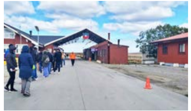
La Express (puede tardar hasta 48 horas) y la Normal (puede tardar hasta 10 días) se pueden llevar a cabo en todas las delegaciones de la DNM.