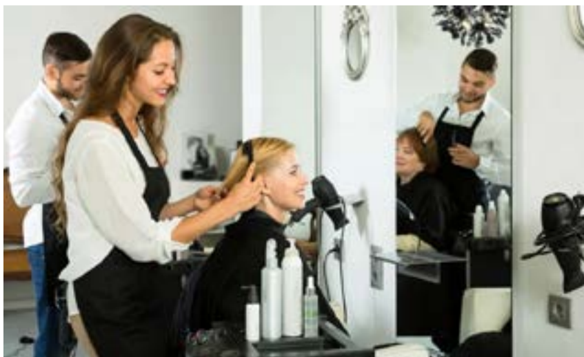
Durante las 2 jornadas habrá demostraciones de las técnicas: corte unisex; Contouring; Balayage al aire libre; y tratamiento de alisado de bajo impacto para la fibra capilar. Se trata de una propuesta más en el marco del Programa Municipal de Capacitación “Formarte es Crecer”.

taciones con el objetivo principal de brindar herramientas para el desarrollo e inserción laboral de los vecinos y vecinas de nuestra ciudad.