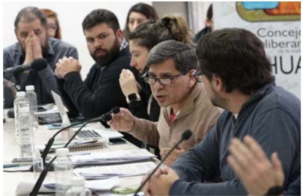
Para fijar el reglamento, se había iniciado el análisis tomando la propuesta de la fuerza política Más Ushuaia.