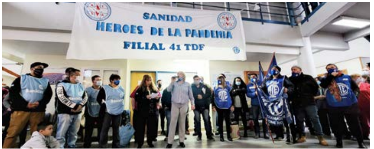
Ayer por la mañana se realizó en el hall central del Hospital Regional Río Grande una asamblea conjunta entre ATE y ATSA, allí se votó por unanimidad el acuerdo logrado en paritarias.

Etchepare resaltó también el resultado obtenido en la negociación, destacando la tarea de los paritarios y recordando que “se presentó una propuesta desde el día