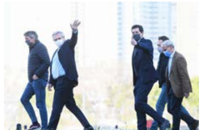
Alberto Fernández junto a Eduardo "Wado" De Pedro y Máximo Kirchner.

mienzos del año, se manifestó en la misma dirección. Durante un discurso efusivo en Florencio Varela, el ex ministro volvió a recriminarle a su predecesora, María Eugenia Vidal, el estado en que le dejó el distrito, pero pidió asistencia de Juntos por el Cambio. "Hoy necesi-