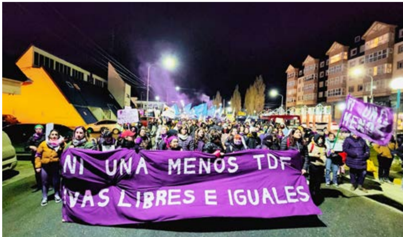
Organizaciones feministas piden se declara la Emergencia Provincial ante los múltiples hechos de violencia.

-Juntas y organizadas la lucha feminista se hace escuchar en Río Grande, Tolhuin y Ushuaia porque no queremos más violencia laboral las compañeras del IPV, porque