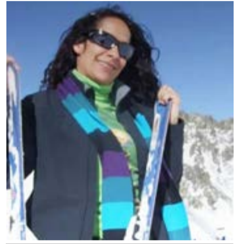
Marcado hermetismo en la causa que investiga la muerte de Alejandra Accetti.

En el marco de la investigación este martes se avanzó con la autopsia y el juez ordenó una serie de allanamientos, entre otras medidas, conducentes a esclarecer el hecho.