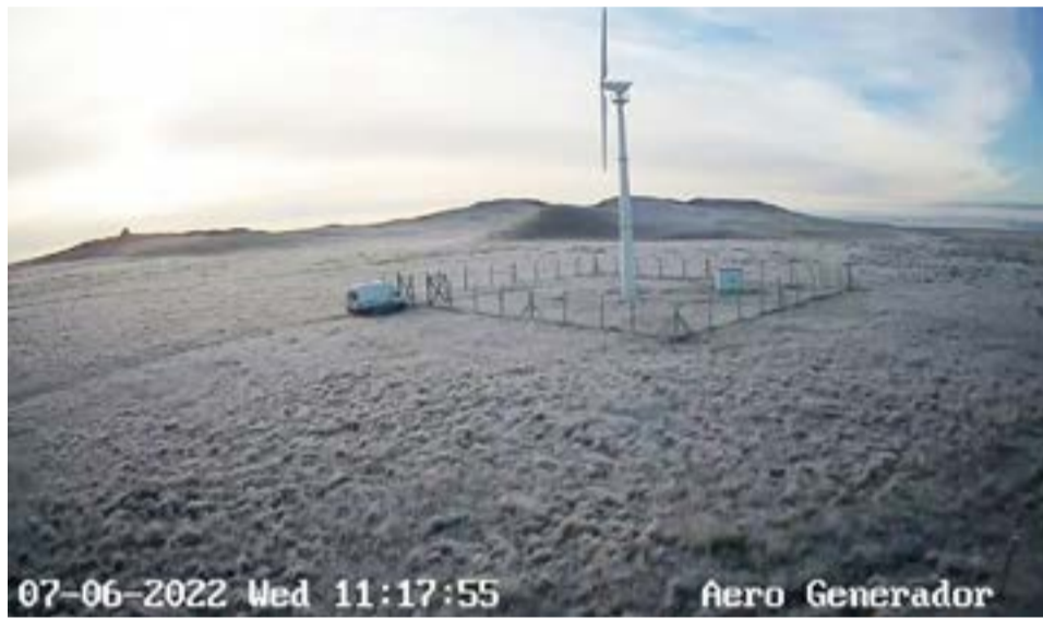
En el caso del Cabo Domingo de Río Grande se instaló un aerogenerador.