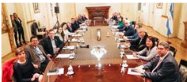
En la que fue su primera reunión de Gabinete, Silvina Batakis, la ministra de Economía que desde el 4 de julio reemplaza a Martín Guzmán, expuso con crudeza el complejo panorama económico que afronta el país.

Buenos Aires.- Fue una de las que más habló y no anduvo con demasiadas vueltas. En la que fue su primera reunión de Gabinete, Silvina Batakis, la ministra de Economía que desde el 4 de julio reemplaza a Martín Guzmán, expuso con crudeza el complejo panorama económico que