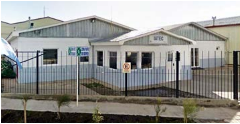
Desde el Grupo Mirgor ya confirmaron la caída de 190 contratos y los problemas podrían extenderse a otras plantas fabriles.

Río Grande.- Se confirmó desde el Grupo Mirgor que “debido a las dificultades Mirgor está evaluando suspender algunas líneas de producción a partir de fin de