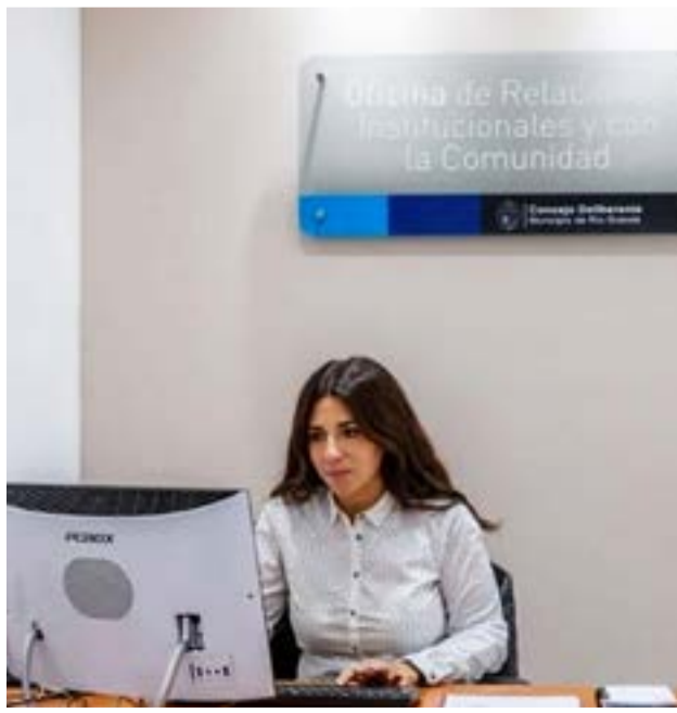
El Concejo Deliberante ya se encuentra utilizando la plataforma de gestión de documentos (GDE).