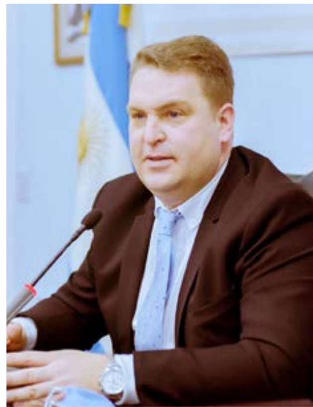
El presidente del Concejo Deliberante Von der Thusen expresó que “esperamos que los vecinos vean los beneficios de esta herramienta en su vida cotidiana”.

Nacional creó el “Plan de Modernización del Estado”, el cual tiene como objetivo mejorar la calidad de vida de los ciudadanos transparentando, acelerando y haciendo más sustentable el funcionamiento del Estado. El concejal también se refirió al ahorro de recursos que se logra con la implementación de este sistema, para lo cual explicó que “desde que asumí la Presidencia del Cuerpo de Concejales me propuse lograr la despapelización del sistema con dos objetivos claros, por un lado, lograr un ahorro de los recursos que son de los riograndenses, ya que se gastará menos en insumos; y por otro lado lograr un edificio sustentable, que impacte lo menos posible en el ambiente y entorno, que es nuestra ciudad. Esto no es menor, ya que por el