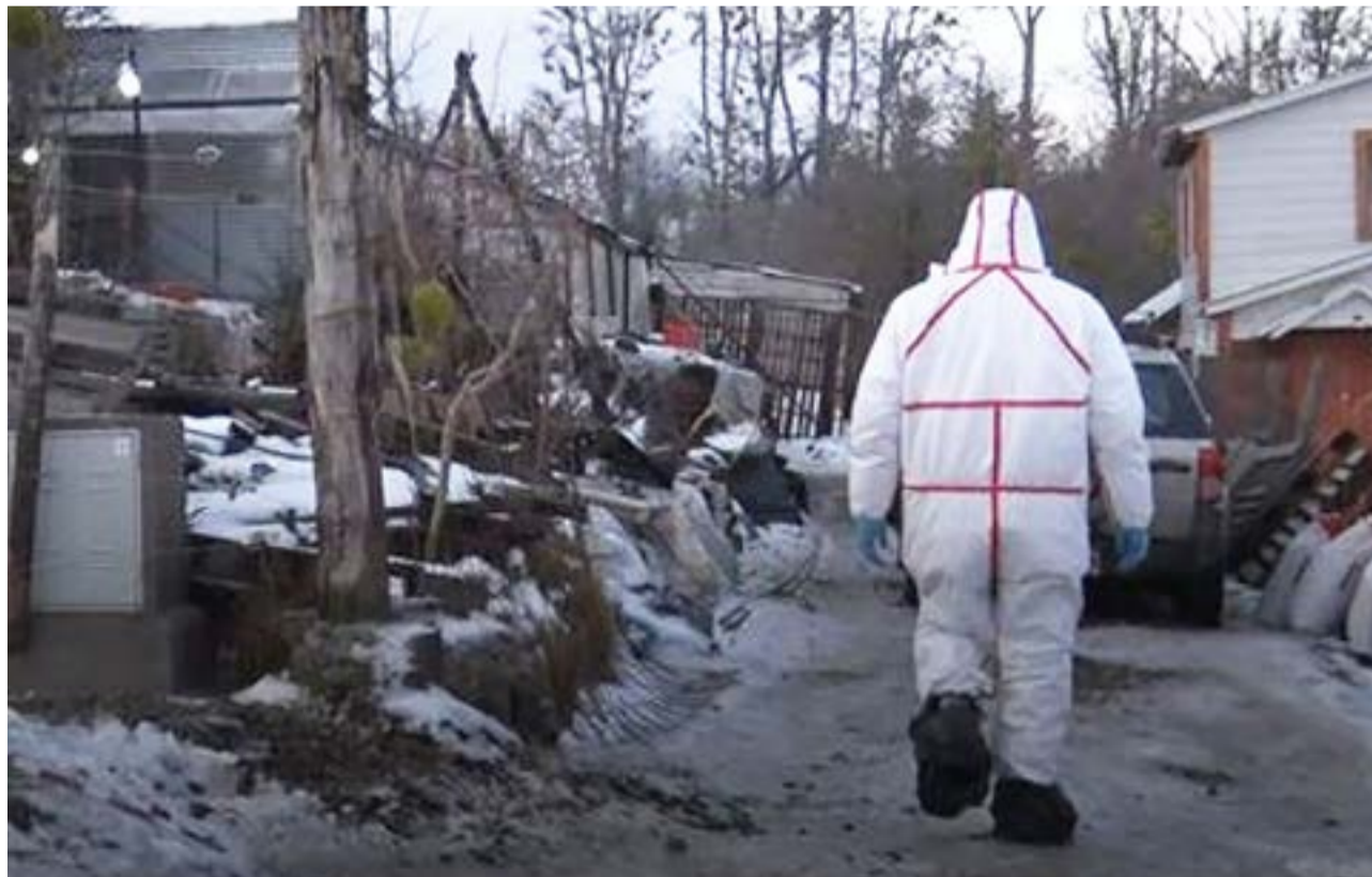
El allanamiento a la vivienda de Accetti no arrojó ningún elemento de interés o indicio que presuma un escenario de violencia.