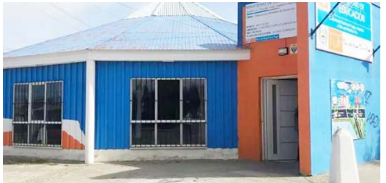
Esta semana se desarrolló en la ciudad de Río Grande una nueva Mesa Técnica de Convenio Colectivo de Trabajo para Educación.

Indicando, además, que “En el acta de la Mesa Técnica se deja registro sobre el trabajo realizado de Misiones y funciones de los cargos de 2do grado de la Res.M.E.T N° 079/08. Supervisores departamentales de Educ. Artística / Educ. Física y Tecnología”.