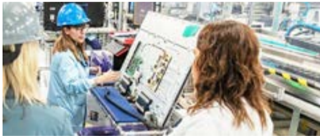
En la última reunión de la CAAE, sus integrantes dieron luz verde al pedido de autorización de electrónicas para la elaboración de televisores color, entre ellos Solnik, para la elaboración de TV marca Hyundai, Newsan en sus productos LG, Sharp, Nóblex y Philco.

En tanto la empresa IATEC (Industria Austral de Tecnología SA), fue autorizada para que a partir de agosto de este año inicie la fabricación de televisores marca Samsung; al igual que la empresa Electrofueguina para la elab-