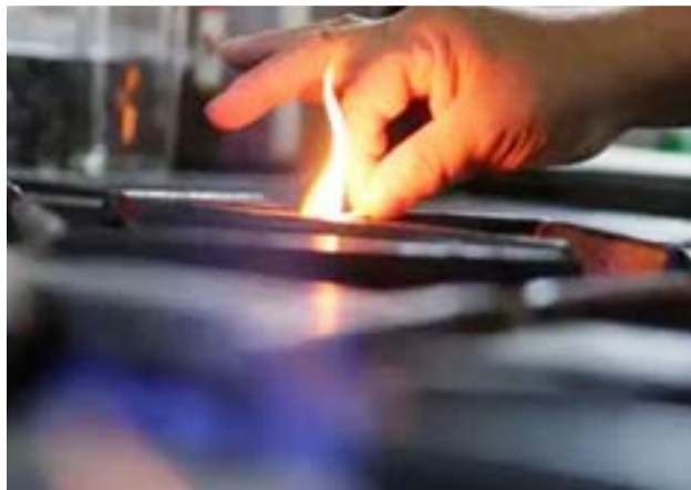
En Tierra del Fuego fueron un total de 3.418 las familias que iniciaron el trámite.

Para completar el formulario, la Secretaría de Energía