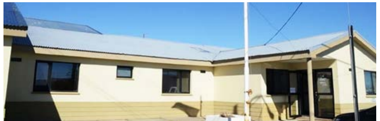
Abren el concurso para cubrir un cargo de Juez/a de la Cámara de Apelaciones del Distrito Judicial Norte, tras la jubilación de la jueza Josefa Haydeé Martín.

Las inscripciones se recepcionarán en la sede del Consejo de la Magistratura, sita en Av. Alem 2320 de U-