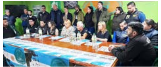
Los integrantes de la CGT Regional Río Grande brindaron una conferencia de prensa, para ratificar la movilización de hoy "en defensa del salario, contra el aumento de precios y la especulación".

que es uno de los que menos inconvenientes tendrían aplicar ese acuerdo, se está negando justamente porque también están intentando llevar a un proceso de devaluación