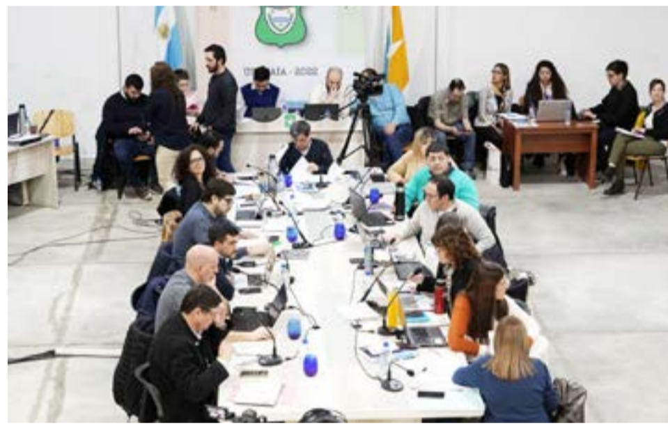
Consenso unánime en varios de los artículos de la reforma de la Carta Orgánica de Ushuaia en la primera jornada de funcionamiento de la comisión temática.

El Municipio de la ciudad de Ushuaia honra, respeta y engrandece el recuerdo de la Gesta de Malvinas y a sus protagonistas, las y los excombatientes. En especial recuerda a aquellos que ofrendaron su vida cayendo en combate en defensa de la soberanía, dignidad y bandera de nuestra Patria.