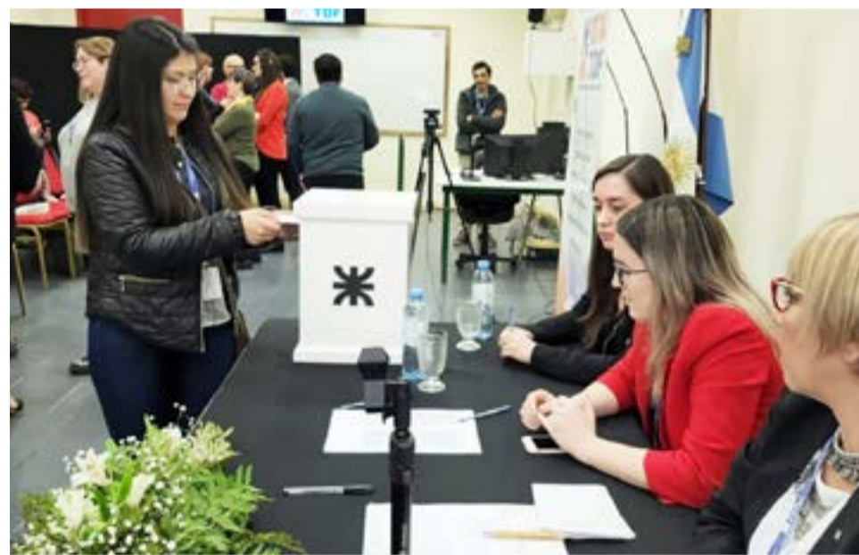
Este martes se realizó la elección de autoridades en la Facultad Regional Tierra del Fuego de la Universidad Tecnológica Nacional.