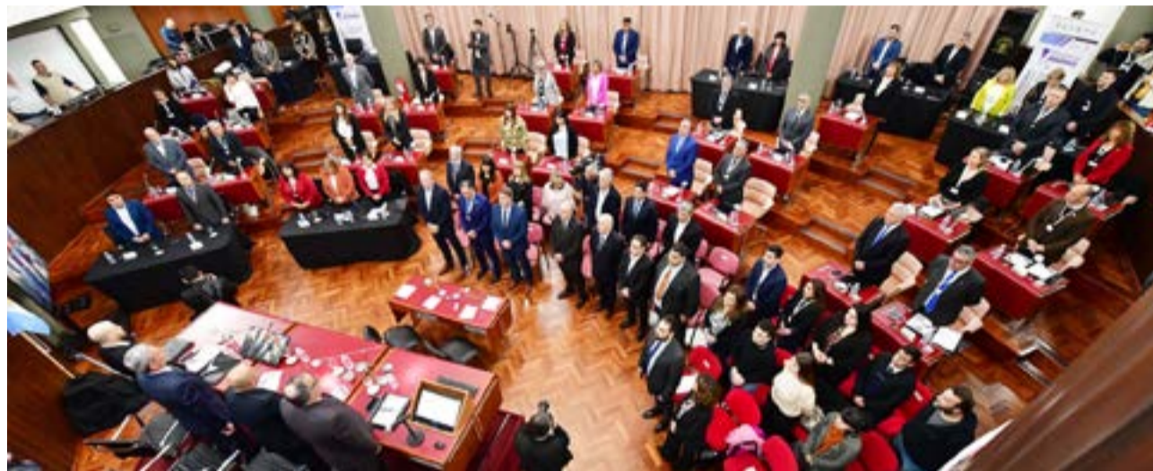
La jornada de trabajo de ayer inició con la reunión de la Comisión de Labor Parlamentaria en sede de la Presidencia de la Honorable Legislatura del Chubut, de la que participaron los diputados de las provincias de La Pampa, Neuquén, Río Negro, Chubut, Santa Cruz y Tierra del Fuego. En el encuentro, definieron los asuntos que irán a la sesión y que fueron informadas oportunamente.

conocer el trabajo de los representantes legislativos y celebró su gestión "aun en pandemia" por COVID-19. Así, enumeró la agenda impuesta: "Hay una gestión que va más allá de los colores partidarios", evaluó. Al finalizar, recordó que la insistencia ante distintos temas públicos, es la vía para alcanzar los objetivos de la región.