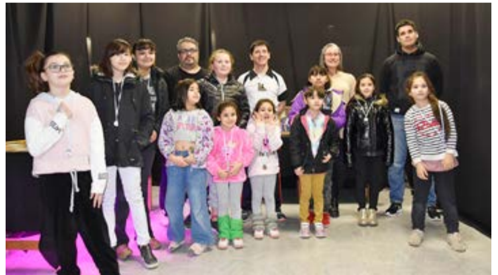
La nueva camada del ajedrez en Río Grande, donde niñas y niños disfrutaron con gran pasión este juego ciencia.

Cabe destacar que los integrantes de la Agrupación 27 de Octubre trabajaron durante tres días para que los competidores estén cómodos, incluso con los atendieron con un rico refrigerio. "No solo abrimos las puertas de nuestra sede durante estos tres días, les brindamos lo mejor de nosotros para que ellos puedan llevar adelante la actividad y estamos muy agradecidos con el Club de Ajedrez y destacamos a todos los deportistas porque muchos de ellos han venido de otros lugares como Río Gallegos, Punta Arenas y Ushuaia y hubo jugadores de todas las edades, desde los 5 años de edad hasta los 70; hubo una diversidad muy importante de niños, niñas y adultos, así que