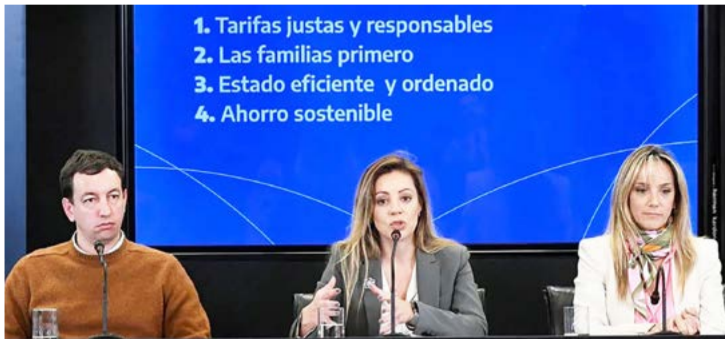
El Gobierno detalló el esquema de quita gradual de subsidios a las tarifas.

En el caso de las tarifas de energía eléctrica, el tope de consumo para la tarifa con subsidios será de 400 kWh mensual por hogar. Pero para las localidades que no cuenten con gas natural por redes el tope se incrementará a 550 kWh.