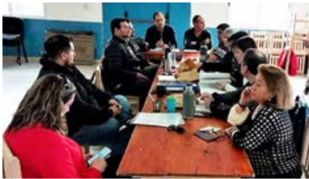
El viernes pasado se cerró un acuerdo salarial que abarca a las trabajadoras y trabajadores de la OSEF.