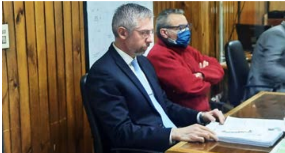
Fiscalía solicitó 4 años de prisión para acusado de abuso sexual y bajó la calificación legal a estupro.

Los hechos comenzaron cuando la víctima tenía 14 años y perduraron hasta sus 17 años, y se desarrollaban en el interior de la vivienda del imputado, quien era vecino de la menor.