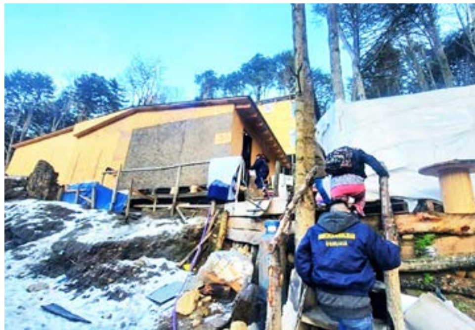
La autoridad judicial interviniente ordenó el allanamiento de un domicilio en el barrio de Andorra de la ciudad capital, con resultado positivo para la investigación.

Con las características aportadas, se identificó a un hombre de aproximadamente 32 años de edad, quien tenía entre sus pertenencias alrededor de ochenta gramos de marihuana, una balanza de precisión y dinero en efectivo, entre otros elementos