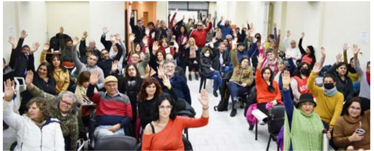
La CONADU Histórica rechazó la oferta salarial del Gobierno y convocó a paro de 48 horas para el miércoles 24 y jueves 25.

También remarcaron que “el resto de las Federaciones firmaron y sin llevar a consulta a sus bases, el acta salarial que presentó el Gobierno a través de la Secretaría de Políticas Universitarias”.