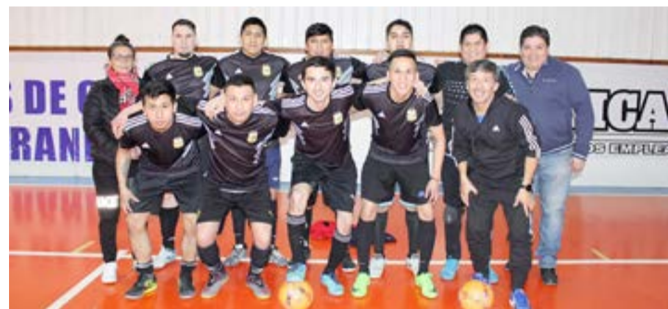
El equipo de Los Indestructibles, categoría libre.