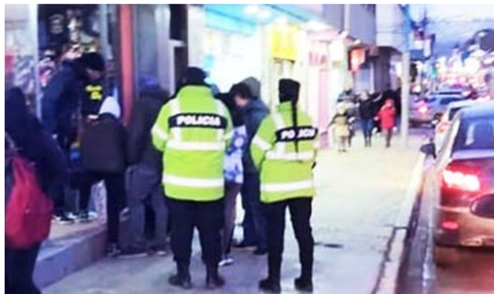
La Policía provincial fue alertada mediante llamados al 101, dando cuenta que una persona estaba realizando venta callejera de drogas en la zona céntrica de la ciudad, más precisamente sobre calle San Martín.

de interés. El personal policial realizó el procedimiento en la vía pública en el marco del artículo 230 bis del CPPN, con inmediata intervención al Juzgado Federal y Fiscalía Federal de la ciudad de Ushuaia, procediéndose a la detención en carácter de incomunicado de la persona de referencia, conforme manda judicial. En relación a este hecho, la autoridad ju-