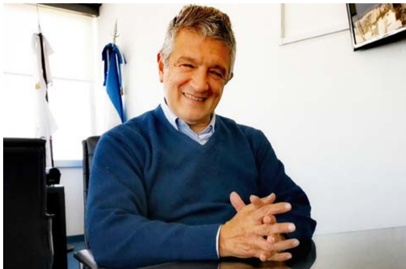
El presidente de FORJA, Gustavo López, se refirió sobre las declaraciones del senador Matías Rodríguez, quien no solamente hizo públicas sus aspiraciones a la gobernación, sino que sumó críticas a la gestión de Gustavo Melella, por deficiencias prácticamente en todas las áreas de gobierno.

do conectividad a las provincias, y la de Melella es cómo seguir gestionando la provincia para la cual se postuló. El gobernador no hizo ninguna manifestación sobre su