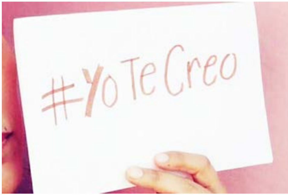
Joven que habría sufrido abusos por parte de su padrastro lo expuso en redes sociales y asegura que su mamá sabía de los hechos.

“Me acuerdo de que mi padrastro se enojó muchísimo cuando yo estaba de novia con ese chico, discutían con mi mamá y él hasta llegaba a meterle cachetazos a ella porque me dejaba salir con él. Ella obviamente no me dejaba, pero a mí ya no me importaba, me escapaba de la casa igual. La mamá de este chico habló conmigo, le pude contar todo lo que me había pasado, por eso me llevó a la policía, la comisaría que está al lado del polivalente de arte, dejando una exposición puesta diciendo que yo me iba a quedar en su casa a vivir un tiempo porque en mi casa me pasaban este tipo de cosas. Obviamente, no pasó 3 días hasta que mi mamá me