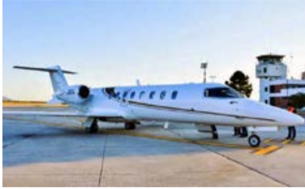
Acusan que “siguen usando el avión sanitario como si fuera una avión privado”.

“Nunca existió por parte del gobernador Jalil el deseo o la voluntad de que el avión que le costó a la provincia