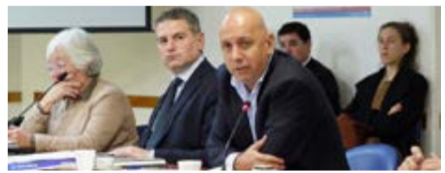
Legislador Pablo Villegas (MPF).

Con posterioridad, Villegas acompañó la jornada de presentación de “lineamientos de capacidad y condiciones de privación de la libertad en lugares de detención provisoria”, informó el titular de la Comisión de Seguridad N° 6. Recientemente se aprobó la resolución CNPT N° 38/2022 que determina “los parámetros para evaluar condiciones de habitabilidad en los lugares de detención de carácter provisoria, tales como comisarias, brigadas, escuadrones, destacamentos, alcaldías, y/o espacios con cualquier otra denominación cuyo criterio funcional es el alojamiento de las personas por un tiempo acotado, ya sea de pocas horas o días”.