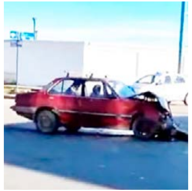
Conductor en estado de ebriedad habría protagonizado un violento choque en Colón y Brown de Río Grande.