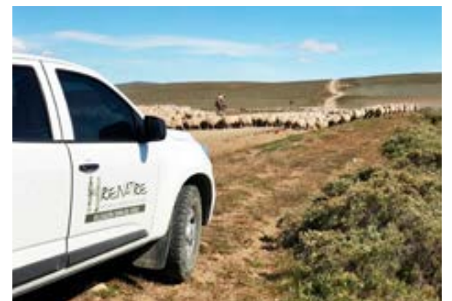
Desde el RENATRE se refirieron al 78° aniversario de la sanción del Estatuto del Peón Rural, en cuya conmemoración se celebra el Día del Trabajador Rural.