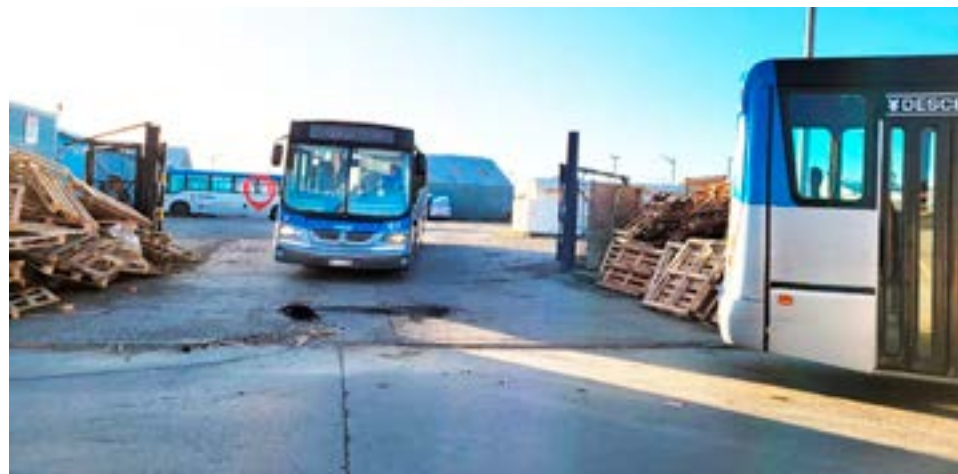
Por un conflicto entre el Gobierno nacional y las provincias, respecto de qué jurisdicción debe hacerse cargo del último aumento de sueldo para los conductores, la Unión Tranviarios Automotor (UTA) anunció un paro total de colectivos de 48 horas que afectará a todo el país.