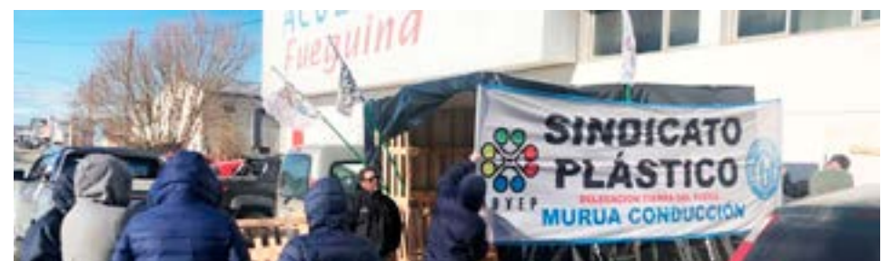
La Unión Obreros y Empleados Plásticos (UOYEP) aplicó la revisión del acuerdo salarial y alcanzó un 90% anual para el período abril 2022-abril 2023.

De igual manera, vale mencionar también que la Federación Nacionales de Trabajadores Camioneros y su secretario Adjunto, Pablo Moyano, ya anticiparon que pedirá un incremento superior al 100%.