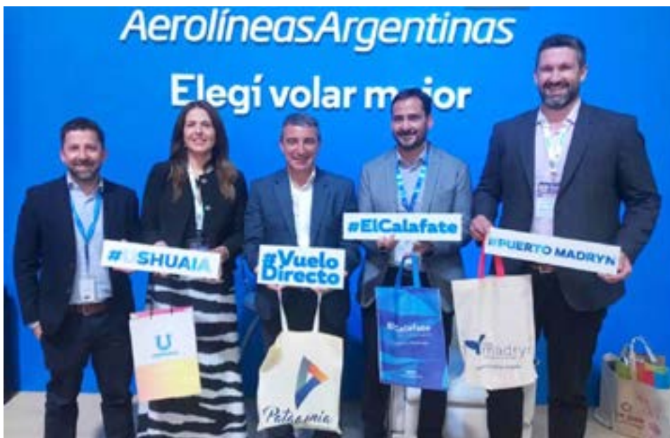
En el encuentro se hizo el anuncio de los vuelos directos para la temporada de invierno de Ushuaia 2023.