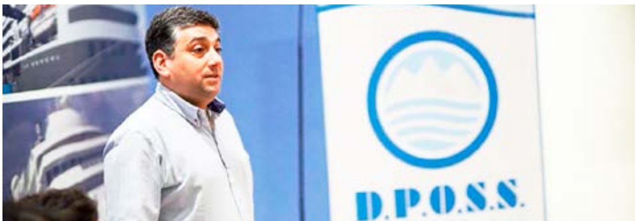
La Dirección Provincial de Obras y Servicios Sanitarios (DPOSS) realizó la audiencia pública sobre la actualización del decreto tarifario de los servicios que presta dicho ente en Ushuaia y Tolhuin.