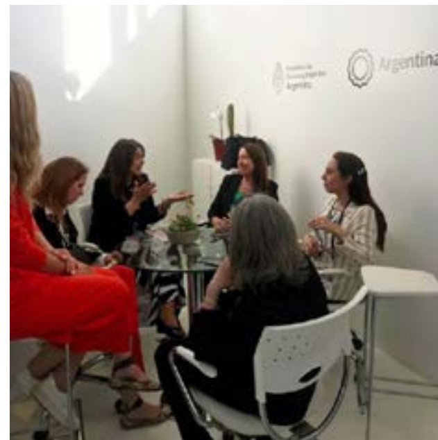
En el encuentro, se propuso llevar adelante en Ushuaia la capacitación de “Anfitriones Turísticos”, un programa del MinTur. Es un taller que contribuye a la correcta atención al turista.

“Estuvimos coordinando la capacitación que se realizará en Ushuaia el 1 de diciembre, con lugar a definir.