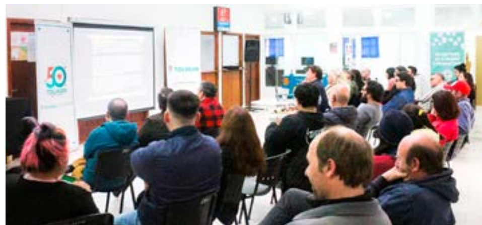
La charla se dio en el marco del 50 aniversario de la Fundación de Tolhuin, contando con el auspicio del municipio mediterráneo y al que asistió una gran cantidad de público, en su mayoría productores.

*Que en las negociaciones políticas que se lleven a cabo con Gobierno nacional, se busque afianzar la Resolución 47/18 que no tiene vencimiento, con legislaciones de un nivel superior que le den previsibilidad a los inversores en el tiempo;