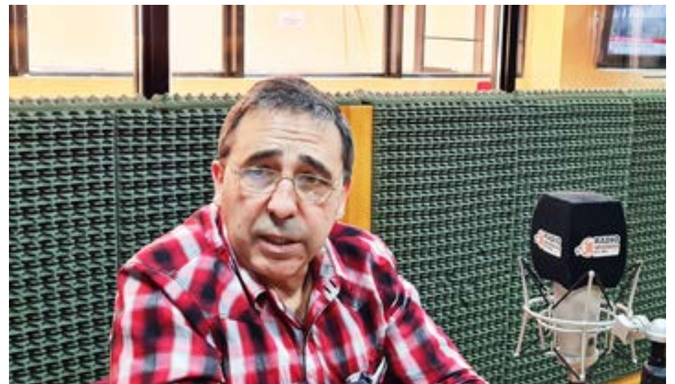
Fresia cuestionó que “no tomen conciencia de la situación y espero que nunca pase algo grave, un problema cardíaco, un accidente de tránsito. El chofer de la ambulancia hace malabares para pasar por el puente y no debería ser así. La ambulancia con médico debería estar en la margen sur”.

un par de zapatillas al que lo necesita. En nuestro caso atendemos a unas 40 familias y estamos en el barrio Provincias Unidas. Hay comedores que hacen 120 ó 140 viandas, depende del sector. La municipalidad hace un aporte mensual con carne, queso, verduras; el gobierno también aporta mercadería y bolsones de fruta. Nosotros estamos haciendo la cena una o dos veces por semana y son siete u ocho personas las que están co-