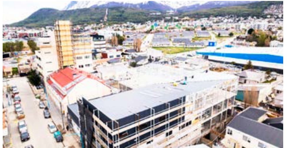
El ministerio de Obras y Servicios Públicos avanza con los trabajos en el Centro de Rehabilitación Ushuaia, el cual estará destinado a la atención integral a niñas, niños, adolescentes y adultos, que requieren atención neurológica y traumatológica.

El CRU contará con un plantel de especialistas que darán vida al lugar, entre los cuales se encuentran Fisiatras, Neurólogos, Fonoaudiólogos, Psicopedagogos, Psicomotricistas, Terapeutas Ocupacionales, Trabajadores Sociales; a los que se sumarán nuevos profesionales.