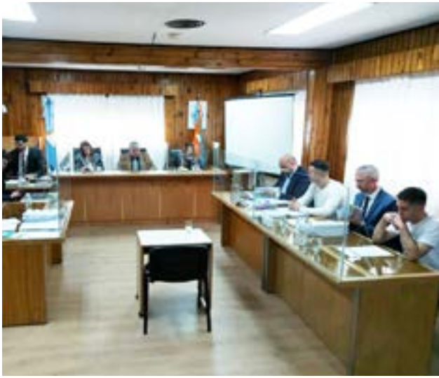
Este martes continúa el juicio a dos hombres acusados de lesiones y amenazas agravadas por el uso de un arma.

Por último, el fiscal enfatizó en las penas que podrían llegar a recibir estos dos sujetos “la fiscalía anteriormente ya había hecho un ofrecimiento de omisión de debate, ya que considera que todo este hecho está muy claro, hay muchas pruebas recabadas. Por lo cual, había pedido tres años de prisión de efectivo cumplimiento por la gravedad del hecho y porque los dos tienen condenas penales previas, esto quiere decir que anteriormente ellos ya estuvieron privados de su libertad”.