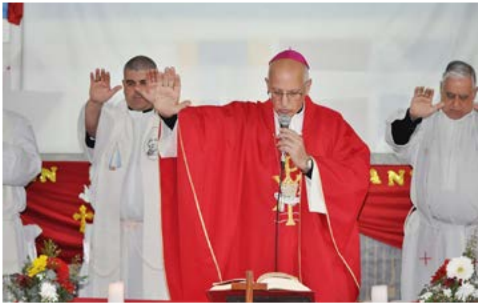
El culto religioso estuvo a cargo del Monseñor Santiago Olivera Obispo Castrense de la Argentina.

La sede de la curia del obispado y su iglesia catedral Stella Maris están en la ciudad de Buenos Aires en un predio que la Armada Argentina le entregó el 22 de abril de 1958. La catedral fue inaugurada el 17 de agosto de 1965.