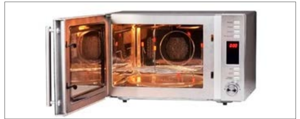
Se destaca el modelo Trifunción (microondas, grill y convección) que permite, con su modo convección, distribuir el calor de manera uniforme por toda la cavidad.

es líder absoluto de la categoría, el lineal completo está disponible con hasta 30% de descuento, cuotas sin interés y envíos gratis en todos sus modelos de microondas y hornos eléctricos.