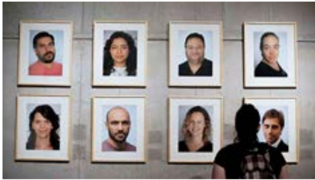
La muestra “Nietos/as”, del fotógrafo Alejandro Reynoso, llega a la capital fueguina luego de pasar por diversos y emblemáticos espacios.

Ushuaia.- La muestra “Nietos/as”, del fotógrafo Alejandro Reynoso, llega a la capital fueguina luego de pasar por diversos y emblemáticos espacios.