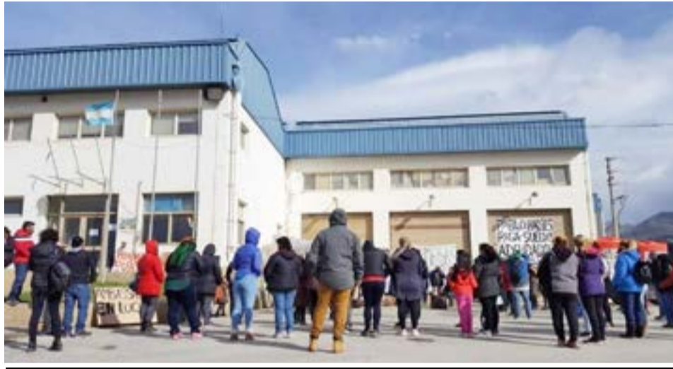
Se espera una inminente definición en el concurso que se lleva adelante para la firma Ambassador Fueguina.

La definición se esperaba para el viernes