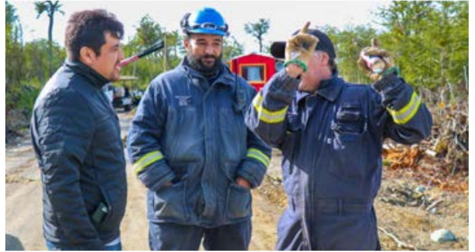
Desde el Municipio de Tolhuin se afirmó que esta "política de regularización de servicios básicos para nuestros vecinos y vecinas garantiza más derechos y servicios".

Participaron de la 4° Feria Intercultural Tierra del Fuego