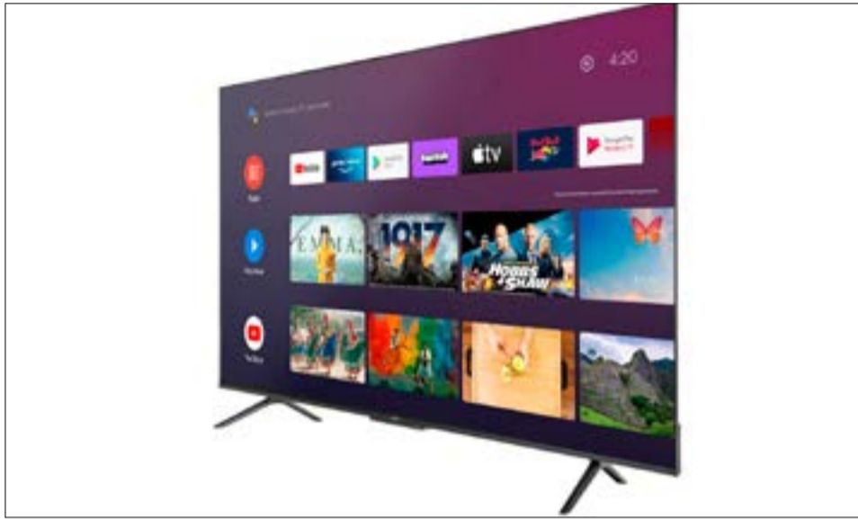
El BGH_3TV75 es un de los productos que se suma al CyberMonday 2022 con descuentos de hasta un 40%, cuotas sin interés y envíos gratis.

El mercado espera un crecimiento mayor al 20% en la comercialización de unidades del CyberMonday 2022 respecto del año anterior. "La categoría Electro es