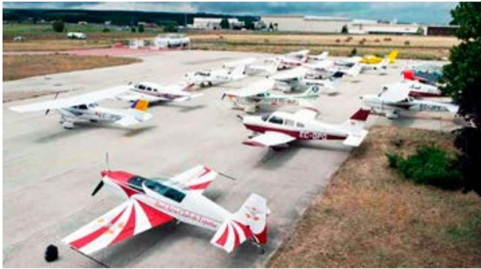
Este martes llegan más de 60 aviones de raid aéreo a Ushuaia.

Fuentes: FM Master's, Ushuaia 24 y Diario El Orden de Coronel Pringles.