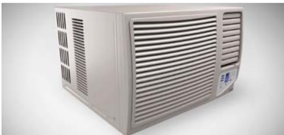
Los Aires Acondicionados BGH Silent Air combinan la última tecnología con la más alta eficiencia.

Para BGH el e-commerce es fundamental en su plan de negocio y apunta a protagonizar el CyberMonday 2022 en el marco del crecimiento que viene teniendo el comercio electrónico en todo el mundo, con más de un billón y medio de pesos facturados en el país el año pasado.