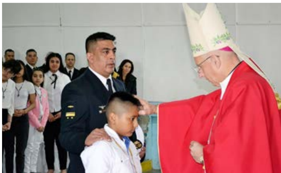
La misa en Río Grande se realizó en el ex cine del BIM N°5.

El obispado castrense de la República Argentina es el ordinariato militar de la Iglesia católica en Argentina que asiste al personal católico de las tres Fuerzas Armadas argentinas y de tres fuerzas de seguridad federales: Gendarmería Nacional, Prefectura Naval Argentina y Policía de Seguridad Aeroportuaria.