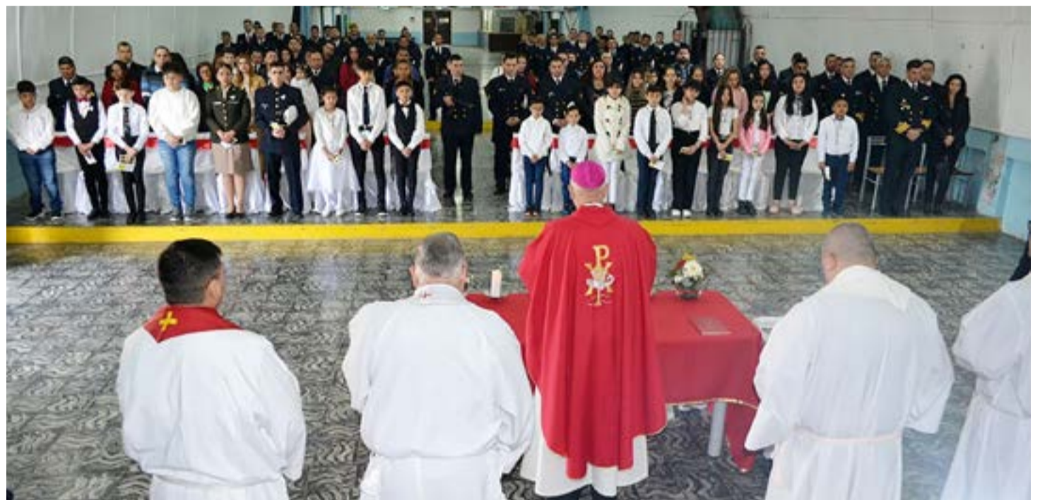
El Obispo Castrense de la Argentina pasó por Tierra del Fuego y celebró misas de confirmación en Ushuaia y Río Grande.

da vez que visito Tierra del Fuego y para mí es un motivo de mucha alegría porque en nuestra jerga militar es cómo ir al terreno o al despliegue y yo como Obispo Castrense es ir a donde están nuestros fieles y visitarlos me hace palpar la realidad de lo que es el obispado castrense de la Argentina que todos los hombres y mujeres de nuestras fuerzas tanto de seguridad como las fuerzas armadas que están bajo el control del obispado así que para mí es un motivo muy especial y de