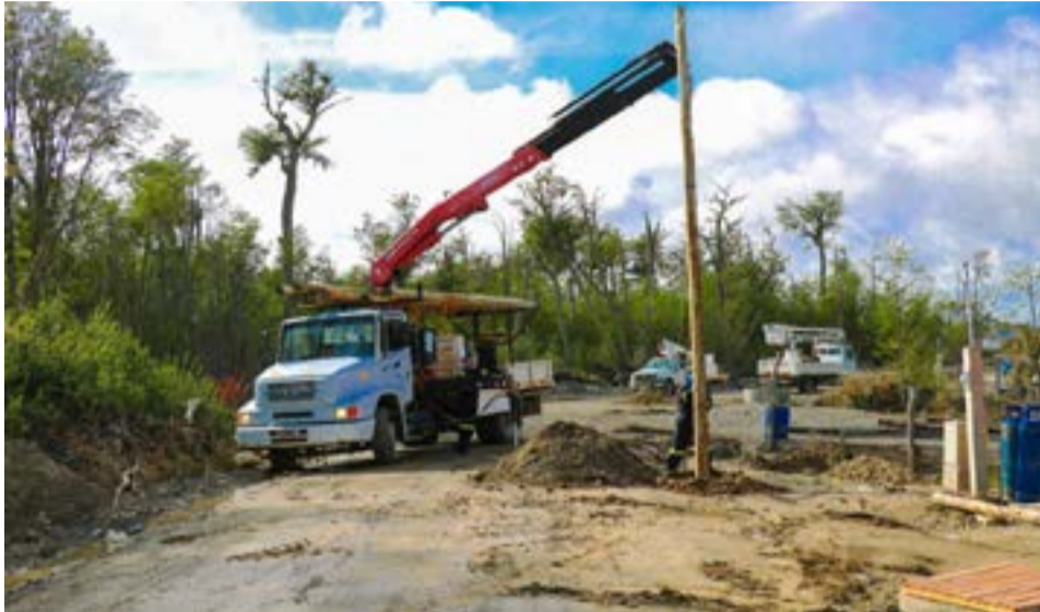
El Municipio de Tolhuin y la DPE trabajan en conjunto para la conexión eléctrica del B° Altos de la Montaña.

Desde el Municipio de Tolhuin se afirmó que esta "política de regularización de servicios básicos para nuestros vecinos y vecinas garantiza más derechos y servicios".