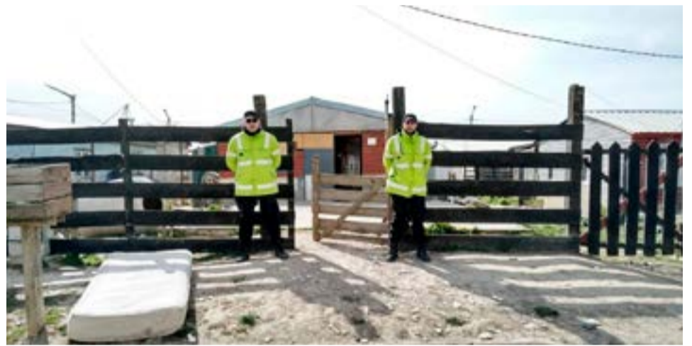
Un hombre fue agredido por otro que quedó a disposición de la Justicia.