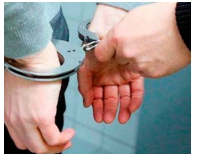
Procesan a un hombre acusado de abusar a una niña y que incumplió la prohibición de acercamiento.