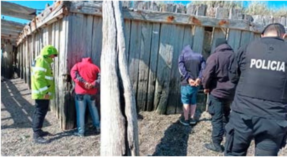
Dos sujetos quedaron incomunicados tras exhibir un arma tipo "tumbera".