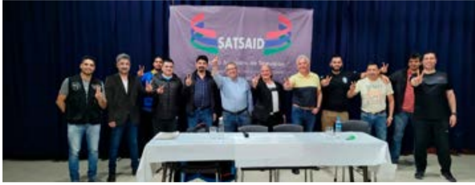
En las instalaciones del SATSAID, en la ciudad de Río Grande, se llevó adelante una charla sobre los alcances y la importancia de la Ley 19640 para la provincia.