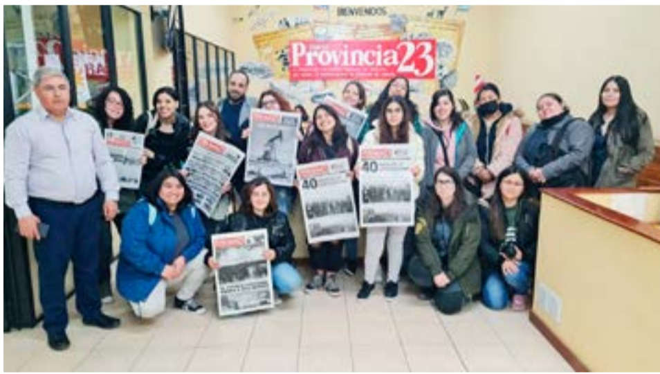
Los alumnos de 2° año de la carrera de Diseño Gráfico del CENT 35 en la Redacción del Diario Provincia 23.