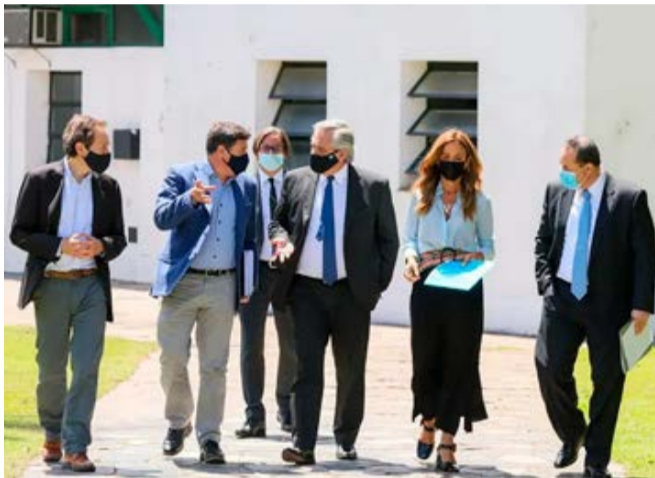
"Lo primero que vamos a reperfilarse son los precios de la canasta básica para que todos tengan acceso", dijo Fernández, menos de tres años después, la Mesa Contra el Hambre se disolvió.

Las palabras que eligió el Jefe de Estado para expresarse ante la sociedad después del encuentro que tuvo como marco el Museo del Bicentenario son una muestra más de las dificultades que enfrenta la dirigencia para resistir un archivo: "A pesar de la pandemia no cedimos en la lucha contra el hambre, en ese contexto nunca bajamos