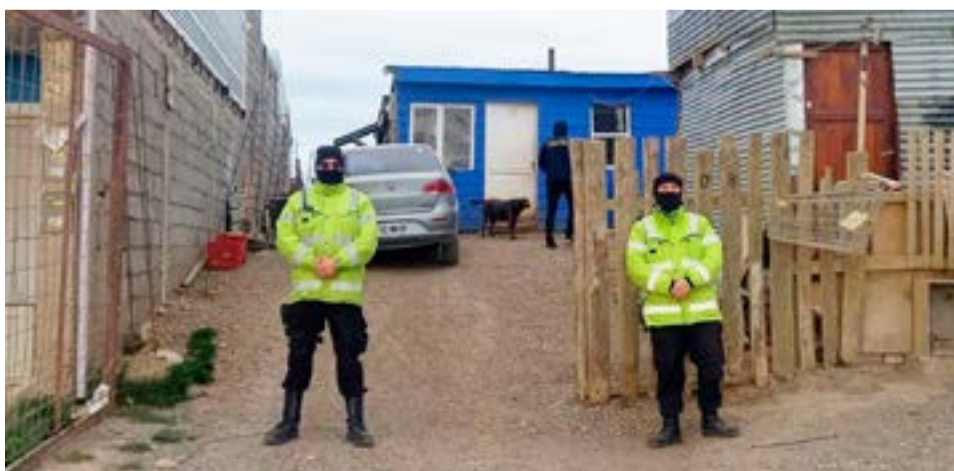
Se realizaron cuatro allanamientos para recuperar un televisor y una licuadora robada el pasado 1 de noviembre.

Se procedió al secuestro de un televisor, una licuadora y teléfonos celulares; como así también la notificación de derechos y garantías a los mayores de edad.