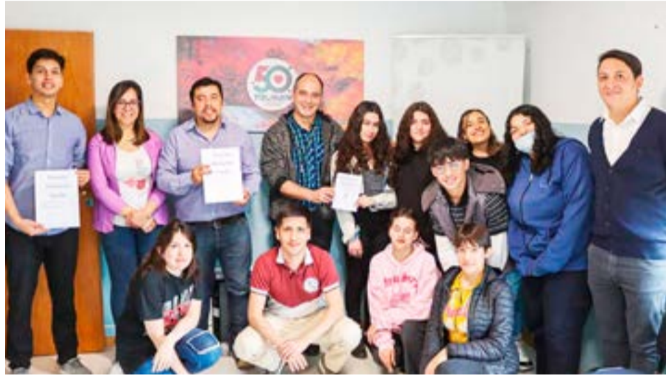
Como todos los años, los y las estudiantes del Colegio Provincial Ramón Alberto Trejo Noel se acercaron al Municipio en el mes de junio para solicitar el acompañamiento del Ejecutivo en la realización de la fiesta de egresados.

rio local les dio el visto bueno para poder desarrollar el evento en el Polideportivo Ezequiel Rivero pero, en esta oportunidad, les pidió una contraprestación.