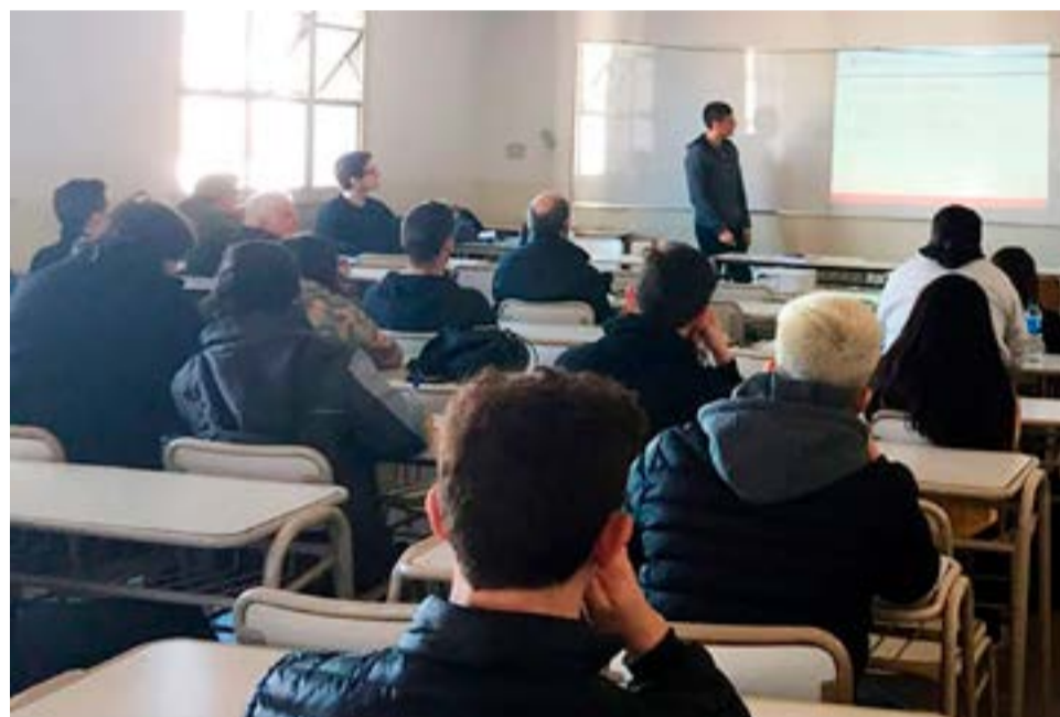
Los institutos que dictan profesorado se verán involucrados en los cambios que se definan en las mesas técnicas.

horas cátedra que sean a término o que dependan de la acumulación de horas que tengan. Entonces es un beneficio para todos los docentes y las docentes. Aparte, estas son algunas especificaciones técnicas, pero por supuesto que es todo para mejor. Nadie tiene por qué tener preocupación de que se recorten cargos ni nada de eso, por el contrario estamos en el proceso de homologación de nuevos códigos, de nuevos cargos para las instituciones. Entonces además de los que existen van a tener otros”, indicó.