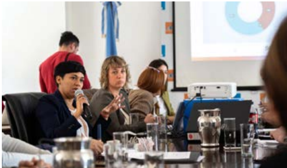
La ministra Analía Cubino junto a miembros de dicha cartera expusieron el presupuesto para el próximo año.

Asimismo, se presentó los proyectos a desarrollar, la Escuela Primaria del Barrio Zona Sur de Río Grande, EDEI (INET), el Jardín del Barrio Andorra, la Escuela N°47 y N°48, y las refacciones en los Colegios Alicia. M. de Justo, Haspen, las Escuelas N°6, 17 y el Jardín N°3. Se estima que con el Programa Fortalecimiento Infraestructura Educativa, Ley 1431, se realizará una primera etapa de 2 mil millones de pesos para el recambio de carpintería, impermeabilización de techos, refuncionalización de Baños Universales, reconstrucción de salas de máquinas, conversión de sistema de calefacción, implementación de Sistemas de Automatización y Monitoreo de Salas de Máquinas, refuncionalización CENT 35 Centro Regional de Simulación de Enfermería, ampliación del Centro de Educación Permanente para Jóvenes y Adultos con Discapacidad y la ampliación SUM Jardín “Chepa-chen”.