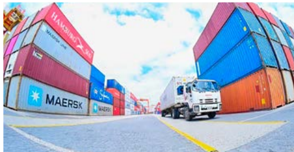
"El sistema SIRA es bueno, pero no está siendo efectivo para normalizar la situación de la producción industrial en Argentina. Una vez que se implementa, hay adecuaciones que hay que hacer y después salen distintas normativas, porque ahora las empresas de alto riesgo tienen que presentar nuevas garantías que se hacen difícil de conseguir. La automatización que se buscaba no se está logrando", manifestó.

do distinto y el sector textil hoy tiene una gran dificultad. Hay insumos que están en Aduana y depósitos fiscales esperando ser liberados. Una vez que sale la aprobación se ponen a producir, pero si no está la aprobación no se puede acceder a los insumos. Se compra al exterior, llega la mercadería, pero el Estado no aprueba el acceso a dólares para el pago de esa mercadería. Ojalá se encuentre un camino más lógico en el corto tiempo. La mayoría están estirando la situación, hay una empresa de Río Grande que fabrica aire acondicionado y sabe que, si en 15 días más no sale la aprobación de SIRA, no va a poder fabricar. Es realmente dificultoso", concluyó.