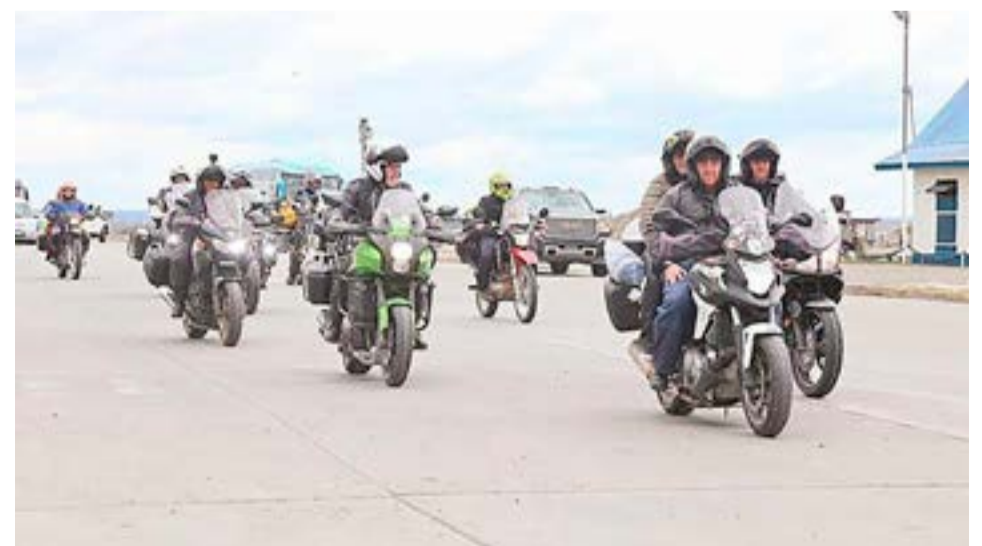
El pasado 23 de noviembre, ‘La Prensa Austral’ se hizo eco el cruce de una enorme cantidad de moteros notó que llamaron la atención de inmediato por su masiva presencia en el terminal de Punta Delgada, a la espera de poder cruzar hacia Tierra del Fuego, con destino a Ushuaia.