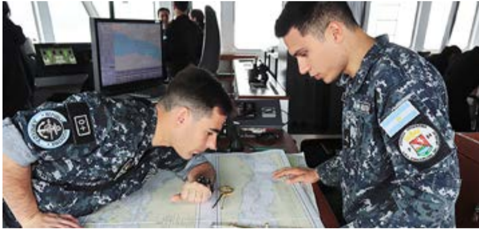
Tras fondear en la bahía, la mañana siguiente el "Contraalmirante Cordero" zarpó rumbo a la Isla de los Estados.

proa hacia el este de Tierra del Fuego, arribando a la Bahía Buen Suceso tras navegar por el Canal Beagle.