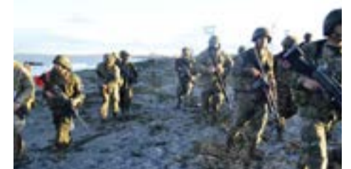
del Curso de Operadores de Botes de Asalto del BIM4.

La actividad se desarrolló en el marco del adiestramiento en técnicas de operaciones anfibia del BIM5 y de la etapa final