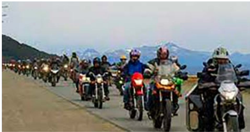
Las actividades comenzarán este viernes 25 de noviembre, con la recepción de motoviajeros en el ingreso a la ciudad.

Fuentes: El Diario del Fin del Mundo y La Prensa Austral.