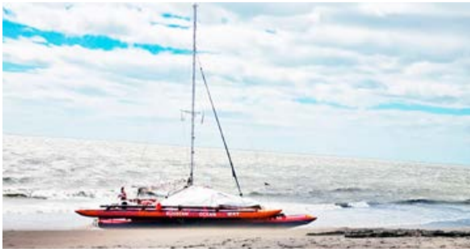
El velero ruso encalló en Río Grande. Personal de Prefectura Río Grande asistió a las cuatro personas de dicha embarcación. (Foto ((La 97)) Radio Fueguina).

documentación perfecta, se controló en Comodoro Rivadavia pero ellos habían ingresado al país desde el puerto de San Fernando. Nosotros los veníamos si-