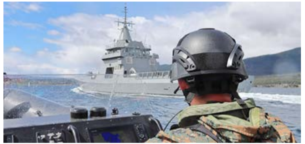
La unidad de la Armada Argentina zarpó desde el muelle militar "Comodoro de Marina Augusto Lasserre" poniendo proa hacia el este de Tierra del Fuego, arribando a la Bahía Buen Suceso tras navegar por el Canal Beagle.

Tras fondear en la bahía, la mañana siguiente el "Contraalmirante Cordero" zarpó rumbo a la Isla de los Estados. Allí desembarcaron embarcaciones menores para el recambio de personal y el reaprovisionamiento de víveres al puesto ubicado en Puerto Parry, único asentamiento humano en la isla establecido el 4 de diciembre de 1978 bajo el nombre de Apostadero Naval Puerto Parry y rebau-