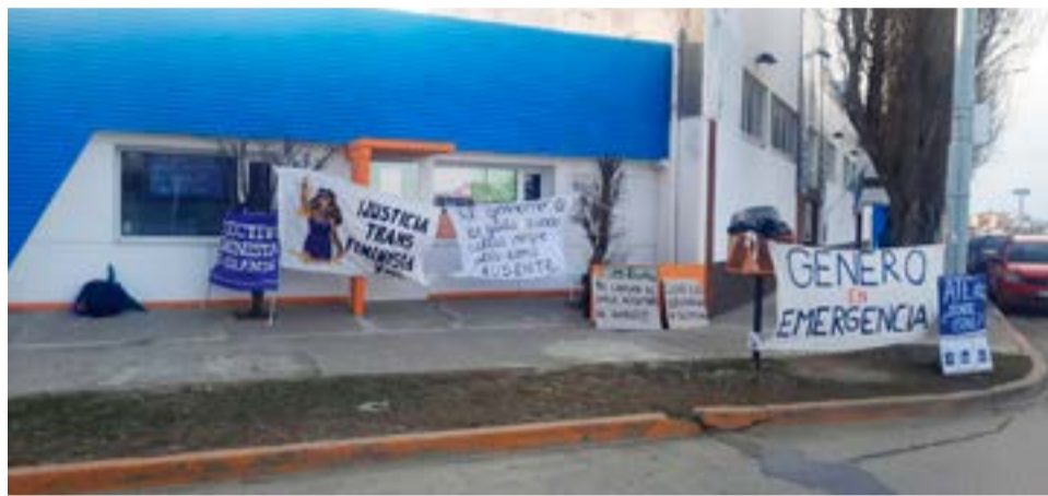
Trabajadoras que se desempeñan en la Dirección de Políticas de Género aseguran que se vieron obligadas a levantar las medidas, porque les advirtieron que de seguir con las asambleas sufrirían descuentos en sus salarios.

"Nueve meses de desidia y omisión. Repetimos que nuestra provincia cuenta con la tasa más alta de femicidios. Ya no tenemos más paciencia. Exigimos que las soluciones a los reclamos se dispongan en carácter urgente. Por eso pedimos a medios de comunicación puedan replicar este comunicado y exigir juntas que el gobierno de respuestas", concluía el texto que difundían en esa oportunidad, relatando los problemas que hoy aseguran se profundizaron.