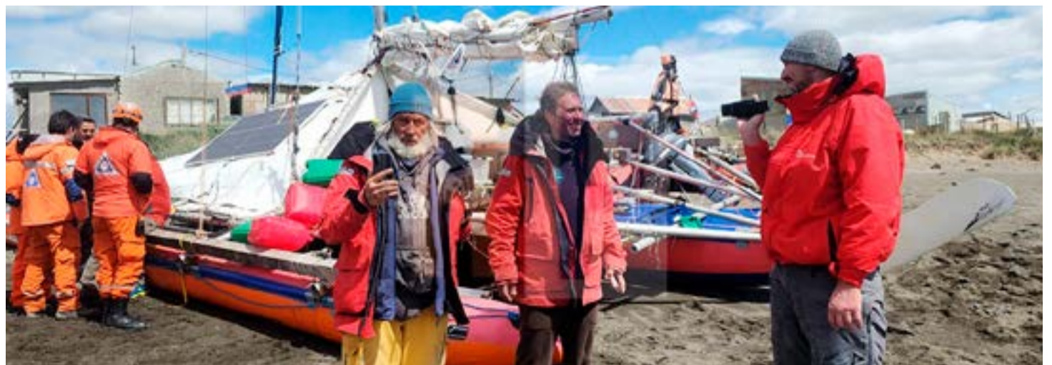
Desde Prefectura informaron que el velero ruso tiene la documentación en orden y que su viaje era monitoreado. (Foto gentileza FM Glaciar).

La tripulación consta de 3 hombres y una mujer, todos de nacionalidad rusa, con la curiosidad de que la tripulante femenina es nacionalizada argentina.