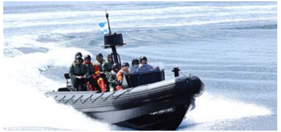
En Isla de los Estados desembarcaron embarcaciones menores para el recambio de personal y el reaprovisionamiento de víveres al puesto ubicado en Puerto Parry.

Una vez finalizados los relevos, el patrullero puso rumbo a Ushuaia. Estas actividades permiten, simultáneamente, el adiestramiento coordinado de los distintos medios que operan en el ámbito del Área Naval Austral, además del adies-