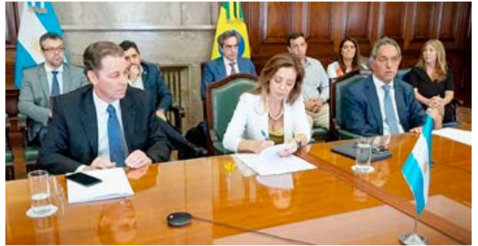
La Argentina y Brasil suscribieron la actualización del memorándum de regulación de intercambio de energía eléctrica y gas entre ambos países hasta 2025.

A partir del desarrollo de las reservas de gas no convencional en los campos de Vaca Muerta en la provincia de Neuquén, la Argentina se convertirá en exportador neto de gas.