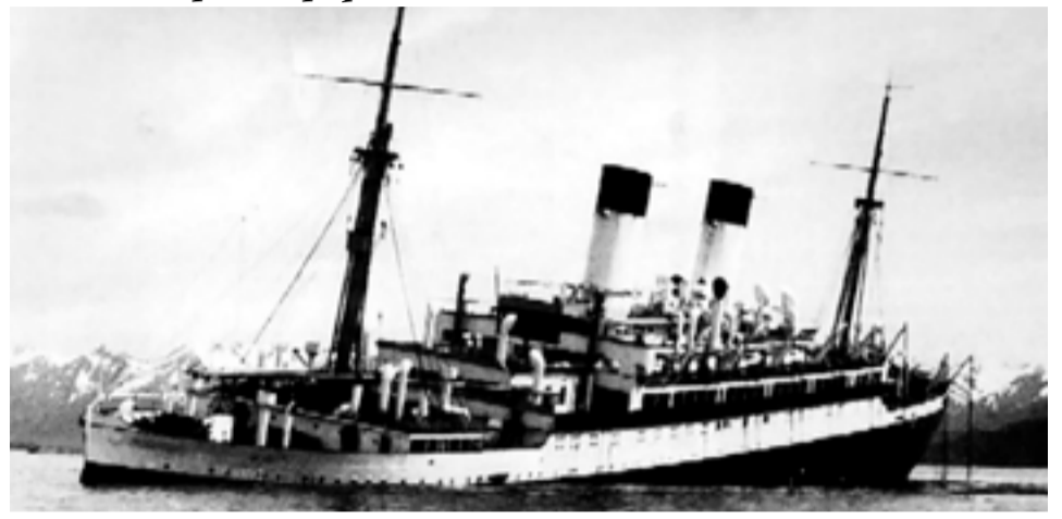
La muestra "Monte Cervantes, episodios de un naufragio" vuelve a la Antigua Casa de Gobierno desde el próximo sábado.

"La muestra estará vigente durante toda la temporada" adelantó luego. "Se utiliza mucho para el área de extensión, veremos si el año que viene la podemos tener, en esa misma sala o en otra, pero es un contenido que nos sirve para llegar a los más chicos, a los jóvenes y sobre todo a