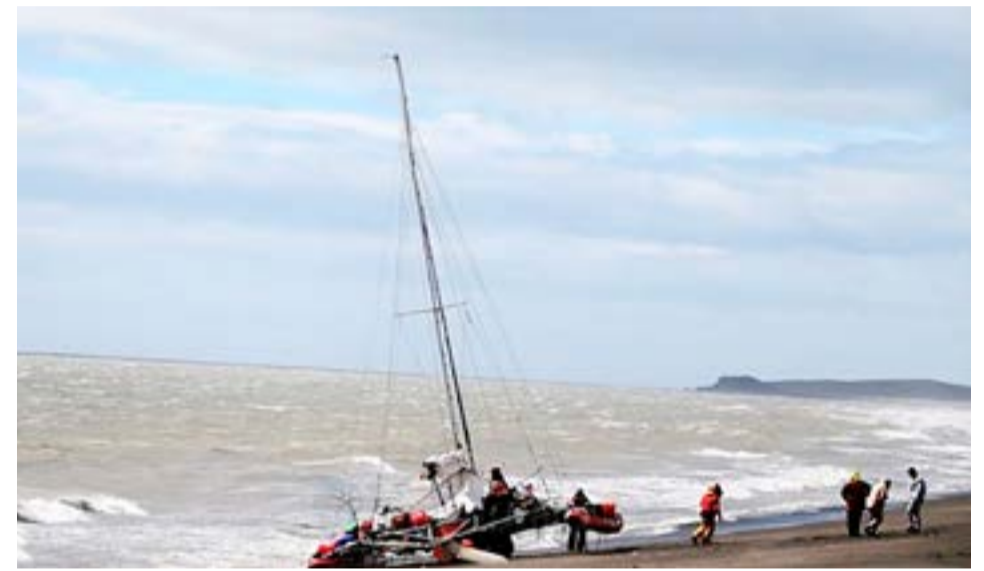
Debido a las fuertes ráfagas de viento acaecido en la presente jornada, una embarcación rusa que navegaba sobre el mar, encalló frente a la zona de la Margen Sur de esta ciudad y debió ser asistida por el personal de Prefectura Naval Río Grande.

cionada nave marítima y todos se encuentran en buen estado de salud. Caber destacar que integrantes del Club Náutico Ioshlelk Oten, les brindaron ayuda y las instalaciones para que duerman, hasta que mejore el estado del tiempo