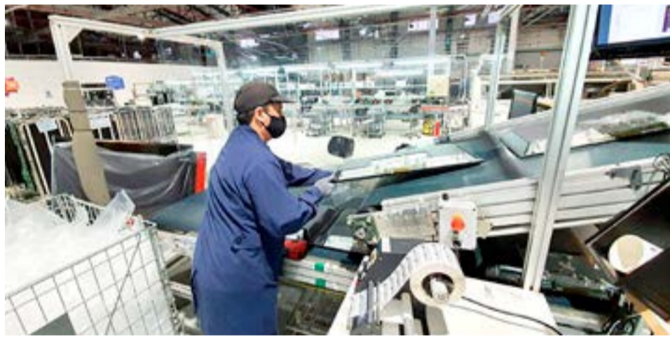
"Desde la UIF tenemos reuniones con la Unión Industrial Argentina cada 15 días y ahí uno ve el termómetro de la situación en todo el país. El tema que se trata siempre es cómo acceder a las divisas, cómo está impactando en la producción, las dificultades actuales, los esfuerzos que están haciendo todos. Estamos en un momento muy difícil", afirmó.

ma se iba a analizar lo que antes se hacía por distintas vías. Después está la instrumentación, y entiendo que hay demoras, reformas que hay que hacer, y luego están las reglamentaciones. Esta semana apareció una normativa nueva que pide distintas garantías que hay que presentar en Aduana según el perfil de riesgo y han estipulado distintos rubros", indicó.