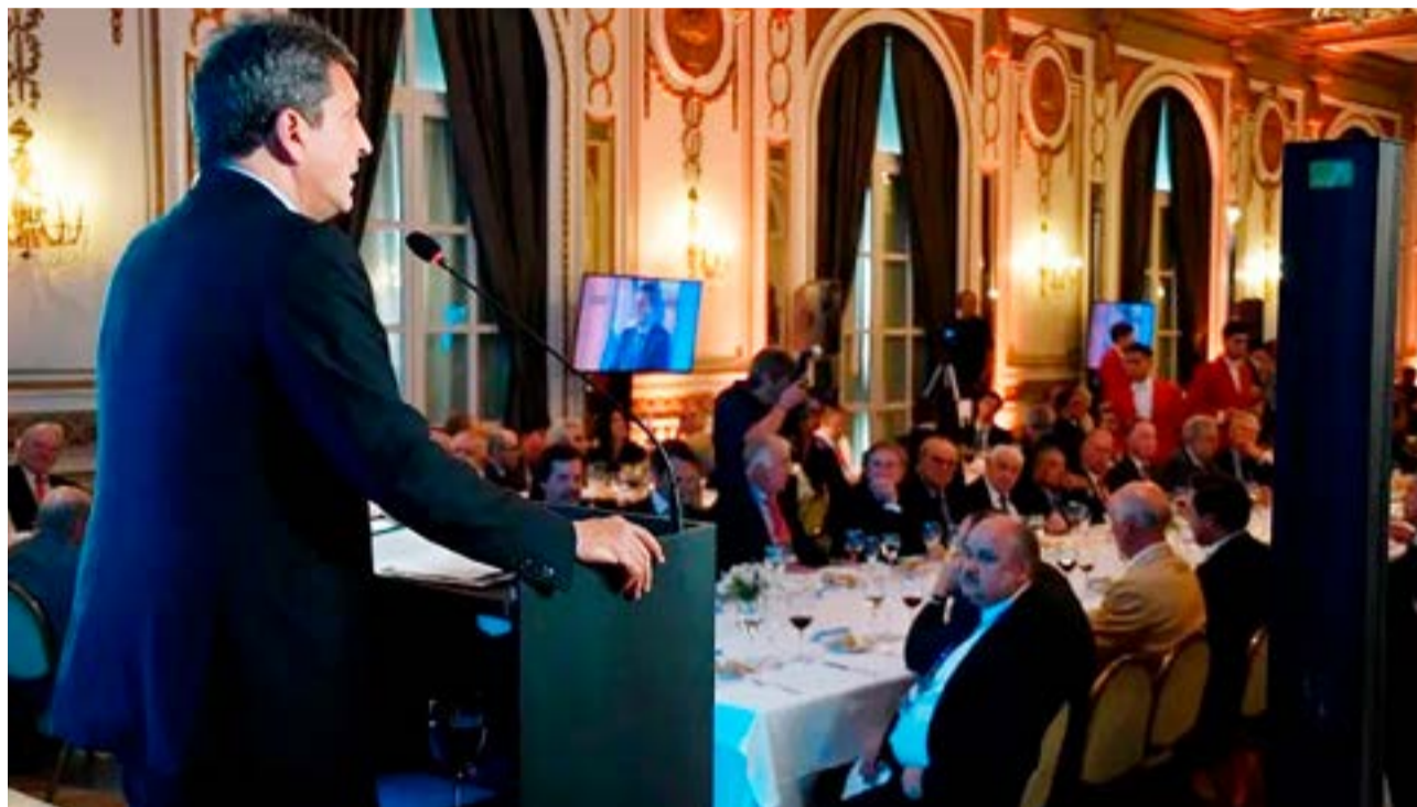
El ministro de Economía Sergio Massa participó como orador invitado este jueves del encuentro empresarial del Consejo Interamericano de Comercio y Producción (Cicyp) que se realizó en el Alvear Palace Hotel.

Luego, destacó las oportunidades para el sector energético con el lanzamiento del próximo Plan Gas 5 y las obras del gasoducto Néstor Kirchner. “No solamente vamos a tener un impacto enorme en inversión y acumulación de reservas. Sin USD 2.700 millones menos de compra de energía importada. Un programa a cinco años que le da certidumbre y largo plazo al sector que sentimos que es central para el desarrollo económico argentino”, señaló.