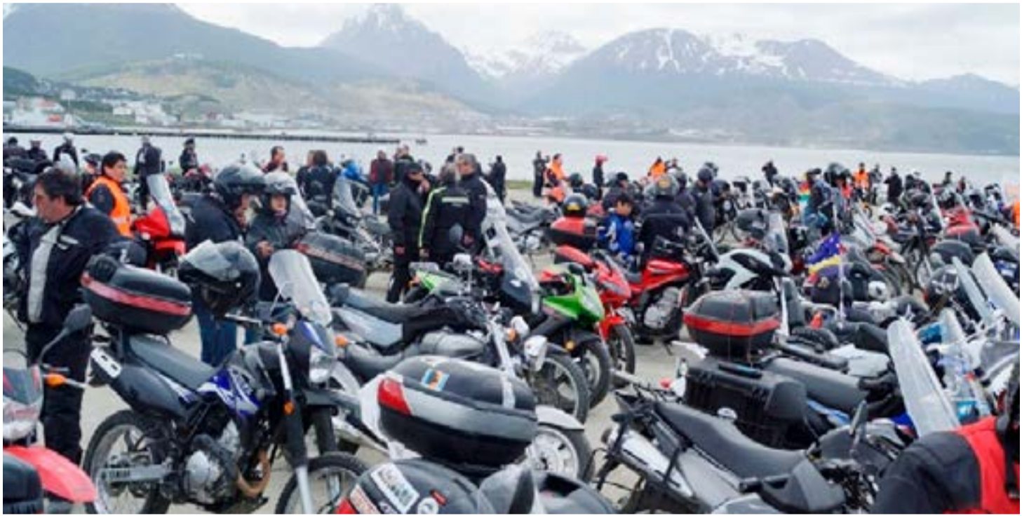
Unos 600 moteros se reúnen a partir de este viernes en esta capital fueguina en el 15° Encuentro Internacional de Motoviajeros en el Fin del Mundo.