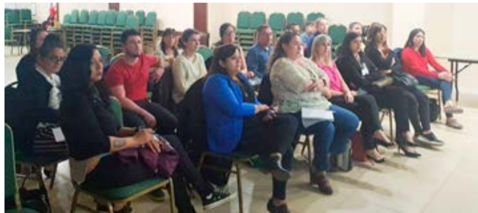
Participantes de la capacitación sobre la digitalización del trámite de nacimientos para los Registros Civiles de la Provincia.