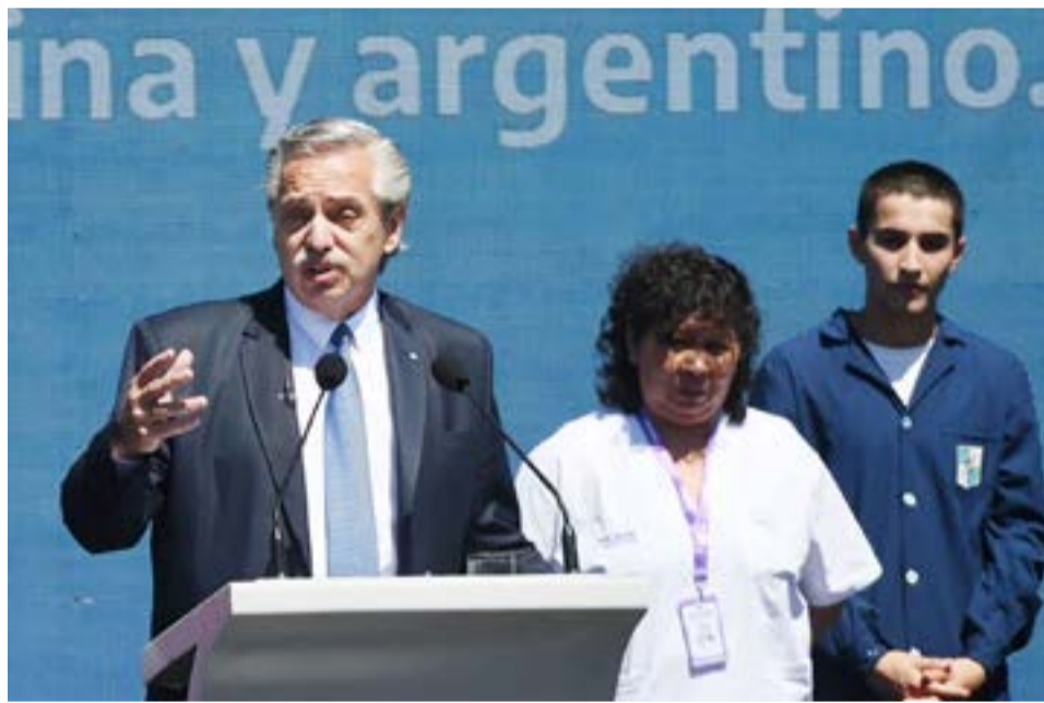
Sobre el final del tercer año de su gestión, sin Cristina Kirchner, sin la primera plana del sector duro del Gobierno, y en medio de la euforia mundialista, Alberto Fernández ratificó ayer, en un acto en la Casa Rosada, sus intenciones de competir por la reelección en 2023.

En la Casa Rosada son conscientes de las resistencias que provoca, especialmente en el kirchnerismo, cualquier manifestación sobre las intenciones de reelección. Sin embargo, aseguran que el primer mandatario está convencido, a pesar de la falta de apoyos internos y de su pobre imagen en las encuestas, de que tiene posibilidades de imponerse dentro del Frente de Todos en las PASO y, eventualmente, en la batalla posterior contra Juntos por el Cambio, en los comicios generales del 2023.