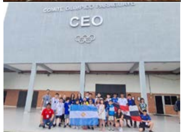
Delegación Argentina Paraguay 2022