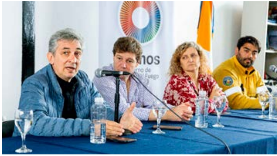
El gobernador de Tierra del Fuego Gustavo Melella brindó, junto al viceministro de Ambiente de Nación, Sergio Federovisky, a la ministra de Producción y Ambiente, Sonia Castiglione y al equipo del Sistema de Manejo del Fuego una conferencia de prensa donde luego de sobrevolar el territorio se brindaron detalles de la situación actual del ígneo en la Reserva Corazón de la Isla.

Finalmente, Federovisky indicó que “ofrecimos la incorporación de otros 20 brigadistas que seguramente estarán llegando el fin de semana. Tenemos también medios aéreos en reserva para el caso de que fuese necesario, están a disposición” y concluyó: “hemos ofrecido un trabajo en conjunto para a partir del mismo día en que demos por terminado este incendio fortalecer las brigadas locales, para que Tierra del Fuego cuente con un Sistema de Manejo del Fuego más robusto y más sólido”.