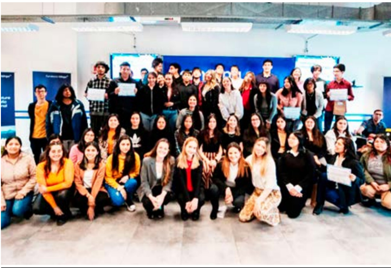
Con la participación de 60 jóvenes, culminó el programa educativo que busca empoderar a estudiantes de Río Grande mediante el desarrollo de habilidades tecnológicas.

La Fundación Mirgor: Desarrollo comunitario hacia el futuro, busca acompañar el desarrollo de las comunidades en donde Mirgor está presente a través de cuatro ejes centrales: educación, soluciones habitacionales, salud y cultura.