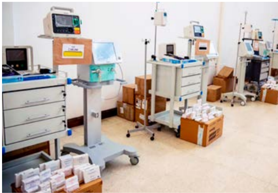
El ministro de Defensa, Jorge Taiana, y su par de Salud de la Nación, Carla Vizzotti, firmaron un convenio para el traslado y la entrega de equipamientos e insumos médicos en las trece bases antárticas permanentes y temporales de nuestro país.

Por otra parte, el acuerdo contempla la colaboración en proyectos de investigación y el fomento de producción pública de medicamentos a partir del trabajo conjunto entre el COCOANTAR e instituciones como el Malbrán y la Agencia Nacional de Laboratorios Públicos (ANLAP), como así también el intercambio y promoción de actividades conjuntas sanitarias de interés común en las bases antárticas. Incluye, a su vez, instancias de capacitación que se realizarán anualmente con todo el personal de sanidad del Comando a fin de incrementar los servicios de atención sanitaria y brindar mayor seguridad.