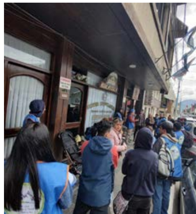
Vecinos de Ushuaia fueron a la Legislatura a reclamar por una ley de emergencia habitacional.

vecinos necesitan soluciones concretas, deben tomar el toro por las astas y actuar en consecuencia”.