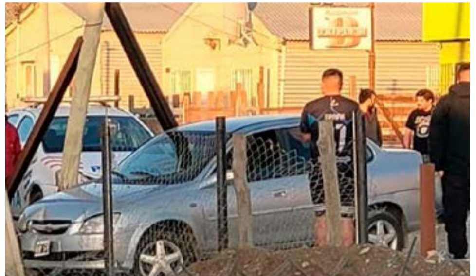
Circulaba con 2.58 g/l en sangre y chocó contra un poste en margen sur.