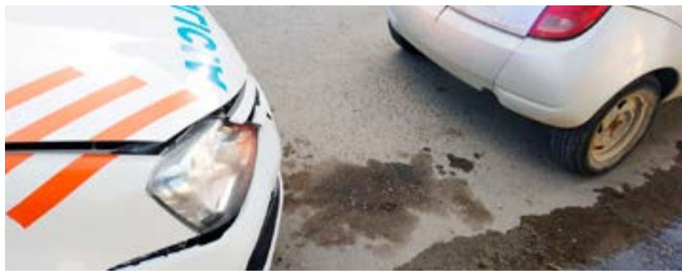
Conductora fue aprehendida tras chocar un móvil y circular en estado de ebriedad.

el móvil policial. De esta manera, se procedió a su aprehensión y asistencia en el Hospital Regional ya que se encontraba en evidente estado de ebriedad. Personal de tránsito efectuó test de alcoholemia arrojando 1,36g/l. El rodado fue resguardado.