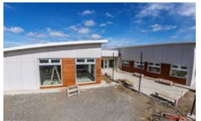
El nuevo Espacio Joven de Margen Sur es un lugar de prevención, dedicado al cuidado y al desarrollo de las juventudes de Río Grande.