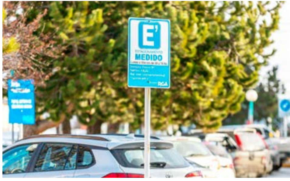
Respecto del estacionamiento medido, reconoció que “realmente hay que repensarlo, hay que repensar las zonas y los valores. Es uno de los temas que tiene en agenda la Secretaría de Gestión Ciudadana”, dijo.

“Esto se plantea con los mismos valores y frecuencias que existen en la actualidad, y con la aplicación funcionando, que nos trajo una solución porque no es lo mismo esperar 20 ó 30 minutos que saber el horario de llegada del colectivo a cada parada. La gente se puede quedar en su casa esperando, en un local comercial o en una garita, y fue muy importante trabajar en conjunto con la empresa de transporte. Ya fue anunciado que vamos a construir nuevas garitas en la ciudad en lugares que no las tienen y vamos a refuncionalizar otras. En todas estas