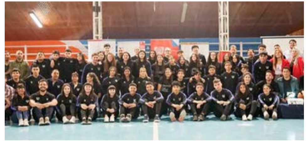
El seleccionado fueguino ya está compitiendo en los “Juegos Deportivos de la Patagonia” en las disciplinas de fútbol, vóley, básquet, natación, judo, atletismo y ciclismo MTB hasta el viernes 9 de diciembre en la provincia de Santa Cruz.

En la sede de Río Gallegos, se compite en básquet, voleibol, natación, judo y atletismo, mientras que en Puerto Santa Cruz se jugará el fútbol femenino y en la localidad de Comandante Piedra Buena se jugará el fútbol masculino y en Río Turbio se competirá en ciclismo, pero en la modalidad mountain bike.