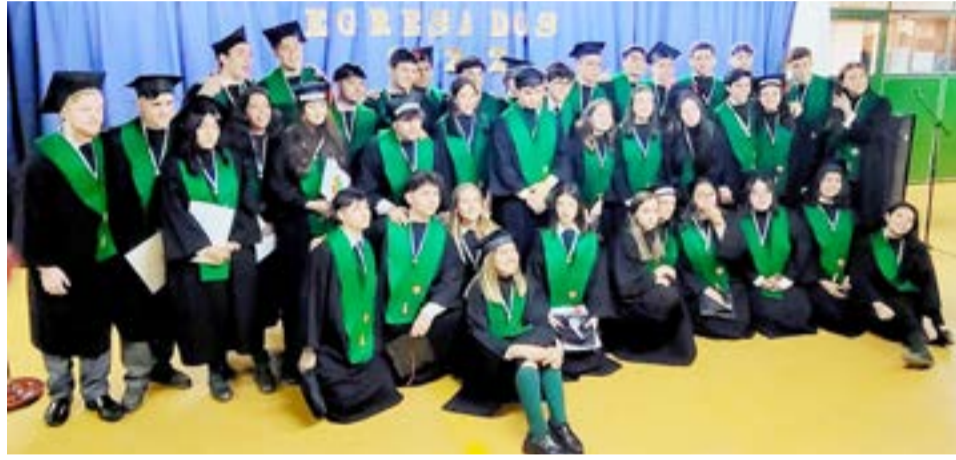
El Presidente de la FUNDATEC resaltó que "en el sistema de la FUNDATEC, sumando los 41 egresados de Ushuaia y los 78 del CIERG egresarán 119 alumnos en este 2022.

éxito de ellos es el éxito de la familia, así como el éxito del Colegio y sus docentes" y recordó en este sentido que "la