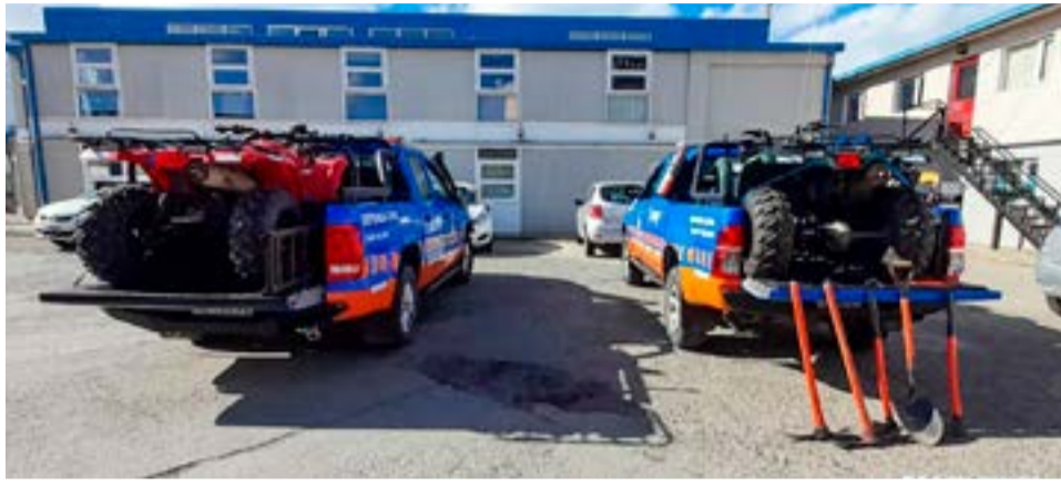
El Municipio de Río Grande dispuso enviar hacia la zona afectada equipamiento, camionetas y cuatriciclos 4x4 sumado a personal de defensa civil municipal. Este despliegue de recursos logísticos se realiza para colaborar con la Provincia y con Nación en el operativo para combatir el incendio que afecta a la Reserva Corazón de la Isla.

Finalmente, se recuerda a las y los riograndenses que, por resolución provin-