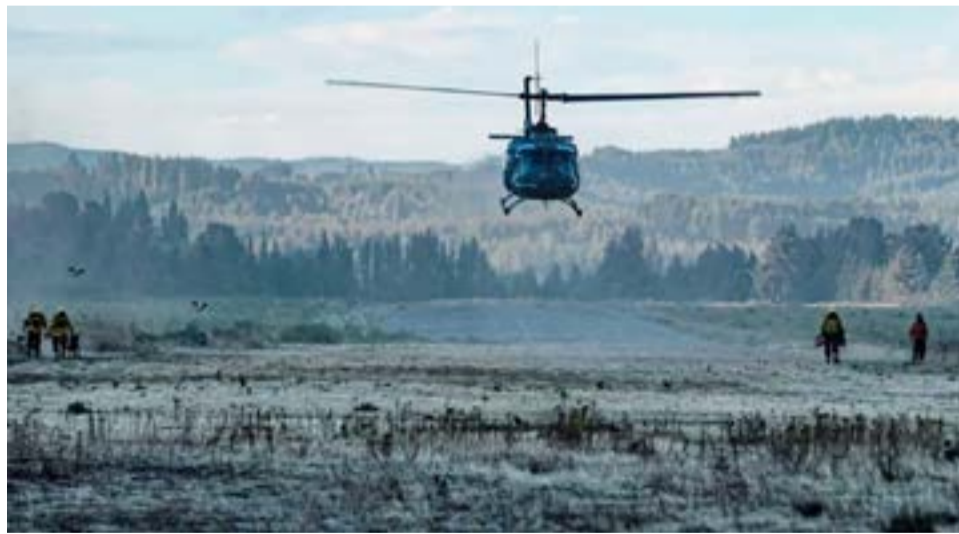
Se suma un avión hidrante, dos helicópteros y recurso humano de Nación para combatir el fuego en la Reserva "Corazón de la Isla".

las jurisdicciones y Parques Nacionales. Desde el Gobierno de la Provincia agradecieron el acompañamiento de la Policía de Seguridad Aeroportuaria; de Gendarmería Nacional y Protección Civil, quienes coordinaron el operativo del arribo del avión de la Fuerza Aérea Argentina.