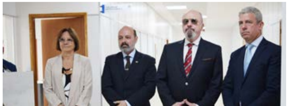
Hoy se define la quinta vocalía del Superior Tribunal de Justicia.

Asimismo, este lunes, se tratará el llamado a concurso para los juzgados Civil y Comercial N° 3 y Familia y Minoridad N° 3, ambos de la ciudad de Río Grande.