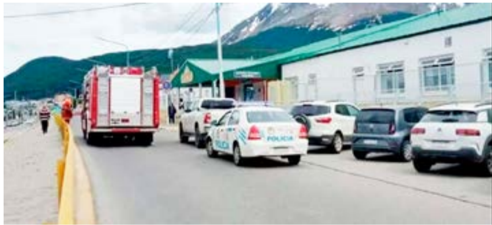
Durante la semana anterior la Escuela Especial Nro. 1, Kayú Chénèn, debió ser evacuada por problemas de infraestructura.

Finalmente expresaron "Lamentamos que estos hechos sigan aconteciendo en nuestras escuelas públicas, que nuestro estudiantado, docencia y personal de limpieza deba ponerse en riesgo porque los responsables miran para otro lado", concluye el comunicado.