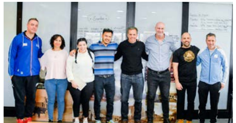
La Secretaría de Deportes y Juventudes de la provincia de Tierra del Fuego se reunió con parte del Comité Paralímpico Nacional.

adaptados. Así mismo se planteó poder lograr para el 2023 un encuentro regional patagónico sobre deportes paralímpicos, en el que se postularía a Ushuaia como sede del mismo, para albergar a profesores, entrenadores y referentes afines.