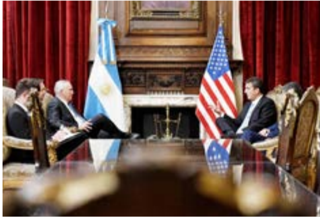
El ministro de Economía, Sergio Massa, firmará hoy el intercambio automático de información financiera entre la Argentina y los Estados Unidos.

Buenos Aires.- El Gobierno firmará hoy lunes con los Estados Unidos el acuerdo de intercambio de información financiera automática entre ambos países en un acto en el Centro Cultural Kirchner, anticipó este domingo el ministro de Economía Sergio Massa. Por otra parte, el Poder Ejecutivo planteará la discusión ante el Congreso sobre un nuevo blanqueo de capitales durante 2023.