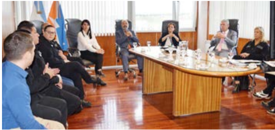
Los organizadores acordaron que a partir de 2023 las reuniones de Redes Interinstitucionales se realicen mensualmente.