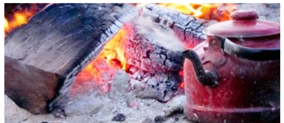
Se recuerda que en caso de emergencia pueden comunicarse a la línea 103 de Defensa Civil Municipal o en su defecto al 105 en caso de detección de columna de humo o principio de incendio.