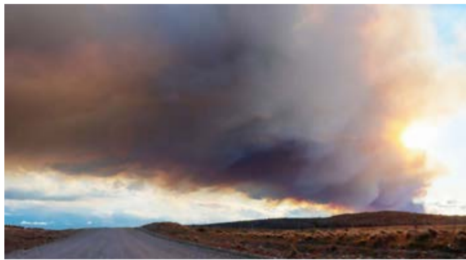
La densa columna de humo, puede divisarse desde distintos puntos de la ruta 3, y zonas aledañas.

Así lo indicaron en redes sociales del Gobierno de la Provincia, respecto del operativo que se ha montado en la ciudad de Tolhuin, a partir del incendio forestal declarado, el pasado 30 de noviembre en la