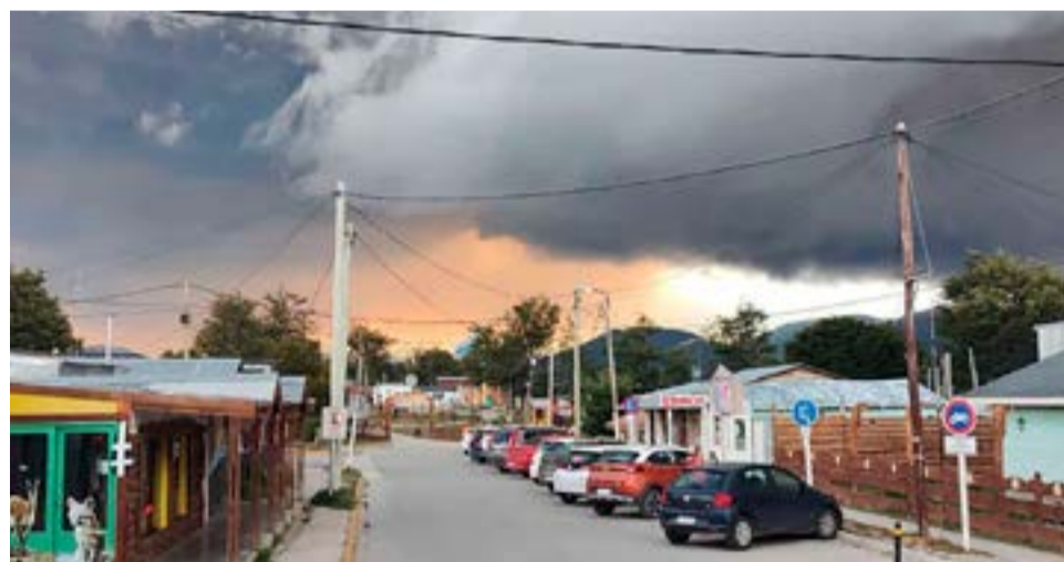
El fuego se puede apreciar desde la ciudad de Tolhuin.