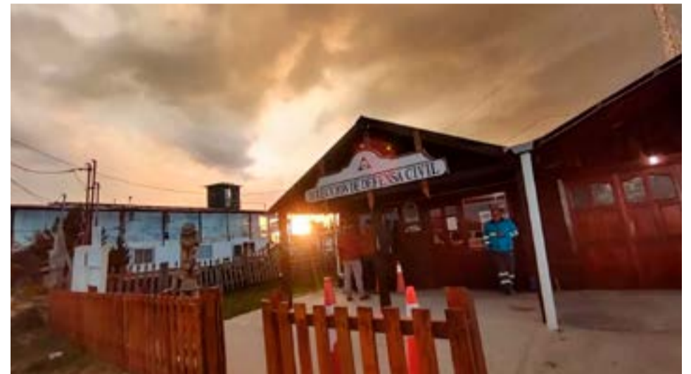
El Municipio de Tolhuin acondicionó el espacio del anexo grande del Polideportivo Ezequiel Rivero para recibir a 40 brigadistas de la Patagonia pertenecientes al Plan Nacional de Manejo del Fuego.

Además se reunirán elementos como guantes de trabajo, lentes de protección, medias de abrigo para recambio de los brigadistas, insumos de primeros auxilios como vendas, gasas, apósitos, solución