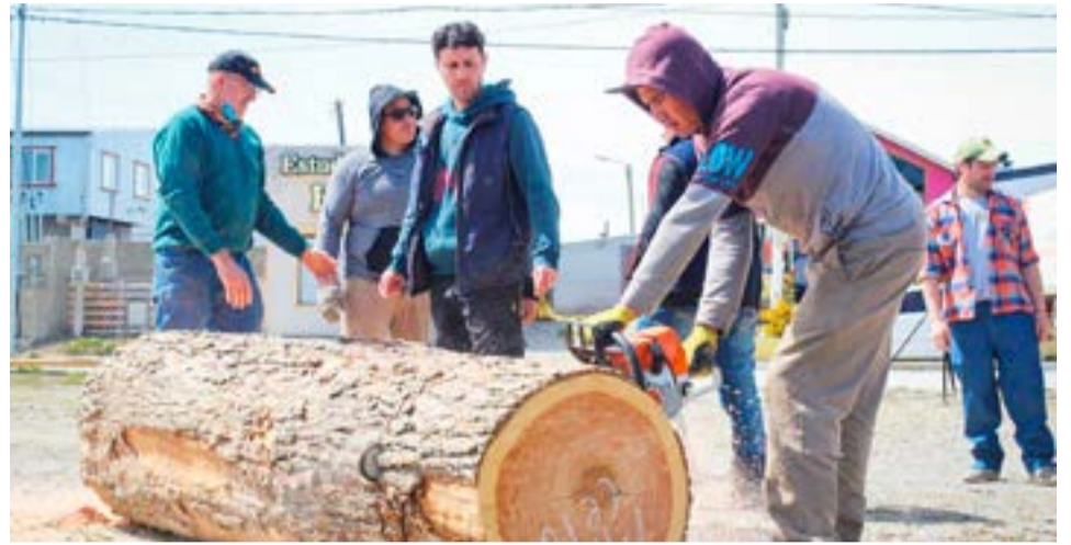
Postergaron la Fiesta Provincial de la Lengua Fueguina que se iba a realizar el próximo fin de semana.