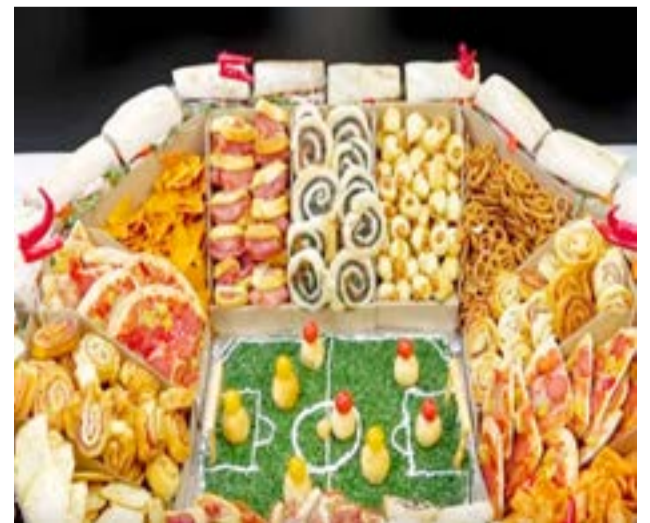
El Mundial ayudó a sostener la compra de alimentos, pero igual cayó.

Textil e indumentaria. Las ventas retrocedieron 18,2% anual en noviembre. El ramo está muy resentido porque los precios vienen aumentado fuerte. Las compras del público se orientaron a ofertas o promociones específicas. Las empresas están convencidas que en diciembre se venderá bien, y están preparando sus stocks para la fecha. Se trata de un rubro vinculado al desempeño del ingreso familiar.