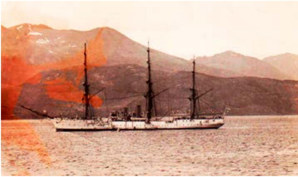
Velero con vapor, en el Canal Beagle.