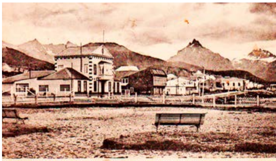
Postal del edificio de la Gobernación en Ushuaia.

En Punta Arenas debieron hablarles del crecimiento que estaba experimentando Ushuaia —una ciudad argentina de barracones de madera con apenas tres décadas de historia y aspecto de poblado del Far West, que prosperaba torno al penal de máxima seguridad que el Gobierno había abierto allí en 1902. La prisión, entre la orilla del Canal Beagle que conduce al Cabo de Hornos y las montañas al Sur de la Patagonia, funcionó hasta 1947 y acogió a algunos de los delincuentes más