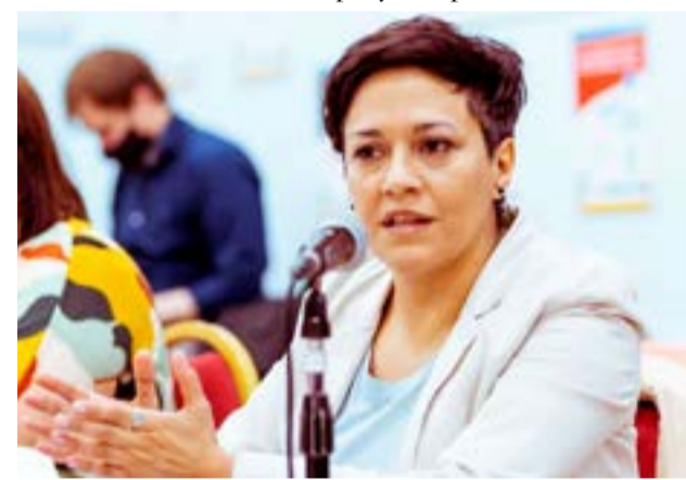
Analía Cubino, Ministra de Educación, Cultura, Ciencia y Tecnología.

a las elecciones 2023, para lo cual expresó que “la verdad que hoy estamos enfocados en la gestión, la mejor manera de colaborar en el proyecto político es haciendo