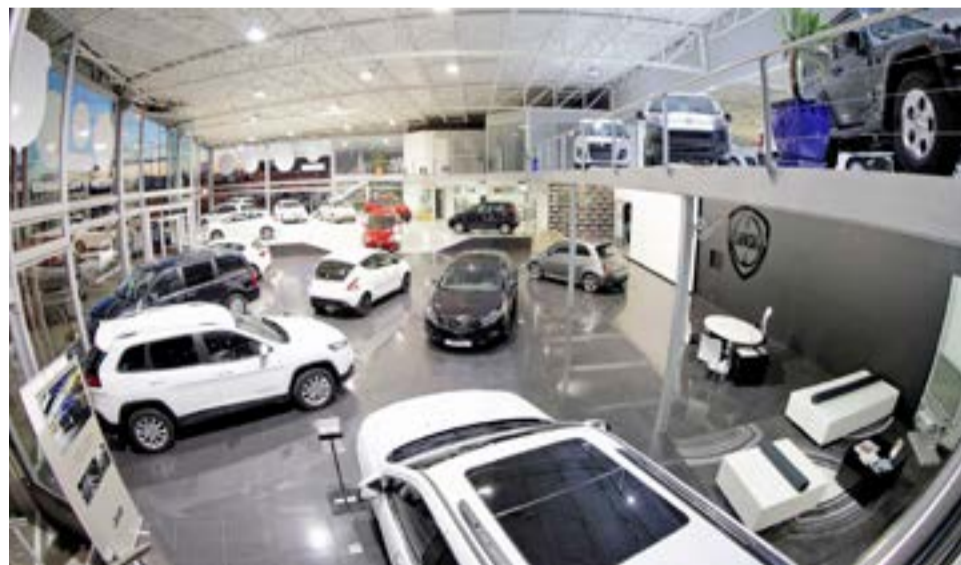
“Están convocados Volkswagen de Argentina, Toyota, General Motors, Renault, Ford, Fiat, Peugeot, Citroën y Honda, que enviarán sus representantes legales, y son todos socios principales de los estudios de abogados más grandes del país. Los demandantes son todos los fueguinos que conformaron esta acción de clase en 2017 y estamos convocados nosotros como sus representantes”, dijo el letrado.

“Están convocados Volkswagen de Argentina, Toyota, General Motors, Renault, Ford, Fiat, Peugeot, Citroën y Honda, que enviarán sus representantes legales, y son todos socios principales de los estudios de abogados más grandes del país. Los demandantes son todos los fueguinos que conformaron esta acción de clase en 2017 y estamos convocados nosotros como sus representantes. Son todos compradores de vehículos y cada