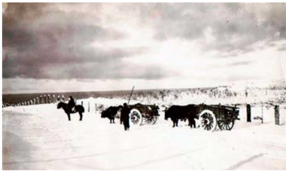
Presos del penal de Ushuaia, en plena sesión de trabajo con carros en la nieve. La geografía hacía difícil las fugas. Atribuida a Leopoldo Gago, cortesía de Manuel Fernández.