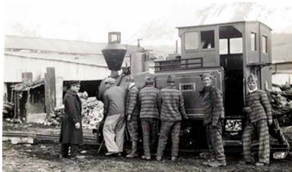
Foto postal de presos del penal de Ushuaia empujando una locomotora de vapor en 1932, con las montañas al fondo. Huir de la cárcel, entre el mar y las montañas, era muy difícil.

Ballenas varadas a la orilla del mar, una