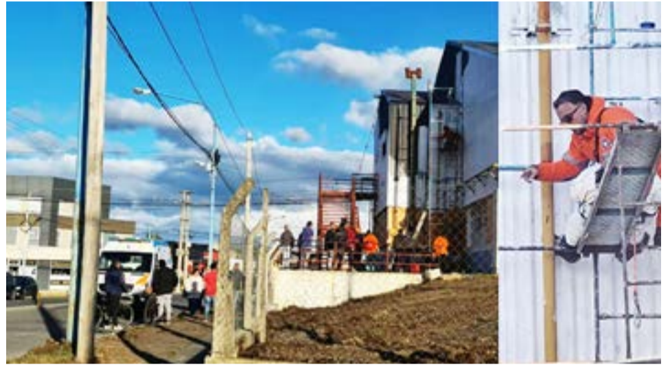
Personal de Defensa Civil del Municipio de Río Grande procedió a bajar al infortunado trabajador que se encontraba pintando una de las paredes del establecimiento educativo con el resto de los trabajadores.

Finalmente se conoció la triste noticia de que el infortunado trabajador, quien según extraoficialmente sufría de diabetes, falleció, pese a los infructuosos esfuerzos que realizaron bomberos y miembros de Defensa Civil para reanimar al difunto a través de maniobras de RCP, dando paso a la organización del operativo para bajar del andamio los restos del hombre.