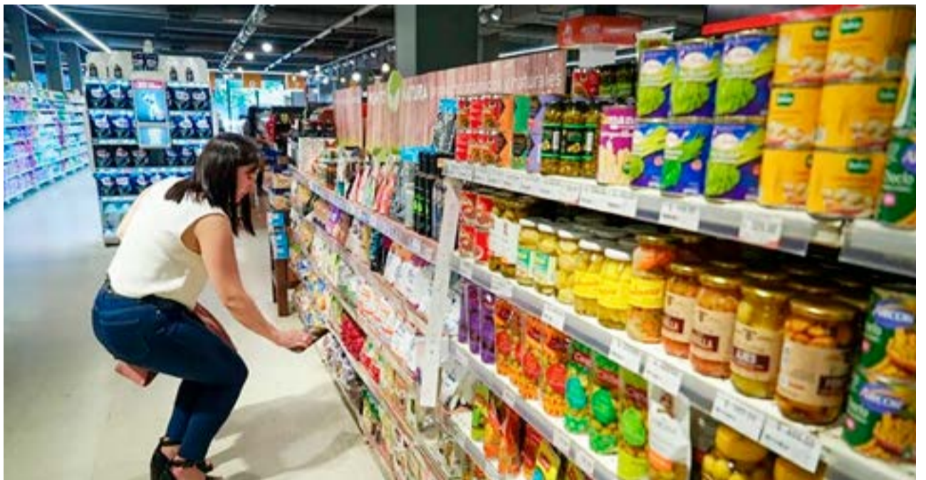
El tomate, la naranja y la manzana fueron los tres productos alimenticios que más aumentaron en enero.

Es el caso por ejemplo de la papa, cuyo valor de mercado era de $61,33 por kilo en enero del 2022 y llegó a los