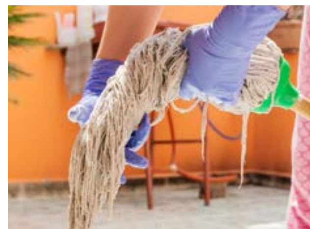
En diálogo con ((La 97)) Radio Fueguina, Sánchez señaló que “los aumentos son los acordados en paritarias en diciembre, venimos organizándonos desde hace tiempo, el grupo viene trabajando en varios proyectos, así que nos venimos ayudando por suerte y venimos despacito, pero con la tranquilidad de ir haciendo las cosas bien”.

“Hay que seguir insistiendo, porque así como en su momento se agregó el adicional zona hay que tener la diferencial, hay que insistir con esto de nuestra situación insular -relató la empleada doméstica-. Este año se cumplen 10 años de la ley, hay un montón de cosas por hacer y, a partir del encuentro que participé en Buenos Aires el año pasado, estuve en contacto con compañeras de Latinoamérica y el Caribe y, mal de muchos consuelo de tontos, pero somos uno de los países que tienen mejor situación con respecto a una ley sobre nuestro sector”.