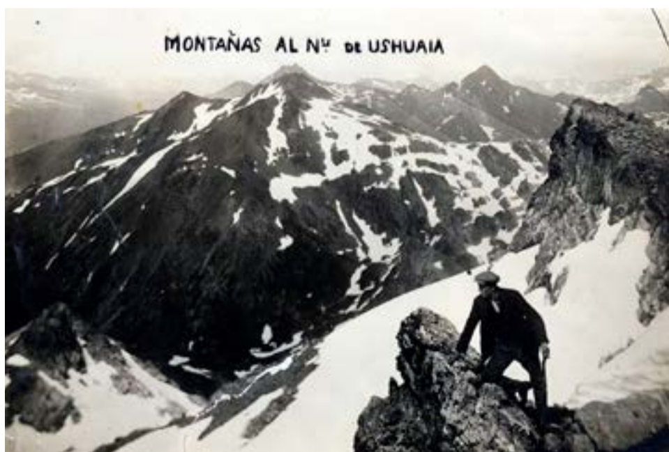
Montañas al norte de Ushuaia. Atribuida a Leopoldo Gago, cortesía de Manuel Fernández.

cárcel con presos muy peligrosos al pie de las montañas, nativos de la agreste Tierra del Fuego que viven en un clima hostil, una ciudad que creció en torno a