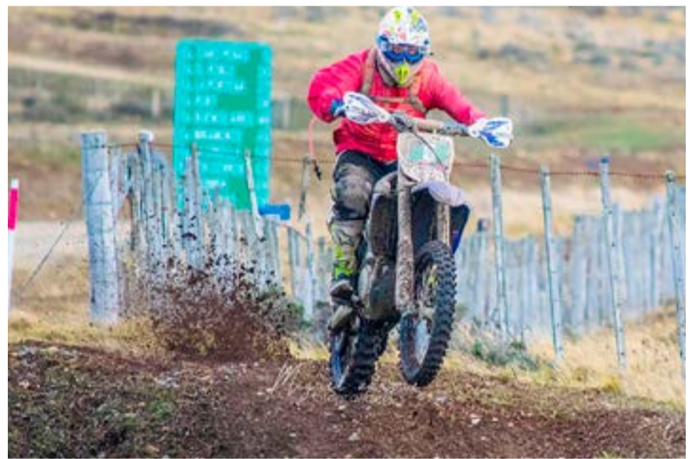
El pasado viernes se concretó la segunda ventana de inscripción para lo que va a ser la XXXIX edición de la Vuelta a la Tierra del Fuego, y con un total de 114 pilotos dio la impresión de que no se estará dando la afluencia multitudinaria de pilotos de años anteriores.