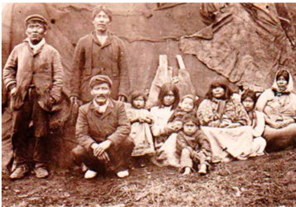
Indios yaganes, nativos de la Tierra del Fuego. Atribuida a Leopoldo Gago, cortesía de Manuel Fernández.

‘albacea’ de las imágenes de los Gago. Y a Punta Arenas, al otro lado del terrible Cabo de Hornos, se fueron padre e hijo desde Brasil en busca de mejor fortuna. No estuvieron en la ciudad de la costa