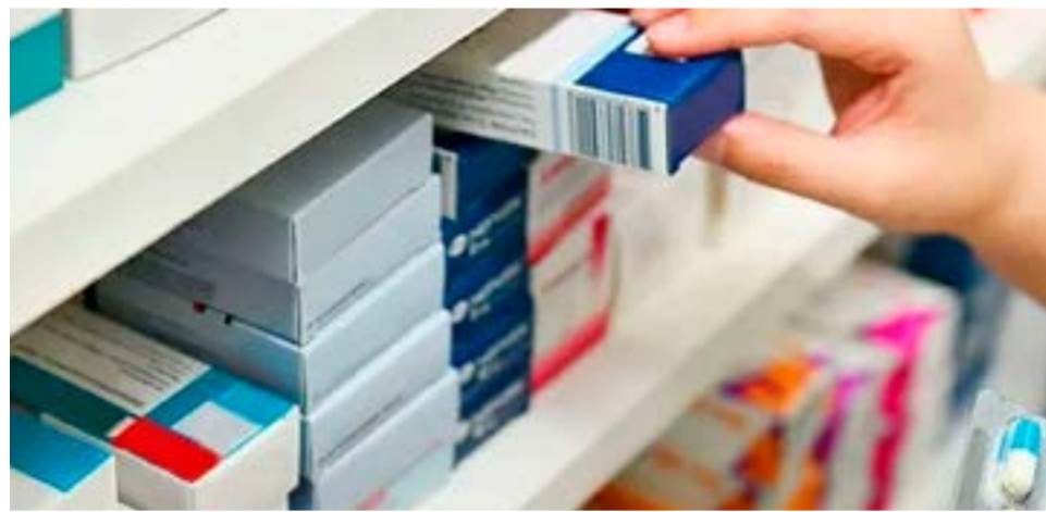
Los productos de venta libre subieron entre 7% y 10% en enero. Están exentos de los toques que puso el Gobierno.

tan (antihipertensivo), clopidogrel (antitrombótico), paracetamol (analgésico), ciprofloxacina (antibiótico), ibuprofeno