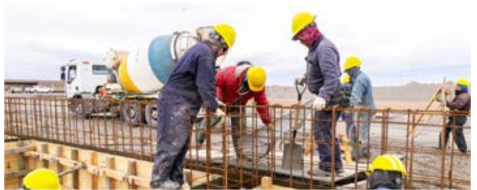
Tierra del Fuego mantiene uno de los mayores índices de empleo registrado asalariado del sector privado en el país.

De acuerdo a datos del Ministerio de Trabajo y Empleo de la provincia, en cuanto al empleo registrado privado, en el mes de septiembre último se registró uno de los mayores índices de crecimiento. Al ser comparado el último