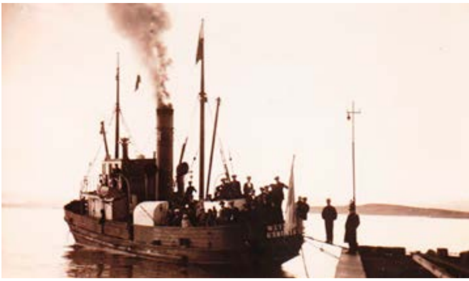
Puerto de Ushuaia.

peligrosos del país, como Cayetano Santos Godino, alias 'El Petiso Orejudo', un joven psicópata que ha pasado a la historia como uno de los primeros asesinos en serie.