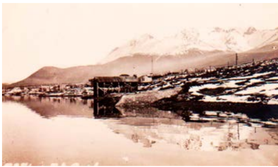
Vista de Ushuaia, entre el mar y las montañas.

chilena más allá de unos meses, tiempo suficiente como para tomarse una fotografía en el estudio de Pacheco fechada el 27 de abril de 1914. Los dos aparecen bien trajeados y con una gorra en la cabeza; el niño de 14 años está de pie, el padre, con un frondoso bigote que empezaba a estar anticuado, posa sentado en una suerte de sillón medieval.