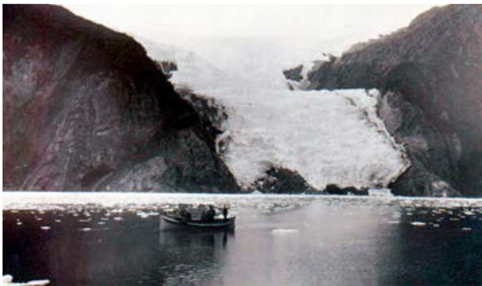
Glaciar en Tierra del Fuego. Atribuida a Leopoldo Gago, cortesía de Manuel Fernández.