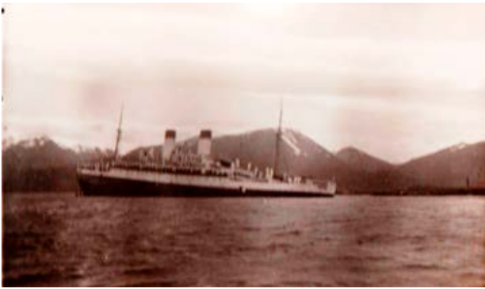
Nafragio del Monte Cervantes tras zarpar desde Ushuaia, el 22 de enero de 1930. El barco rozó el fondo y el capitán lo llevó a encallar en los islotes Les Eclaireurs. Así se pudo salvar a toda la tripulación y los pasajeros.