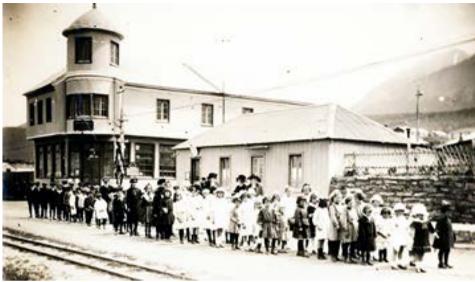
Escolares en Ushuaia. La ciudad más austral del mundo, fundada en 1884, creció en torno al penal a partir del siglo XX.

Padre e hijo desembarcaron en Brasil, “posiblemente en Río de Janeiro, y allí alguien les habló de Punta Arenas, en Chile”, cuenta Manuel Fernández, moderno