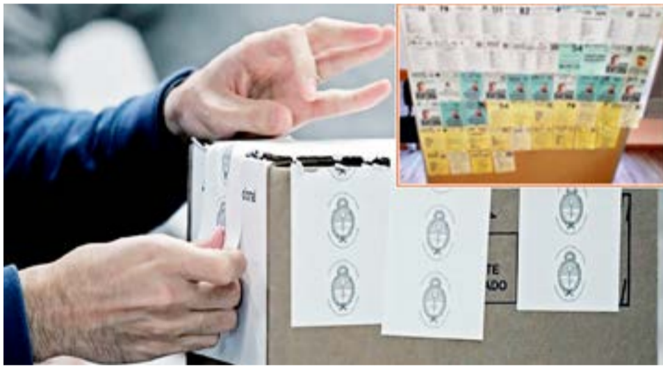
Serán 41 agrupaciones políticas, siendo este número prácticamente igual al de las elecciones del año 2019, cuando 42 espacios obtuvieron el visto bueno de las autoridades.

son infractores por ello, no los vamos a tener incorporados, y tendrán que hacer el trámite en el Registro Civil para que