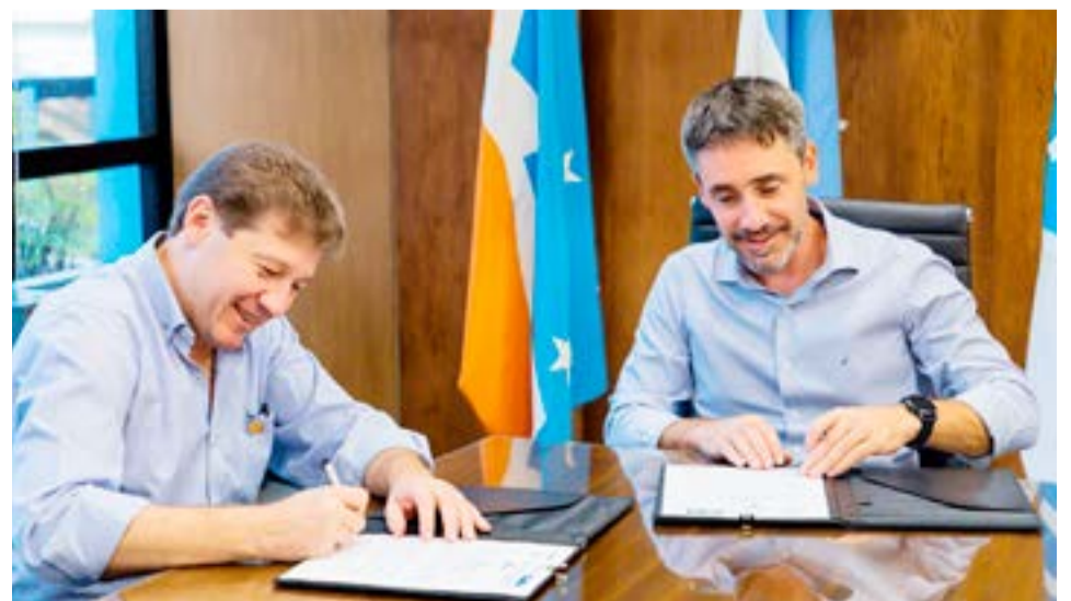
El gobernador Gustavo Melella informó que "este plan plantea encarar un trabajo de unificación de todos los datos que hay, de todas las investigaciones y también de los protocolos ambientales y sociales".

Por último, el Gobernador definió al "Plan Hidrógeno Patagonia" como "muy importante", puesto que al abarcar a toda la región "tiene más fuerza y aumenta los volúmenes de producción; y para nosotros es muy importante trabajarlo codo a codo con todos los gobernadores y gobernadoras de nuestra región".