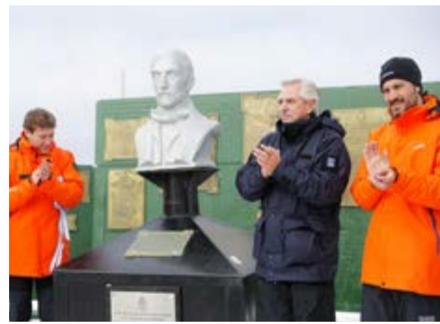
"Nuestra presencia ininterrumpida en el terreno sería única por casi 40 años e implicó la consolidación de la vocación antártica nacional y el inicio de una verdadera política de Estado con respecto a la actividad de la Argentina en la Antártida", explicó en un comunicado la cartera que conduce Santiago Cafiero.

En sintonía, la Cancillería remarcó que el "compromiso ambiental argentino se demuestra con la propuesta presentada junto a Chile de creación de un Área Marina