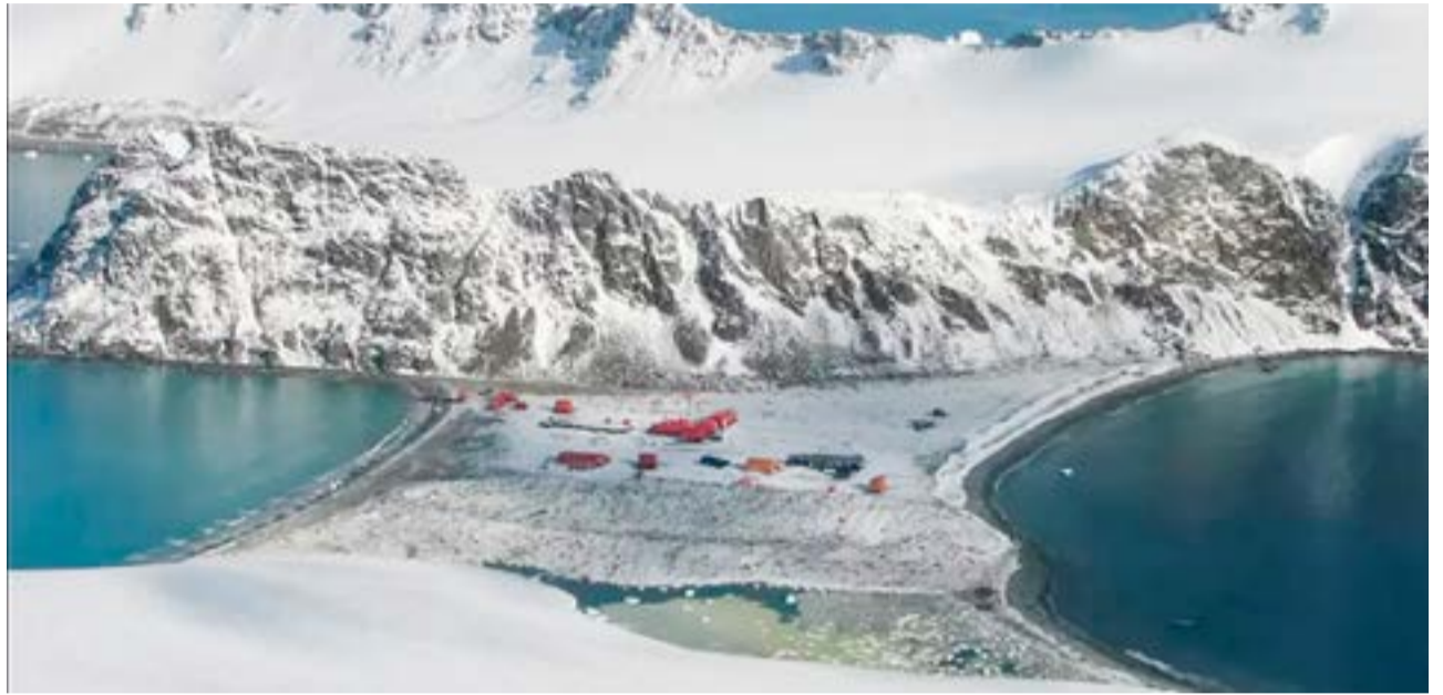
La estación en la isla Laurie, como luce en la actualidad, entre las dos bahías.

Acuña continuó trabajando en el Ministerio de Agricultura hasta 1910, cuando ingresó en el Banco Español del Río de la Plata. Murió el 13 de mayo de 1953.