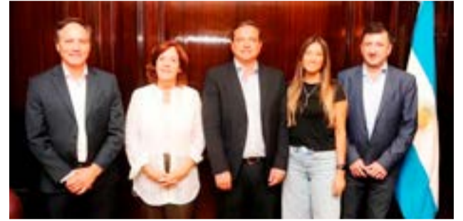
Se quebró el bloque del Frente de Todos en el Senado: cinco legisladores formarán una bancada propia.

Al igual que el senador de Entre Ríos, Espínola y Snopek también registraban una última etapa en la que se habían distanciado de la figura presidencial. Y si bien el grupo