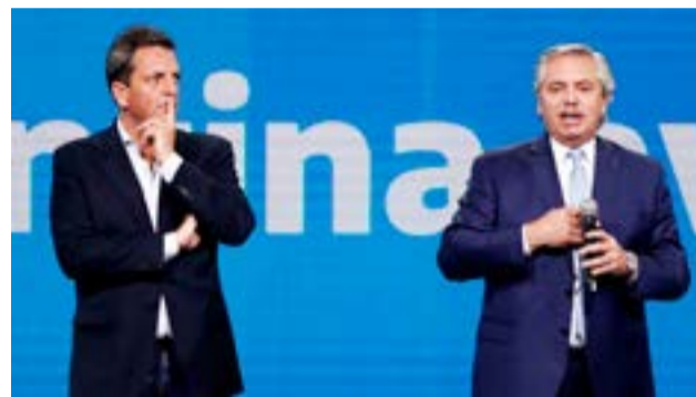
El nuevo Jefe de Gabinete de Ministros, Agustín Rossi, firmó junto al ministro de Economía, Sergio Masa, la Decisión Administrativa 122/2023 que dispuso la primera ampliación presupuestaria neta para el corriente año.

"Que el citado incremento se financia con una reducción por igual importe de las transferencias corrientes al Fondo Nacional de Desarrollo Productivo (Fondep).