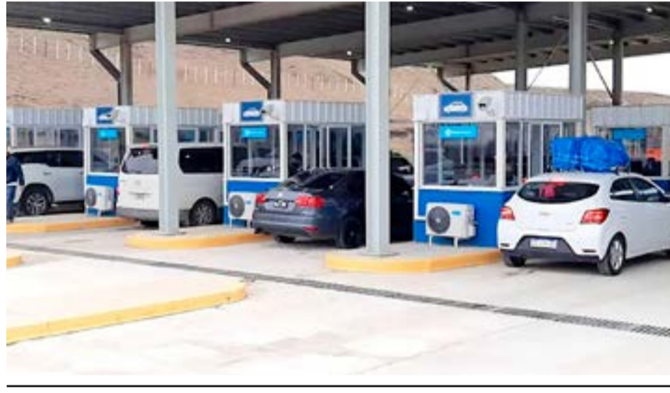
Alrededor de veinticinco mil personas salieron de la provincia durante el mes de febrero.

También señaló que “hay que remarcar que este año estuvo especialmente movido, dado que contabilizando los egresos que se han registrado durante el sábado 18 y el domingo 19 de febrero, vemos que fue el fin de semana con más salidas de la actual temporada, donde hubo un total de 3.038 personas que egresaron durante esos días por el Paso Fronterizo San Sebastián”.