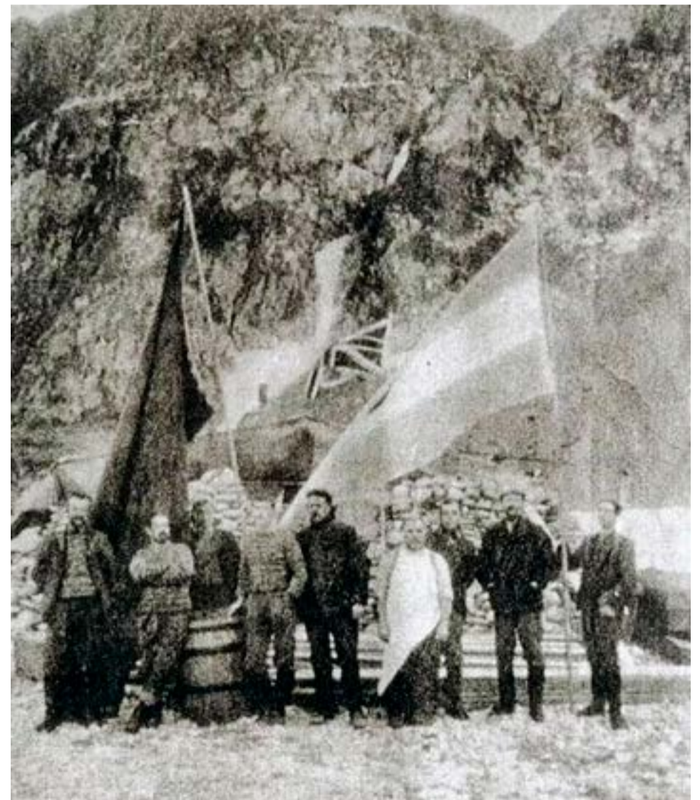
Cuando el Scotia partió, la bandera que flameó fue la argentina. La presencia argentina motivó diversas protestas de la diplomacia inglesa

El 25 de mayo hubo mal tiempo, con cielo cubierto y nevadas esporádicas. A las nueve de la mañana se izó la bandera y al son de una mandolina ejecutada por Valette, se cantó el himno nacional y la marcha de Ituzaingó para conmemorar la