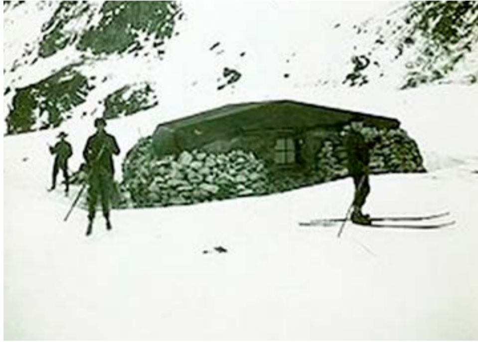
En la soledad total. La casa construida en la Isla Laurie, en las Orcadas del Sur. Paredes de piedra y techo de lona.

rrogantes sobre cómo sería la vida allí motivó la necesidad de estudiarla científicamente. Fueron varias las expediciones del Viejo Mundo que pusieron proa al continente blanco. Las más conocidas