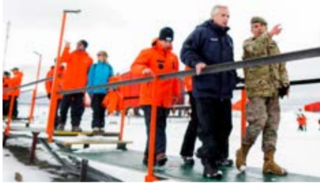
El presidente Alberto Fernández anunció este miércoles la creación de una "corresponsalía itinerante" de la agencia pública de noticias Télam en la Antártida argentina con el objetivo de dar visibilidad a la información vinculada al continente blanco.

Ushuaia.- El presidente Alberto Fernández anunció este miércoles la creación de una "corresponsalía itinerante" de la agencia pública de noticias Télam en la Antártida argentina con el objetivo de dar visibilidad a la información vinculada al continente blanco.