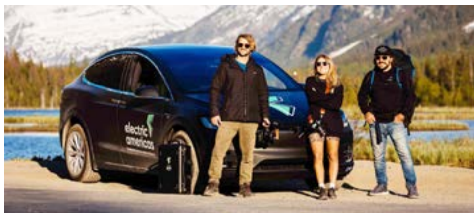
El tour Electric Americas llegó recientemente a El Salvador. Se trata de un equipo de personas que está cruzando el continente americano en un automóvil eléctrico, desde Alaska hasta Patagonia. Su meta es conducir 20,000 millas en seis meses, a través de doce países, lo cual empezó a partir de junio de 2022. Y ahora viajan por tierras salvadoreñas.

proyecto fue demostrar que ya hoy es posible recorrer distancias largas con autos eléctricos, y con eso facilitar la adopción de movilidad eléctrica por el público en