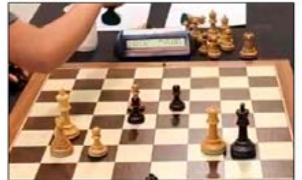
Momento justo donde se observa 2 segundos de Leandro y 0 segundos de Adolfo Paris.

48...Dg6 49.Dxc6+ [el reloj digital marca la bandera, se acabó el tiempo de Paris, lagrimas salen de los ojos del riograndense nuevo campeón argentino sub 14.] 1-0