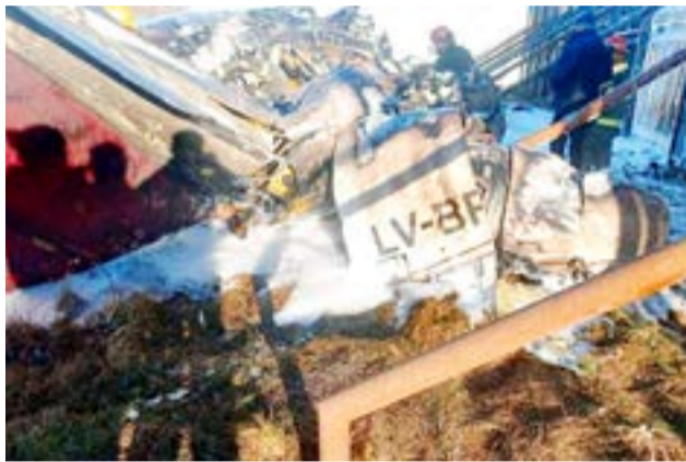
Prosigue la investigación de la caída del avión sanitario que se estrelló en Río Grande el 1 de julio del año pasado.

nos tira un nombre de carátula como 'Atentado contra la Seguridad Aérea', pero eso se debe entender como un concepto general, pero en lo particular la carátula tiene la denominación de 'Accidente' aéreo, todavía no podemos llevar adelante un informe total porque nos falta todo lo que venga de la Junta (Junta de Seguridad en el Transporte de la Nación -JST-) que debe determinar cuál fue la razón de la caída de la aeronave", explicó la magistrada.