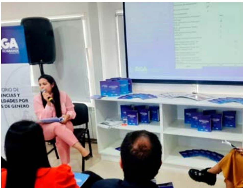
Se realizó la presentación del Primer Informe de la Incidencia de la Violencia por motivos de Género y Diversidad, del Observatorio de las Violencias y Desigualdades.