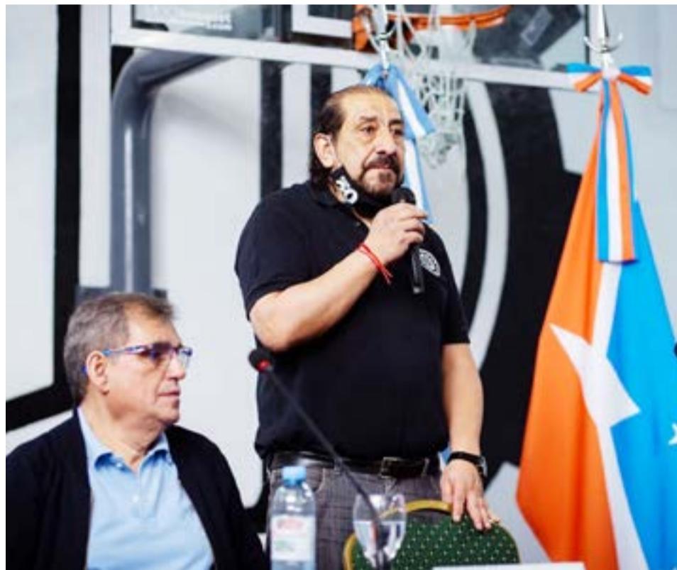
El secretario General de la UOM Río Grande se refirió a la situación del sector.

“Los compañeros han realizado distintas gestiones, para tratar de lograr como mínimo algún grado de atención y resolución de sus problemas. Cuestión en la cual, lamentablemente, no se ha podido avanzar. Esperemos que a partir de este