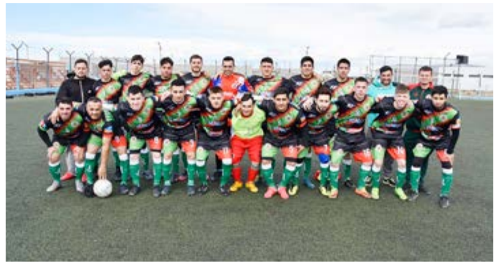
El equipo de Deportivo Frías, primera división.