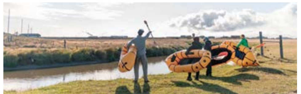
Entre las actividades que ofrecen se encuentra un recorrido histórico por la ciudad, y la visita a Cabo San Pablo y Estancia San Pablo.

Es fundamental el trabajo articulado del Municipio de Río Grande con agencias receptoras como Tierra Turismo porque