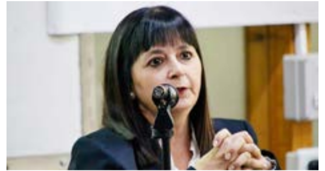
La Juez Federal de Río Grande, Dra. Mariel Borruto, aclaró que la carátula de 'Atentado contra la Seguridad Aérea', es solo una formalidad legal general inserta en el Código Penal.

fue a las 14:10 (17:10 UTC) y describe que: "Durante la fase de despegue, cuando la aeronave se encontraba en vuelo a escasa altitud, experimentó un rolido de manera brusca hacia la izquierda provocando la pérdida de control de la misma e impactando contra el terreno".