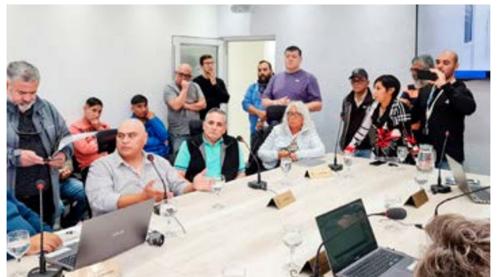
Propietarios y chóferes de taxis y remises se hicieron presentes este lunes en el Concejo Deliberante.