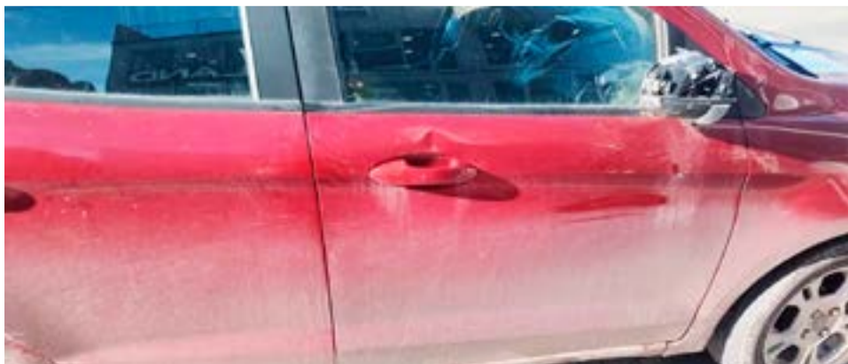
Las marcas que dejó el siniestro en el rodado estacionado.

calada de 37 años, un motovehículo Beta, color negro, sin chapa patente, conducido por Federico Ravetti de 25 y una Toyota rav4 color gris, propietaria Nadia