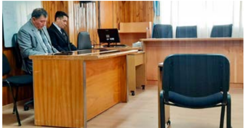
Policía recibió 4 años de prisión por el abuso sexual de una sobrina y se podría iniciar una segunda causa por otros hechos de abuso cuyas víctimas también serían de su entorno familiar.

mismos estrados judiciales, entendiéndose que habría peligro de fuga. En este marco también, se ordenó se ponga en conocimiento al juzgado de Instrucción de Turno y a la Fiscalía, acerca de las posibles situaciones de vulnerabilidad de las que habrían sido víctimas, otros menores del entorno familiar de Benítez. La lectura del fallo completo se hará el próximo 20 de marzo.