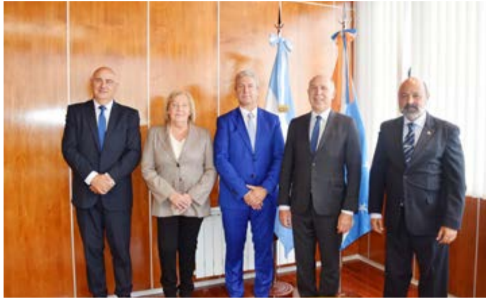
Los jueces del Superior Tribunal de Justicia de la Provincia de Tierra del Fuego, Antártida e Islas del Atlántico Sur, recibieron este viernes 3 de marzo, la visita protocolar del Ministro de la Corte Suprema de Justicia de la Nación, Dr. Ricardo Lorenzetti.

Ushuaia.- Los jueces del Superior Tribunal de Justicia de la Provincia de Tierra del Fuego, Antártida e Islas del Atlántico Sur, recibieron este viernes 3 de marzo, la visita protocolar del Ministro de la Corte Suprema de Justicia de la Nación, Dr. Ricardo Lorenzetti.