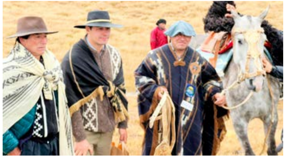
El RENATRE participó de la 49° Edición de la Fiesta del Ovejero el pasado 5 de marzo en el potrero Pedro Pechar de la Estancia "El Roble", a 45 km de Río Grande.

El evento contó con la participación del RENATRE, UATRE, Instituto Fueguino de Turismo y la Asociación Rural de Tierra del Fuego AeIAS. La participación de la delegación del RENATRE en Tierra del Fuego se enmarca en la promoción y difusión de los derechos y beneficios de estar registrado en el organismo, tanto para los trabajadores rurales como para los empleadores del sector.