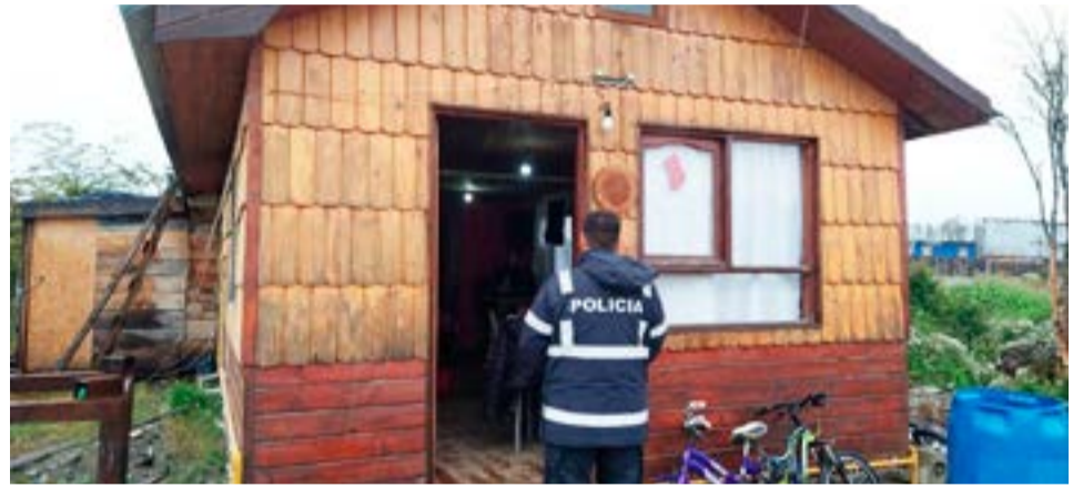
Recién este fin de semana, ordenaron los allanamientos y se detuvo al menos a 8 personas.

Según dan cuenta en el parte policial, se procedió al secuestro de elementos de interés y todos los nombrados quedaron detenidos en carácter de incommunicados.