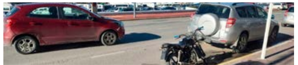
Motociclista chocó contra la puerta de una camioneta estacionada sobre calle Maipú y salió despedido.