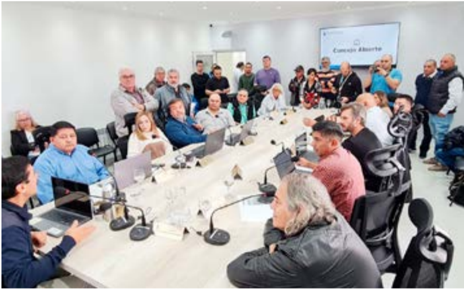
Este lunes los Concejales debatieron junto a taxistas y remiseros la ampliación de licencias de taxis y remises.

Cabe resaltar que el objeto del proyecto de ordenanza establece la ampliación de 30 licencias para taxis y 30 para remises, lo que arroja un total de 60 licencias o permisos nuevos, que sumados a los actuales da un total de cuatrocientos cuarenta y nueve (449) licencias, lo cual como se expresó se aproxima a la estimación poblacional actual de la ciudad, todo ello de acuerdo a lo estipulado en la Ordenanza Municipal N° 2067/05.