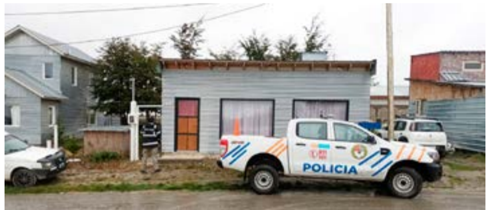
Se realizaron un total de 5 allanamientos.