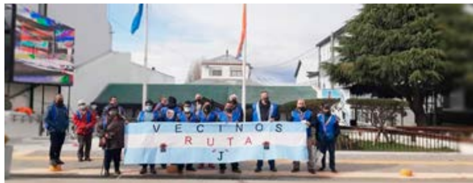
Cabe destacar que la Asociación Civil Emprendedores de Ushuaia ‘Amigos de la Tierra’ viene reclamando para que la Legislatura sancione la Emergencia Habitacional.

“La cruel realidad es que hay una crisis habitacional, por más que los intendentes y el gobernador anuncien algunas viviendas, porque el número de que hablan es exiguo. En Ushuaia en los últimos me-