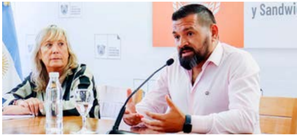
Juan Marcelo Maciel, ministro de Desarrollo Humano de la Provincia adelantó que "en breve llevaremos a cabo una capacitación laboral con incentivo económico en relación a cuestiones gastronómicas".