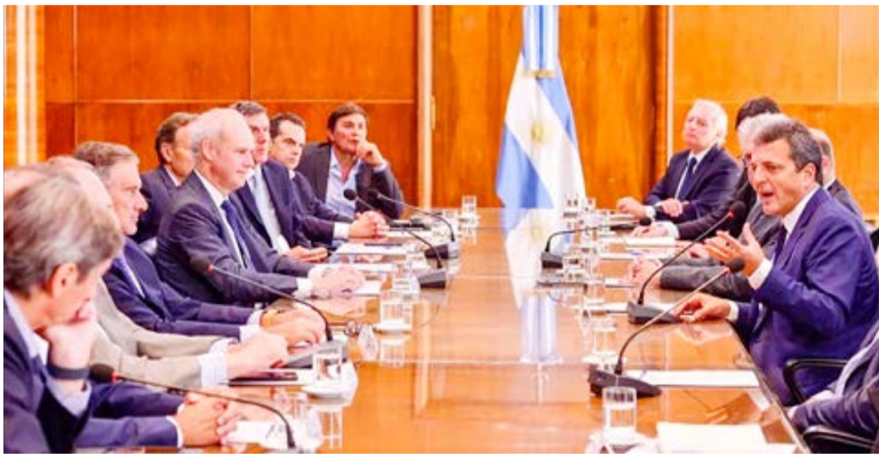
La reunión de ayer al mediodía entre el ministro Sergio Massa y los banqueros.

En el Palacio de Hacienda consideraron que el comunicado opositor sobre el peligro de una operación de deuda como la que se anunció hoy solo busca "hacer ruido". "La deuda en pesos tiene un riesgo asociado a la política. Los bancos se protegen de alguna necesidad financiera o de mercado habitual o quizás de algún anuncio poco feliz de la oposición", dijeron con sorna desde un despacho oficial. "El riesgo y las tasas altas están asociados a eso", concluyeron.