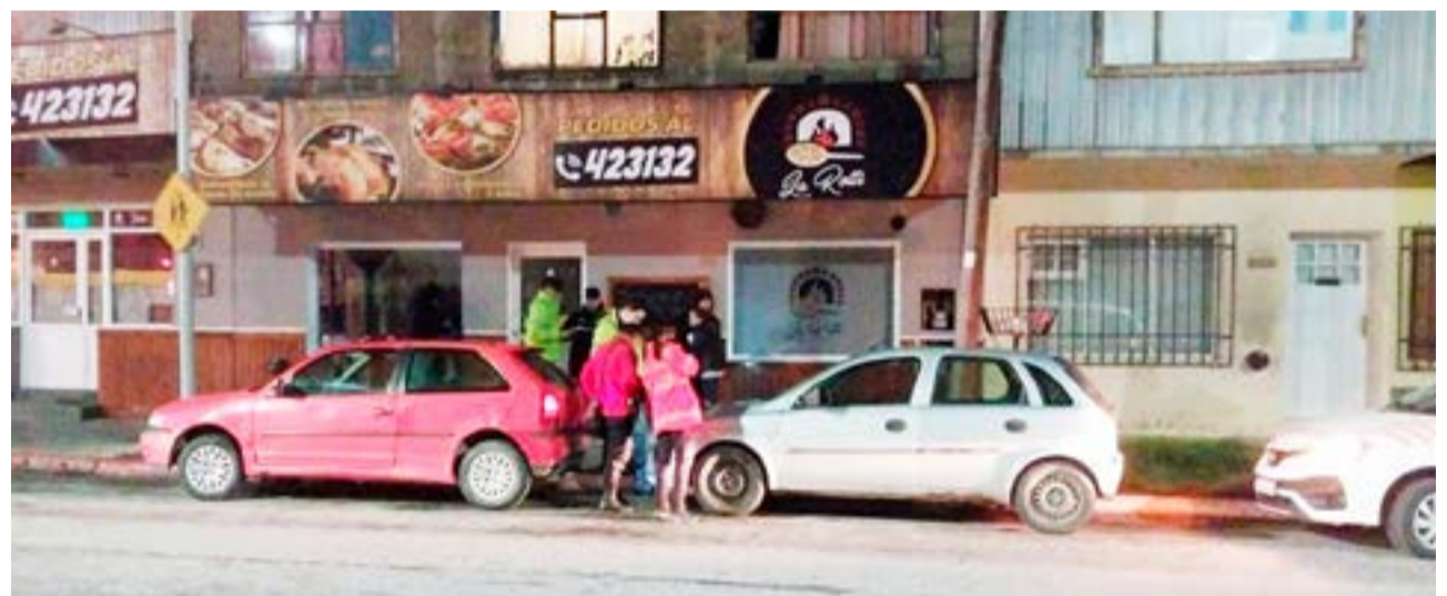
Chocaron en Magallanes y Darwin. no hubo heridos, pero hubo golpes y un borracho

Ushuaia para pericia de rigor y posterior se le hará entrega a un familiar.