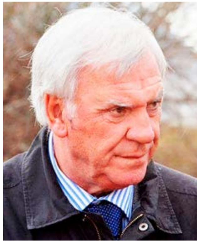
José Estabillo, ex gobernador e intendente de Ushuaia.

den del día. Hoy tenés 40 partidos políticos que van a dirimir las elecciones de Tierra del Fuego. El candidato que debe plantear su proyecto tiene que ser serio y realizable. Yo hasta hoy conservo el proyecto de vida de nuestro Gobierno que en un 90% fue logrado, más allá de los errores cometidos”.