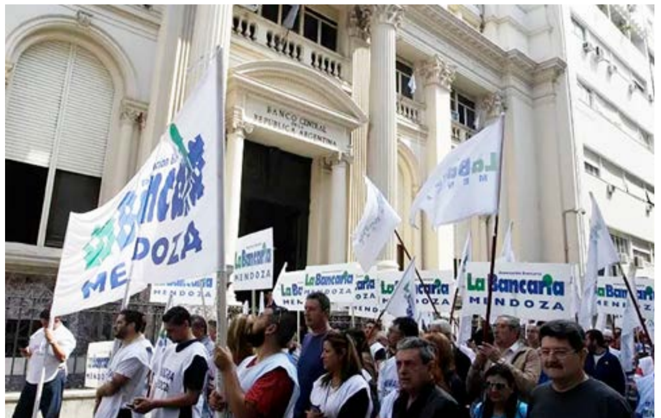
La negociación paritaria de los bancarios sigue dilatándose sin llegar a acuerdo alguno y se fijó una nueva reunión para el miércoles entre el gremio, las cámaras empresarias y el ministerio de Trabajo.

La negociación entre las partes se desarrolla con la participación de la ministra de Trabajo Kelly Olmos y funcionarios de esa cartera, el nuevo encuentro paritario se fijó para este miércoles desde las 10 en las oficinas de la sede ministerial de la avenida Alem.