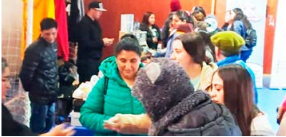
Con gran éxito se realizó el pasado domingo una nueva edición de la Feria Municipal de Porvenir evento de carácter mensual organizado por la Dirección de Fomento del municipio. (Foto gentileza El Pingüino).