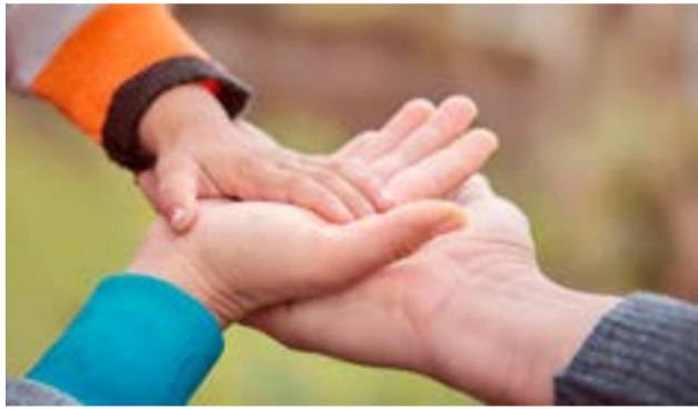
Pareja de Río Grande imputada por la supresión de identidad de una niña fue sobreseída de manera definitiva.

Comodoro Rivadavia.- El titular de la Fiscalía N°4 ante la Cámara Federal de Casación, Javier De Luca, desistió el recurso interpuesto por su colega del Ministerio Público Fiscal contra la resolución de la Cámara Federal de Apelaciones de Comodoro Rivadavia que confirmó el sobreseimiento de una pareja imputada por los delitos de supresión del estado civil de un menor de edad y falsedad ideológica.