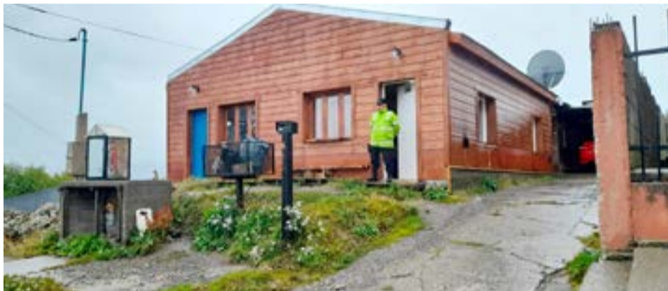
Un empresario denunció el 20 de febrero haber sido agredido por un grupo de siete personas, entre hombres y mujeres.