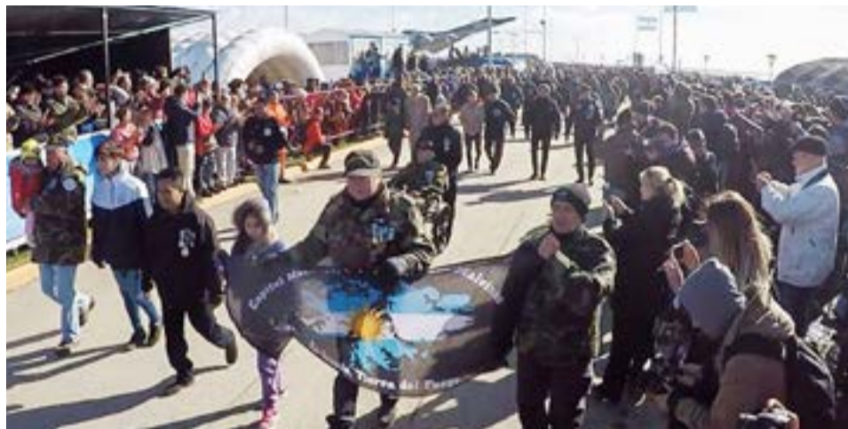
El Municipio de Río Grande, en el marco de los 41° Aniversario de la Gloriosa Gesta de Malvinas, invita a las instituciones a sumarse al Desfile Cívico - Militar.

Aquellas instituciones que quieran sumarse al Desfile del 2 de Abril, tiene tiempo de inscribirse hasta el 23 de marzo inclusive. Para ello, se deberán comunicar con la Dirección de Ceremonial y Relaciones Públicas del Municipio a través del correo electrónico ceremonialrga@gmail.com o llamando al 436200, interno 9032.