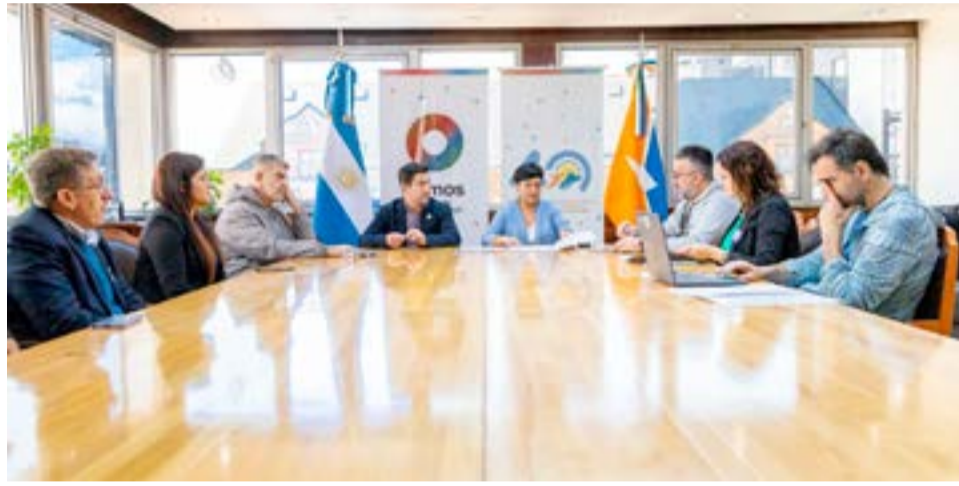
El acto se llevó adelante este lunes en Casa de Gobierno, donde se acordó un incremento salarial en tres tramos, llegando al mes de abril a un 41%. Dicho porcentaje representa un aumento interanual del 134%.

Por su parte la ministra de educación celebró el acuerdo celebrado por cuarto año consecutivo, y afirmó que “continuamos trabajando con el sector docente para seguir mejorando las condiciones laborales y avanzar en las cuestiones pedagógicas”.