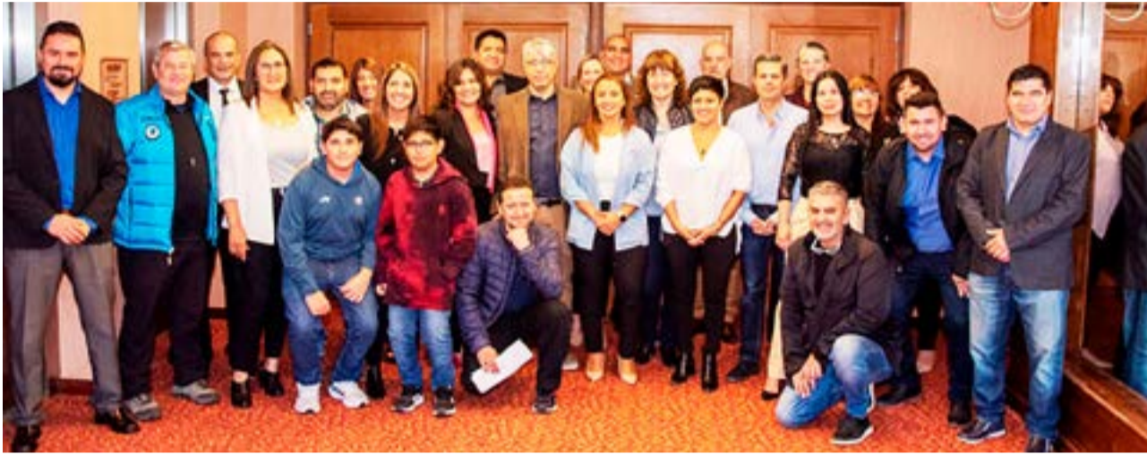
En el marco de la Ley provincial N° 1106, autoridades fueguinas homenajearon hoy a docentes bicontinentales argentinos, quienes prestaron servicios en la escuela N° 38, en la base Esperanza en la Antártida Argentina.