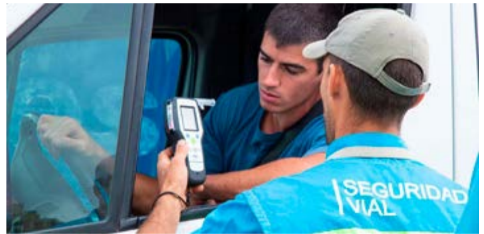
La ANSV cuenta con una nueva disposición a nivel nacional de operativo de Alcoholemia Federal que obligatoriamente se realizará cada fin de semana en ruta para los 23 distritos del país y CABA.