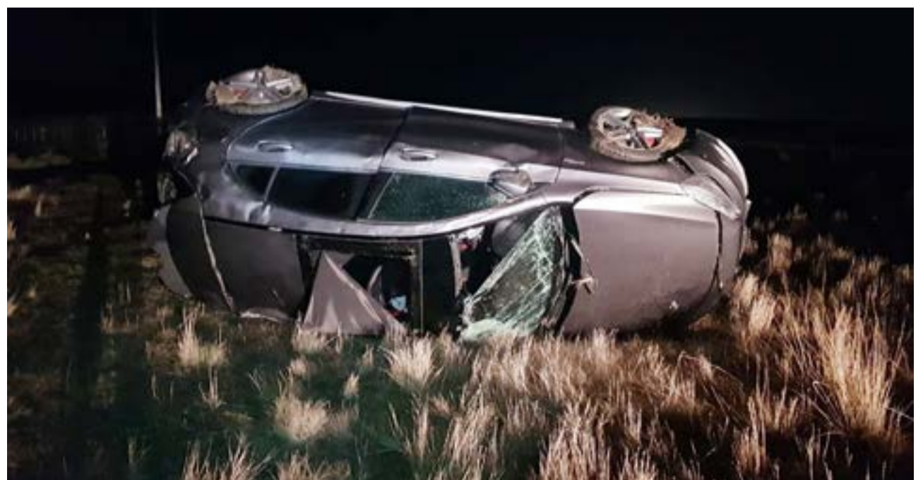
Conductor volcó en Cabo Domingo y resultó ileso.