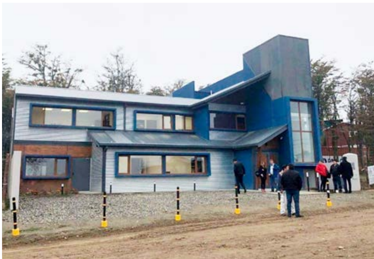
La Justicia de Tolhuin ordenó restituir al progenitor a una pequeña de 10 años que manifiesta no querer estar con el mismo

En este contexto, y con medidas pocas claras hasta este momento, activistas y feministas se autocovocaron para este lunes a las 18 horas, en el Juzgado de Tolhuin, ubicado en calle 2 de Abril 1386 del barrio IPV Nuevo.