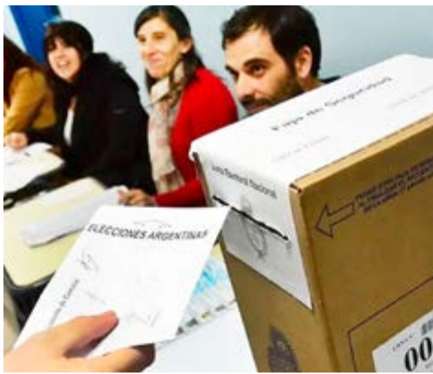
Elecciones 2023: por la crisis del papel y la inflación, el Gobierno compró sobres con casi 400% de aumento.

Dos años atrás, el Ministerio del Interior adjudicó el servicio de recuento de votos a Indra a cambio de unos $1.594.702.340. Si se compara ese valor con la actual oferta de la compañía, la que casi trepa a los $7 mil millones, en dos años este servicio se encareció en un 318%. Claro que la contratación de este año es más amplia por tratarse de otra clase de elección. La firma que resulte ganadora prestará el servicio par alas PASO, las generales y una eventual segunda vuelta.