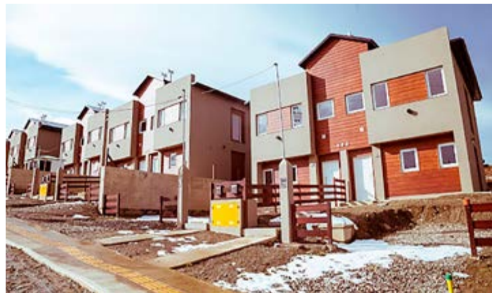
El objetivo es poder avanzar en la creación de 2.000 soluciones habitacionales y en una primera etapa se construirían 500 viviendas.

el funcionamiento del mismo sobre estas proyecciones, sino que tenemos que ir a buscar un endeudamiento en bonos que es lo que vamos a remitir al Concejo por cinco años, ya sean estatales o privados para que podamos financiar esta construcción de viviendas. Queremos que sea a largo plazo es para que se puedan amortizar las cuotas y que no impacte en lo que tiene que ver el funcionamiento habitual y normal del Municipio. También planteamos la creación de un fideicomiso municipal con actores públicos y privados