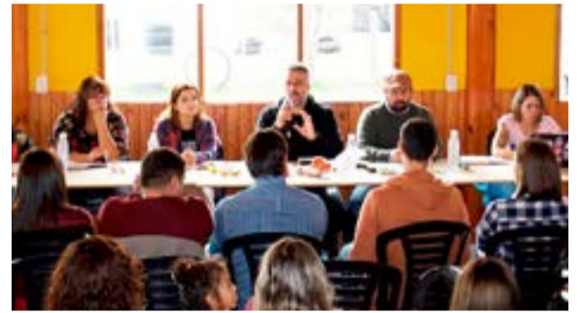
Se realizó un nuevo Congreso Provincial con la participación de más de 110 de delegadas, delegados e integrantes de Comisión Directiva del SUTEF en Tolhuin.

Visibilizar y denunciar a través de las redes las condiciones de los establecimientos educativos de la provincia