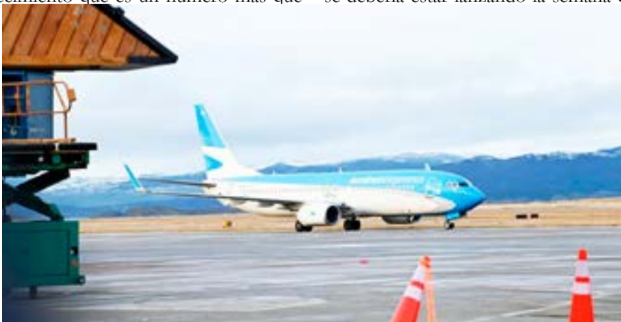
Los vuelos están viniendo al 100% de su capacidad casi todos y si uno define su viaje en el último minuto, los precios son realmente altos.

tema de los vuelos. Nunca nos ahorcaron, pero nunca tuvimos tranquilos. Hay un problema serio con la disponibilidad de vuelos. No es fácil encontrar vuelos y es normal que no haya ningún lugar disponible para uno, dos o tres días. Ni hablar de la tarifarias. Los vuelos están viniendo al 100% de su capacidad casi todos y si uno define su viaje en el último minuto, los precios son realmente altos. No es extraño estar pagando 100 mil pe-