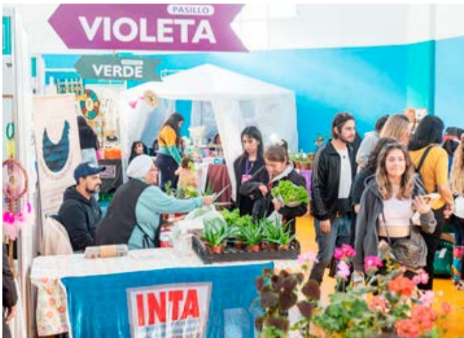
El Intendente expresó que “el nombre ‘Nosotras Podemos’ surgió para reflejar aún más el esfuerzo que hacen las mujeres de Río Grande todos los días”.

“el nombre ‘Nosotras Podemos’ surgió para reflejar aún más el esfuerzo que hacen las mujeres de Río Grande todos los días” porque organizar “una Expo en el marco del Mes de la Mujer nos parece fundamental en nuestra ciudad y hoy vemos que esa idea se fue consolidando ya que son muchas las mujeres que llevan adelante la tarea de emprender”.