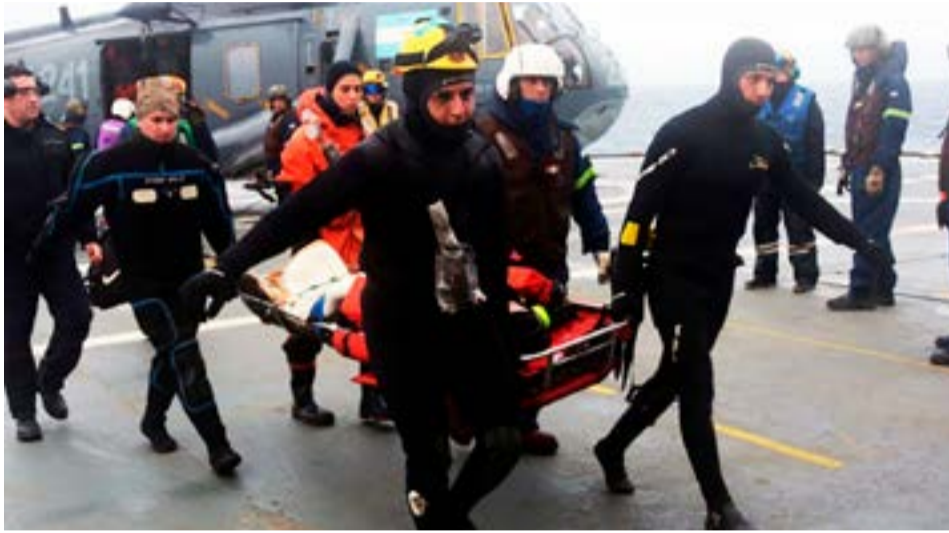
En La mañana de este sábado el herido fue trasladado con un helicóptero Sea King de la Aviación Naval desde la cubierta del buque hacia el rompehielos ARA "Almirante Irizar", para recibir atención de mayor complejidad.

Se trata de un hombre de 55 años que sufrió un traumatismo por aplastamiento en la pierna derecha en el buque de investigación pesquera oceanográfico (BIPO) "Víctor Angelescu" mientras se encontraba a 90 millas de las Islas Georgias del Sur y recibió asistencia la noche del viernes. Tras un pedido del buque, el Centro Coordinador de Búsqueda y Salvamento Marítimo, Fluvial y Lacustre (MRCC) Ushuaia asumió la conducción del caso y el rompehielos ARA "Almirante Irizar" fue