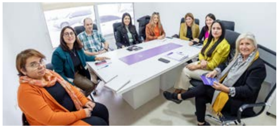
Este espacio de diálogo tuvo lugar en el marco de la presentación del primer informe del Observatorio de las Violencias y Desigualdades por razones de género presentado por la Secretaría de la Mujer, Género y Diversidad.

La consolidación de esta herramienta estadística permitió generar distintas instancias de diálogo con instituciones vinculadas a la problemática. A través de estos encuentros se busca fortalecer el vínculo y el trabajo en red entre ambos espacios, en pos de generar estrategias conjuntas para mejorar la atención a la comunidad en términos de igualdad de género.