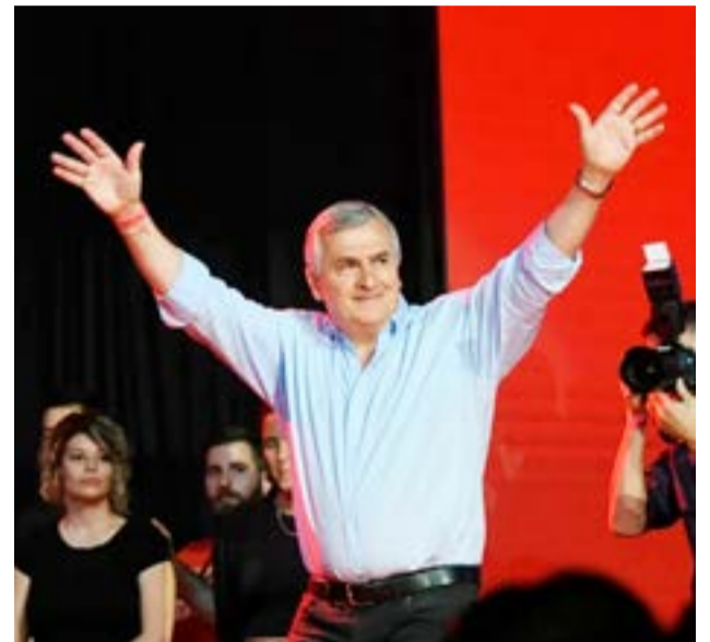
El presidente del radicalismo a nivel nacional y titular de la UCR, Gerardo Morales, lanzará su candidatura presidencial.

parques eólicos, podría no llegar a ser suficiente. Hoy las encuestas lo ubican con un 6% de respaldo social para ser Presidente.