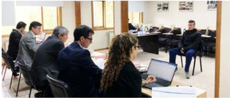
Un hombre fue condenado, en Ushuaia, a 3 años de prisión en suspenso por hechos de violencia de género.

Los fundamentos de la sentencia se conocerán el jueves 23 de marzo, a las 19 horas.