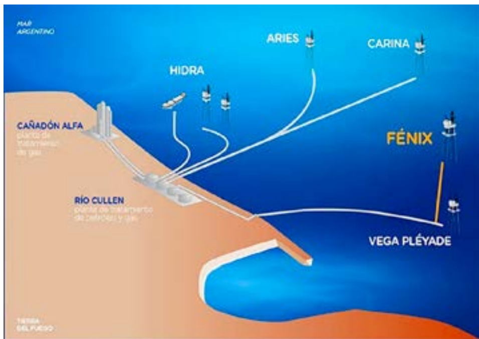
La producción de Fénix será transportada a través de un gasoducto que se conectará a la plataforma costa afuera Vega Pléyade. El gas será procesado y acondicionado en la planta de Río Cullen, y luego ingresará al Gasoducto San Martín.