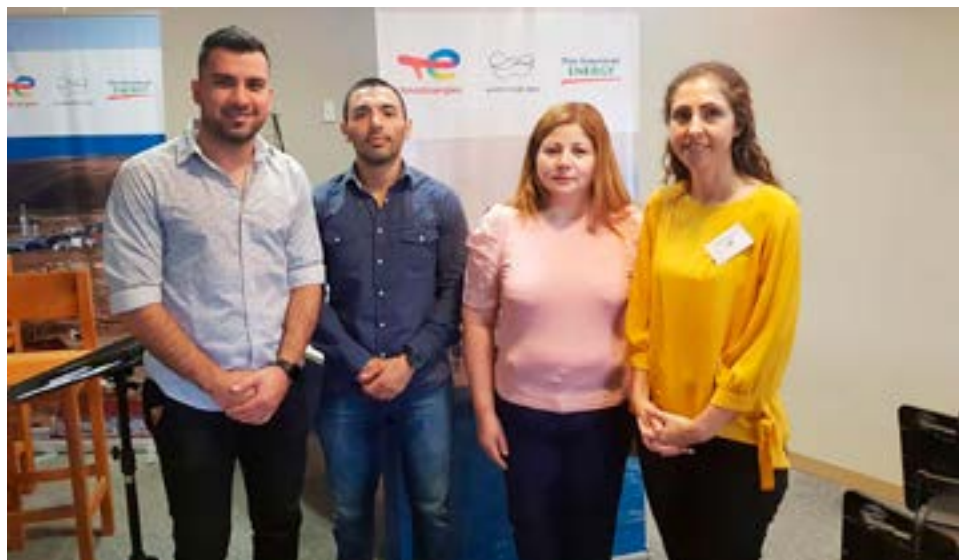
Dirigentes de AMET Tierra del Fuego asistieron a la presentación del proyecto Fénix.

Finalmente, la secretaria de Asuntos Gremiales de AMET Tierra del Fuego dijo que, “creemos que los lazos se pueden cruzar y siempre buscando el bienestar para nuestros estudiantes por un lado, y que el docente de lleve una formación continua y calidad”.