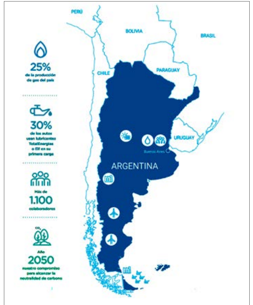
Mapa esquemático de lo que representa Total Energies en la Argentina.

En varias oportunidades este consorcio resaltó que este es un paso importante para Argentina, y todos los socios invo-