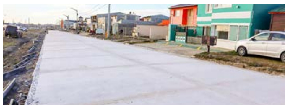
El Municipio de Río Grande avanza con los trabajos de pavimentación en la avenida Federico Echelaine.

La pavimentación de la Av. Echelaine es parte del Plan de Obras Integral que el Municipio de Río Grande despliega en toda la ciudad, con el objetivo de consolidar cada barrio para acercar beneficios y servicios a la comunidad.