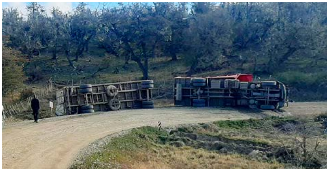
Camión jaula volcó en la ruta complementaria A, su conductor salió ileso y un vacuno murió.

Se realizaron las tareas de remoción del camión, quedado estacionado sobre sus neumáticos, a la vera de la ruta, en el Destacamento Policial. En tanto que personal de la Estancia se abocó a las tareas de búsqueda de los animales.