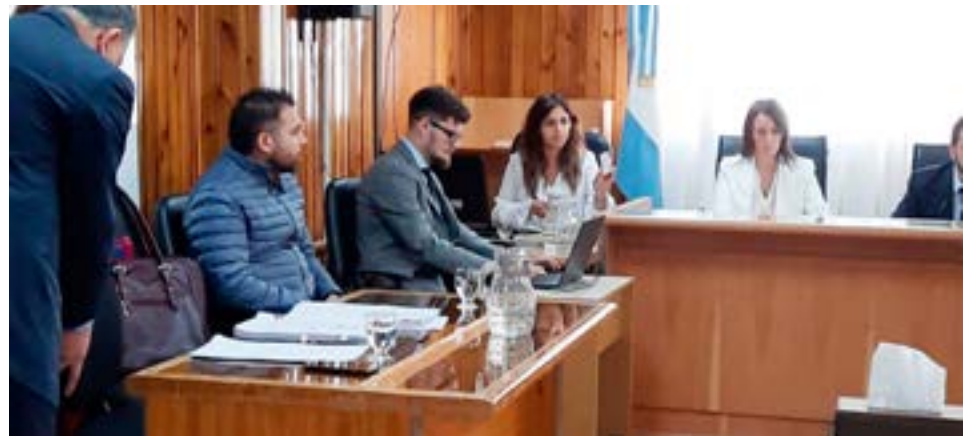
Declaró ante el Tribunal sujeto acusado de abuso sexual, en una causa que data del año 2018.